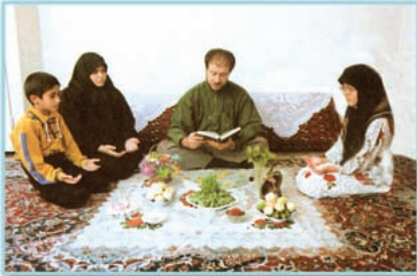
اعضای خانواده فعالیت‌های مشترک بسیاری دارند.

همان‌طور که می‌دانید، در کشور ما گاه زلزله‌هایی روی می‌دهد. در جریان این زلزله‌ها بعضی از بچه‌ها پدر و مادر خود را از دست می‌دهند و بی‌سرپرست می‌مانند. البته مردم نوع دوست کشور ما به یاری آن‌ها می‌شتابند و حتی بعضی از این بچه‌ها را به فرزند می‌پذیرند. بسیاری از برادران و خواهران شما در فلسطین اشغالی به علت وحشی‌گری‌های سربازان ظالم و ستمگر رژیم اشغالگر قدس، پدر، مادر و سایر اعضای خانواده‌ی خود را از دست داده‌اند. آن‌ها با یاری سایر مسلمانان می‌کوشند تا انتقام خود و خانواده‌شان را از تجاوزکاران بگیرند.