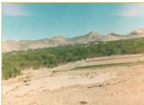
قطعه‌ای زمین که قسمتی از آن قابل کشت و قسمت‌های دیگر آن غیر قابل کشت است.

نظر اول، پذیرش این نکته قدری مشکل است اما با اندکی دقت، صحت آن را درمی‌یابیم. مقدار زمین‌های کشاورزی، ذخایر معدنی، سرمایه و نیروی کاری که در اختیار یک جامعه قرار دارد - هر قدر هم که زیاد باشد - محدود است. حتی ممکن است زمین‌های کشاورزی نسبتاً زیادی در اختیار جامعه باشد ولی زمین‌های مرغوبی که بازدهی بالایی دارند، کم است. هم‌چنین، زمین‌هایی که نزدیک به محل زندگی و تجمع انسان‌ها قرار دارند و به همین دلیل، بهره‌برداری از آن‌ها هزینه‌ی حمل و نقل چندانی ندارد، محدودند. به‌علاوه، ذخایر معدنی با وجود فراوان بودن در کره‌ی زمین، به دلیل ناشناخته بودن بسیاری از این ذخایر و نیز محدود بودن دانش فنی بشر، باز نامحدود نیستند.