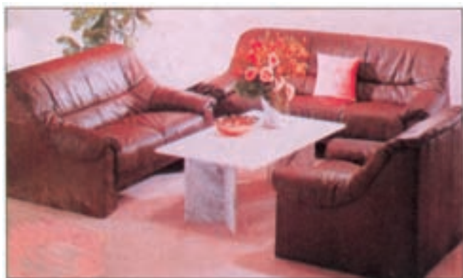
شکل ۳-۴- مورد مصرف چرم مصنوعی

۲-۴-۳- چرم مصنوعی: مواد تشکیل‌دهنده این چرم‌ها ممکن است ضایعات چرم‌های طبیعی و یا مواد شیمیایی باشد. این چرم‌ها به رنگ‌های مختلفی به بازار عرضه می‌شوند و به‌عنوان پوشش انواع مبلمان، پوشش کف و پستی انواع صندلی و غیره می‌توان از آنها استفاده کرد (شکل ۳-۴). چرم مصنوعی به دو صورت، چرم ساده و چرم چروک در بازار یافت می‌شوند که نوع چروک آن برای پوشش انواع مبلمان لوکس استفاده می‌شود. برای جلوگیری از خشک شدن چرم‌ها باید هر چند مدت یک دفعه آن‌ها را روغن (واکس) زد. مورد مصرف چرم‌های مصنوعی، جاهایی است که امکان شستشوی آن وجود دارد. چرم‌ها را می‌توان به‌وسیله سوزن‌های دوخت (میخ‌منگنه) یا میخ‌های بنفش به کلاف مبلمان یا صندلی محکم کرد (شکل ۳-۵).