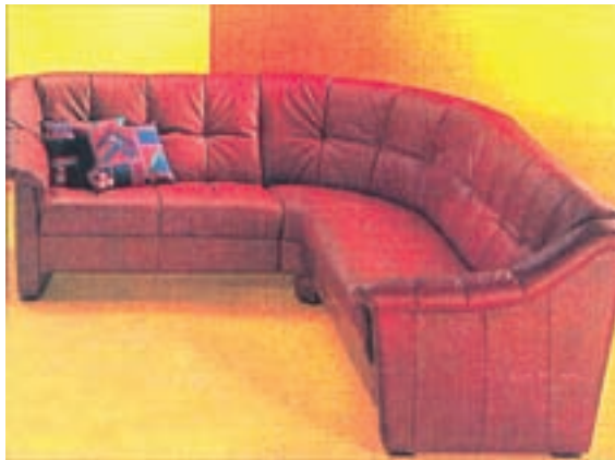
شکل ۳-۳- مورد مصرف چرم طبیعی

چرم برای پوشش رویی مبلمان نشیمن، پوشش کف و پشتی صندلی و غیره به کار می‌رود. چرم‌های مورد مصرف در صنایع چوب را می‌توان به دو دسته تقسیم کرد: ۱-۴-۳- چرم‌های طبیعی: این چرم‌ها را می‌توان از پوست گاو، گوساله، اسب، بز و... از طریق دباغی کردن به دست آورد. چرم‌های طبیعی مورد مصرف در صنایع چوب اغلب از نوع چرم گاوی است که معمولاً به ابعاد 2 \times 3 متر تهیه و به بازار عرضه می‌شود. چرم گاوی ضخیم که معمولاً از پوست گاو میش تهیه می‌شود، به وسیله ماشین‌های برش به دو ورقه‌ی رویی و زیرین تبدیل می‌شود. ورقه‌ی رویی که قسمت مرغوب چرم است و نمایش طبیعی چرم را دارد بدون سوراخ، خراش، تغییر رنگ ناشی از بیماری و غیره است و نیازی به تغییر و اصلاح ندارد. این قسمت به عنوان چرم درجه یک و عالی برای پوشش مبلمان لوکس و گران قیمت استفاده می‌شود (شکل ۳-۳). قسمت‌های زیرین چرم که اشکالت نامیده می‌شود، به عنوان چرم درجه ۲ و ۳ و ارزان‌تر از ورقه‌ی رویی چرم به بازار عرضه می‌شود که به مصارف کفش‌سازی، دستکش‌های کار و غیره می‌رسد. چرم‌هایی که به مصارف رویه (روکش) می‌رسند را می‌توان به وسیله‌ی لایه‌ای از رنگ ۱ پوشاند که در این صورت