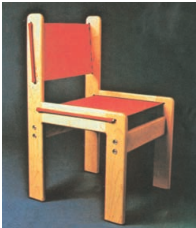
شکل ۲-۳- مورد مصرف پارچه برزنت در محصولات چوبی

۳-۳-۴ پارچه ضخیم یا برزنت: پارچه‌ای است محکم و نخ‌ی که به رنگ‌های مختلفی در بازار وجود دارد و به‌صورت رُل به فروش می‌رسد، از این پارچه‌ها می‌توان برای ایجاد پشتی و کف صندلی‌های تاشو، راحتی و... استفاده کرد. هم‌چنین می‌توان آن را در کفی انواع مبلی و صندلی به‌جای فتر مورد استفاده قرار داد (شکل ۲-۳).