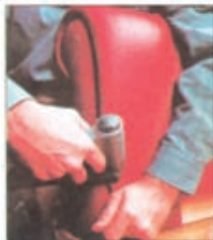
شکل ۳-۵- متصل کردن چرم به بدنه با سوزن‌های دوخت