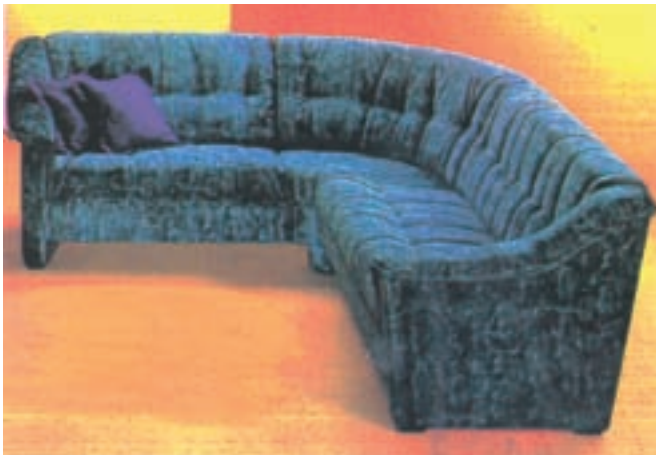
شکل ۱-۳- مورد مصرف پارچه رویه در مبیل‌سازی

۳-۳-۳- پارچه‌های رومبیلی (رویه): این پارچه‌ها برای پوشش و تزئین قسمت‌های رویی انواع مبیل‌ها، صندلی‌ها و مواردی نظیر آن به‌کار می‌روند و از نظر ارزش در درجه اول قرار می‌گیرند (شکل ۱-۳).