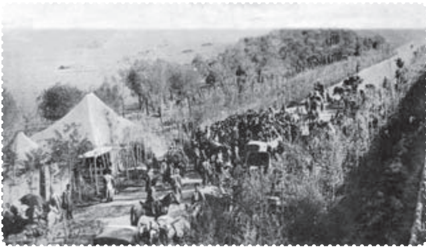
بازگشت علما از مهاجرت کبری

مظفرالدین شاه تسلیم خواسته‌های مردم شد. او عین‌الدوله را عزل کرد و فرمان تشکیل مجلس شورای ملی را در ۱۴ مرداد ۱۲۸۵ صادر کرد. هفت روز بعد، علما، با استقبال پرشکوه مردم، از قم بازگشتند. شهر چراغانی و جشن شادی به پا شد و در ۲۸ مرداد، اولین دوره‌ی مجلس شورای ملی با حضور نمایندگان تهران تشکیل گردید. عده‌ای از سیاستمداران مشروطه‌خواه، به تدوین قانون اساسی پرداختند. ۱ آنان با عجله آن را نوشتند و به امضای مظفرالدین شاه رساندند. شاه، ده روز پس از امضای قانون اساسی، درگذشت. به این ترتیب، کشور استبداد زده‌ی ما، با بهره‌گیری از اندیشه‌های سیاسی عالمان بزرگ دینی، کوشش فرهیختگان جامعه و مجاهدت مردم، به حکومتی دست یافت که می‌بایست براساس قانون اداره می‌شد.