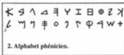
2. Alphabet phénicien.