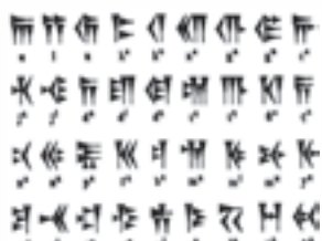
الفبای خط میخی پارسی باستان