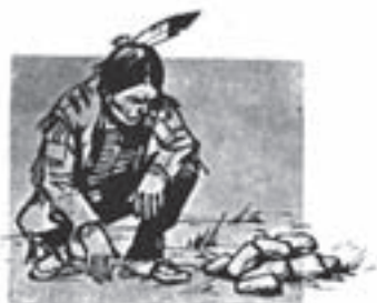
1. Deux clefs de l'écriture chinoise signifiant métal (8 traits) et jaune (12 traits). Indien déchiffrant le message exprimé par un certain arrangement de cailloux.