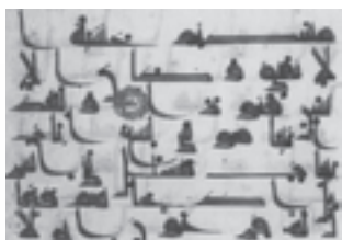
نمونه خط کوفی