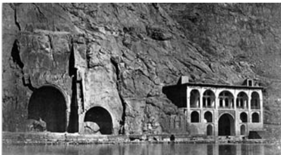
شکل ۴-۴ - نمایی از تاق بستان قدیم

از نظر وجود آثار مربوط به دوران باستان در ایران زمین، تنها استان فارس و تا حدودی خوزستان با استان کرمانشاه قابل مقایسه است.