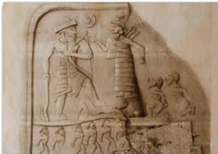
شکل ۳-۴- نقش آنوبانی نی - سربل زهاب

از نخستین اقوام ساکن در منطقه کرمانشاه کنونی که نام آن‌ها در تاریخ ذکر شده، می‌توان اقوام گوتی، کاسی و لولوبی را نام برد. در این میان لولوبی‌ها یکی از قدیمی‌ترین سنگ‌نگاره‌های شناخته شده ایران (نقش آنوبانی نی) را پدید آوردند (شکل ۳-۴).