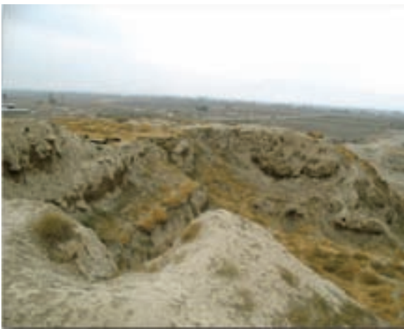
شکل ۲-۴- قدمت سکونت در تپه گودین در کنگاور به هزاره ششم قبل از میلاد می‌رسد.