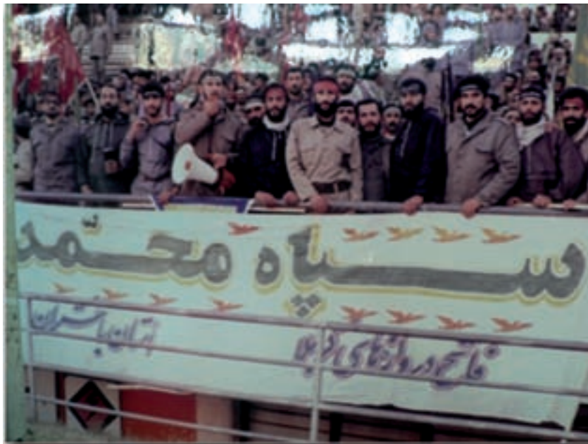
شکل ۵-۴- تصویری از سپاه محمد (ص)

رژیم عراق برای پیروزی در جنگ از هیچ عمل ننگینی علیه رزمندگان و مردم بی دفاع مرزنشین استان فروگذار نکرد؛ به طوری که در طول جنگ بارها از سلاح های شیمیایی استفاده کرد. از مناطقی که این چنین ناجوانمردانه مورد حمله شیمیایی دشمن قرار گرفت، می توان به روستای بان زرده ریجاب اشاره نمود.