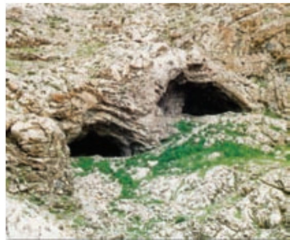
شکل ۱-۴- غار دواشکفت یکی از کهن‌ترین سکونتگاه‌های بشر در منطقه کرمانشاه در دامنه کوه تاق بستان

به نظر شما آیا رابطه‌ای بین گذشته تاریخی هر منطقه و جغرافیای طبیعی آن وجود دارد؟ با ذکر مثال برای گفته‌های خود دلیل بیاورید.