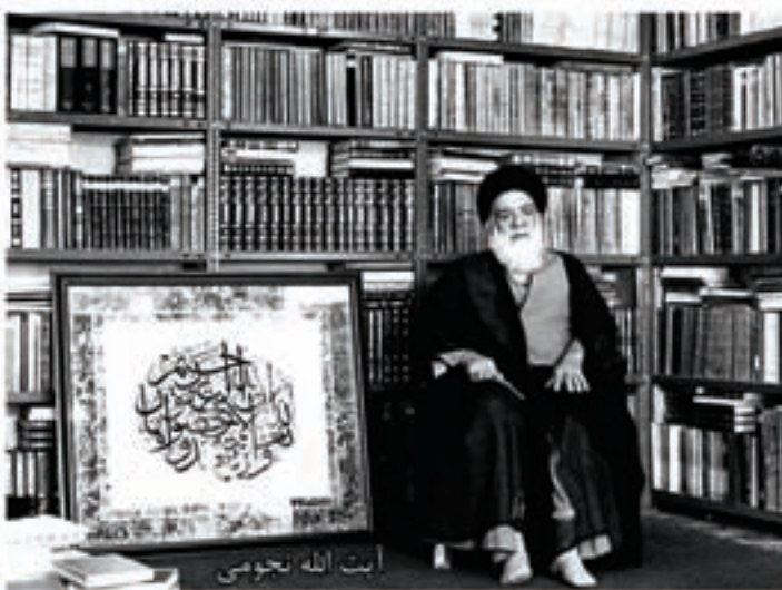
آیت الله نجومی