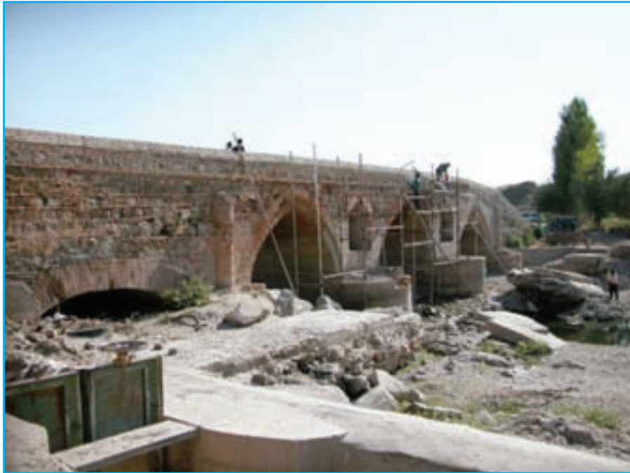
شکل ۱۱-۴- پل دختر- ملکان- دوره صفوی ۹۵۱ ه.ق