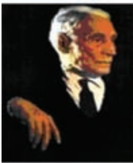
جبار باغچه بان