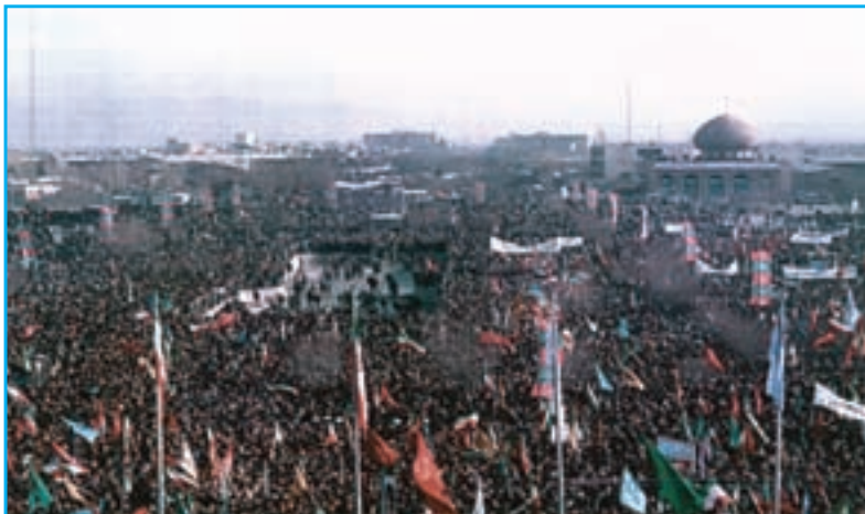
شکل ۲۸-۴- صحنه‌ای از اعزام رزمندگان به جبهه‌ها در دوران دفاع مقدس

اگر حمزه سیدالشهداء در جنگ‌های صدر اسلام، مدافع اسلام و آرمان‌های رسول خدا بود، تا پای جان از اسلام دفاع نمود و در جنگ احد عاشقانه به شهادت رسید، لشکر ۲۱ حمزه آذربایجان نیز همراه با افراد غیور و شجاع و خلبانان تیزپرواز پایگاه دوم شکاری تبریز، از آغاز جنگ تحمیلی و دفاع مقدس، در جبهه‌های حق علیه باطل با دشمن بعثی نبرد کردند. امیران و فرماندهان رشید و از جان گذشته و غیور مردان این لشکر سرافراز آذربایجان با جان‌فشانی‌ها و حماسه‌سازی‌های خود چهره ایران و ایرانی را در پیشگاه تاریخ و اجداد سلحشور خود سفید کردند. حملات خلبانان متهور پایگاه دوم شکاری آذربایجان به عمق خاک و استحکامات دشمن و بمباران مراکز حیاتی، نظامی و صنعتی عراق، فرماندهان آن کشور که خواب تصرف تهران را دیده بودند به زانو درآوردند. لشکر سرافراز ۲۱ حمزه و پایگاه دوم شکاری تبریز با پایداری خود در مقابل دشمن خسارات و تلفات سنگینی بر آنها وارد کردند. این پایگاه افسران و سربازان و امرای شهیدی چون سرلشکر شهید فکوری را تقدیم اسلام و ایران نمودند. نامشان جاودانه تاریخ پرافتخار گلگون کفن ارتش ایران اسلامی باد.