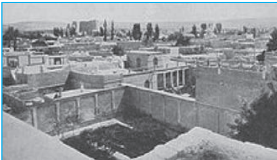
شکل ۲۲-۴- تبریز قدیم مربوط به اوایل عهد قاجار

با دشمن تا آخرین نفس تأکید می‌کردند و عباس‌میرزا را به ادامه آن و عدم قبول شرایط روس‌ها تشویق می‌کردند. در این میان رفتار پیرزنی از زنان آذربایجانی از همه افتخارآمیزتر بود. این زن سالخورده با شنیدن خبر متارکه جنگ، از قیمت ریسمان دست تاب، مقداری لوازم جنگ و خواروبار برای سربازان تهیه کرده و به مقر فرماندهی عباس‌میرزا آورده بود تا در تجهیز سربازان وطن در مقابل دشمن سهمی داشته باشد.