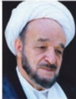
علامه محمدتقی جعفری