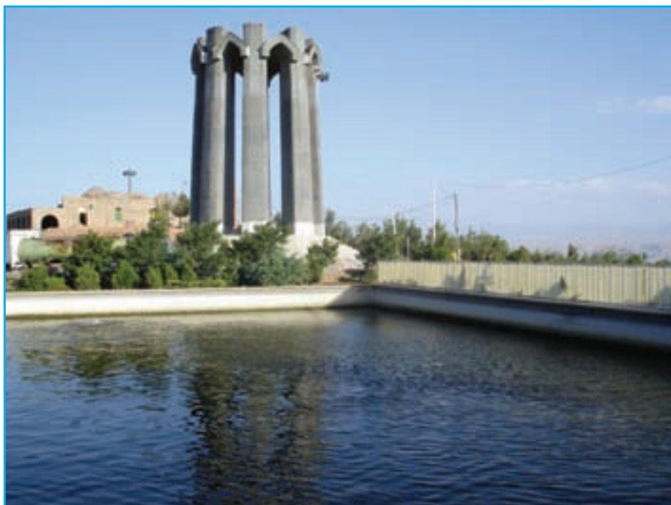
شکل ۲۷-۴. یادبود شهدای گمنام واقع در کنار امام‌زاده عون‌بن علی تبریز