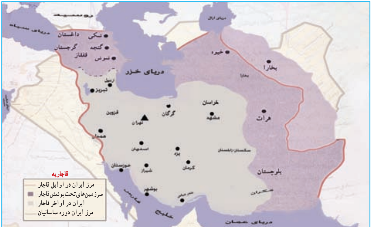
شکل ۲۱-۴ نقشه ایران در اوایل قاجاریه که در آن آذربایجان مرکز فرماندهی جنگ‌های ایران و روس بود