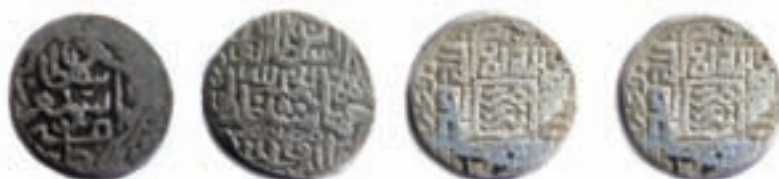
شکل ۱۷-۴- سکه‌های متعلق به دوران قرا قویونلوها