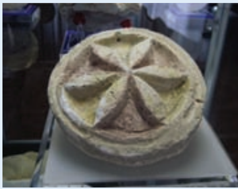
شکل ۶-۴- گجبری‌های نقش خورشید و شیر آثاری متعلق به دوره اشکانی (قلعه ضحاک - اشکانی - هشترود)