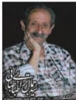
سیدجمال ترابی طباطبایی