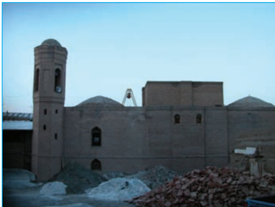
شکل ۹-۴- مسجد جامع مرند دوره اتابکان قرن ۶ هـ.ق