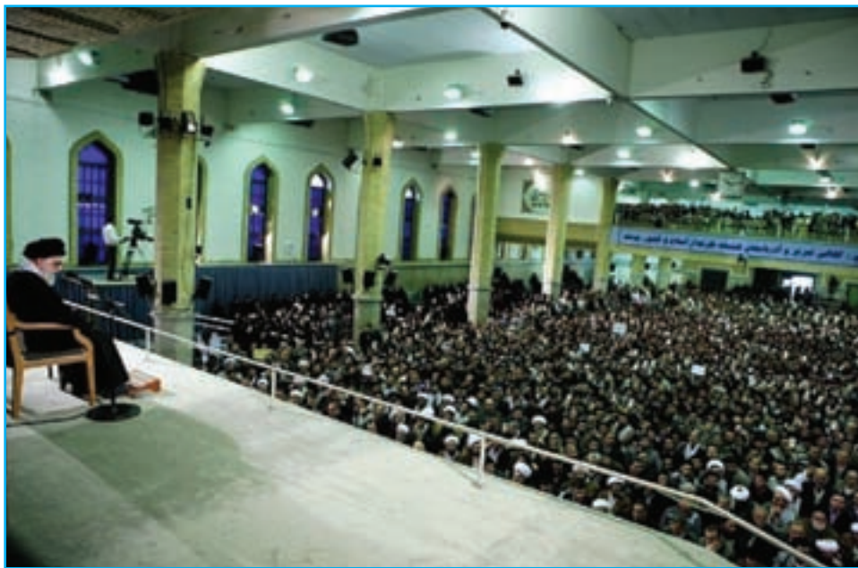
شکل ۲۳-۴ دیدار جمعی از مردم استان با رهبر معظم انقلاب اسلامی در سالروز ۲۹ بهمن، قیام مردم تبریز

مردم آذربایجان شرقی، بارها مخالفت خود را با برنامه‌های ضداسلامی دولت پهلوی‌ها چه در موضوع تغییر لباس و کشف حجاب و چه در اجرای برنامه «اصلاحات ارضی» ابراز نمودند و از حریم اسلام و روحانیت دفاع کردند. اعتراض آنها در قیام پانزده خرداد ۱۳۴۲ ه.ش به رهبری امام خمینی (ره) بعد از انقلاب مشروطه و نهضت ملی شدن نفت، قدرت ایمان و عزم ملی مردم آذربایجان را به نمایش گذاشت. قیام توفنده مردم تبریز در ۲۹ بهمن سال ۱۳۵۶ ه.ش که به مناسبت گرامیداشت چهلمین روز شهادت شهدای ۱۹ دی ماه ۵۶ شهر قم اتفاق افتاد، لرزه بر بنیاد دولت پهلوی انداخت و این اعتراض بدر انقلاب را در سراسر کشور پاشید.