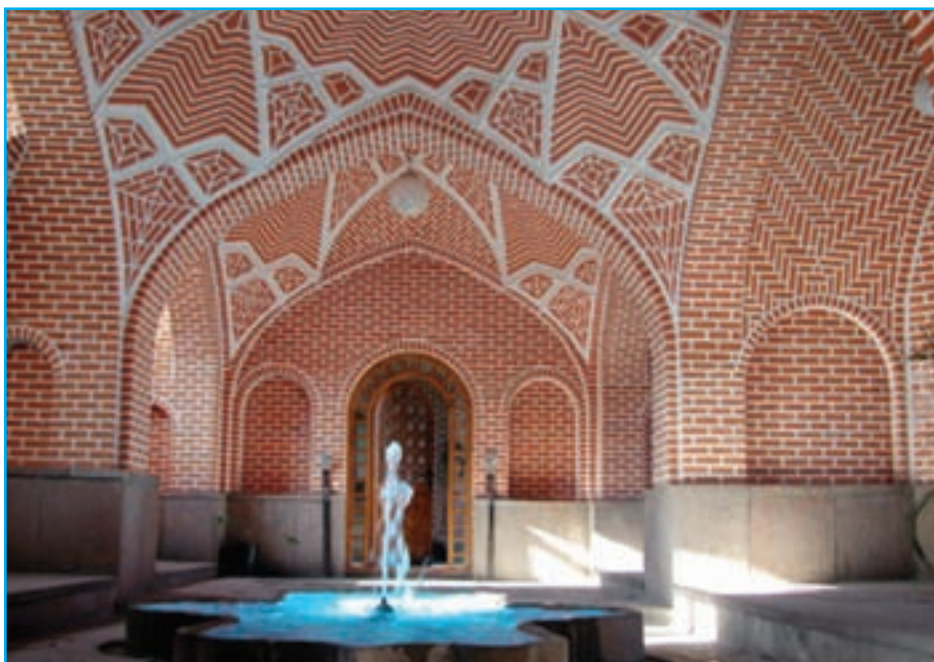
شکل ۱۰-۴- خانه بهنام (دانشکده معماری) - دوره قاجار