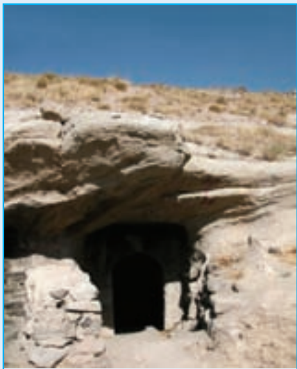
شکل ۵-۴- اثری متعلق به دوره اشکانی (غار قدمگاه - اشکانی - آذرشهر)

ق.م به دست اسکندر مقدونی، خستریوان والی ماد، آترویات (آذربید) فرمانده طلایه قشون داریوش سوم در جنگ گوگمل بود. بعضی‌ها او را مرد روحانی می‌دانند، او و بازماندگانش با تدبیر توانستند استقلال ماد و حاکمیت خاندان خود را تا سال ۲ ق.م حفظ کنند، در طول دوره‌ای نزدیک به هفت قرن فرمانروایی اشکانیان و ساسانیان، آذربایجان جزء جدایی ناپذیر ایران و از ایالات بسیار مهم این دو دولت محسوب می‌شده است. آذربایجان در عهد ساسانیان به دلیل استقرار پایتخت تابستانی آنها در شهر «شیز» ۱ یا «گنزک» ۲ و وجود آتشکده مقدس «آزرگشنسب» ۳ در این محل از تقدس خاص و اهمیت فوق‌العاده‌ای برخوردار بوده است.