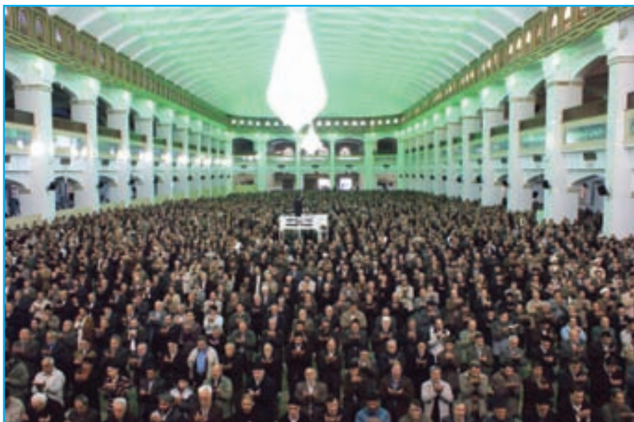
شکل ۲۵-۴- برگزاری پرشکوه نماز جمعه در مصلائی امام خمینی (ره) - تبریز

تلاش انقلابی مردم آذربایجان بعد از پیروزی انقلاب اسلامی تا به امروز گواه روشن، بر حمایت بی دریغ مردم آذربایجان از آرمان‌های مقدس انقلاب اسلامی ایران به رهبری حضرت امام (ره) و آیت‌الله خامنه‌ای است. در جریان هشت سال دفاع مقدس، جوانان غیور و باایمان آذری حمایت بی چون و چرای خود را از اسلام و انقلاب به نمایش گذاشتند. اقدامات ایثارگرانه مردم آذربایجان