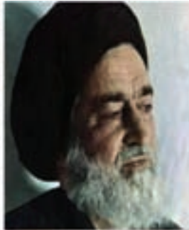
شهید آیت الله سیداسدالله مدنی