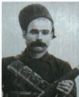
باقرخان سالار ملی