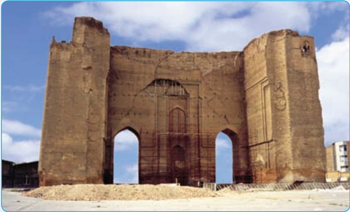
شکل ۱۳-۴- ارگ علیشاه از آثار دوره مغول

ربع رشیدی به عنوان بزرگ ترین دانشگاه جهان اسلام در قرون ۷-۸ هـ. ق شناخته می شد.