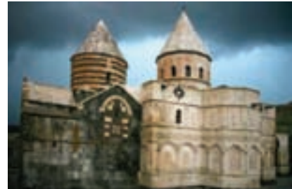
شکل ۳۴-۵- قره کلیسا در چالدران

کلیسای سیر : در ۵ کیلومتری جنوب ارومیه واقع شده و قدمت آن به ۱۷۰۰ سال پیش باز می گردد. محوطه بنا در فصل تابستان محل برگزاری مراسم مذهبی و فرهنگی است. از دیگر کلیساهای مهم استان می توان به کلیسای ننه مریم و حضرت مریم در ارومیه، سورپ سرکیس، ملهذان در خوی، هفتوان در سلماس و... اشاره کرد.