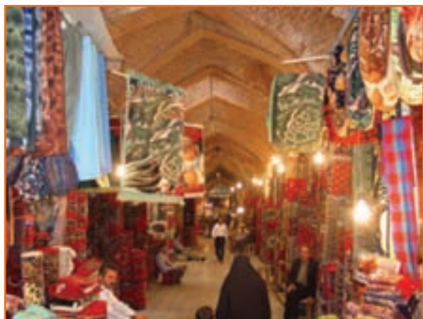
شکل ۲-۵- بازار فرش ارومیه

به تصاویر زیر نگاه کنید و بگویید چرا استان آذربایجان غربی جزء استان‌ها و قطب‌های برتر در زمینه گردشگری است. روز جهانی جهانگردی و روز جهانی موزه و میراث فرهنگی را در تقویم پیدا کنید.