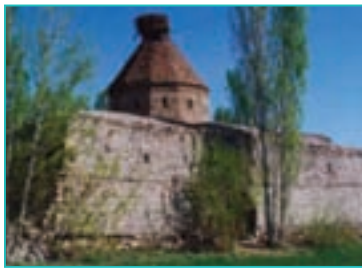
شکل ۳۶-۵- کلیسای ملهذان خوی

قره کلیسا در چالدران : این کلیسا که به کلیسای تاتائوس هم معروف است، یکی از قدیمی ترین کلیساهای عالم مسیحیت به شمار می رود و مزار یکی از مبشران حضرت مسیح (ع) به نام تاتائوس است. بنای آن در دو قسمت متعلق به قرن هفتم و دوازدهم میلادی است. این کلیسا بر فراز تپه ای در دشت چالدران بنا شده و همه ساله تعداد کثیری از ارامنه داخل و خارج کشور در مرداد ماه جهت شرکت در مراسم ویژه مذهبی از این کلیسا دیدن می کنند.