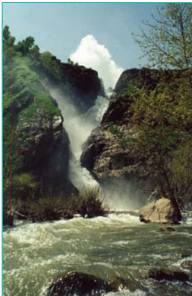
شکل ۶-۵- آبشار شلماش

استان آذربایجان غربی با برخورداری از تمدن کهن، آثار تاریخی غنی و جاذبه‌های متعدد فرهنگی و طبیعی به‌عنوان یکی از قطب‌های مهم فرهنگی و گردشگری ایران و جهان محسوب می‌شود. مهم‌ترین توانمندی‌های گردشگری استان عبارت‌اند از: ۱- شرایط آب و هوایی مناسب، تنوع پوشش گیاهی، رودها، چشمه‌ها، غارها، آبشارها، پارک‌های جنگلی، جزایر، گونه‌های مختلف گیاهی و جانوری، جلگه‌ها و دامنه‌های پر از گل‌های وحشی ۲- قلعه‌ها، دژها، مساجد، بازارها، اماکن و بناهای تاریخی ۳- تاکستان‌ها، توستان‌ها و باغات اطراف شهر ارومیه، سوغات نقل و بیدمشک ارومیه، قالیچه‌های تکاب، دست‌بافت‌های عشایر و روستاییان، لباس‌های رنگی و محلی و از همه مهم‌تر مردم خونگرم و مهمان‌نواز ۴- همجواری با سه کشور، ترکیه، جمهوری آذربایجان و عراق که موقعیت خاصی برای گردشگری استان ایجاد کرده است. با توجه به توانمندی‌های ذکر شده، این استان را می‌توان «سرزمین زیبایی‌های» ایران نامید.