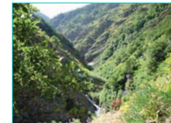
شکل ۱۳-۵- جنگل‌های سردشت