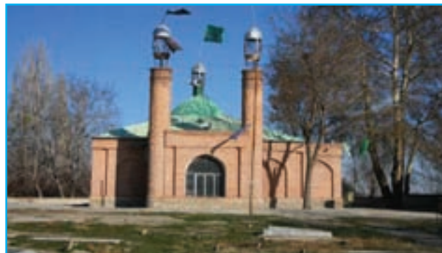
شکل ۲۹-۵- بقعه دیزج تکیه

دیگر امامزاده‌های مهم استان عبارت‌اند از: برکشلوی ارومیه، سید بهلول خوی، میر هادی خوی، سید یعقوب خوی بقعه دیزج تکیه: این مقبره مدفن یکی از نوادگان امام موسی کاظم (ع) است و در ۱۵ کیلومتری جنوب شرقی ارومیه قرار دارد. بنای این بقعه از آجر ساخته شده و مربوط به دوره قاجار است. بقعه‌های متبرکه استان عبارت‌اند از: بقعه دیزج ارومیه، بقعه ذهبیه خوی و بقعه ایوب در تکاب