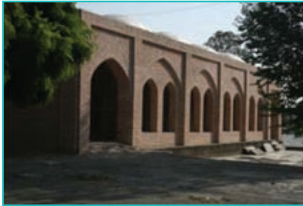
شکل ۲۸-۵- امامزاده تازه شهر سلماس