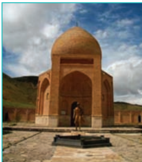
شکل ۱۷-۵- مقبره سید صدرالدین - چالدران

در این استان بیش از ۲۰۰۰ اثر و یادمان تاریخی، فرهنگی و هنری از ادوار مختلف وجود دارد که دو اثر ارزشمند تخت سلیمان در تکاب و قره کلیسا در چالدران در فهرست آثار جهانی به ثبت رسیده‌اند و به همراه گوی تپه ارومیه، تپه اهرنجان سلماس، تپه کردلر ارومیه، تپه حسنلو نقره و دژ بسطام قره ضیاءالدین و ... دارای شهرت جهانی‌اند و نقش مهمی را در جلب و جذب گردشگران ایفا می‌کنند. بنابراین استان آذربایجان غربی را می‌توان شاهراه تمدن‌ها و فرهنگ‌های ایرانی نامید.