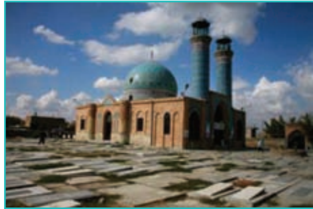
شکل ۲۷-۵- امامزاده سید بهلول (ع) - خوی

دیگر امامزاده‌های مهم استان عبارت‌اند از: برکشلوی ارومیه، سید بهلول خوی، میر هادی خوی، سید یعقوب خوی بقعه دیزج تکیه: این مقبره مدفن یکی از نوادگان امام موسی کاظم (ع) است و در ۱۵ کیلومتری جنوب شرقی ارومیه قرار دارد. بنای این بقعه از آجر ساخته شده و مربوط به دوره قاجار است. بقعه‌های متبرکه استان عبارت‌اند از: بقعه دیزج ارومیه، بقعه ذهبیه خوی و بقعه ایوب در تکاب