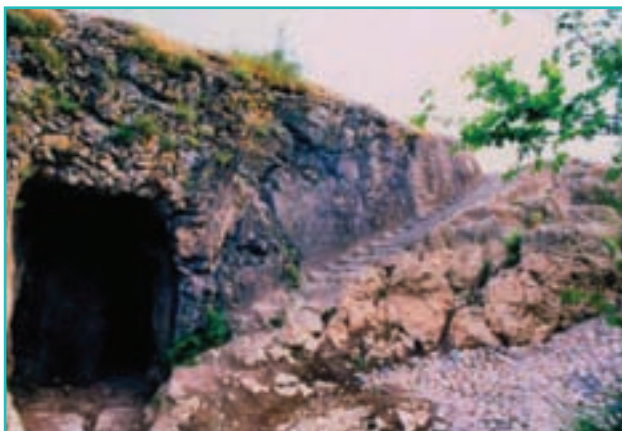
شکل ۱۲-۵- غار بام فرهاد ماکو

غار آبی - خاکی سهولان : این غار در ۳۵ کیلومتری شهر مهاباد قرار دارد و یکی از زیباترین و شگفت‌انگیزترین غارهای طبیعی ایران است. غار سهولان از چند حوضچه بزرگ که به وسیله دالان‌های آبی به هم متصل شده‌اند، تشکیل شده است. ارتفاع سقف غار از سطح آب در حوضچه آخر ۵۰ متر و عمق آب در حوضچه وسط ۳۵ متر است. این غار پس از غار علی‌صدر همدان دومین غار آبی و خاکی ایران است که همه ساله هزاران نفر را جذب می‌کند. آیا در شهرستان محل زندگی شما هم غار مهمی وجود دارد؟