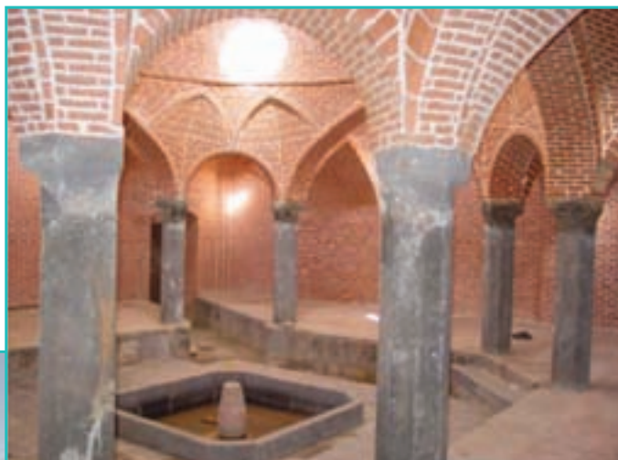
شکل ۱۵-۵- حمام شیخ سلماس