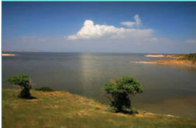
شکل ۹-۵ چشم اندازی از دریاچه ارومیه

- آیا می توانید موارد دیگری به جاذبه های طبیعی دریاچه ارومیه اضافه کنید.