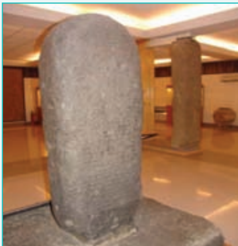
شکل ۲۲-۵- کتیبه کله شین - موزه ارومیه

— کتیبه خان تختی: این نقش برجسته دوره ساسانی در ۱۶ کیلومتری شهر سلماس، روی سنگ صاف و بزرگی در کوه پیرچاوش کنده شده است. در این کتیبه دو نفر سوار بر اسب نقش شده‌اند. احتمالاً این دو سوار، یکی اردشیر پادشاه نامدار ساسانی و دیگری پسرش «شاپور اول» است. در این نقش دو نفر پیاده نیز دیده می‌شوند.