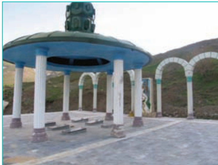
شکل ۴۰-۵- یادمان شهدای گمنام حاج عمران - پیرانشهر