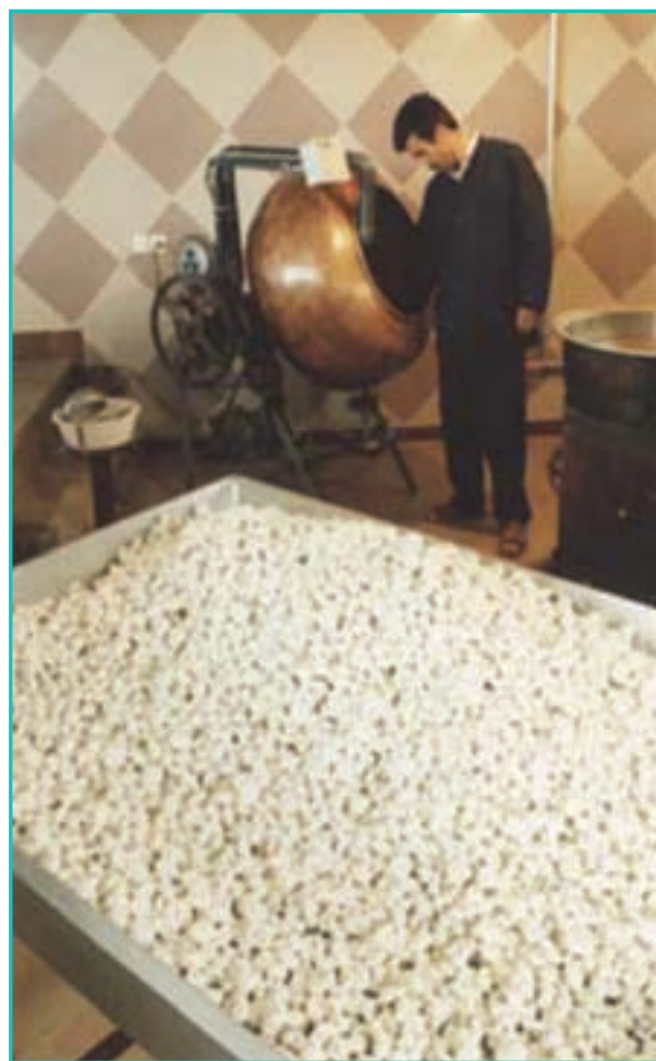
شکل ۵-۵- نقل ارومیه