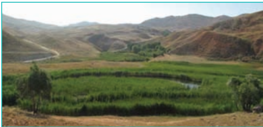
شکل ۷-۵- چمن متحرک چملی تکاب

در ایران چه روزی را روز طبیعت نام‌گذاری کرده‌اند؟