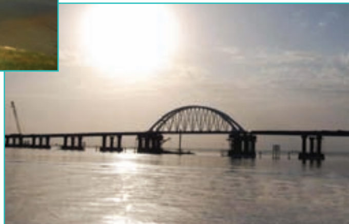
شکل ۱۰-۵ بزرگراه شهید کلانتری بر روی دریاچه ارومیه