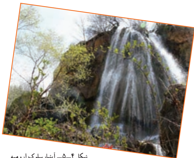
شکل ۴-۵- آبشارسلوک ارومیه