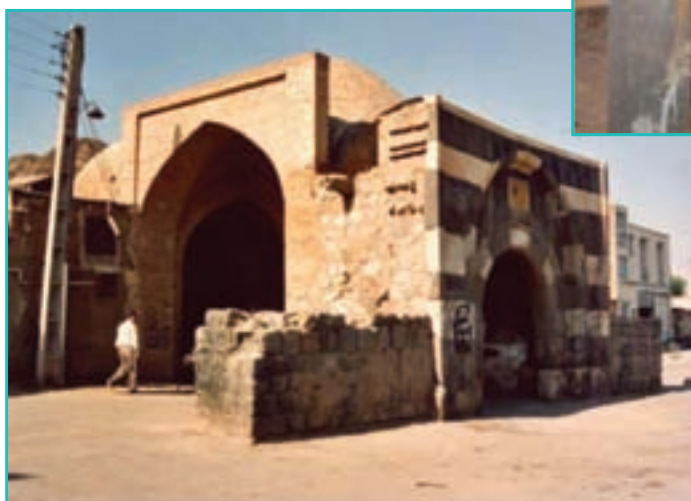
شکل ۱۶-۵- دروازه سنگی خوی