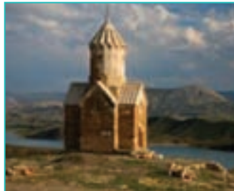
شکل ۳۵-۵- کلیسای زورزور در ماکو