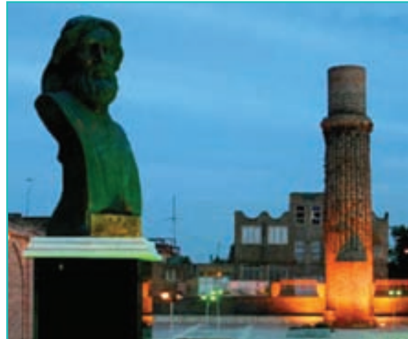
شکل ۱۸-۵- مقبره شمس تبریزی - خوی