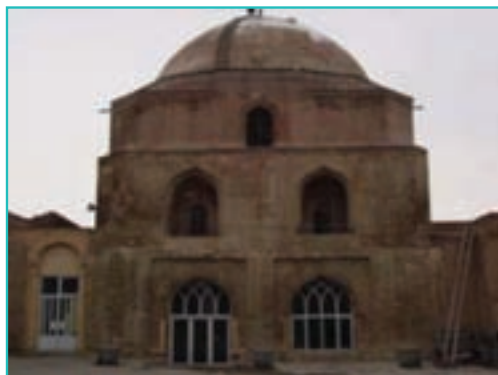
شکل ۳۱-۵- مسجد جامع ارومیه