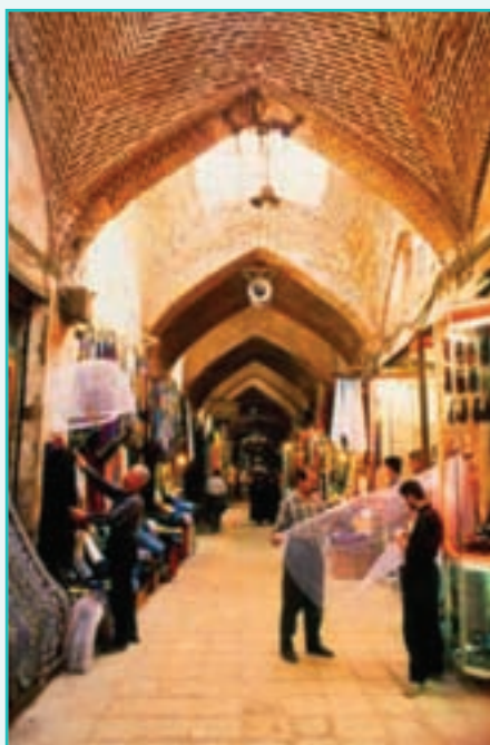
شکل ۳۹-۵- بازار خوی

بازار ارومیه: این بازار در مجموعه بافت قدیمی شهر قرار دارد. قدیمی‌ترین بخش‌های باقی مانده آن به دوره صفویه تعلق دارد. در بازار ارومیه هر راسته از سبک و شکل خاص دوره خود پیروی می‌کند و بقایای به جا مانده نمایانگر ذوق معماری دوره‌های مختلف است. سردر ورودی اصلی بازار ارومیه یکی از زیباترین جلوه‌های قدیمی معماری ایران است. این بازار هسته مرکزی خرید و فروش اهالی منطقه است. درون بازار مسجد جامع ساخته شده که قبلاً با آن آشنا شدیم.