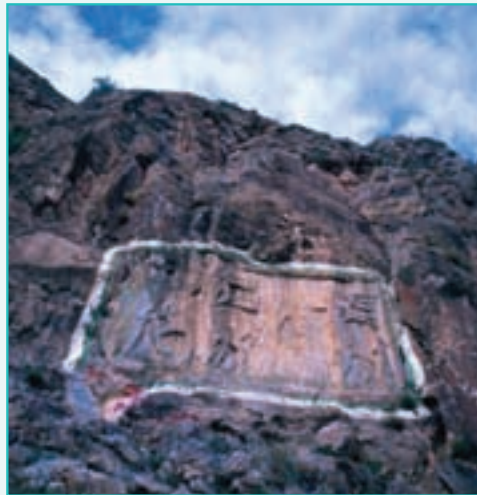
شکل ۲۱-۵- کتیبه خان تختی - سلماس