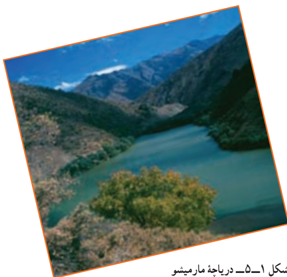
شکل ۱-۵- دریاچه مارمیشو