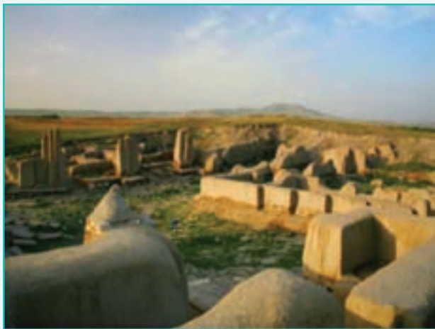
شکل ۲۰-۵- تپه حسنلو - نقده

از جمله مهم ترین جاذبه های تاریخی و فرهنگی استان می توان به موارد زیر اشاره کرد: تپه حسنلو: تپه باستانی حسنلو در ۲۲ کیلومتری شهر نقده و در ۴۵ کیلومتری جاده ارومیه به مهاباد، در کنار روستای حسنلو واقع شده است. این تپه شهرت جهانی دارد و بقایای یک شهر دژمانایی است. جام طلایی حسنلو در این تپه کشف شده است. قدمت تپه حسنلو به ۶۰۰۰ سال قبل از میلاد می رسد.