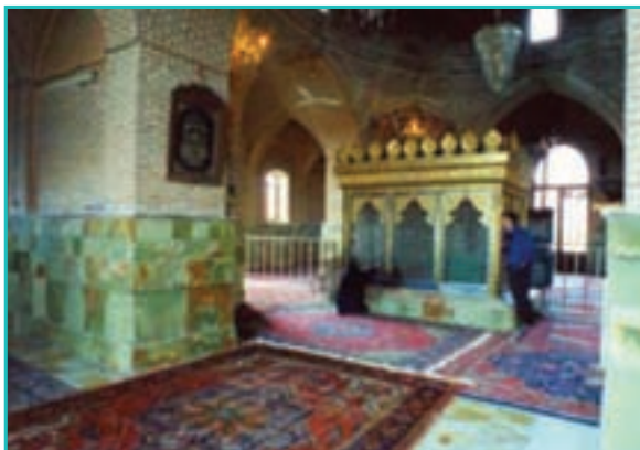
شکل ۲۶-۵- امامزاده برکشلوی ارومیه

امام علی النقی (ع) به اسامی «اسحاق بن محمد، ابراهیم بن محمد، محمود بن عمر، جعفر بن محمد» و زیارتگاه عاشقان اهل بیت عصمت و طهارت است. این امامزاده از سده‌های گذشته زیارتگاه مردم تازه شهر سلماس بوده است.