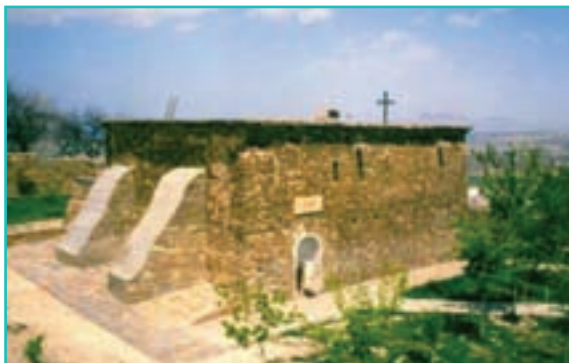
شکل ۳۸-۵- کلیسای سیر - ارومیه

کلیسای سیر : در ۵ کیلومتری جنوب ارومیه واقع شده و قدمت آن به ۱۷۰۰ سال پیش باز می گردد. محوطه بنا در فصل تابستان محل برگزاری مراسم مذهبی و فرهنگی است. از دیگر کلیساهای مهم استان می توان به کلیسای ننه مریم و حضرت مریم در ارومیه، سورپ سرکیس، ملهذان در خوی، هفتوان در سلماس و... اشاره کرد.