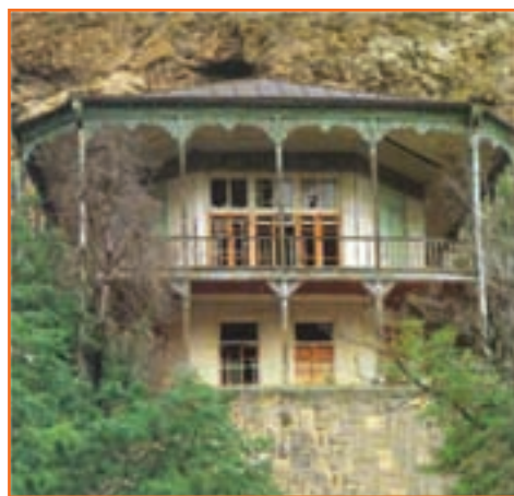
شکل ۳-۵- عمارت کلاه فرنگی ماکو