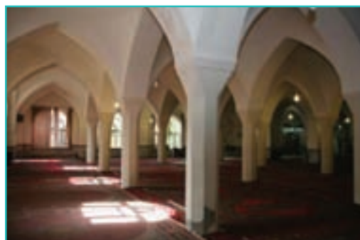
شکل ۳۲-۵- مسجد جامع مهاباد

مسجد جامع ارومیه : مسجد جامع یکی از آثار کهن و قدیمی شهر تاریخی ارومیه است. این مسجد در میان بازار قدیمی شهر واقع شده است. برخی معتقدند این بنا ابتدا آتشکده بوده و بعد از تسلط مسلمین ویران شده است. سپس در قرن هفتم (هجری قمری) روی آن مسجدی ساخته شد. این بنا شامل مجموعه آثاری از دوره‌های مختلف به شرح زیر است :