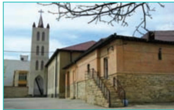
شکل ۳۷-۵- کلیسای ننه مریم - ارومیه