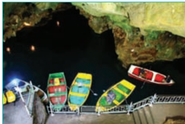
شکل ۱۱-۵- غار سهولان در مهاباد