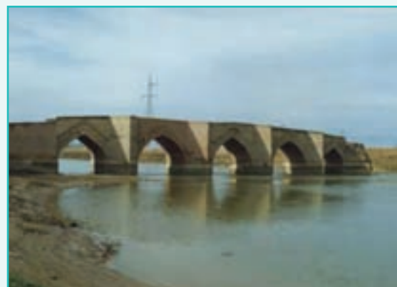
شکل ۲۴-۵- پل میرزا رسول در میاندوآب