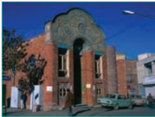
شکل ۳۰-۵- مسجد سردار - ارومیه