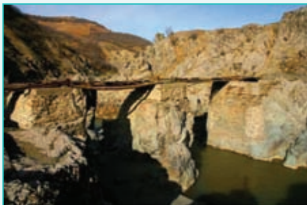
شکل ۲۵-۵- پل قالاتاسیان سردشت

موزه‌ها: آثار کشف شده از تپه‌ها، قلعه‌ها و بناهای تاریخی و... استان در موزه‌های ارومیه، خوی، میاندوآب، نقده و موزه باغچه جوق ماکو نگهداری می‌شود. موزه تاریخی ارومیه نیز از مکان‌های جذب گردشگران داخلی و خارجی به‌شمار می‌رود.