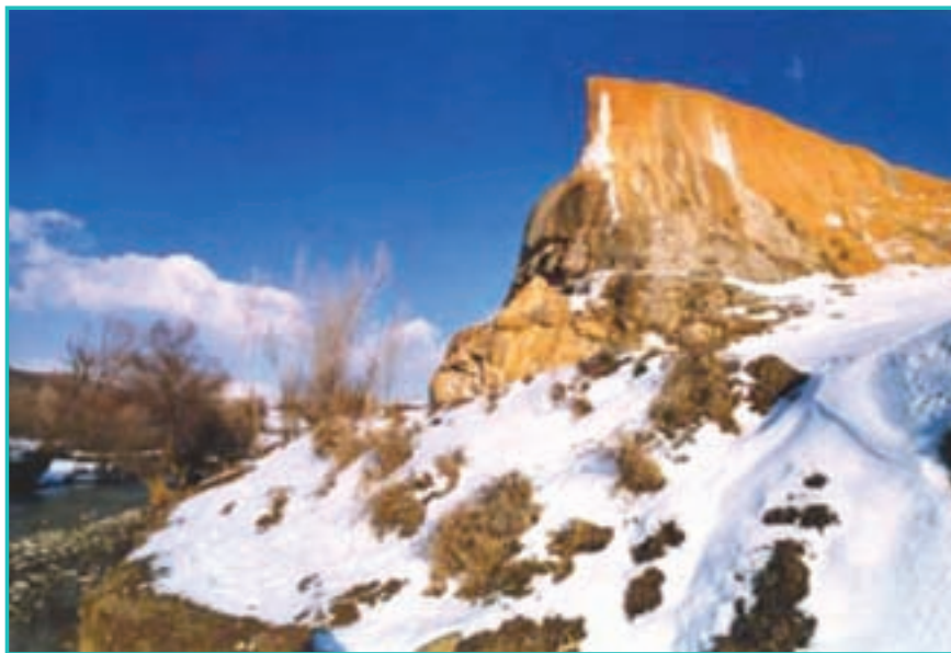
شکل ۱۴-۵- آب معدنی کانی گراوان در سردشت

شهرستان محل زندگی شما کدام جاذبه گردشگری درمانی را دارد؟