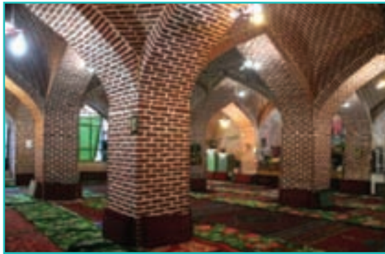
شکل ۳۳-۵- مسجد جامع بوکان

قره کلیسا در چالدران : این کلیسا که به کلیسای تاتائوس هم معروف است، یکی از قدیمی ترین کلیساهای عالم مسیحیت به شمار می رود و مزار یکی از مبشران حضرت مسیح (ع) به نام تاتائوس است. بنای آن در دو قسمت متعلق به قرن هفتم و دوازدهم میلادی است. این کلیسا بر فراز تپه ای در دشت چالدران بنا شده و همه ساله تعداد کثیری از ارامنه داخل و خارج کشور در مرداد ماه جهت شرکت در مراسم ویژه مذهبی از این کلیسا دیدن می کنند.