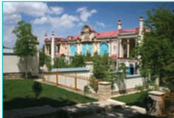
شکل ۲۳-۵- باغچه جوق ماکو

— کاخ موزه باغچه جوق ماکو: این بنا به فاصله ۲ کیلومتری سمت غرب جاده ماکو - بازرگان در روستای باغچه جوق واقع شده است. این کاخ توسط اقبال السلطنه ماکویی از حکام مقتدر اواخر دوره قاجاریه و یکی از سرداران مظفرالدین شاه ساخته شده است که با ۲۵۰۰ متر مربع زیربنا داخل باغ باصفایی واقع شده است و در نوع خود منحصر به فرد است.