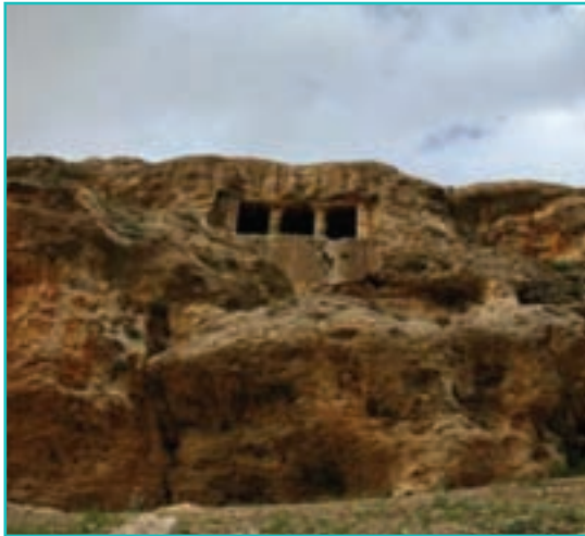
شکل ۱۹-۵- مقبره فخریگاہ - مهاباد