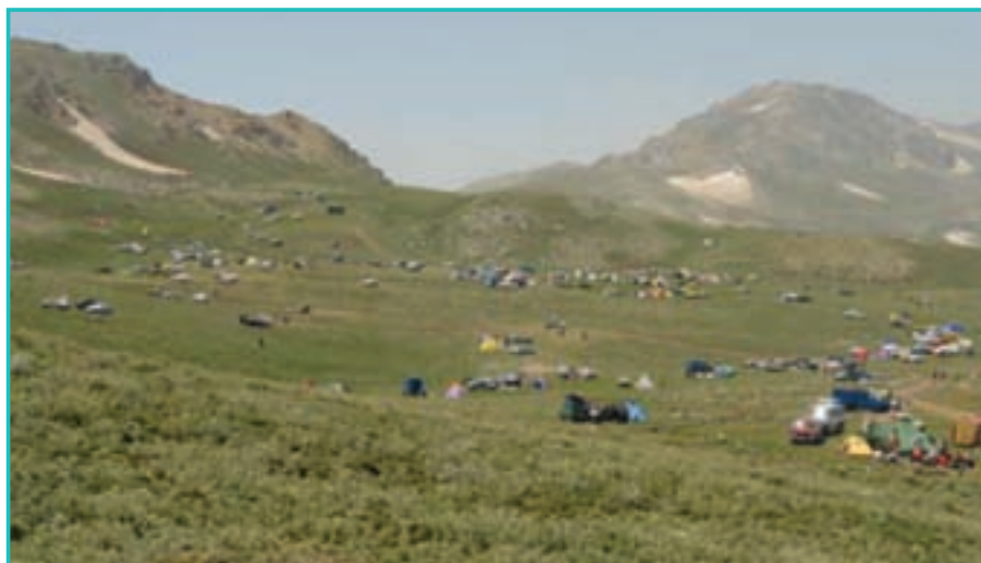
شکل ۸-۵- تفرجگاه تابستانی