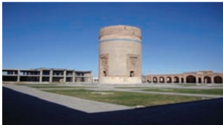
شکل ۱۲-۴- بقعه شیخ حیدر مشکین شهر

خیابان و آبادانی آن اهمیتی فوق العاده یافت. در دوره قاجار به ویژه در جنگ های ایران و روسیه این شهر از مراکز بسیار مهم برای استقرار سپاه عباس میرزای ولیعهد بوده است. در سال ۱۲۷۵ ه.ق. لشکریان روس پس از جنگ سختی با توپ و تفنگ و تجهیزات کامل شهر را به مدت ۶ ماه محاصره کرده و پس از سرکوب ایلات شاهسون که به شدت مقاومت می کردند، اموال مردم به عنوان غرامت توسط روس ها به یغما رفت.