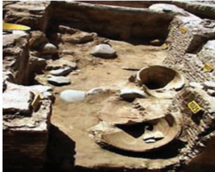
شکل ۳-۴- آثار به جا مانده از اردبیل در دوره پارت‌ها

یاقوت حموی در معجم البلدان بنای این شهر را به فیروز ساسانی که در سال‌های ۴۸۳-۴۵۹ میلادی سلطنت می‌کرد نسبت داده و آن را فیروزگرد نامیده است. وی در کتاب خود اردبیل را مشهورترین شهر آذربایجان خوانده و گفته است که پیش از اسلام کرسی ناحیه بوده و در جای دیگر گویند اردبیل از بناهای فیروز موسوم به باذان فیروز بوده است. پادشاهان اشکانی و ساسانی در جنگ با رومی‌ها که بر سر تسخیر اران و ارمنستان با هم داشتند، همواره به جمع‌آوری و استقرار نیرو در شمال آذربایجان همت می‌گماشتند که اردبیل محل مناسبی برای این تدارک و مرکز استقرار ستاد عملیات سپاه ایران علیه رومیان بوده است.