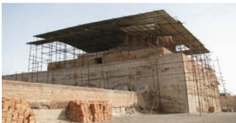
شکل ۴-۴- مسجد جمعه اردبیل یادگاری از دوره سلجوقیان

استان اردبیل امروزی به سبب موقع خاص خود، همواره در معرض تهاجم کوه‌نشینان قفقاز و اقوام دشت‌های جنوبی روسیه بوده است. چنانکه ترکان خزر و گرجیان بارها از دربند‌های قفقاز به دشت‌های اردبیل تاختند. با حضور ترکان سلجوقی در ایران، منطقه‌ما نیز در قلمرو آنها قرار گرفت و فرهنگ ترکان در میان مردم استان گسترش یافت. اردبیل در زمان حمله مغول نیز مرکز حکومت آذربایجان بود که غارت شد. ابن حوقل در کتاب صورة الارض می‌نویسد: «...مردم اردبیل در برابر مغولان به شدت مقاومت کردند و یک بار نیز آنها را شکست دادند. ولی سرانجام تسلیم شدند.»