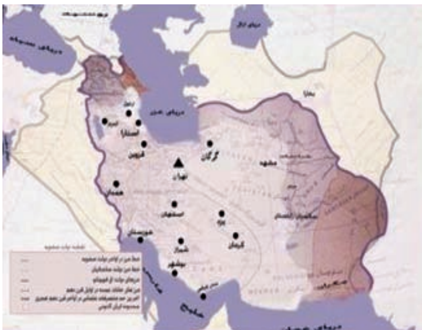
شکل ۴-۶- نقشه ایران در دوره صفویه که در آن ایران به‌عنوان خاستگاه مذهب تشیع در جهان مطرح شد.

شاه اسماعیل نواده شیخ صفی برای تشکیل حکومت واحد ایرانی از اردبیل قیام کرد و همه ولایات را مطیع خود ساخت. شورش‌ها را خواباند و ملوک الطوایفی را از بین برد. نخستین اقدام او رسمی کردن مذهب شیعه در ایران بود. بنابراین، اردبیل خاستگاه مذهب شیعه و تشکیل دولت ملی در ایران به شمار می‌رود.