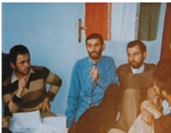
شکل ۲۲-۴- شهید داور یسری (نفر دوم)