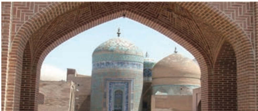
شکل ۷-۴- مجموعه بقعه شیخ صفی - گنبد الله الله در اردبیل