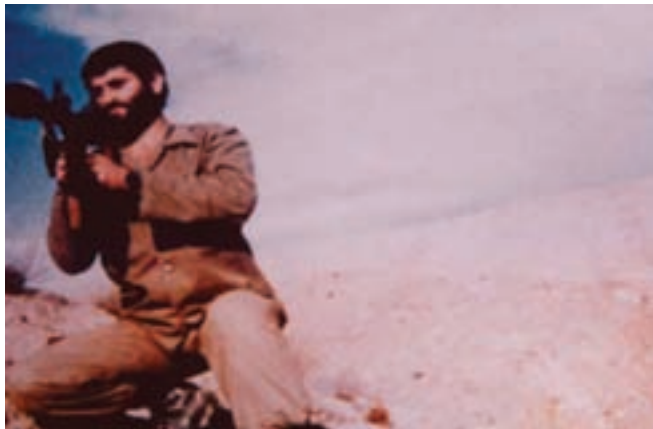
شکل ۲۴-۴- شهید بنام علی محمدزاده