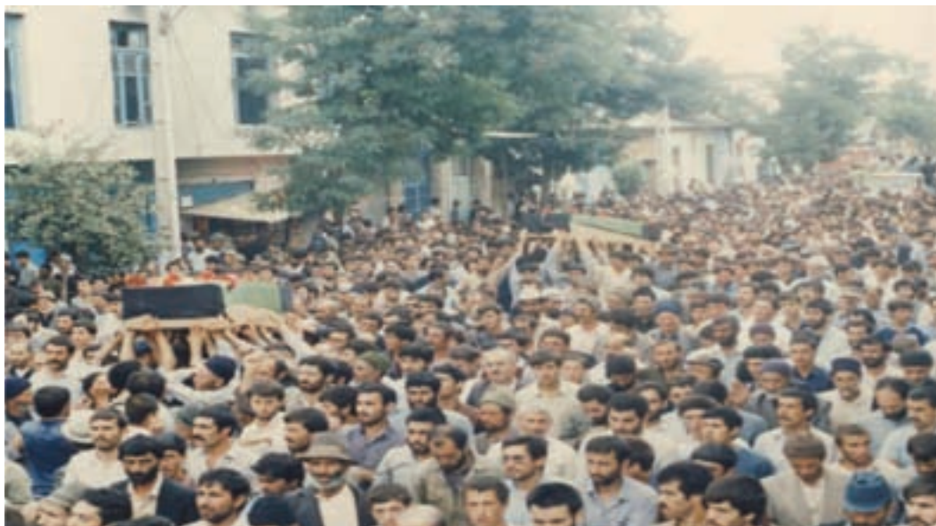
شکل ۱۸-۴- تشییع بیکر شهدا