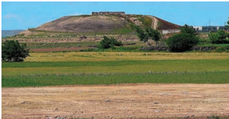
شکل ۱۰-۴- تپه نادری در اصلاندوز

بیله سوار یکی از بخش‌های مغان با داشتن تپه‌های مربوط به قبل از اسلام از نظر تاریخی حوادث بسیاری را شاهد بوده است که می‌توان از هجوم و حمله اقوام ترک اوغوز، و حملات روس‌ها در جنگ‌های دوره‌های مختلف نام برد. وجود آثاری همچون قیز قلعه‌سی، قبرستانی به نام گوور و تپه‌های باستانی مربوط به دوره اشکانی و اجاق برزند و آلازار، گرمی را به یکی از مراکز مهم تاریخی تبدیل کرده است. همچنین اصلاندوز محل جنگ‌های ایران و روس در دوره قاجار دارای تپه‌های قدیمی از جمله تپه نادری و گورستان‌های تاریخی یکی دیگر از بخش‌های تاریخی مغان محسوب می‌شود. در جنوب مغان، منطقه خیابو قدیم یا مشکین شهر امروزی قرار دارد که مدنیت بزرگی در این حوالی بوده که هنوز تقریباً دست‌نخورده زیر خاک مدفون است. قدمت خیابو را به دلیل وجود قبور زردشتیان و سنگ نبشته‌های ساسانی و قلعه‌هایی چون قهقهه، دیو قالاسی، کهنه قلعه و قلعه ارشق می‌توان به قبل از قرون اسلامی رساند.