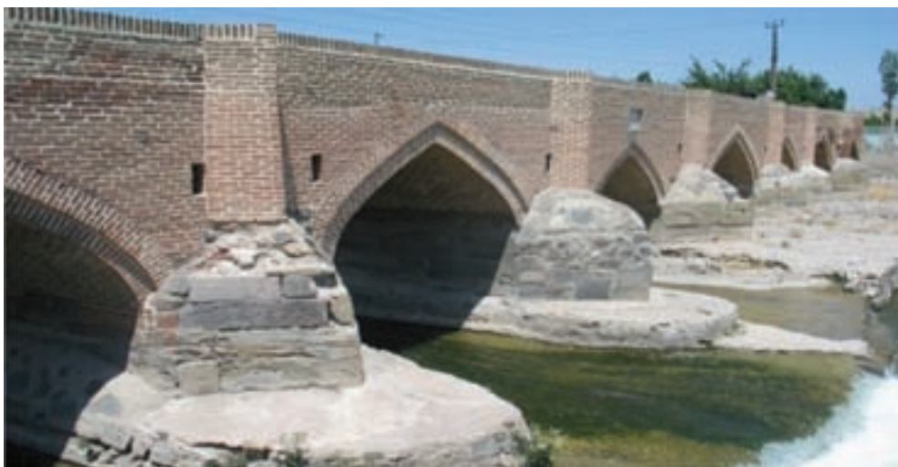
شکل ۸-۴- پل هفت چشمه اردبیل از دوره صفویه