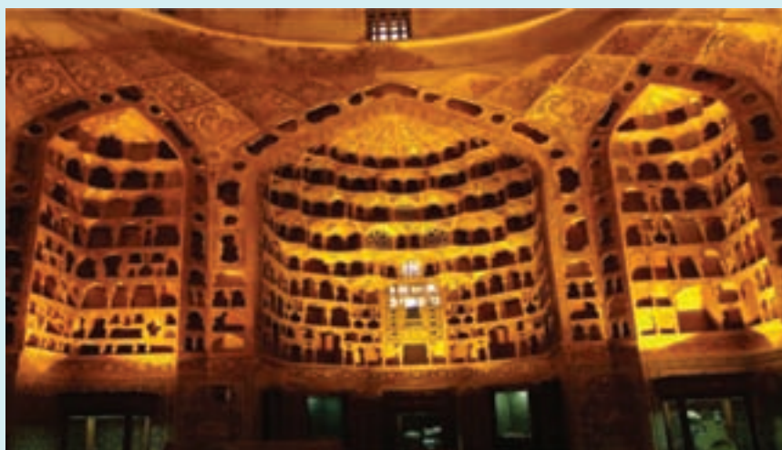
شکل ۹-۴- چینی خانه بقعه شیخ صفی

به نظر شما از تصویر زیر در چه زمینه‌ای استفاده می‌شده است؟