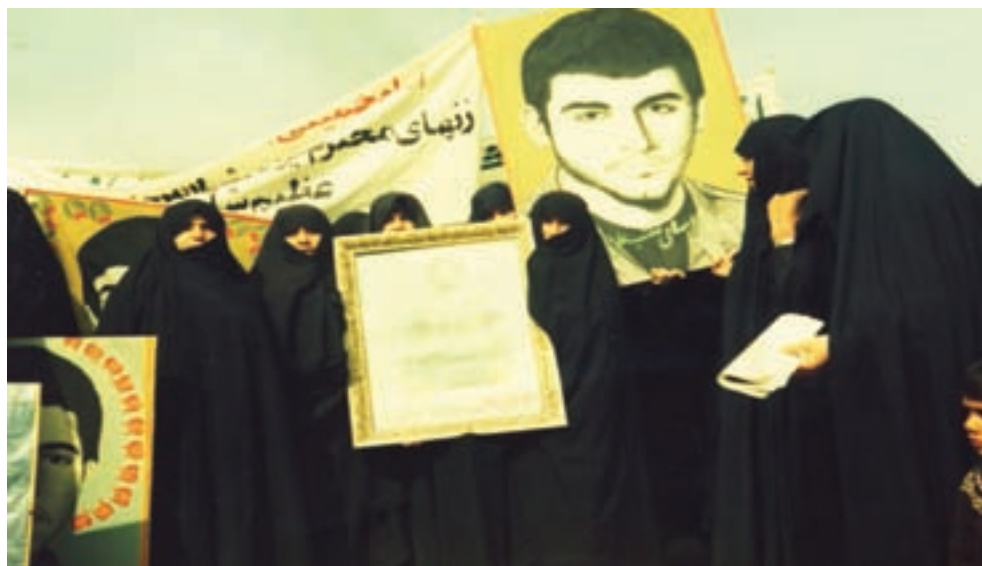
شکل ۱۵-۴- حضور زنان استان در عرصه‌های مختلف دفاع مقدس