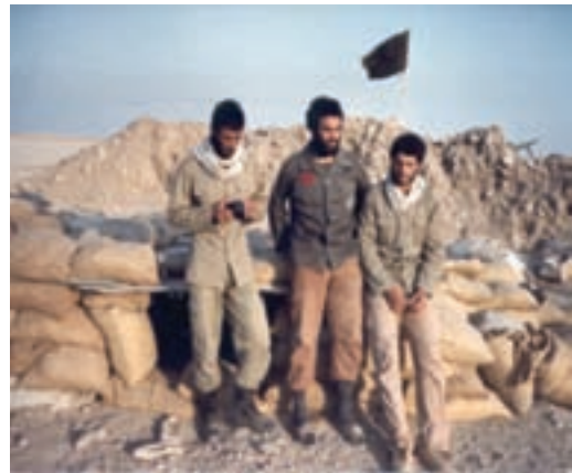
شکل ۲۳-۴- شهید میر محمود بنی هاشم (نفر دوم)