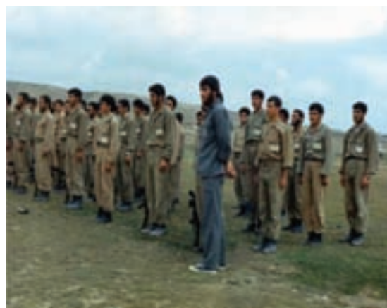
شکل ۲۱-۴- شهید شاپور برزگر (نفر اول)