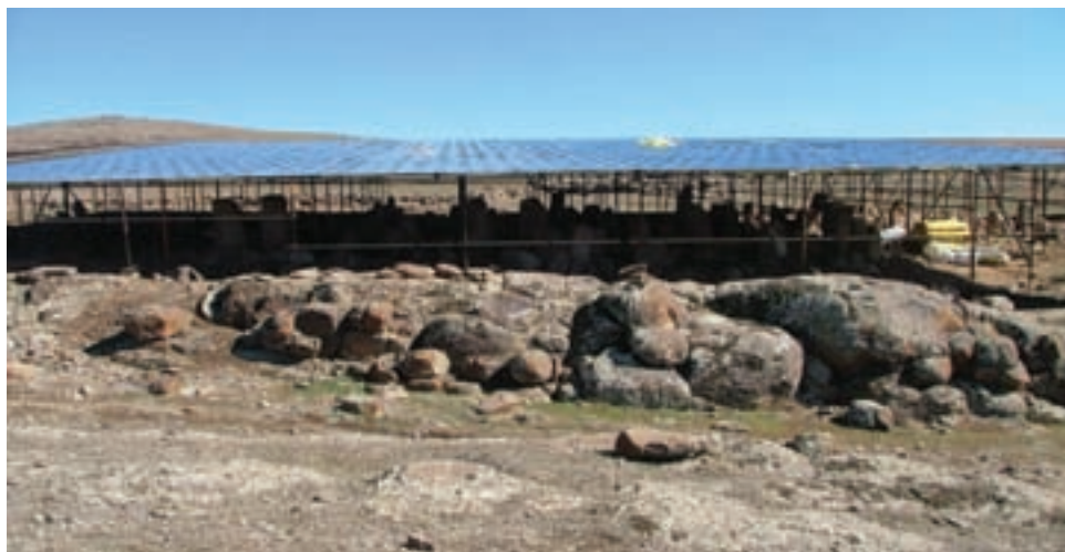
شکل ۱-۴- شهر یری در مشکین شهر مربوط به دوره پیش از تاریخ

با توجه به مدارک موجود باستان‌شناسی، می‌توان گفت منطقه اردبیل حداقل از هزاره ششم قبل از میلاد مسکون بوده است؛ چرا که سراسر منطقه از تپه‌های باستانی یا به عبارت دیگر مناطق استقراری که روزگاری دژ یا شهرک یا روستا بودند پوشیده شده است مانند شهر یری در مشکین شهر، قلعه اولتان در پارس آباد و بوینی یوغون (دژ بهمن) در نیر.