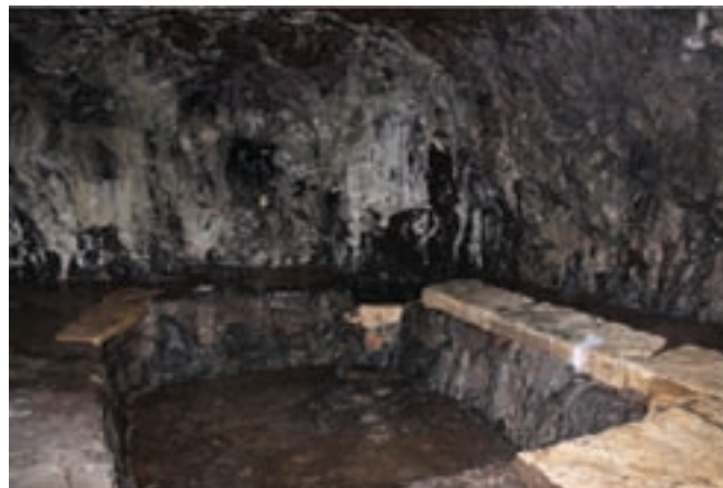
شکل ۱۳-۴- حمام سنگی خلخال

در معجم البلدان (اواخر قرن ششم هجری) آمده است: «در ولایت خلخال قلاعی بلند قرار دارد که مردم آن هنگام حمله مغول به آنجا عزیمت کردند» وجود کاروان سراهای تاریخی، امازاده ها، مساجد و پل ها از جمله پل پردیس (مربوط به دوره ساسانی)، غارها و حمام های تاریخی حاکی از مدینت طولانی در این منطقه است.