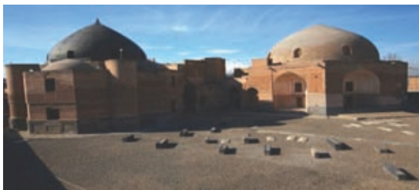
شکل ۴-۵- خانقاه شیخ صفی‌الدین در اردبیل

در دوره ایلخانان به دلیل رشد و گسترش تصوف، خانقاه‌های زیادی در نواحی مختلف ایران بنا شدند که مهم‌ترین آنها خانقاه شیخ صفی‌الدین در اردبیل بود. بزرگی مقام شیخ صفی‌الدین در عرفان باعث شد که اردبیل کعبه‌آمال و قبله صوفیان شود. علاوه بر مردم، حاکمان و بزرگان نیز احترام خاصی به شیخ صفی‌الدین و فرزندان آنها می‌گذاشتند، به طوری که معروف است امیر تیمور لنگ در ملاقات با شیخ خواجه علی در اردبیل هزاران اسیر عثمانی را به درخواست ایشان آزاد کرد.