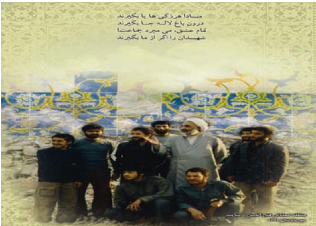
شکل ۱۷-۴- دیدار رزمندگان اردبیل با آیت الله مروج امام جمعه فقید اردبیل

مردم غیور استان در اعزام نیروها و همچنین پشت جبهه در امر پشتیبانی همیشه فعال بودند. در این میان می توان از مساجد به عنوان مهم ترین پایگاه جذب نیرو نام برد. به طوری که اولین پایگاه های بسیج نیز در مساجد شکل گرفت. وجه مشترک تمامی نیروهای داوطلب، ارتباط با مساجد و پایگاه های بسیج محلات بود که مساجد نقش اصلی پشتیبانی خطوط نبرد را نیز بر عهده داشتند و مطمئن ترین و ساده ترین راه کمک رسانی مردم به جبهه ها محسوب می شدند. ترویج فرهنگ ایثار و شهادت که ریشه در مذهب و پویایی مساجد داشت نیز موجب تداوم این فعالیت ها می شد و هر فردی که شهید می شد، ضمن آنکه همگی در مراسم تشییع آن شهید حضور فعال داشتند از نظر روحی نیز ضربه مهلکی بر دشمنان وارد می آوردند و افراد بیشتری را راهی جبهه های نبرد حق علیه باطل می کردند که در آن میان، حضور جوانان بسیار چشمگیر بود.