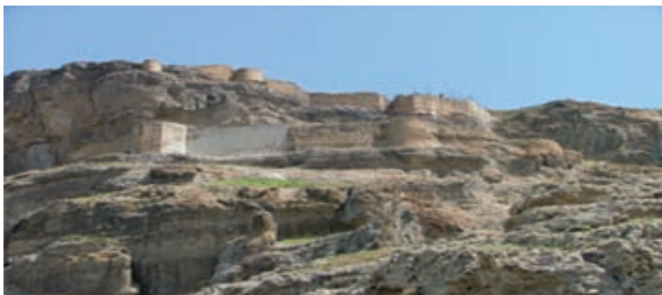
شکل ۱۱-۴- قلعه قهقهه در مشکین شهر

بیله سوار یکی از بخش‌های مغان با داشتن تپه‌های مربوط به قبل از اسلام از نظر تاریخی حوادث بسیاری را شاهد بوده است که می‌توان از هجوم و حمله اقوام ترک اوغوز، و حملات روس‌ها در جنگ‌های دوره‌های مختلف نام برد. وجود آثاری همچون قیز قلعه‌سی، قبرستانی به نام گوور و تپه‌های باستانی مربوط به دوره اشکانی و اجاق برزند و آلازار، گرمی را به یکی از مراکز مهم تاریخی تبدیل کرده است. همچنین اصلاندوز محل جنگ‌های ایران و روس در دوره قاجار دارای تپه‌های قدیمی از جمله تپه نادری و گورستان‌های تاریخی یکی دیگر از بخش‌های تاریخی مغان محسوب می‌شود. در جنوب مغان، منطقه خیابو قدیم یا مشکین شهر امروزی قرار دارد که مدنیت بزرگی در این حوالی بوده که هنوز تقریباً دست‌نخورده زیر خاک مدفون است. قدمت خیابو را به دلیل وجود قبور زردشتیان و سنگ نبشته‌های ساسانی و قلعه‌هایی چون قهقهه، دیو قالاسی، کهنه قلعه و قلعه ارشق می‌توان به قبل از قرون اسلامی رساند.