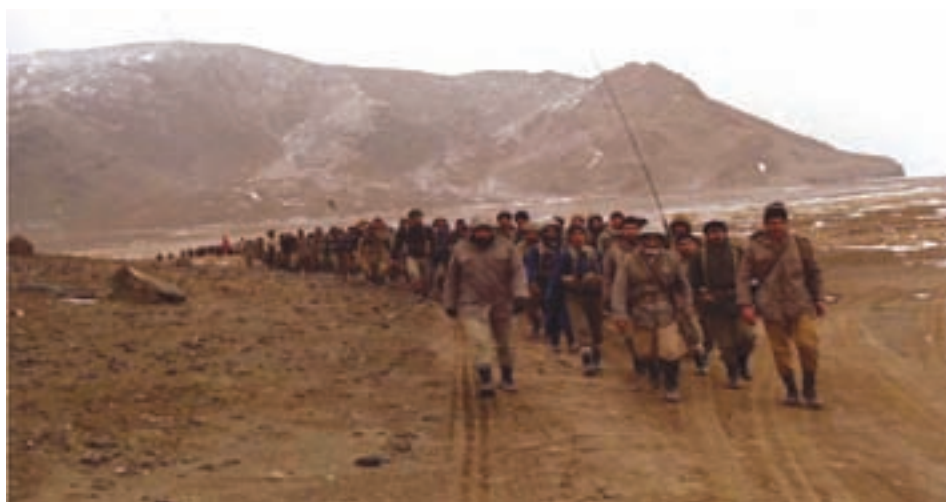
شکل ۱۶-۴- رزمندگان اسلام در جبهه

در طول ۸ سال دفاع مقدس مردم غیرتمند اردبیل در تمامی مراحل جنگ حضور فعال داشتند. از ابتدا تا پایان دفاع مقدس با اعزام ده‌ها هزار نیرو به جبهه‌های نبرد و شرکت در عملیات‌های مختلف حضور مؤثر داشتند. سپاه اردبیل از فعال‌ترین یگان‌ها در طول هشت سال دفاع مقدس بود که در حدود ۳۵۰۰۰ نفر نیرو به جبهه اعزام کرد. دومین یگان رزمی تیپ پیاده ارتش مستقر در اردبیل که متناسب به لشکر زرهی قزوین بود در اوایل جنگ در مناطق جنگی رشادت‌های به یادماندنی از خودشان نشان دادند. سومین یگان عمل‌کننده در استان اردبیل، نیروهای جان بر کف جهاد سازندگی بودند که در قالب جهاد آذربایجان شرقی از شروع جنگ تا پایان آن همواره در مناطق جنگی جهت سنگرسازی حضور داشتند.