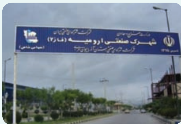
شکل ۲-۶- شهرک صنعتی شماره ۲ ارومیه

۱- شهرک صنعتی شماره ۲ ارومیه: شهرک صنعتی شماره ۲ ارومیه بزرگ‌ترین شهرک صنعتی از نظر میزان اشتغال ایجاد شده در واحدهای بهره‌برداری رسیده استان است که در کیلومتر ۷ جاده ارومیه - ریحان‌آباد قرار دارد. مساحت آن ۱۵۴/۰۳ هکتار و تعداد واحدهای بهره‌برداری رسیده آن ۱۸۵ واحد با ۴۴۹۴ نفر اشتغال است. نزدیکی به مرکز استان، وجود مواد اولیه و راه‌های ارتباطی و زمین هموار و مناسب، از مزایای مهم این شهرک به‌شمار می‌رود.