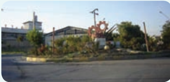
شکل ۳-۶- شهرک صنعتی شماره یک ارومیه

۲- شهرک صنعتی شماره یک ارومیه : شهرک صنعتی شماره یک ارومیه، در کیلومتر ۷ جاده ارومیه در بزرگراه شهید کلاتری قرار دارد. مساحت این شهرک ۳۴/۵۳ هکتار و تعداد واحدهای بهره‌برداری رسیده آن ۷۹ واحد و میزان اشتغال در این شهرک ۴۴۹۴ نفر است. افتتاح میان‌گذر دریاچه ارومیه و دسترسی به بزرگراه شهید کلاتری بر اهمیت این شهرک در سال‌های اخیر افزوده است.