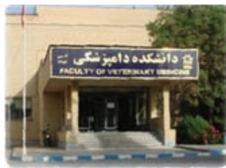
شکل ۷-۶- دانشگاه‌های ارومیه