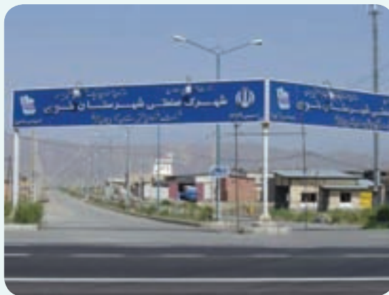
شکل ۴-۶- شهرک صنعتی خوی

۳- شهرک صنعتی خوی : سومین شهرک صنعتی استان از نظر ایجاد اشتغال شهرک صنعتی خوی است. این شهرک با وسعت ۲۲۱/۸۳ هکتار در کیلومتر ۱۵ خوی - سلماس قرار دارد. تعداد واحدهای به بهره‌برداری رسیده این شهرک ۱۰۵ واحد و میزان اشتغال ۲۱۰۲ نفر است. نزدیکی به نیروگاه سیکل ترکیبی، فرودگاه خوی و شبکه راه آهن سراسری در سال‌های اخیر در توسعه آن نقش مهمی ایفا کرده است.