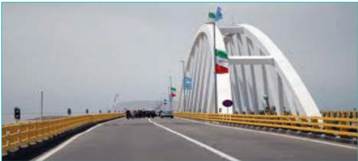
شکل ۶-۶- پل میان گذر دریاچه ارومیه