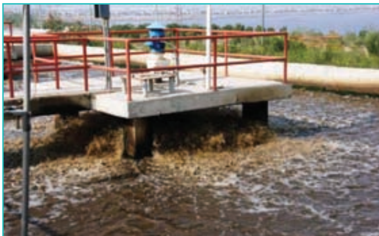
شکل ۵-۶- تصفیه‌خانه فاضلاب ارومیه