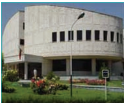
شکل ۸-۶- بیمارستان امام خمینی(ره) - ارومیه