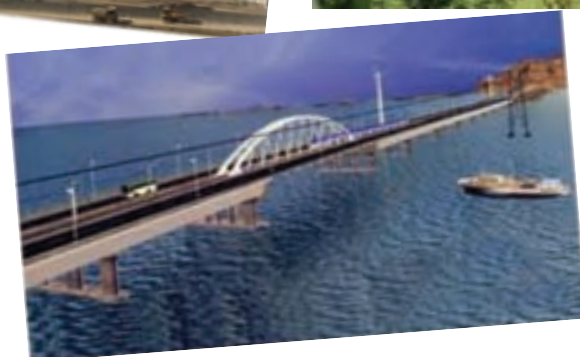
شکل ۱-۶- بخش‌های دستاوردهای انقلاب اسلامی