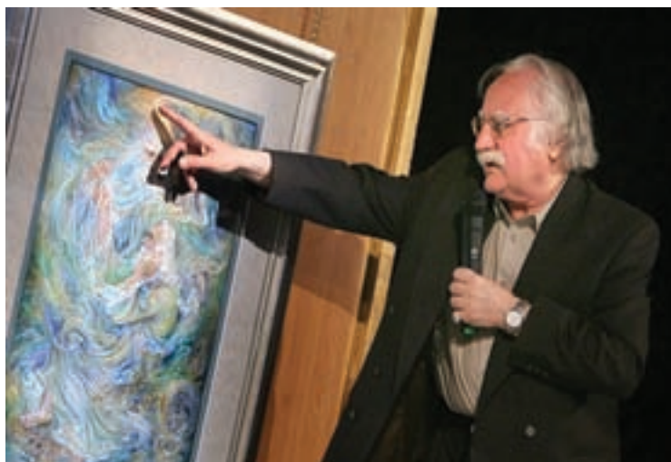
شکل ۱۵-۶- استاد محمود فرشچیان نقاش و طراح معروف معاصر