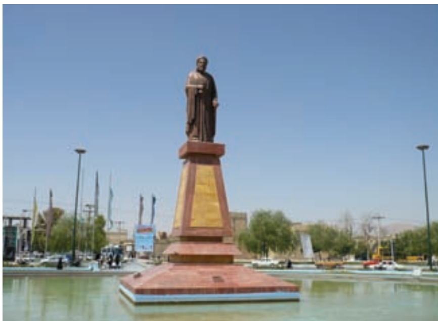
شکل ۱۰-۶- تندیس شیخ بهایی (ورودی شهر نجف آباد)

به غیر از شهر اصفهان در سایر شهرها و حتی روستاهای استان نیز آثاری از دوره صفویه به چشم می خورد؛ مثلاً کاشان، خوانسار، نجف آباد (ایجاد شهر در زمان صفویه)، کوهپایه و نائین.