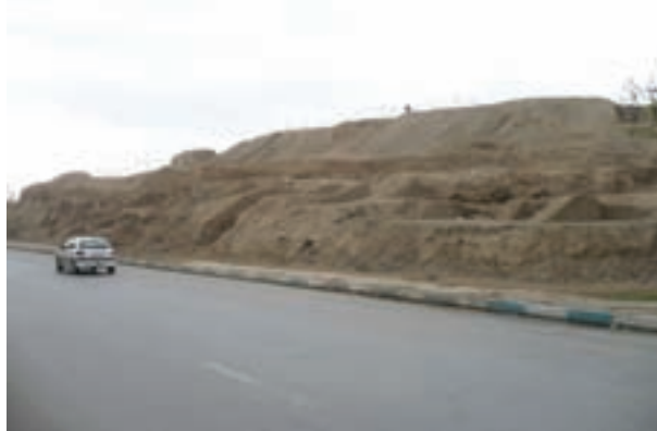
شکل ۴-۶- تپه اشرف باقی مانده بنای کهن سارویه (نزدیک پل شهرستان اصفهان)

از اصفهان پیش از اسلام؛ یعنی زمان هخامنشیان، اشکانیان و ساسانیان اطلاعات زیادی در دست نیست و آثار چندانی برجای نمانده است ولی آنچه مسلم است، از آنجا که استان اصفهان از لحاظ جغرافیایی در مرکز ایران واقع شده است، وجود دشت‌های وسیع و حاصل خیز و در برخی از مناطق، منابع آب فراوان - مانند زاینده رود - جاذبه‌هایی در آن ایجاد کرده است؛ از این رو، تمامی حاکمان در طول تاریخ نسبت به آن توجه ویژه داشته‌اند و تلاش همه‌جانبه آنها این بوده است که تسلط خود را بر این منطقه حفظ کنند. در دوران اساطیری، وجود داستان‌هایی مانند ماجرای کاوه آهنگر همان چهره آزاده که علیه ستم ضحاک قیام کرد و به کمک فریدون ملت ایران را از بند اسارت آزاد کرد و هم اکنون نیز در منطقه فریدن در روستایی به نام مشهد کاوه، آرامگاهی منسوب به این قهرمان ملی دیده می‌شود، نشان از مرکزیت قدرت سیاسی در این قسمت کشور دارد. وجود دژی بسیار بزرگ همانند اهرام مصر به نام کهندژ سارویه در حاشیه اصفهان امروزی که آثار آن تا هزار سال قبل هنوز برجای بوده و امروزه بخشی از آن در کنار پل شهرستان به نام تپه اشرف باقی مانده است و نیز بقایای آتشکده منسوب به عصر ساسانیان در ماریین اصفهان (کوه آتشگاه)، نمونه‌ای از آثار برجای مانده از پیش از اسلام است.