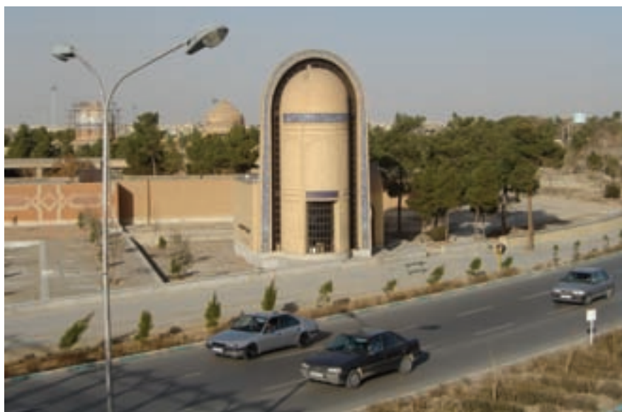
شکل ۱۴-۶- مقبره دانشمند بزرگ بانو مجتهده امین - تخت فولاد اصفهان

علاوه بر مردان نام‌آور در تاریخ این استان بزرگ، بانوانی در صحنه علم، هنر و اخلاق در دامن این استان پرورش یافته‌اند که می‌توان به بزرگانی چون ام‌الفراسیه (اولین ایرانی مسلمان)، فاطمه جوزدانی، آمنه بیگم مجلسی، مریم بانو نائینی، هما امامزاده (اولین پزشک زن ایرانی از شهرضا)، بی‌بی‌جان کاشانی و بانو مجتهده امین اشاره کرد.