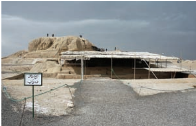
شکل ۲-۶- تپه‌های باستانی سیلک - کاشان

بیشتر این مکان‌ها مربوط به هزاره چهارم تا هزاره ششم قبل از میلاد است. برخی از مکان‌های باستانی استان عبارت‌اند از: تپه سیلک کاشان، محوطه باستانی اریسمان در شهرستان نطنز (هزاره چهارم ق. م)، تپه آشنا در چادگان (هزاره ششم ق. م)، تپه چغا حسن در گلپایگان (هزاره پنجم ق. م)، گورتان اصفهان (هزاره چهارم ق. م)، سبا در ورزنه (هزاره سوم ق. م)، تپه جوزک تیران و کرون (هزاره چهارم ق. م)، تل شاهی سمیرم (هزاره چهارم ق. م) و تپه‌های ننادگان فریدن (هزاره چهارم ق. م).