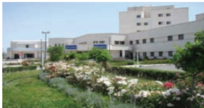
شکل ۸-۶- بیمارستان امام خمینی اردبیل