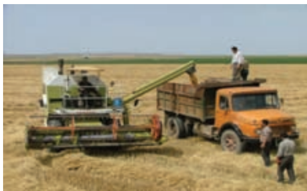
شکل ۹-۶ برداشت محصول گندم در جلگه مغان