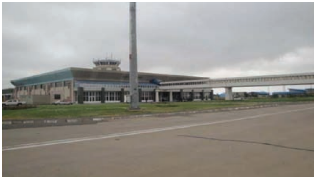
شکل ۴-۶- فرودگاه اردبیل