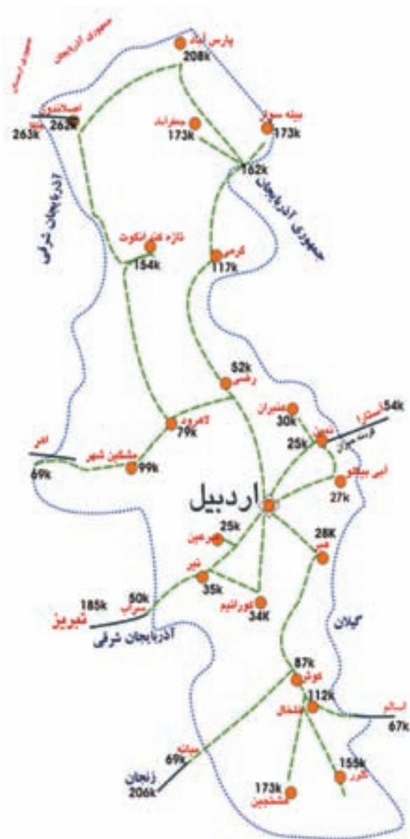
شکل ۱۶-۶- نقشه راه‌های استان اردبیل