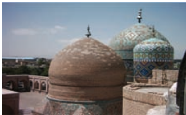
شکل ۱۱-۶ بقعه شیخ صافی در اردبیل