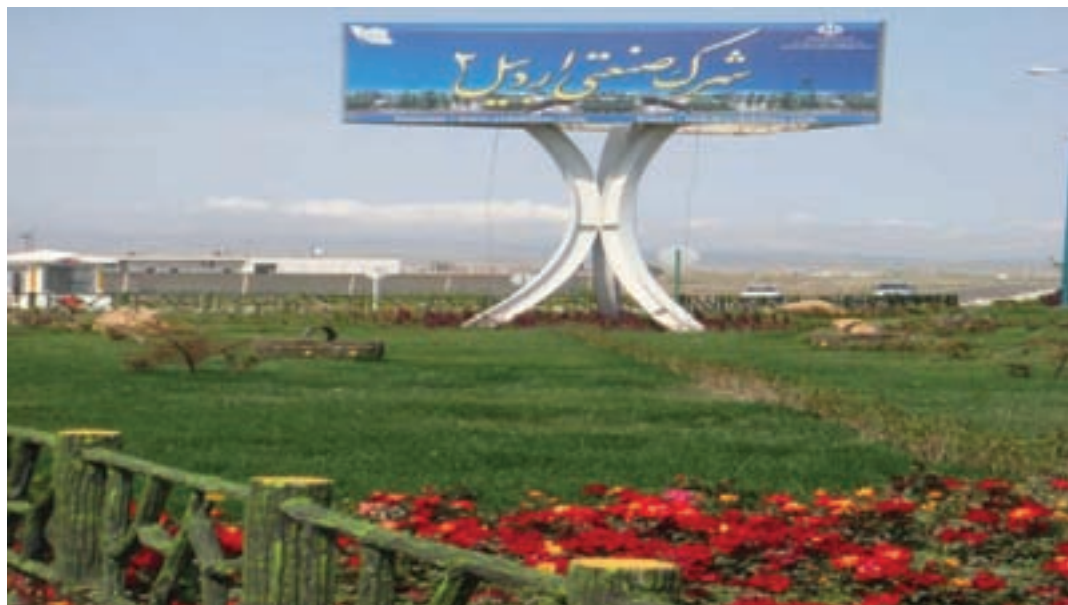
شکل ۳-۶- شهرک صنعتی اردبیل ۲

۲- شهرک صنعتی اردبیل (۲) : عملیات اجرایی این شهرک از سال ۱۳۸۰ در زمینی به مساحت ۶۰۰ هکتار (امکان توسعه تا ۷۰۰ هکتار) آغاز شد. این شهرک که بزرگ‌ترین شهرک صنعتی استان است در فاصله ۱۳ کیلومتری بزرگراه اردبیل - آستارا واقع شده است همجواری این شهرک با گمرک و فرودگاه و نیز واقع شدن در مسیر بزرگراه اردبیل به تهران و نداشتن محدودیت‌های زیست محیطی برای استقرار واحدهای صنعتی مختلف از مزایا و جاذبه‌های این شهرک می‌باشد.