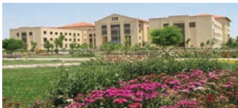
شکل ۶-۷- دانشگاه محقق اردبیلی