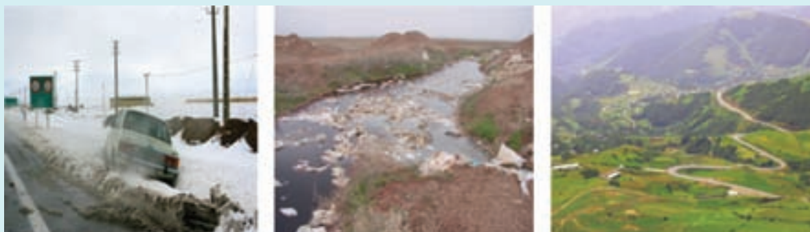
شکل ۱۵-۶- نمونه‌هایی از محدودیت‌ها و مشکلات توسعه در استان

در شکل ۱۵-۶ نمونه‌هایی از مشکلات و محدودیت‌های استان به تصویر کشیده شده است. هر تصویر کدام یک از مشکلات و محدودیت‌های استان را نشان می‌دهد؟ راهکارهای خود را برای حل این مشکلات بیان کنید.