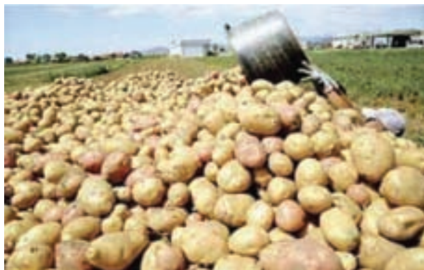
شکل ۱۳-۶- محصول سیب زمینی در دشت اردبیل