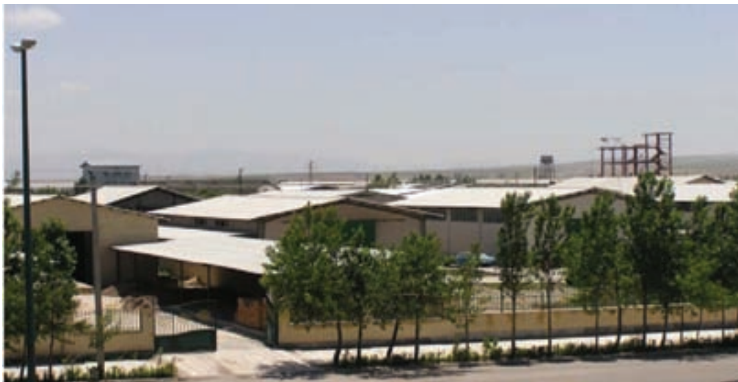
شکل ۲-۶- شهرک صنعتی اردبیل ۱

۲- شهرک صنعتی اردبیل (۲) : عملیات اجرایی این شهرک از سال ۱۳۸۰ در زمینی به مساحت ۶۰۰ هکتار (امکان توسعه تا ۷۰۰ هکتار) آغاز شد. این شهرک که بزرگ‌ترین شهرک صنعتی استان است در فاصله ۱۳ کیلومتری بزرگراه اردبیل - آستارا واقع شده است همجواری این شهرک با گمرک و فرودگاه و نیز واقع شدن در مسیر بزرگراه اردبیل به تهران و نداشتن محدودیت‌های زیست محیطی برای استقرار واحدهای صنعتی مختلف از مزایا و جاذبه‌های این شهرک می‌باشد.