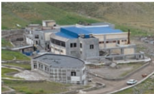
شکل ۱۲-۶ آبگرم قینرجه در مشکین شهر