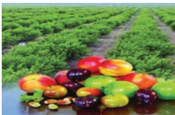
شکل ۱۴-۶- محصولات باغداری کشت و صنعت مغان

امروزه استان اردبیل با شرایط خاص جغرافیایی، تنوع محیطی، شرایط آب و هوایی، جاذبه‌های توریستی، قابلیت کشاورزی و باغداری از توان بالایی در مسیر توسعه فضایی یکپارچه برخوردار است. از طرفی همجواری با کشور جمهوری آذربایجان و ایجاد بازارچه مرزی و گمرک، ارتباط کشورمان ایران را با منطقه قفقاز و اروپا تسهیل کرده و جایگاه استان را در سطح فنی و بین‌المللی بهبود بخشیده است. با وجود قابلیت‌ها و مزیت‌های یاد شده، استان ما مسائل و مشکلاتی به شرح زیر دارد: - مرزی بودن استان و داشتن فاصله زیاد از مناطق مرکزی و توسعه یافته‌تر کشور - کوهستانی بودن استان و به تبع آن ضعف پیوند فیزیکی، اقتصادی و اجتماعی - طولانی بودن دوره سرما و یخبندان - عدم تجهیز فرودگاه‌های اردبیل و پارس آباد - نبود شبکه راه آهن