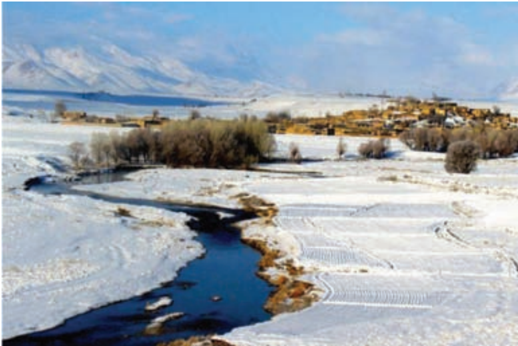
شکل ۱-۷- روستایی در فریدن

— صدا و سیما: اصفهان اولین استان در کشور است که شبکه استانی سیما در آن شکل گرفته است. همچنین، صدای مرکز استان نزدیک به نیم قرن سابقه فعالیت دارد. از سال ۱۳۷۴ افتتاح شبکه ۵ سیمای استان به توسعه این سازمان کمک چشم گیری کرده است. در حال حاضر، کل استان زیر پوشش شبکه صدا و سیما قرار دارد.