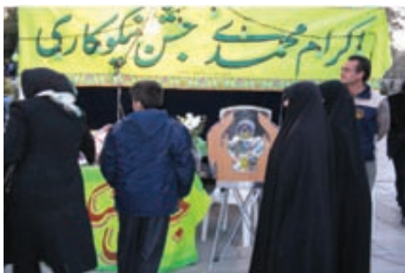
شکل ۲-۷- جشن نیکوکاری

وجود ۱۴۷ واحد توانبخشی، ۳۲ مرکز بازپروری ۱ معتادان و ۷ مرکز مشاوره ۲ ژنتیک ۳ از افتخارات خدماتی این سازمان بوده است. — کمیته امداد امام خمینی: ۳۴ واحد کمیته مشغول در استان، به عنوان نهادی انقلابی از نوع مؤسسات غیرانتفاعی و عام المنفعه، خدمات خود را در جهت سه محور امور حمایتی از محرومان، امور توانمندسازی محرومان و امور اعتمادسازی و جلب مشارکت‌های مردمی دنبال می‌کند.