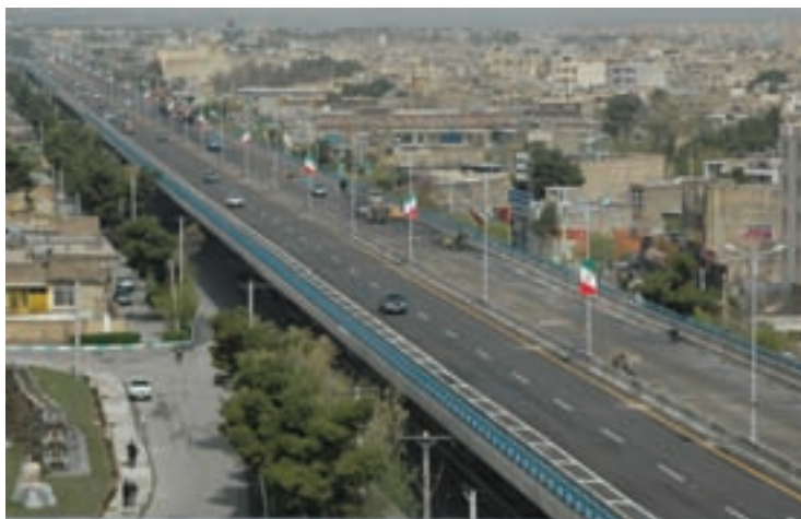
شکل ۳-۷- پل روگذر غیر مسطح امام خمینی (ره)

— حمل و نقل: استان اصفهان با دارا بودن ۱۱۰۰۰ کیلومتر راه، نقش مهمی را در بخش حمل و نقل کشور ایفا می‌کند. ۲۵ درصد آزاد راه‌ها و ۲۳ درصد بزرگراه‌های کشور در این استان قرار گرفته است. در بخش حمل و نقل ریلی، استان اصفهان دارای ۶۴۹ کیلومتر خط اصلی است. در بخش هوایی نیز با پنج فرودگاه در استان وجود دارد، که فقط فرودگاه شهید بهشتی در زمینه حمل و نقل عمومی و مسافربری فعال است. کاهش تلفات جاده‌ای و شناسایی و اصلاح نقاط پرحادثه، افزایش ظرفیت شبکه راه‌های استان، برقراری تردد امن با کاهش زمان و هزینه سفر از اقدامات مهم این بخش است. — حمل و نقل درون شهری: تا پایان شش ماهه اول سال ۱۳۸۷ سهم حمل و نقل عمومی در کلان‌شهر اصفهان ۶۸ درصد بوده است. طی ۳۰ سال (۱۳۵۸-۸۵) جمعیت شهری استان حدود ۲/۱۵ برابر شده؛ در حالی که تعداد وسایل حمل و نقل عمومی به بیش از ۵۹ برابر رسیده است.