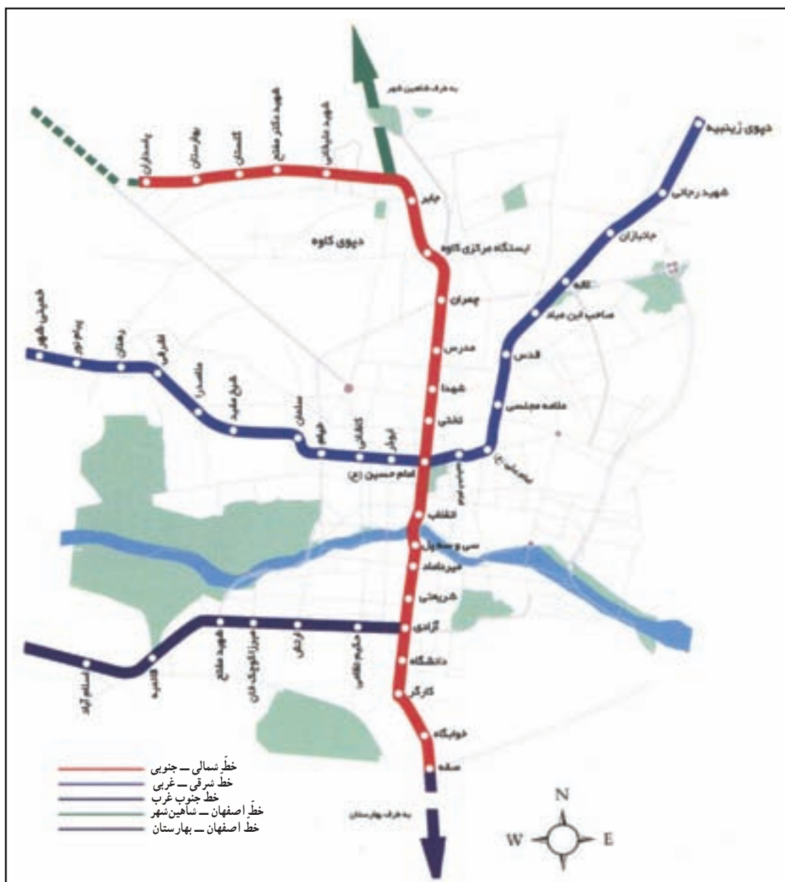
شکل ۴-۷- نقشه خطوط متروی شهر اصفهان

افزایش حجم سنگین سفرهای شهری هر روز بیشتر از گذشته، راه اندازی سیستم های حمل و نقل زیرزمینی مانند مترو، تونل ها و پل های زیر گذر را ضروری ساخته است. اجرای طرح های عمرانی شهری مانند طرح تونل زیر گذر شهید آقاخانی به طول ۱۱۰۰ متر (نخستین تونل شهری در کشور)، پل روگذر غیر مسطح خیابان امام خمینی به طول ۵ کیلومتر از بزرگ ترین و پیشرفته ترین پل های روگذر کشور است. احداث قطار شهری در کلان شهر اصفهان، یکی از مناسب ترین راه کارها جهت کاهش حجم ترافیک درون شهری در محور شمال - جنوب شهر است. در حال حاضر، احداث شش خط مترو به طول ۲۰/۲ کیلومتر در دستور کار قرار دارد.