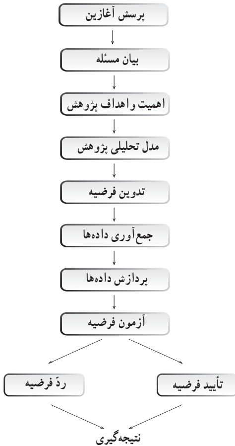
شکل ۲- مراحل یک پژوهش علمی جغرافیایی

به این نمودار که مراحل یک پژوهش علمی جغرافیایی را نشان می‌دهد، توجه کنید.