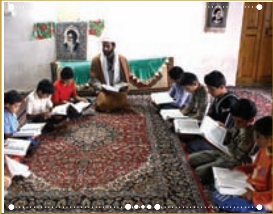
انسان با قرآن کریم در استان فارس، شهرستان داراب