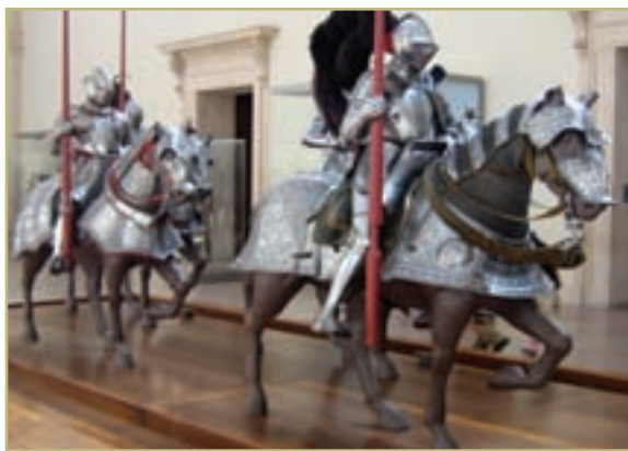
● جنگ های صلیبی

جهان غرب طی جنگ های صلیبی، پس از رویارویی با فرهنگ اسلامی، تحولاتی هویتی پیدا کرد. این جهان بار دیگر با عبور از عقاید و ارزش های مسیحیت قرون وسطی، به عقاید و ارزش های دنیوی و سکولار روی آورد و هویت جدیدی پیدا کرد.