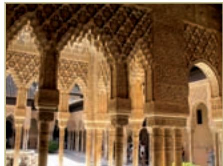
● قصر الحمرا / اندلس / یادگار دوران حکومت مسلمانان در اسپانیا