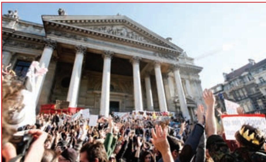
● اعتراض‌های مردمی در ایتالیا