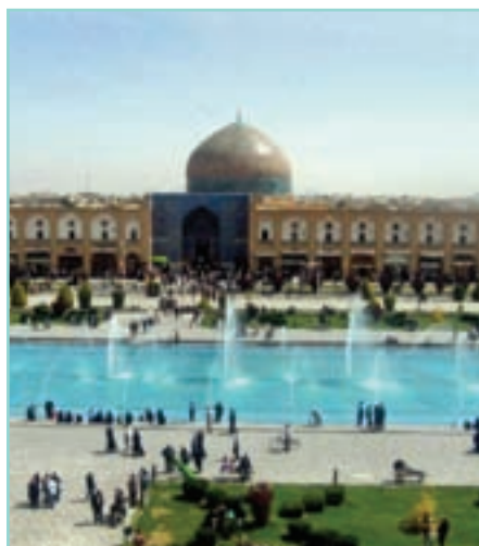
• میدان نقش جهان / اصفهان

بخش‌های مختلف جهان اسلام و از جمله ایران در تاریخ اسلامی خود با هجوم‌های نظامی و سیاسی اقوام مختلف مواجه شده است. فرهنگ اسلامی در طی سده‌های مختلف یا مانند آنچه در جنگ‌های صلیبی گذشت، به دفع مهاجمان پرداخت یا مانند آنچه در حمله مغول رخ داد، مهاجمان را درون خود جذب و هضم کرد. برخورد جهان غرب با جهان اسلام تجربهٔ جدیدی است که هنوز به پایان خود نرسیده است. قدرت سیاسی و نظامی غرب در نخستین رویارویی‌ها، بخش‌هایی از ذهنیت مسلمانان