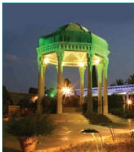
• مزار حافظ / شیراز