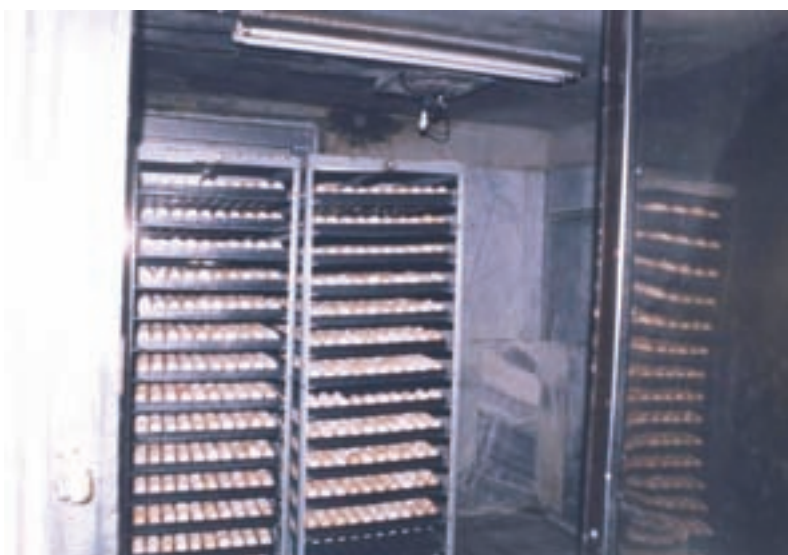
تصویر ۲-۳- تخم مرغ‌ها در اتاق دود

مقادیر فرمالین و پرمنگنات پتاسیم ذکر شده در جدول برای ۲/۸ متر مکعب فضاست.