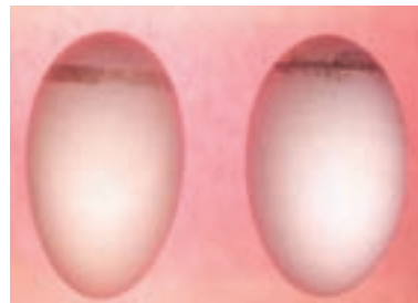
تصویر ۴-۳- تأثیر پرمنگنات زیاد بر روی تخم مرغ

برخی آلودگی‌های میکروبی مربوط به قبل از ورود تخم مرغ به جوجه‌کشی است و مقابله با آن‌ها در جوجه‌کشی غیرممکن است. یکی از خطرناک‌ترین این آلودگی‌ها باکتری سالمونلاست. این باکتری می‌تواند در پوسته‌ی تخم مرغ نفوذ کند و در مراحل جوجه‌کشی با وجود ضدعفونی‌شدن باقی بماند و بیماری را در جوجه‌های تولیدشده ایجاد کند. به این لحاظ رعایت بهداشت تخم مرغ در گله‌ی مادر اهمیت زیادی دارد. تلاش کنید فاصله‌ی تخم‌گذاری تا جمع‌آوری تخم مرغ‌ها طولانی نشود. در سیستم‌های دستی، جمع‌آوری روزانه‌ی تخم مرغ‌ها را ۳ تا ۵ بار در فصل سرد و ۶ تا ۷ بار در فصل گرم اجرا کنید و یا از سیستم‌های جمع‌آوری اتوماتیک تخم مرغ استفاده کنید.