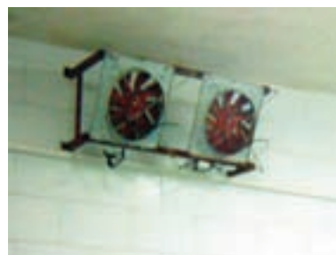
تصویر ۵-۳- ایجاد جریان هوا در اتاق دود