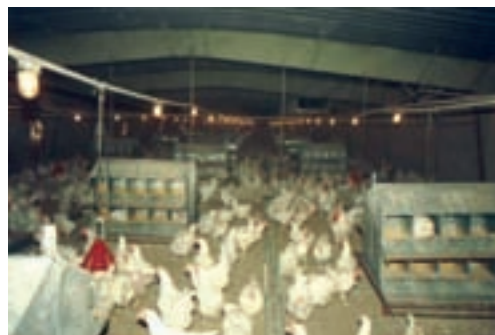
تصویر ۸-۳- استفاده از لانه‌ی مرغداری به تعداد کافی

این افراد برای ورود باید لباس خود را تعویض کنند و پس از گرفتن دوش و پوشیدن لباس کار، با چکمه‌های خود از داخل ماده‌ی ضدعفونی‌کننده عبور نمایند. کارکنان واحد جوجه‌کشی نباید در مرغداری‌ها شاغل باشند و یا در خانه‌ی خود از پرندنگه‌داری کنند. هم‌چنین برای رعایت بهداشت فردی باید به‌طور منظم به پزشک مراجعه کنند.