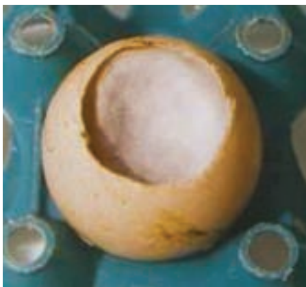
تصویر ۱-۳- آلودگی قارچی

بیماری‌ها و تلفات در چند روز اول، بعد از خروج جوجه از تخم مرغ، نیز اغلب با فساد باکتریایی ارتباط دارند. هم‌چنین فساد باکتریایی سبب کاهش میزان جوجه درآوری است. بنابراین، تخم مرغ‌های جوجه‌کشی که به شدت به میکرب‌ها آلوده‌اند، مشکلات زیادی در واحدهای جوجه‌کشی ایجاد می‌نمایند. از این رو لازم است در ابتدای ورود تخم مرغ‌ها به واحد جوجه‌کشی به اتاق‌های گاز انتقال یابند و ضدعفونی شوند.