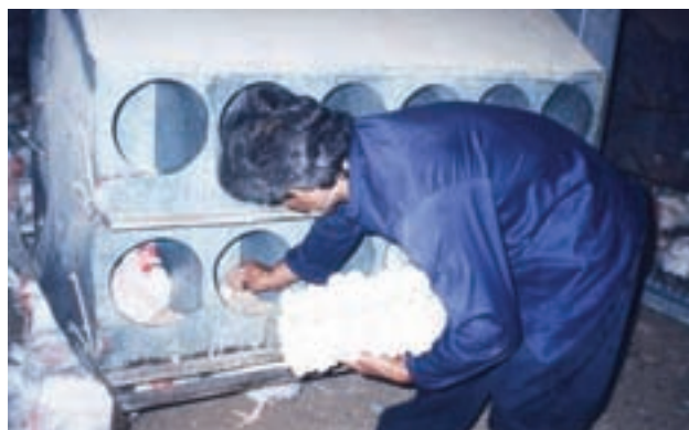
تصویر ۶-۳- جمع‌آوری دستی تخم مرغ