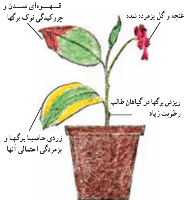
شکل ۱-۵۳ - علایم و خسارات کمبود در رطوبت نسبی هوا بر روی گیاهان آپارتمانی

– پاشیدن آب در هنگام عصر یا شب باعث می‌شود تا آب بر روی گیاه باقی بماند و تبخیر نشود و از تبادلات گیاه با محیط خارج جلوگیری کند.