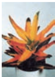
۲-۵ - ستاره طلا C.V gold Star (شکل ۳-۲-۴).