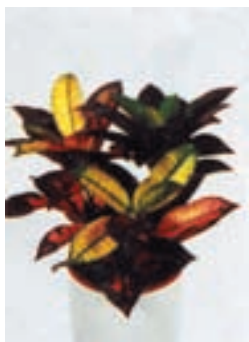
۲-۶ - اکتون C.V Mrs. Iceton (شکل ۳-۲-۵).