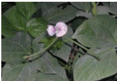
لوبیا چشم بلبلی

حبوبات : گیاهانی از تیره نخود هستند که به منظور تولید دانه کشت می شوند. این نوع گیاهان از نظر پروتئین غنی بوده و به مصرف تغذیه‌ی انسان و دام می‌رسند گونه‌های آن عبارتند از : نخود، لوبیا، ماش، عدس، باقلا، بادام زمینی، سویا، لوبیا چشم بلبلی، نخود فرنگی و... (شکل ۲-۲).