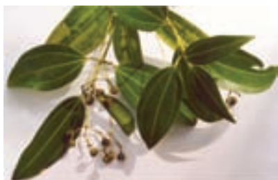
برگ و گل دارچین

گیاهان دارویی، تدخینی، ادویه ای: گیاهانی از تیره های مختلف هستند که به منظور استفاده از برخی مواد و ترکیبات آن ها در تهیه دارو، دخانیات یا استفاده از عطر و رنگ و طعم آن ها به عنوان ادویه کشت می شوند، مانند: توتون، خشخاش، خردل، زعفران، دارچین، زردچوبه، هل، گاوزبان، سنبل الطیب و غیره (شکل ۷-۲).