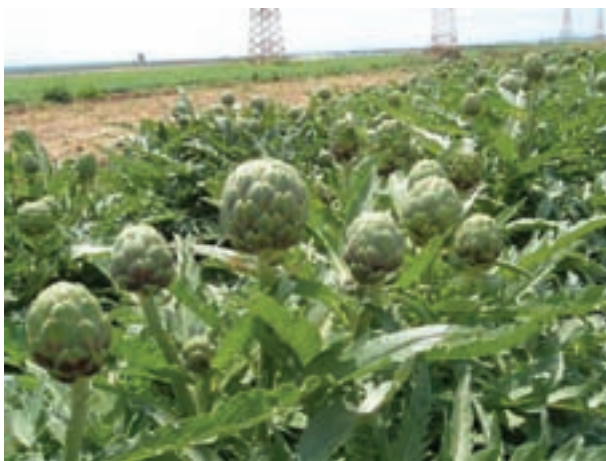
شکل ۹-۲- کنگر فرنگی