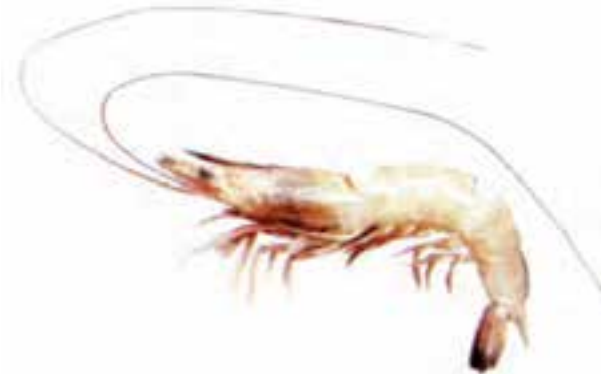
شکل ۵-۶- میگوی سفید

۴- میگوی سفید یا سرتیز: رنگ بدن این میگوها سبز تا سفید یا صورتی روشن و گاهی متمایل به قهوه‌ای است. همانند سایر گونه‌های پرورشی، ماده‌ها از نرها بزرگ‌ترند. حداکثر طول ماده‌ها ۱۹ و نرها ۱۵ سانتی‌متر است. در سراسر مناطق خلیج فارس و دریای عمان حضور دارند. ارزش اقتصادی آن در ایران از سایر گونه‌های ذکر شده کمتر است ولی یکی از گونه‌های مهم اقتصادی استان خوزستان به‌شمار می‌رود.