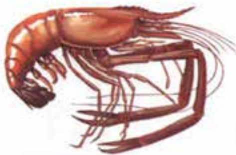
الف - شاه میگوی قرمز