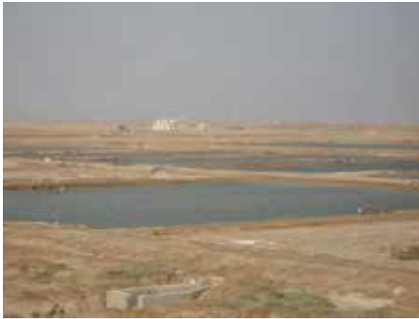
شکل ۸-۶- استخر پرورش میگو

استخرهای میگو از جنس خاکند و عملیات ساخت آن‌ها با توجه به نوع گونه، شرایط اقلیمی و امکانات موجود صورت می‌گیرد. از آن‌جا که میگو کف‌زی است و از بستر استخر برای زیست استفاده می‌کند. این استخرها به گونه‌ای طراحی می‌شوند که حائز بیشترین وسعت بستر باشند. مساحت استخرهای پرورش میگو معمولاً یک هکتار در نظر گرفته می‌شود.