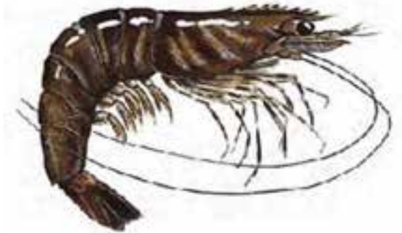
شکل ۴-۶- میگوی ببری سبز

۳- میگوی ببری سبز: این گونه دارای بدنی دراز و کم و بیش خمیده است. رنگ بدن کرم زرد تا نارنجی با نوارهای عرضی قهوه‌ای ارغوانی روی ناحیه شکم است. طول آن در نرها حداکثر ۱۸ و در ماده‌ها ۲۳ سانتی‌متر است. وزن آن‌ها به ۱۳۰ گرم می‌رسند. این میگو در میان ساحل نشینان جنوب کشورمان به نام میگوی صورتی که برگرفته از رنگ صورتی آن پس از انجماد است شهرت دارد. یکی از صیدگاه‌های اصلی آن در استان هرمزگان، اطراف جزیره لارک می‌باشد. بیشترین صید استان بوشهر را این میگو تشکیل می‌دهد.