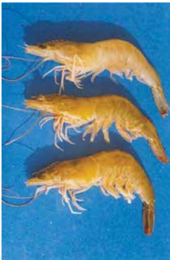
شکل ۶-۶- میگوی وانامی

گونه جدیدی که محققین شیلات کشورمان به صنعت تکثیر و پرورش میگوی ایران معرفی کرده‌اند میگوی پافسفید یا وانامی ۱ نام دارد. این گونه بومی سواحل غربی آمریکای لاتین است. از مزایای آن می‌توان مقاومت به شوری، سرما و بیماری را نام برد و همچنین بالاترین رشد را در میان سایر گونه‌های پرورشی دارد.