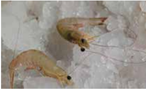
شکل ۲-۶- میگوی سفید هندی

برای شناخت بیشتر هریک از گونه‌های نام برده شده در زیر به بررسی آن‌ها می‌پردازیم. ۱- میگوی سفید هندی: این میگو به رنگ زرد کم‌رنگ مایل به سفید و خال‌های آبی پراکنده، پاهای قرمز رنگ می‌باشد میانگین طول ماده‌ها ۱۲ تا ۱۷ سانتی‌متر و وزن ۳۰ تا ۳۵ گرم و نرها ۱۱ تا ۱۳ سانتی‌متر و وزن ۲۵ تا ۳۰ گرم می‌باشد. بیشترین تراکم این گونه در ایران در محدوده شهرستان جاسک می‌باشد. در حال حاضر تنها گونه پرورشی دریایی است.