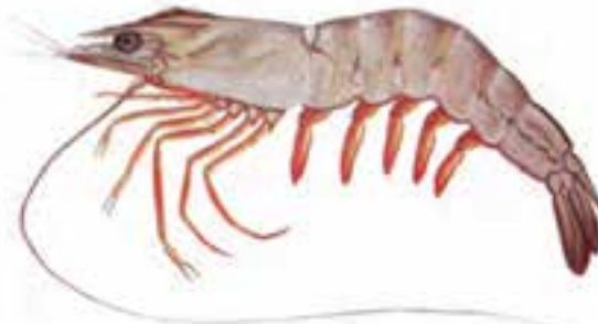
شکل ۳-۶- میگوی موزی

طول این گونه هنگام بلوغ در مناطق مختلف از ۱۲/۵ تا ۱۵ سانتی‌متر متغیر است پراکنش آن در ایران معمولاً همراه با میگوی سفید هندی است و در حوضه استان هرمزگان مهم‌ترین گونه صیادی محسوب می‌شود. گسترش کلی آن در دریای عمان و خلیج فارس است و یکی از مهم‌ترین و گران‌ترین میگوهای خوراکی است.