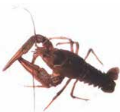
ب - خرچنگ دراز آب شیرین