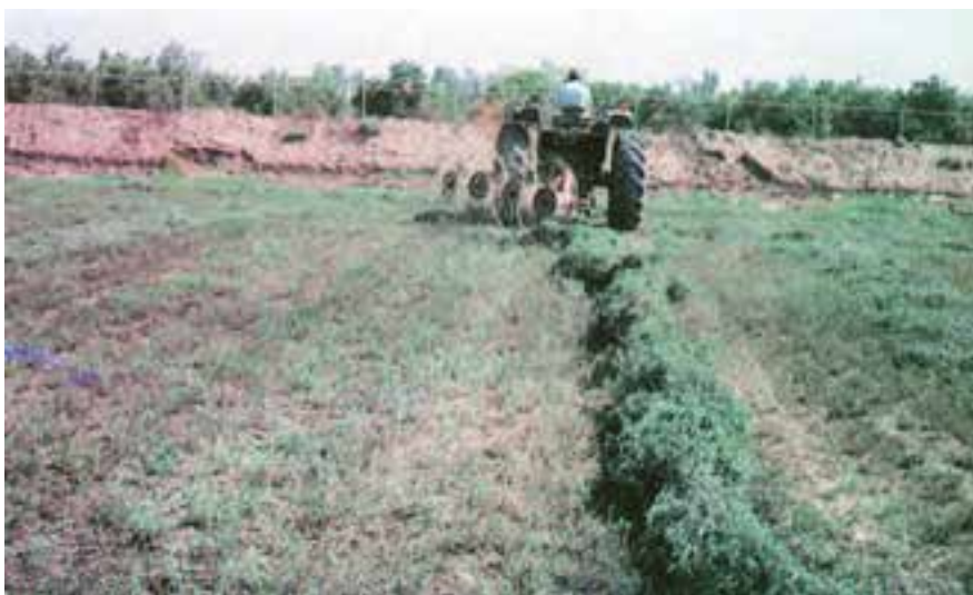
شکل ۷-۲- عملیات ردیف کردن یونجه (ریک)

حدود ۱۲-۲۴ ساعت بعد، یونجه‌های ردیف شده به وسیله‌ی دستگاه دنباله‌بند دیگری به نام بیلر (دستگاه بسته‌بند) بسته‌بندی می‌شود (شکل ۸-۲).