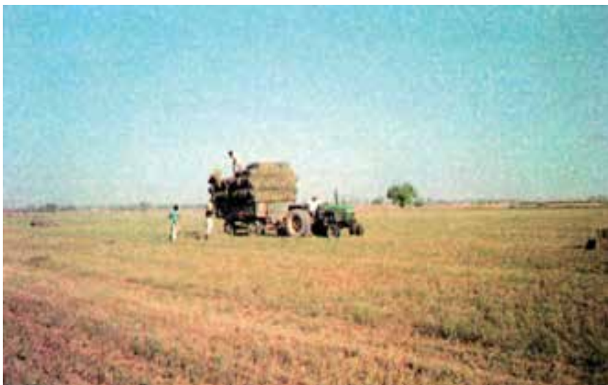
شکل ۹-۲- جمع آوری و انتقال بسته‌ها