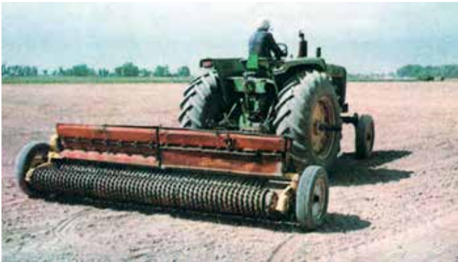
شکل ۴-۲- عملیات بذرکاری با بذرکار مخصوص (علوفه‌کار)

کاشت یونجه معمولاً به دو صورت دستی یا با ماشین انجام می‌شود. در کشت دستی که معمولاً در زمین‌های با سطح کوچک کاربرد دارد یونجه را به صورت کرتی کشت می‌کنند. در این روش عملیات داشت و برداشت نیز به ناچار با دست انجام می‌گیرد. کاشت با ماشین‌های بذرکار: این روش معمولاً در زراعت‌های بزرگ عملی می‌باشد. بعد از عملیات آماده‌سازی زمین با استفاده از ماشین‌های بذرکار مخصوص به کاشت اقدام می‌گردد (شکل ۴-۲).