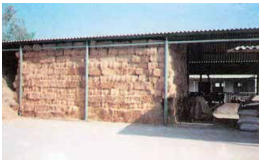
شکل ۱۰-۲- نحوه‌ی نگهداری بسته‌ها در فضای سرپوشیده