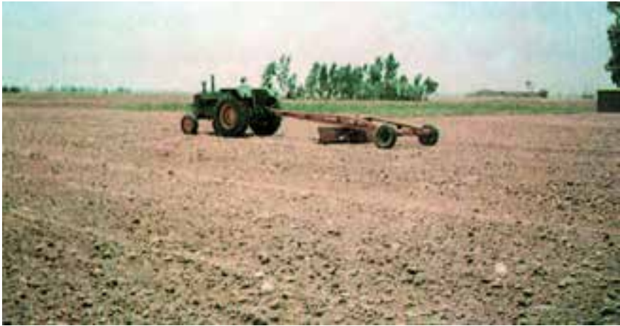
شکل ۲-۳- تسطیح کردن زمین توسط زمین صاف‌کن (لندلولر)