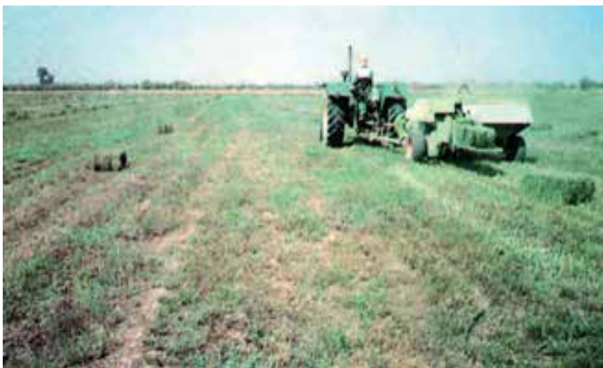
شکل ۸-۲- عملیات بسته‌بندی یونجه با دستگاه بیلر