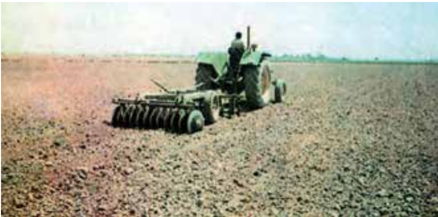
شکل ۲-۲- عملیات دیسک زدن در زراعت یونجه

۱- آماده‌سازی فیزیکی: در آماده‌سازی فیزیکی خاک یونجه، باید دقت زیادی به عمل آورد. زمین یونجه باید یکنواخت، پوک، با ماده‌ی آلی کافی حداقل ۱/۵ درصد و عاری از علف‌های هرز باشد. در موقع تهیه‌ی زمین، باید به شیب زمین و امتداد نه‌رهای آبیاری و زهکشی و هم‌چنین روش آبیاری توجه زیادی داشته باشیم. برای ایجاد تخلخل کافی در خاک، در پاییز حداقل یک ماه قبل از کاشت پس از مصرف حدود ۳۰ تن کود دامی شخم عمیق زده می‌شود. سپس اقدام به نرم و هموار کردن خاک و گاهی فشرده کردن لایه ۲-۳ سانتی متر سطح خاک جهت اتصال بهتر بذور با خاک می‌نمایند. در صورتی که ماده‌ی آلی خاک بالا باشد و خطر سله مطرح نباشد، اجرای اتیواتور نیز مناسب است. در کاشت بهاره به منظور نرم کردن سطح خاک و از بین بردن علف‌های هرزی که ممکن است رویده شده باشند می‌توان از کولتیواتور هم استفاده کرد. شکل‌های ۲-۲ و ۲-۳ عملیات آماده‌سازی فیزیکی خاک را در زراعت یونجه نشان می‌دهند.