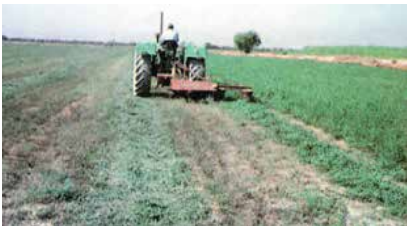
شکل ۵-۲- عملیات برش یونجه با دستگاه موور

قدآره) صورت می‌گیرد. این روش با توجه به میزان کارکرد یک نفر کارگر در روز و میزان دستمزد روزانه، در اراضی وسیع مقرون به صرفه نیست. در مزارع بزرگ از ماشین‌آلات خاصی برای درو استفاده می‌شود. ابتدا به وسیله‌ی ماشین دنباله بند دروگر یا موور (شکل ۵-۲) یونجه بریده می‌شود و پس از ۲۴-۴۸ ساعت - بسته به فصل و شرایط آب و هوایی منطقه - مقداری از آب خود را از دست می‌دهد. برای درو یونجه از ماشین خودگردانی به نام سواتر نیز استفاده می‌کنند (شکل ۶-۲).