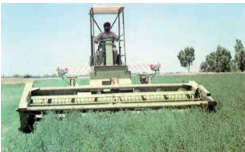
شکل ۶-۲- برداشت یونجه به وسیله‌ی دستگاه سواتر