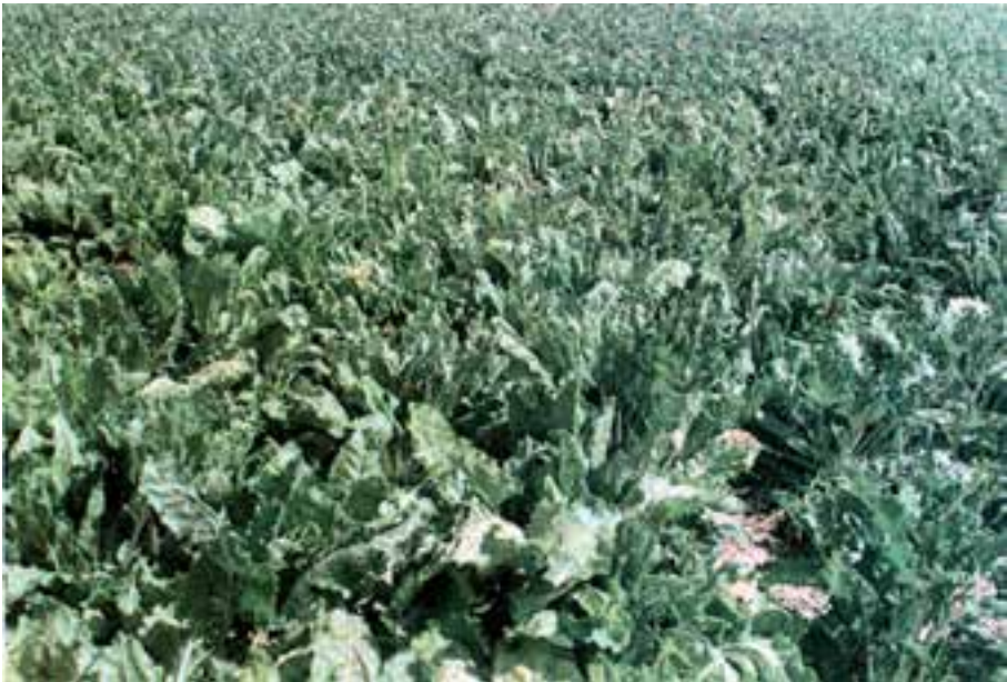
شکل ۳-۳- زمان برداشت مزرعه‌ی چغندر قند

چغندر قند جزو آن دسته از محصولات کشاورزی است که کیفیت آن دقیقاً قابل اندازه‌گیری می‌باشد. تعیین بهترین زمان رسیدن چغندر قند و برداشت آن در عملکرد و استحصال شکر سفید تأثیر فراوانی دارد و هزینه‌های تولید را در کارخانه کاهش می‌دهد. رسیدگی فیزیولوژیکی در چغندر قند وجود ندارد بلکه، رسیدگی تکنولوژیکی ۱ مورد نظر است. زمان رسیدن چغندر قند تابع عوامل زیادی است که مهم‌ترین آن‌ها نوع بذر، طول فصل یا سال زراعی، دما، حرارت محیط (بخصوص در آخر دوره‌ی رشد)، میزان مصرف کودهای شیمیایی (خصوصاً کودهای ازته) و عملیات داشت می‌باشد. به استثنای خوزستان در بقیه‌ی نقاط کشورمان با توجه به تاریخ کاشت و عوامل مؤثر دیگر، زمان رسیدگی تکنولوژیکی چغندر قند از اواسط مهرماه تا اواخر آذر متفاوت است. تا زمانی که دمای هوا به کمتر از 4^{\circ}\text{C} نرسیده باشد، چغندر قند به ذخیره سازی قند و افزایش وزن خود، ادامه خواهد داد. علائم ظاهری رسیدن چغندر قند با زرد شدن برگ‌های مسن، کُند شدن رشد برگ‌های مرکزی بوته نمایان می‌شود (شکل ۳-۳).