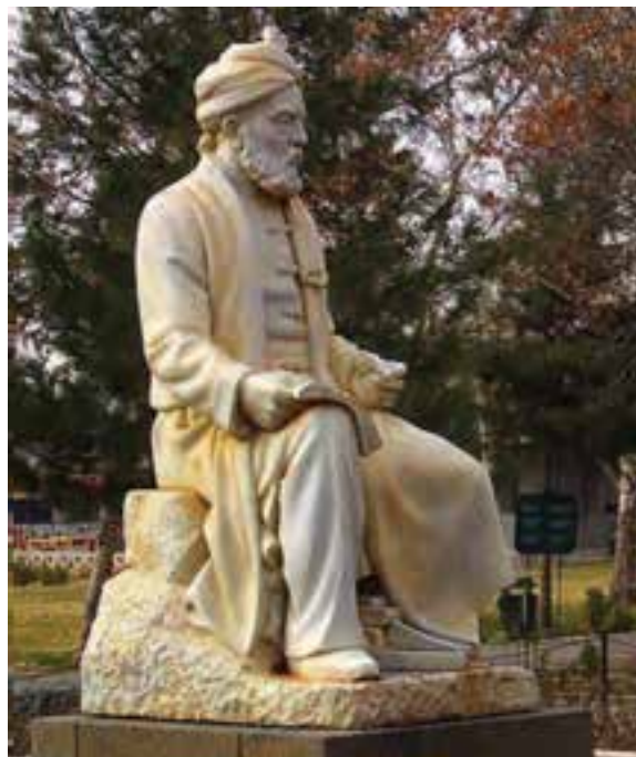
شکل ۱-۴- فردوسی شاعر حماسه سرای ایران

اگر ادبیات و زبان باستانی در ایران مورد بررسی قرار گیرد، بی‌شک بخش عمده آن ریشه در خراسان بزرگ دارد. خط و زبان پهلوی متعلق به عصر اشکانیان و آنان نیز منتسب به خراسان هستند. از اواخر دوره ساسانی و سده‌های پس از اسلام، خراسان محل ظهور زبان دری گردید. امروزه هرگاه از فارسی دری سخنی به میان می‌آید، منظور زبان مردم خراسان است. خراسان در گستره فرهنگ و تمدن ایران اسلامی پرچم دار انتقال فرهنگ و تمدن بین شرق و غرب بوده است. وجود فرق و اندیشه‌های مختلف در خراسان، زمینه پیدایش علوم اسلامی و گسترش مراکز علمی و دینی را به وجود آورد.