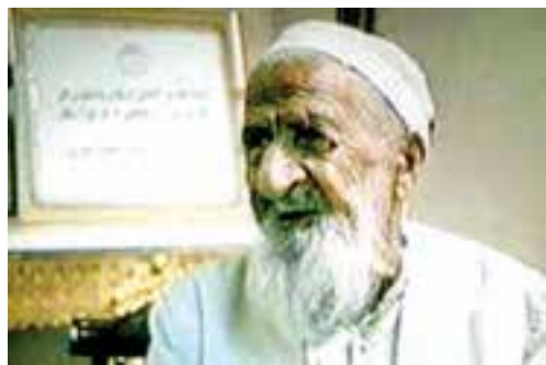
شیخ بهلول گنابادی

با تشکیل دولت صفویه و رسمیت دادن به مذهب شیعه آنها به خراسان و مشهد توجه خاصی نشان دادند. دولت صفویه در تاریخ به دلیل برقراری امنیت، توسعه اقتصادی و وحدت سیاسی در ایران از جایگاه خاصی برخوردار است. پس از سقوط صفویه توسط محمود افغان، نادر شاه افشار از خراسان (منطقه درگز و ایبورد) قیام کرد و با شکست دادن افغان‌ها یک بار دیگر اقتدار ایران را بازگرداند. نادر مدتی مشهد را به عنوان پایتخت خود برگزید. در دوره زندگی مشهد و خراسان همچنان در دست نوادگان نادر باقی ماند و سرانجام آقا محمدخان قاجار بساط دولت نادری را در مشهد برچید. در دوره قاجاریه بخش‌های مهمی از خراسان بزرگ از ایران جدا شد.