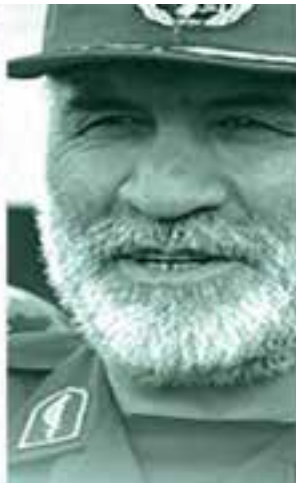
شهید نورعلی شوشتری - جانشین نیروی زمینی سپاه