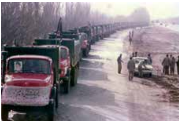
شکل ۱۶-۴- ارسال کمک‌های مردمی به جبهه توسط جهادسازندگی خراسان

همچنین ستادهای پشتیبانی جنگ جهاد به همراه ستادهای پشتیبانی هلال احمر و سپاه پاسداران انقلاب اسلامی مسئولیت جمع‌آوری، ساماندهی و ارسال کمک‌های مردمی و اعزام امدادگران داوطلب به جبهه‌ها را برعهده داشتند.