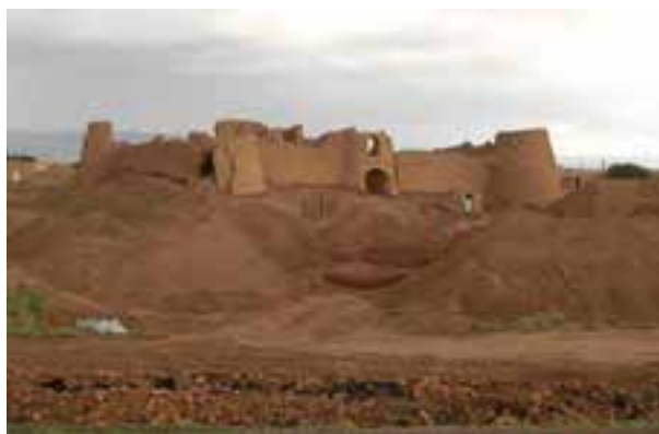
شکل ۸-۴ — قلعه سربداران — باشتین سبزوار