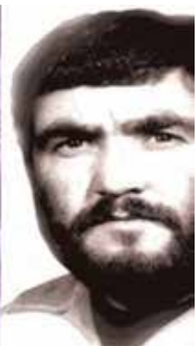
شهید محمد بابارستمی - مسئول عملیات سپاه خراسان