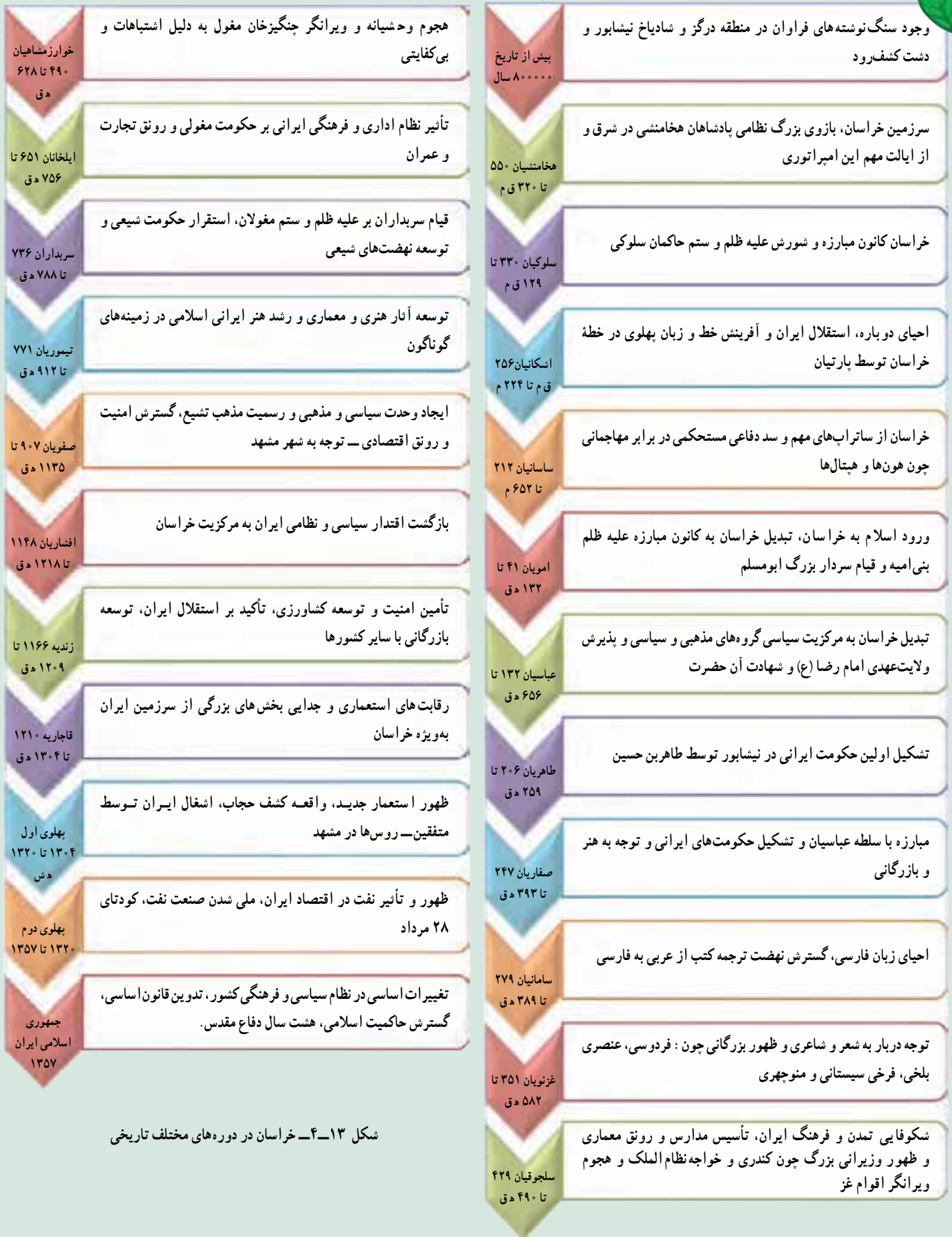
شکل ۱۳-۴ خراسان در دوره‌های مختلف تاریخی