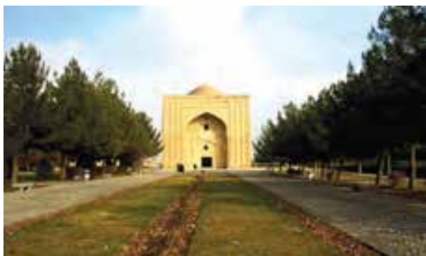
شکل ۴-۵ - هارونیه - توس

خراسان پس از ورود اسلام به ایران : استقرار حاکمان اموی در خراسان و سخت گیری و ظلم آنان در منطقه خراسان و مهاجرت و فرار گروه های سیاسی - مذهبی مخالف حکومت اموی؛ خراسان را به کانون مبارزه علیه دولت بنی امیه تبدیل کرد. سرانجام از میان این مخالفین، سردار معروف خراسانی ابومسلم قد برافراشته و حکومت بنی امیه را از بین برد و قدرت به عباسیان رسید.