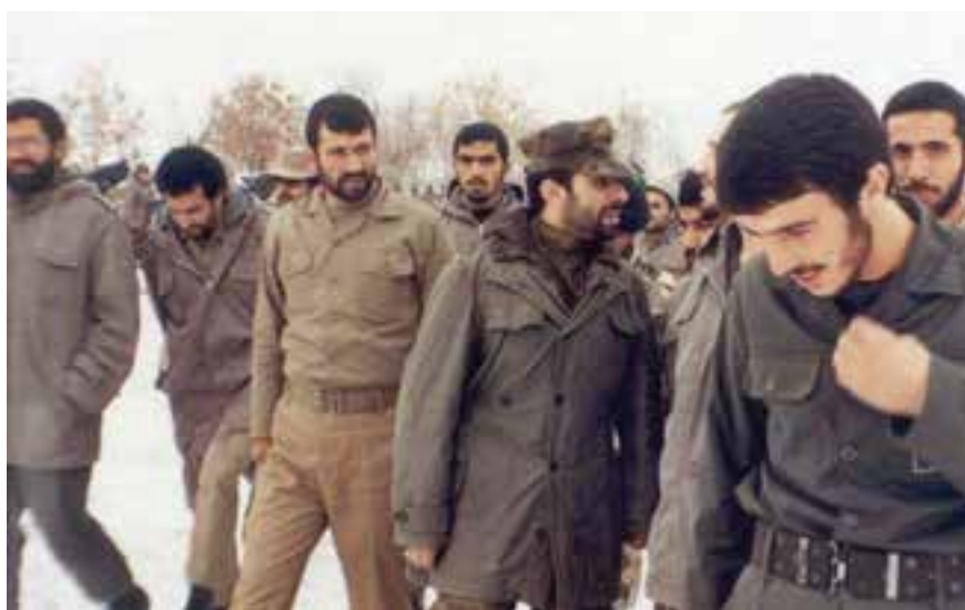
شکل ۱۴-۴- سردار سرلشکر شهید محمود کاوه و امیر شهید سپهبد علی صیاد شیرازی در مناطق عملیاتی

لشکر پنج نصر، لشکر ویژه شهدا، تیپ ۲۱ امام رضا (علیه السلام) از مهم‌ترین یگان‌های سپاه پاسداران انقلاب اسلامی بودند که در عملیات‌های متعددی چون طریق القدس، کربلای ۵، والفجر ۸ و جزابه و... رشادت‌های زیادی نشان دادند. و سند افتخار مقاومت مردم ایران در برابر هجمه همه جانبه دشمن بعثی را رقم زدند.