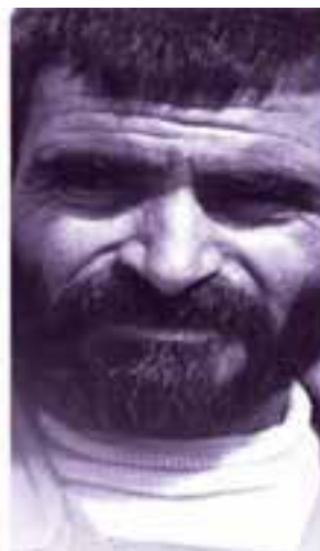
شهید عبدالحسین برونسی - فرمانده تیپ ۸ جوادالائمه (ع)