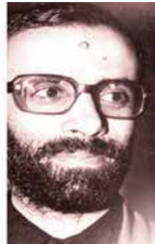
شهید یوسف کلاهدوز - جانشین فرماندهی کل سپاه