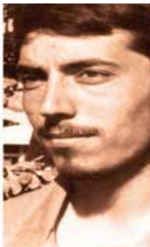
شهید ولی اله چراغچی مسجدی - جانشین لشکر ۵ نصر