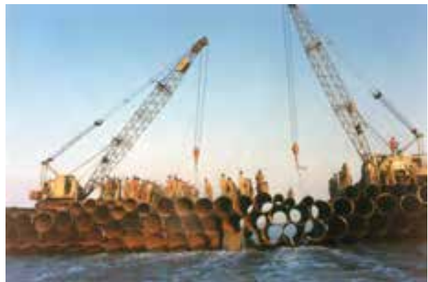
شکل ۱۵-۴- پل بعثت در داخل اروند رود «سند افتخار نیروهای مهندسی رزمی جهادسازندگی خراسان»