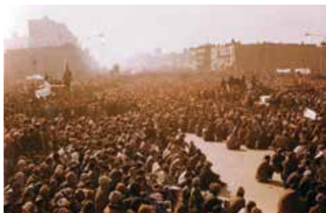
شکل ۱۲-۴- تظاهرات مردم مشهد در سال ۱۳۵۷

مردم مسلمان و انقلابی این استان در دوره حکومت پهلوی در کنار روحانیت و دیگر انقلابیون به مخالفت با اقدامات استبدادی و ضد مذهبی رژیم پرداختند. مبارزات مردم مشهد در دوره رضاشاه و واقعه کشف حجاب زیانزد همگان است.