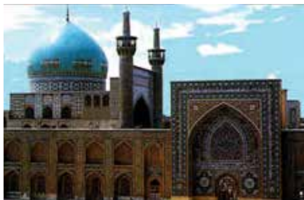
شکل ۹-۴ — مسجد جامع گوهر شاد — مشهد

سربداران: در سال ۷۳۷ ه.ق امیر عبدالرزاق از مردان ظلم‌ستیز منطقه سبزوار، در قریه باشتین علیه حکام مغولی قیامی را آغاز کرد و موفق به تشکیل دولت شیعی مذهب به نام سربداران در سبزوار و بخشی از خراسان گردیدند. پس از سقوط دولت سربداران روند نفوذ و گسترش مذهب شیعه در بخش‌هایی از خراسان همچنان تداوم یافت. پس از مدتی در سال ۷۸۱ ه.ق خراسان بار دیگر مورد حملات ویرانگر تیمور واقع شد، اما نوادگان او تسلیم فرهنگ اسلامی— ایرانی شده و با تأسیس دولت تیموریان (به ویژه در خراسان) عامل ایجاد آثار هنری و معماری ماندگاری شدند.