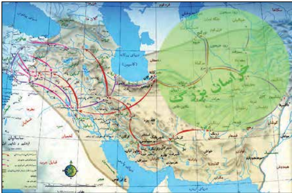
شکل ۲-۴- حدود پارتیا (خراسان بزرگ) در دوران باستان