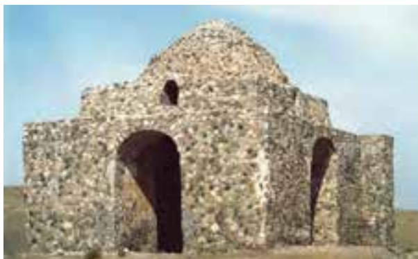
شکل ۴-۴ - چهار طاقی بازه هور در دوره ساسانیان