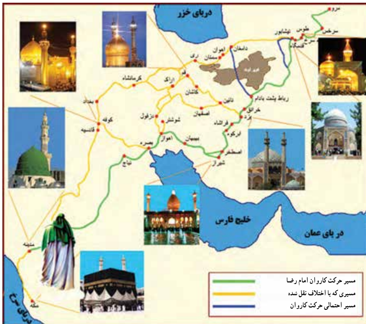
شکل ۱۱-۴- مسیر حرکت امام رضا (ع) از مدینه به مرو