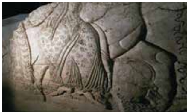
شکل ۴-۳ - مجموعه آثار بندیان دوره ساسانیان - درگز