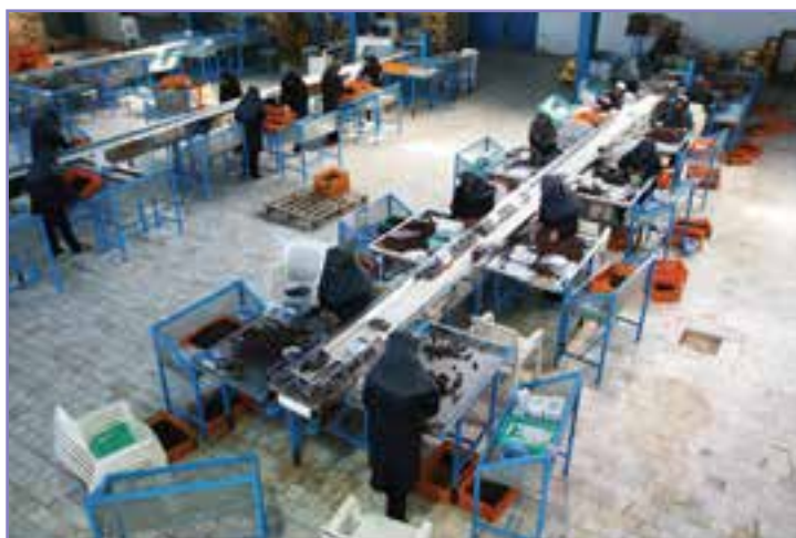
شکل ۴۵- کارگاه بسته‌بندی و فرآوری خرما