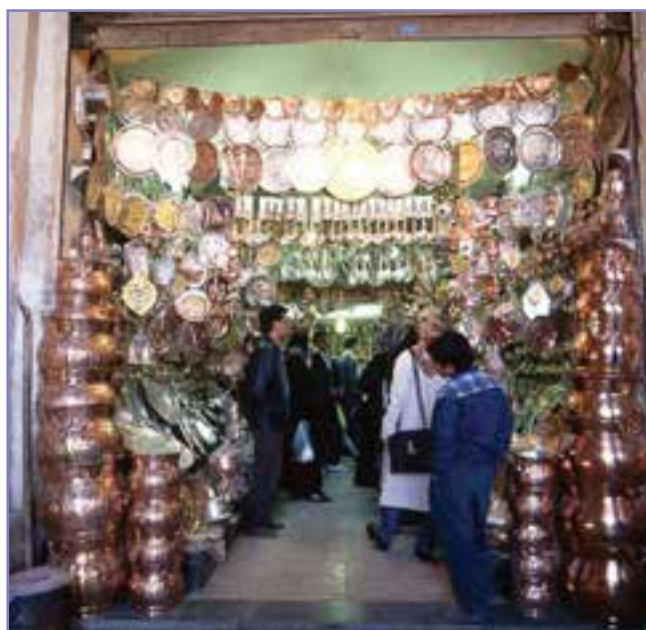
شکل ۲۸- ظروف مسی صنایع دستی کرمان