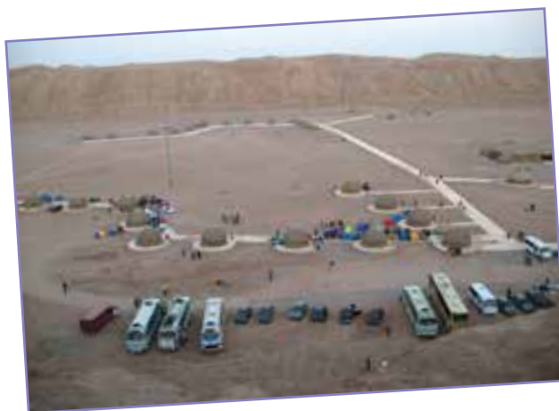
شکل ۵- کمپ کویری لوت شهید