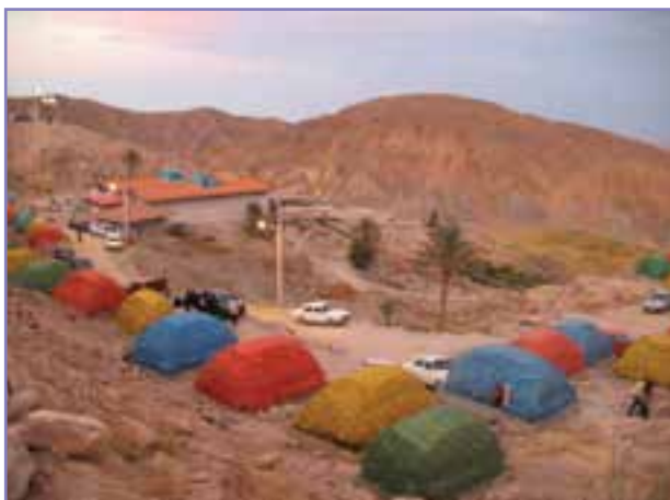
شکل ۸- ۵- آب گرم چوشان