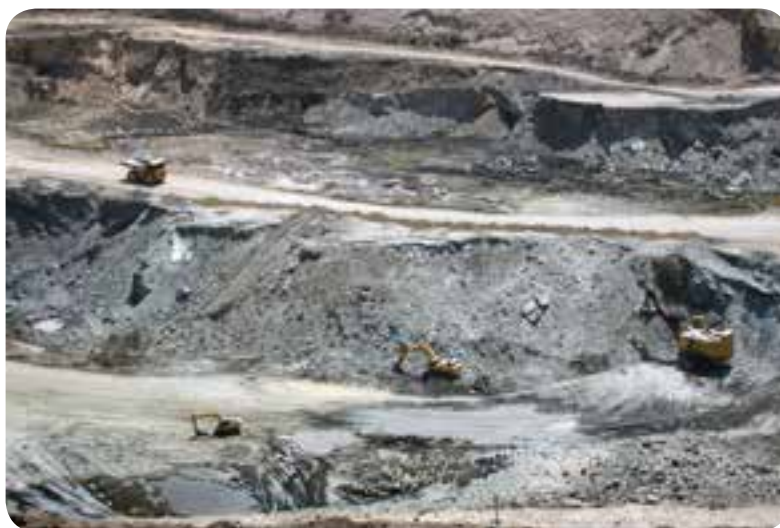
شکل ۴۲- معدن آهن گل گهر سیرجان

و آهن را نازل کردیم که در آن نیروی شدید و منافی برای مردم است