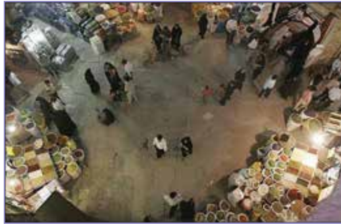
شکل ۲۹-۵- چهار سوق بازار کرمان