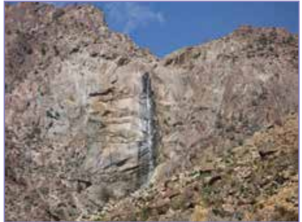
شکل ۹-۵- آبشار وُروار (رود فرق) عنبرآباد