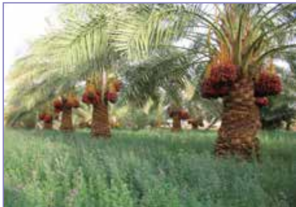
شکل ۳۵-۵- باغات خرماهای پرم