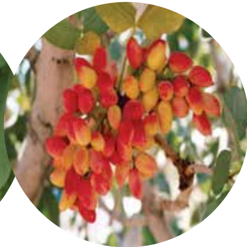
شکل ۳۸-۵- محصول پسته رفسنجان