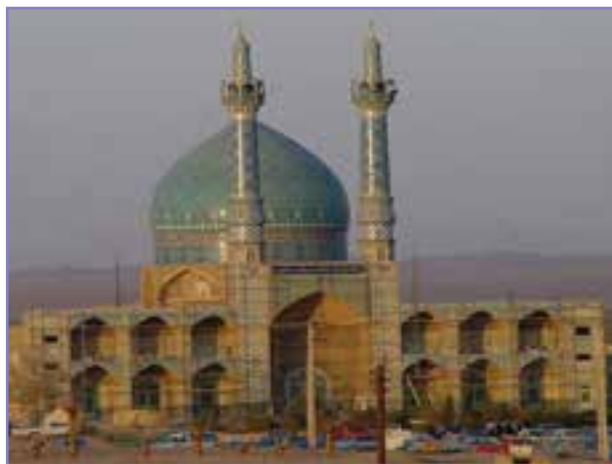
شکل ۲۱-۵- پارگاه امامزاده صالح علیه السلام شهر انار