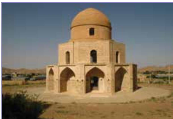
شکل ۱۹- گنبد اخوند (آرامگاه محمد شهید کوهپناهی)