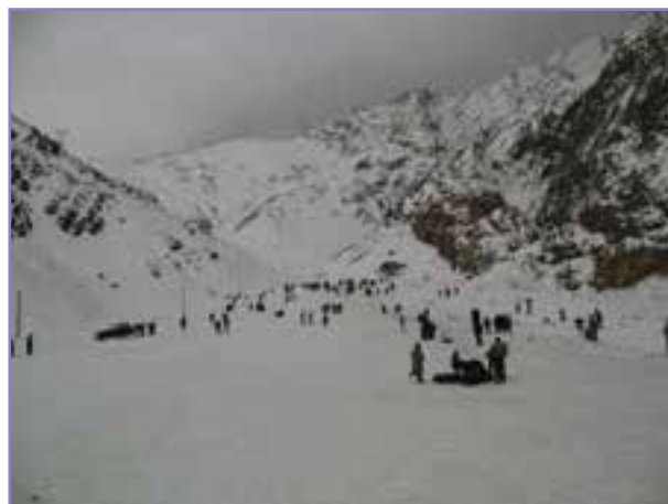
شکل ۷- ۵- پهنیت اسکی سپهرچ