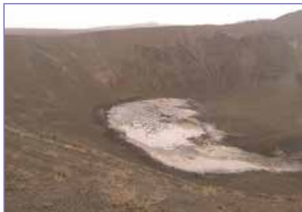
شکل ۱۳-۵- دهانه آتشفشان خاموش قلعه حسنعلی راین