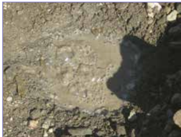
شکل ۳- گاز فشان کت پاد