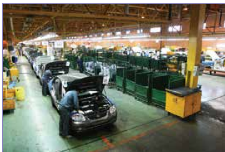
شکل ۴۶- خودرو سازی گرمان موتور