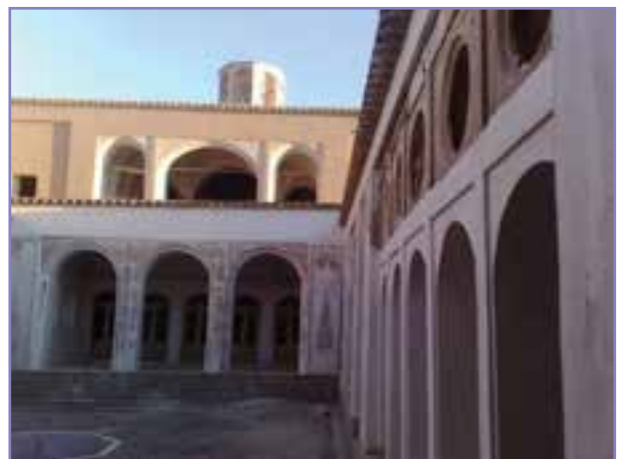
شکل ۳۲-۵- خانه تاریخی حاج آقا علی رفسنجان