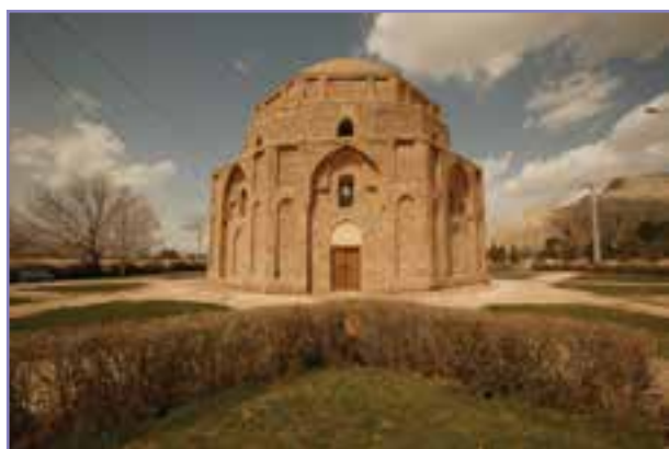
شکل ۲۷- گنبد جبلیه کرمان