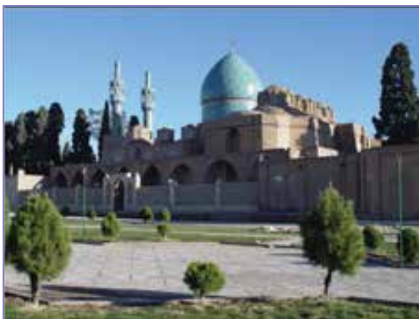
شکل ۱۶- مقبره شاه نعمت الله ولی ماهان