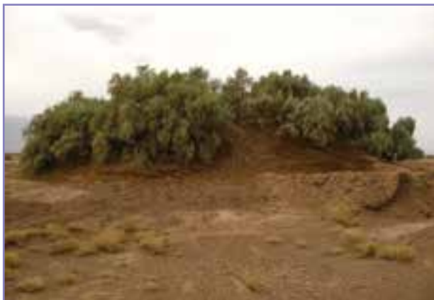
شکل ۶- نپگاهای شهید