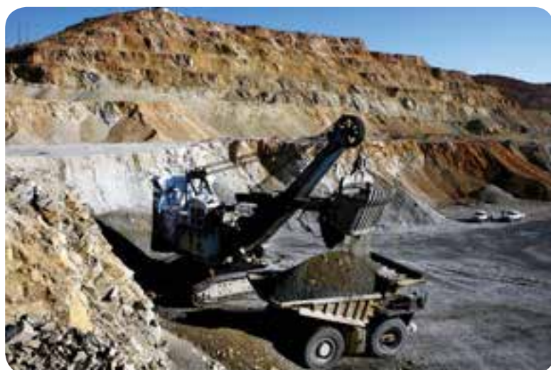
شکل ۴۳- معدن مس سرچشمه