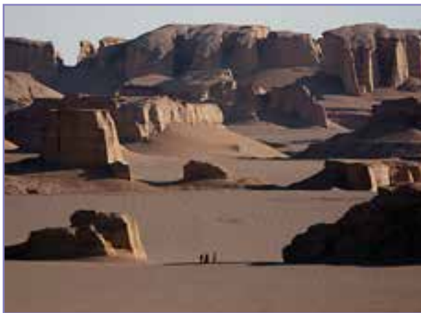
شکل ۴- گلوت‌های دشت لوت منطقه شهید