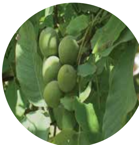
شکل ۳۷-۵- محصول گردوی خوشه‌ای استان

وجود افتخاراتی چون رتبه اول سطح زیر کشت گردو کشور، رتبه اول سطح زیر کشت و تولید محصولات گلخانه‌ای و وجود منطقه جیرفت و کهنوج با امکان تولید محصول در تمام فصول سال، رتبه اول تولید خرما در کشور، رتبه سوم تولید مرکبات، کسب حداکثر عملکرد ۱۳/۹ تن در هکتار پسته، ۱۳/۸ تن گردو، ۲۷/۷ تن خرما، ۴۲ تن مرکبات، ۱۳ تن گندم، ۵۴ تن سیب زمینی در هکتار توسط کشاورزان نمونه از موفقیت‌های دیگر استان، تماماً نشانه لطف خداوند منان و بیانگر سخت کوشی و توانمندی مردان و زنان این استان کویری است.