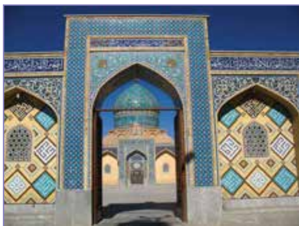
شکل ۱۷- پارکگاه امامزاده حسین علیه السلام چوپار