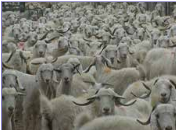
شکل ۴۱-۵- پرورش نژاد بز راہنی با گروک بسیار مرغوب

مساحت عرصه‌های طبیعی استان کرمان ۱۶/۲ میلیون هکتار (شامل ۱/۳ میلیون هکتار جنگل، ۸/۶ میلیون هکتار مرتع و ۶/۲ میلیون هکتار بیابان) است.