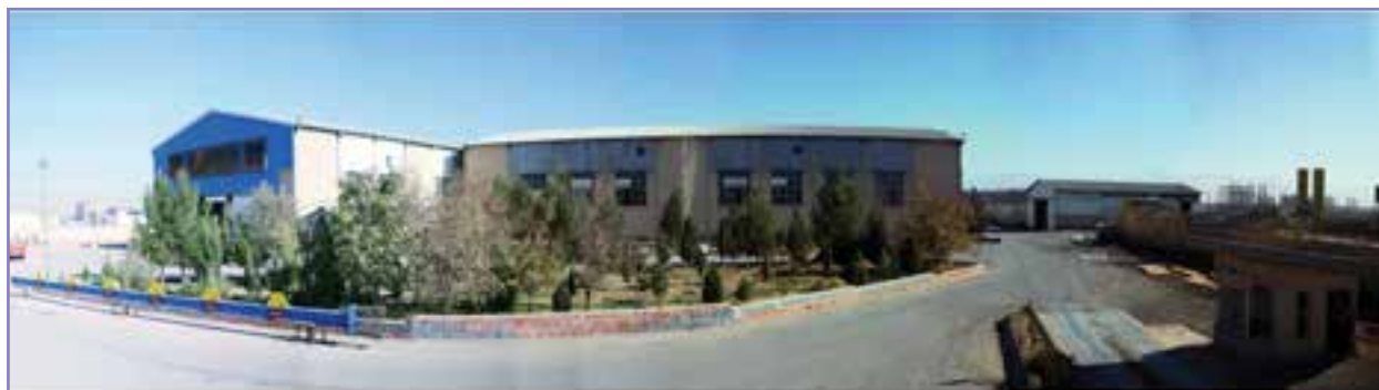
شکل ۴۴- کارخانه فولادسازی پردیس