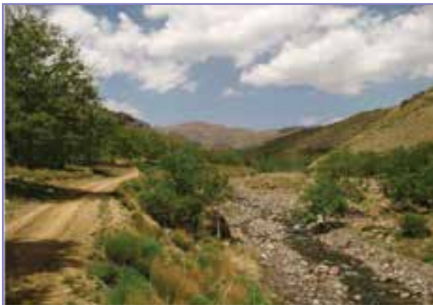
شکل ۱۲-۵- دره زیبا و سرسبز پناه خوان پردیسیر