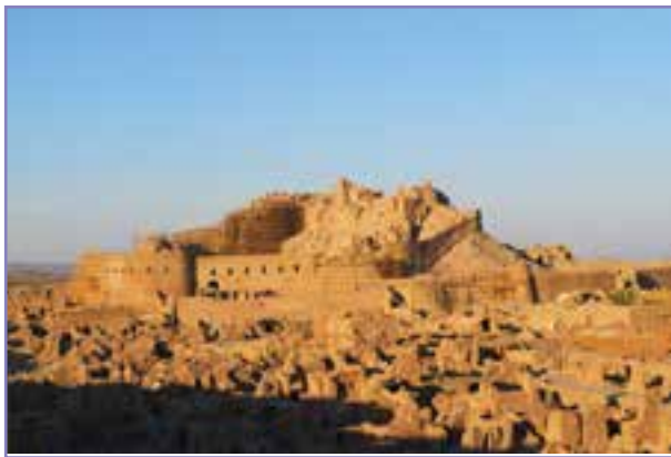
شکل ۳۱-۵- ارگ بم در حال بازسازی