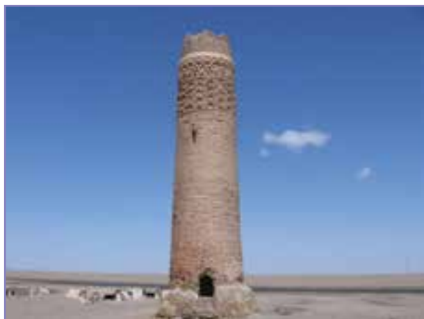
شکل ۲۵- میل فاوردی (نادر در فهرج)