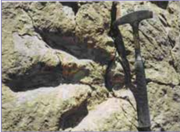
شکل ۱۰-۵- رد پای دایناسور دره نیزار شمال زرند