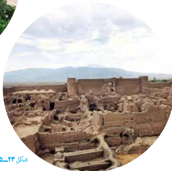
شکل ۲۳-۵- ارگ راین