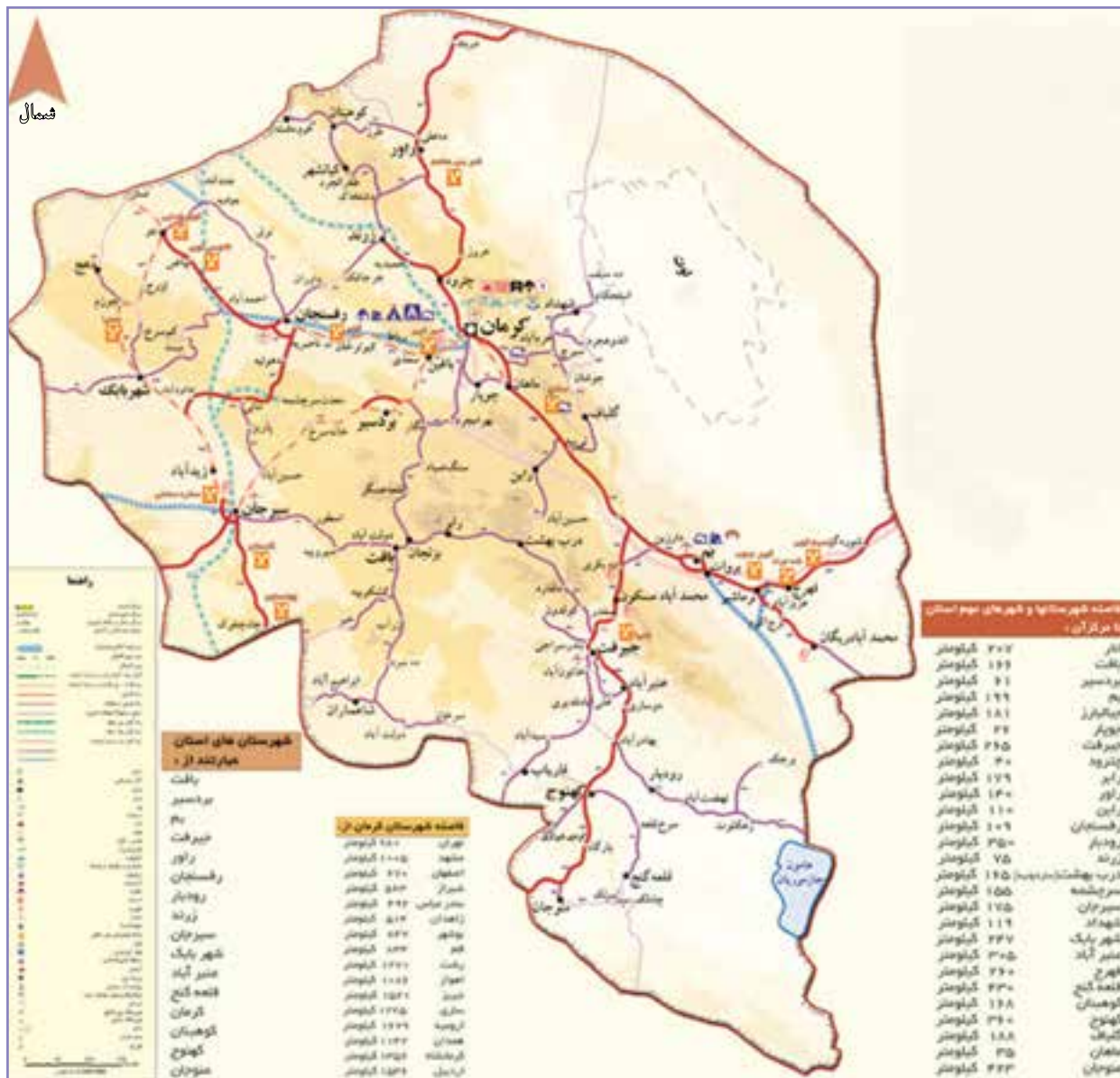
شکل ۳۶-۵ نقشه راه‌های استان کرمان