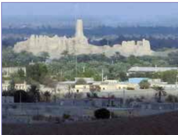
شکل ۳۳-۵- شهر منوجان و قلعه تاریخی آن