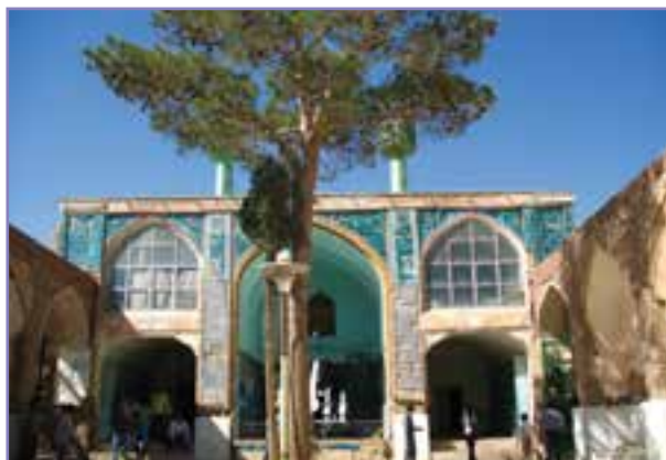
شکل ۱۸- آرامگاه امامزاده بی بی حیات (س) در نزدیکی خنمان