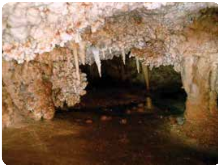
شکل ۲-۵-۵- غار میرزا در کوه‌های داوران رفسنجان

● غارها: غار طُرُنْگِ طویل‌ترین غار استان کرمان است که در حوالی روستای طُرُنْگِ شهرستان بافت است. غار ایوب غاری آتشفشانی است که بزرگ‌ترین دهانه غار در ایران است که در نزدیک دِهْجِ شهر بابک است. غار میرزا در کوه‌های داوران، غار یخ‌نیا در دامنه جنوبی کوه جوپار، غار جَفْرِیز در نزدیکی گوغَرِ بافت، غارشب پَره یا خفاش در کوه خَبَرِ بافت، غار شعیب در مارون جیرفت، غار کفتار و غار صفا در کوه‌های صاحب‌الزمان کرمان، غار مموشا در نزدیکی سیه بنوئیة رابُر از جمله غارهای مهم استان کرمان‌اند.