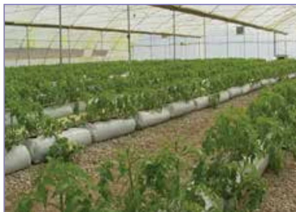
شکل ۳۶-۵- کشت محصولات گلخانه‌ای هیدروپونیک (بدون نیاز به خاک)