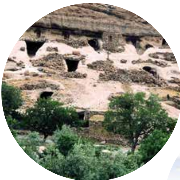
شکل ۲۲-۵- روسنگای صخره‌ای میمند شهر باک