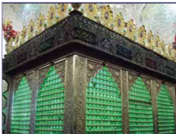
شکل ۱۴- امامزاده علی علیه السلام در شیراز