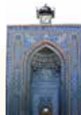
جدول ۳-۵- مهم ترین جاذبه های گردشگری استان کرمان