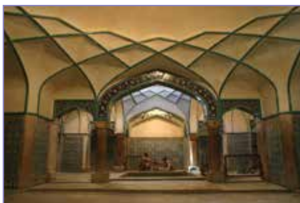
شکل ۲۸- حمام گنجعلی خان کرمان