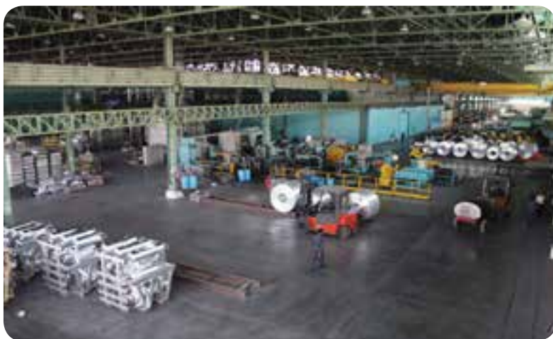
شکل ۴۷-۵- کارخانه آلومینیوم هزار کرمان

در کنار این ارقام، وجود چندین شهرک صنعتی در کرمان و شهرستان‌های دیگر چرخه عظیم فعالیت‌های اقتصادی استان را به گردش در آورده‌اند.