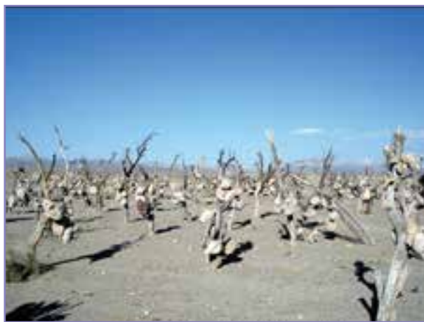
شکل ۲۶- باغ سنگی در یلوره سیرجان