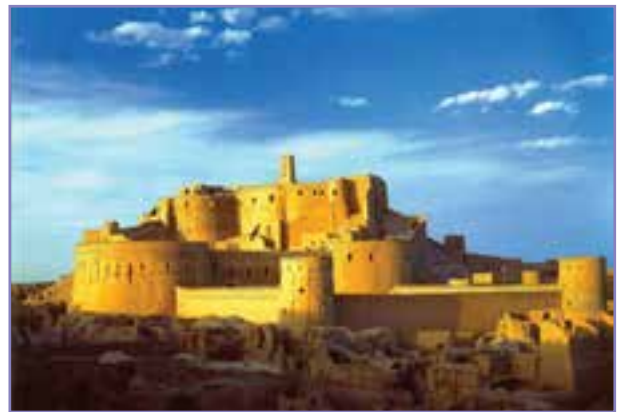
شکل ۳۰-۵- ارگ بم قبل از زلزله