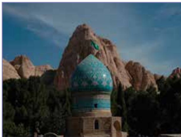
شکل ۱۵- پارکگاه امامزاده محمد علیه السلام در شهر کرمان