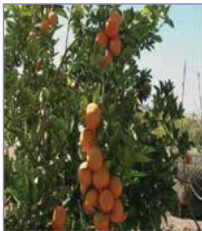
شکل ۳۹-۵- محصول مرکبات جنوب استان

نمونه‌ای دیگر از فعالیت‌های کشاورزی در استان کرمان کشت گلخانه‌ای است که این نوع کشت در اغلب نقاط استان به ویژه شهرهای جنوبی استان مورد استفاده قرار می‌گیرد. این نوع کشت به دلیل صرفه‌جویی در مصرف آب و خاک امکان اجرای آن در تمامی فصول سال و کنترل راحت شرایط کشت، در سال‌های اخیر به شدت مورد استقبال و توجه قرار گرفته است. گفتنی است تولید گل محمدی و اسانس آن در لاله زار بردسیر بعد از قمر کاشان رتبه دوم را در ایران دارد.