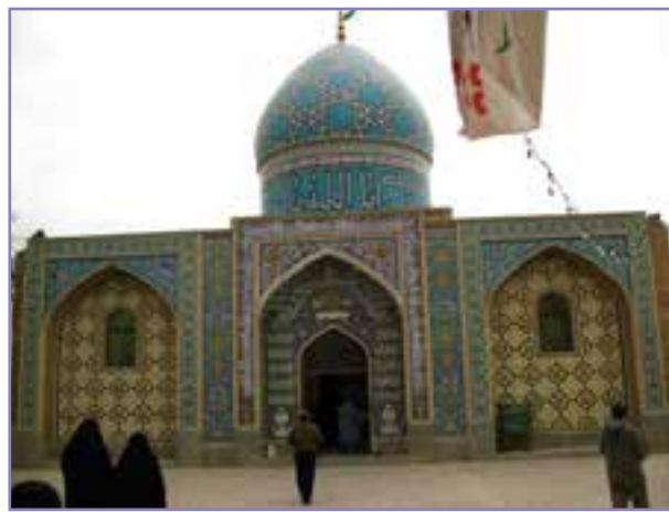
شکل ۲۰-۵- پارگاه امامزاده زید علیه السلام در شیراز