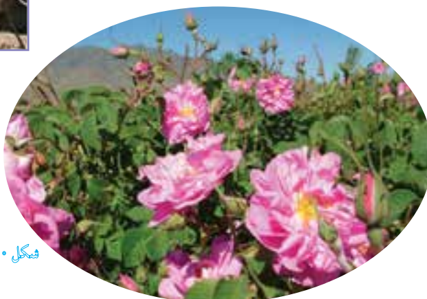
شکل ۴۰-۵- تولید گل محمدی در بخشی لاله زار

نمونه‌ای دیگر از فعالیت‌های کشاورزی در استان کرمان کشت گلخانه‌ای است که این نوع کشت در اغلب نقاط استان به ویژه شهرهای جنوبی استان مورد استفاده قرار می‌گیرد. این نوع کشت به دلیل صرفه‌جویی در مصرف آب و خاک امکان اجرای آن در تمامی فصول سال و کنترل راحت شرایط کشت، در سال‌های اخیر به شدت مورد استقبال و توجه قرار گرفته است. گفتنی است تولید گل محمدی و اسانس آن در لاله زار بردسیر بعد از قمر کاشان رتبه دوم را در ایران دارد.