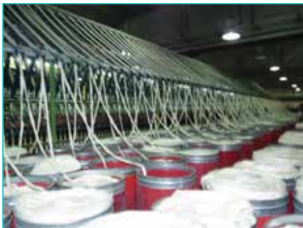
شکل ۵۴-۵- تصویری از کارخانه نساجی