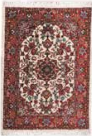
نام طرح: فرش افشار نام نقشه: شکارگاه ابعاد: ۲.۵ \times ۳.۵ ۲ \times ۳ ۱.۷ \times ۴.۰ بافت: تکاب