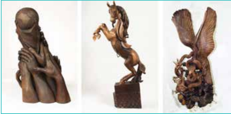
شکل ۶۰-۵- پیکره تراشی

۳- پیکره تراشی: این هنر به طور گسترده در شهرستان ارومیه کار می‌شود. ماده اصلی پیکره‌ها چوب گردو است.