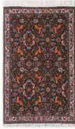
نام طرح: فرش افشار نام نقشه: شکارگاه ابعاد: ۲.۵ \times ۳.۵ ۲ \times ۳ ۱.۷ \times ۲.۴ بافت: تکاب