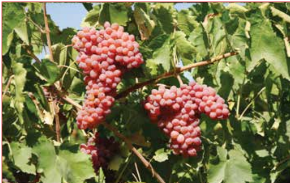
شکل ۴۳-۵- محصولات باغی استان

الف) زراعت : استان آذربایجان غربی با تولید ۴۶ نوع محصول زراعی و باغی از قطب های مهم کشاورزی کشور محسوب