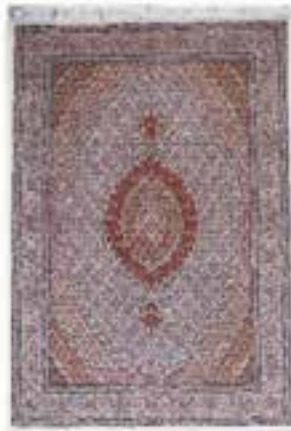
نام طرح: ماهی نام نقشه: شکارگاه ابعاد: ۶ \times ۴ ۲.۵ \times ۵ ۲.۵ \times ۳.۵ ۲ \times ۳ ۱ \times ۱.۵ ۱.۵ \times ۲ بافت: ارومیه - خوی - سلماس - ماکو - چالدران - پلدشت