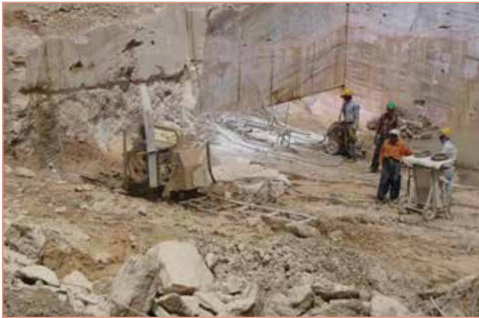
شکل ۶۳-۵- بهره‌برداری از معادن استان