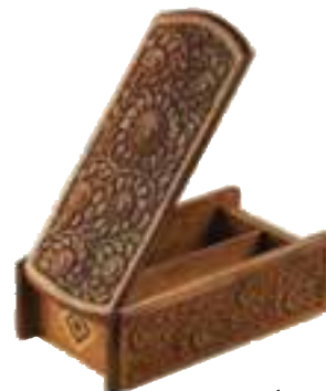
شکل ۵۹-۵- ریزه‌کاری

۲- ریزه‌کاری: هنری بسیار ظریف، زیبا و کاربر است. در این هنر چوب‌هایی بر اساس طرح و نقش از قبل آماده می‌شود و بر قسمت خالی شده چوب روکش می‌شود. ارومیه مرکز اصلی این هنر است. عمده‌ترین تولیدات این صنعت رحل قرآن، جعبه جواهرات، جعبه دستمال کاغذی، قاب عکس، صفحه شطرنج و... است.