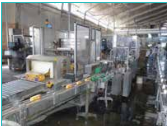
شکل ۵۳-۵- کارخانه آب میوه‌گیری