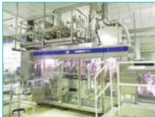
شکل ۵۲-۵- کارخانه شیر باستوریزه

آیا می‌توانید صنایع تبدیلی کشاورزی استان محل زندگی خود را نام ببرید؟