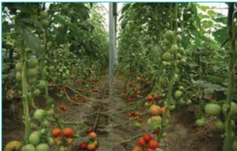
شکل ۴۴-۵- کشت گلخانه‌ای

در سال‌های اخیر کشت گلخانه‌ای نیز در استان رونق زیادی پیدا کرده است. آیا می‌توانید بگویید چرا این نوع کشت مورد استقبال و توجه کشاورزان قرار گرفته است؟ آیا می‌توانید بگویید در شهرستان محل زندگی شما کدام محصولات زراعی در گلخانه تولید می‌شوند؟ از کشت گلخانه‌ای محل زندگی خود تصاویری تهیه و در کلاس ارائه کنید.