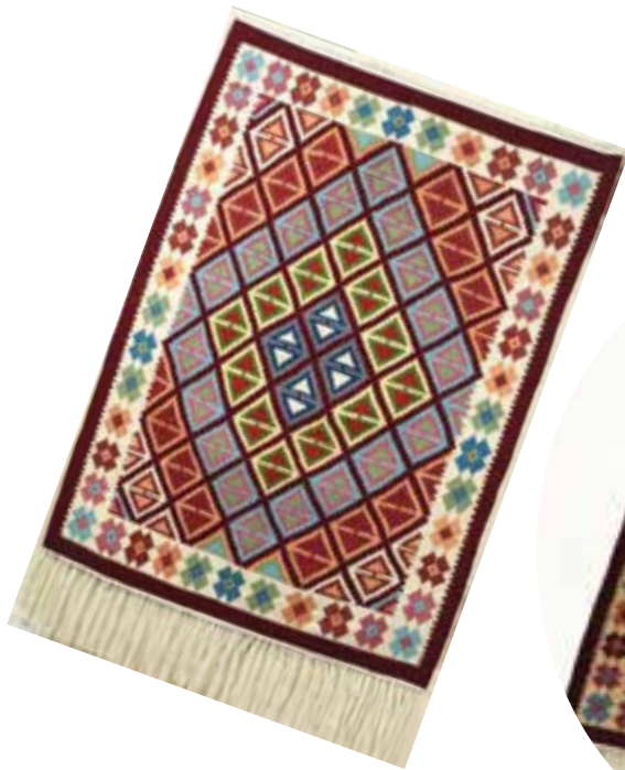
شکل ۵۷-۵- گلیم بافی

در بافت گلیم به کار می‌رود. نقوش گلیم به‌طور معمول هندسی است و بافت آن بیشتر در میان عشایر متداول است. از مراکز مهم گلیم‌بافی می‌توان به شهرستان‌های تکاب، مهاباد و بوکان اشاره کرد.