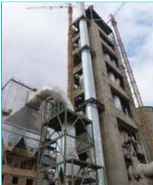
شکل ۵۱-۵- کارخانه سیمان

صنایع تولید مواد غذایی و آشامیدنی پس از صنایع فرآوری و تبدیلی معدنی دومین تخصص صنعتی استان در سال ۱۳۸۵ بود و ۲۱/۶ درصد از کل صنایع استان را شامل می‌شد.