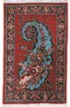
نام طرح: فرش افشار نام نقشه: بته جقه ابعاد: ۳ \times ۴ ۳ \times ۳ بافت: شاهین دژ و بوکان