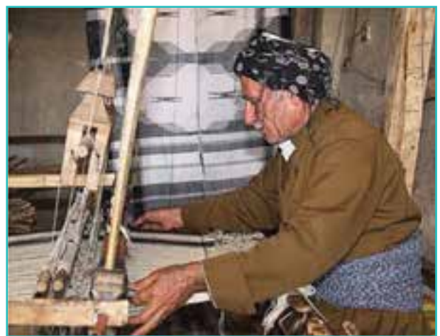
شکل ۵۶-۵- صنایع نساجی سنتی استان