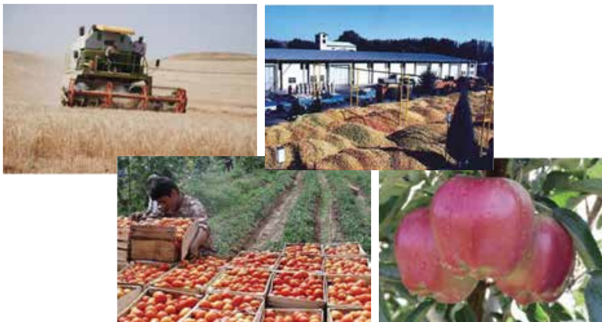
شکل ۴۱-۵- توانمندی‌های کشاورزی استان

به تصاویر زیر نگاه کنید. به نظر شما مهم‌ترین توانمندی اقتصادی استان ما چیست؟