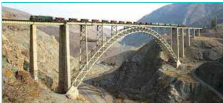
شکل ۶۴-۵- پل هوایی قطور- خوی