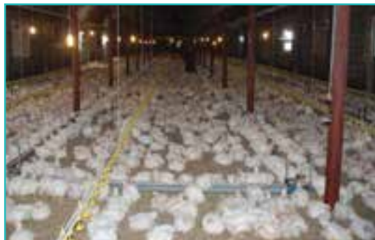
شکل ۴۸-۵- مرغداری صنعتی