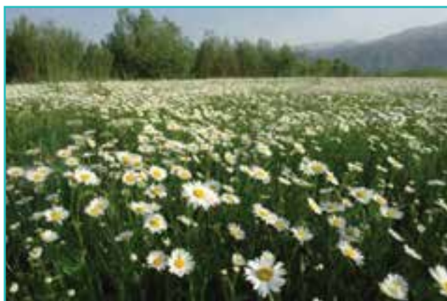
شکل ۵۰-۵- دشت‌های پرگل