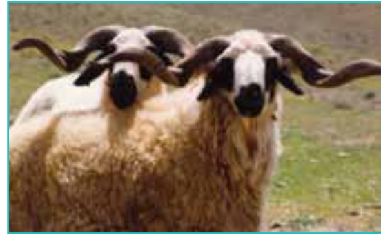
شکل ۴۷-۵- پرورش دام