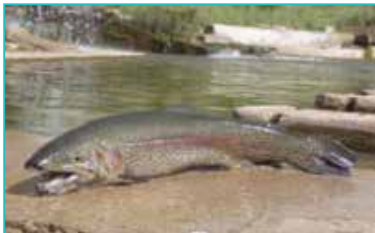
شکل ۴۹-۵- پرورش ماهی