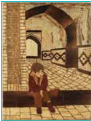
شکل ۶۱-۵- معرق چوب

۴- معرق چوب: این هنر ۴۰ سال پیش به شهرستان ارومیه راه پیدا کرد و با منبت تلفیق شد و رشته جدیدی به نام معرق - منبت یا معرق برجسته بوجود آمد.