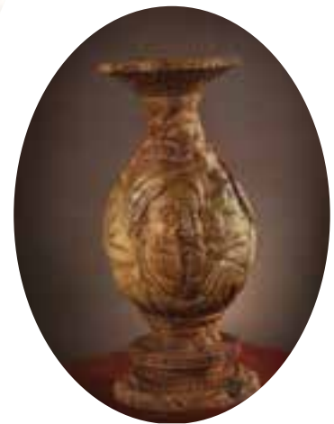
شکل ۵۸-۵- منبت‌کاری