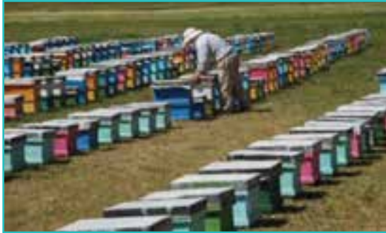
شکل ۴۶-۵- پرورش زنبورعسل