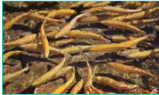
شکل ۴۵-۵- پرورش ماهی