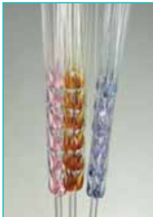
شکل ۶۲-۵- شیشه‌گری

۴- معرق چوب: این هنر ۴۰ سال پیش به شهرستان ارومیه راه پیدا کرد و با منبت تلفیق شد و رشته جدیدی به نام معرق - منبت یا معرق برجسته بوجود آمد.