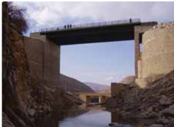
شکل ۳-۶- برخی دستاوردهای راه‌سازی استان