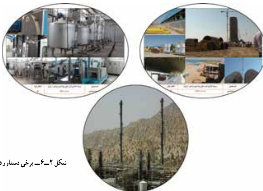
شکل ۲-۶- برخی دستاوردهای صنعتی استان