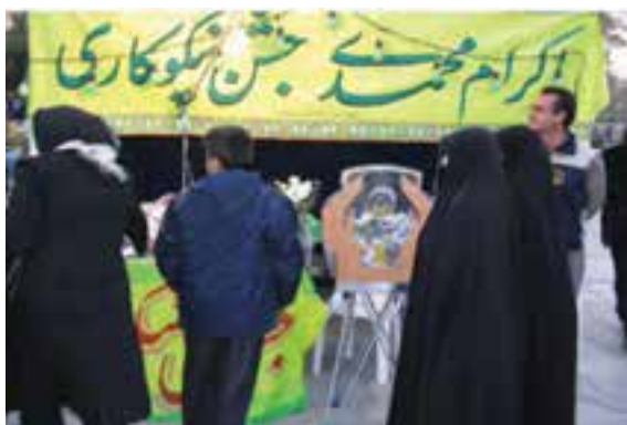
شکل ۲-۷- جشن نیکوکاری

وجود ۱۴۷ واحد توانبخشی، ۳۲ مرکز بازپروری ۱ معتادان و ۷ مرکز مشاوره ژنتیک ۲ از افتخارات خدماتی این سازمان بوده است. — کمیته امداد امام خمینی: ۳۴ واحد کمیته مشغول در استان، به عنوان نهادی انقلابی از نوع مؤسسات غیرانتفاعی و عام المنفعه، خدمات خود را در جهت سه محور امور حمایتی از محرومان، امور توانمندسازی محرومان و امور اعتمادسازی و جلب مشارکت‌های مردمی دنبال می‌کند.