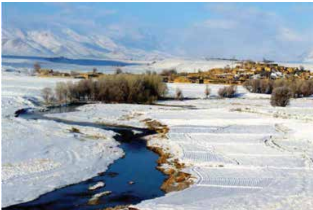
شکل ۱-۷- روستایی در فریدن

— صدا و سیما: اصفهان اولین استان در کشور است که شبکه استانی سیما در آن شکل گرفته است. همچنین، صدای مرکز استان نزدیک به نیم قرن سابقه فعالیت دارد. از سال ۱۳۷۴ افتتاح شبکه ۵ سیمای استان به توسعه این سازمان کمک چشم گیری کرده است. در حال حاضر، کل استان زیر پوشش شبکه صدا و سیما قرار دارد.