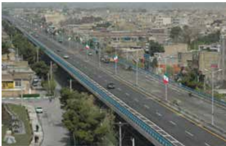
شکل ۳-۷- پل روگذر غیر مسطح امام خمینی (ره)

— حمل و نقل: استان اصفهان با دارا بودن ۱۱۰۰۰ کیلومتر راه، نقش مهمی را در بخش حمل و نقل کشور ایفا می‌کند. ۲۵ درصد آزاد راه‌ها و ۲۳ درصد بزرگراه‌های کشور در این استان قرار گرفته است. در بخش حمل و نقل ریلی، استان اصفهان دارای ۶۴۹ کیلومتر خط اصلی است. در بخش هوایی نیز با پنج فرودگاه در استان وجود دارد، که فقط فرودگاه شهید بهشتی در زمینه حمل و نقل عمومی و مسافربری فعال است. کاهش تلفات جاده‌ای و شناسایی و اصلاح نقاط پرحادثه، افزایش ظرفیت شبکه راه‌های استان، برقراری تردد امن با کاهش زمان و هزینه سفر از اقدامات مهم این بخش است. — حمل و نقل درون شهری: تا پایان شش ماهه اول سال ۱۳۸۷ سهم حمل و نقل عمومی در کلان‌شهر اصفهان ۶۸ درصد بوده است. طی ۳۰ سال (۱۳۵۸-۸۵) جمعیت شهری استان حدود ۲/۱۵ برابر شده؛ در حالی که تعداد وسایل حمل و نقل عمومی به بیش از ۵۹ برابر رسیده است.