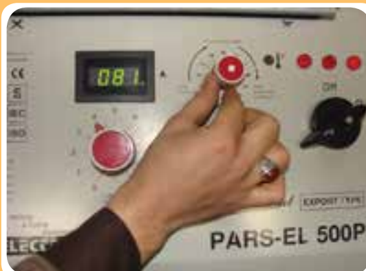
کلید انتخاب جریان مناسب بر حسب نوع الکتروود جوشکاری