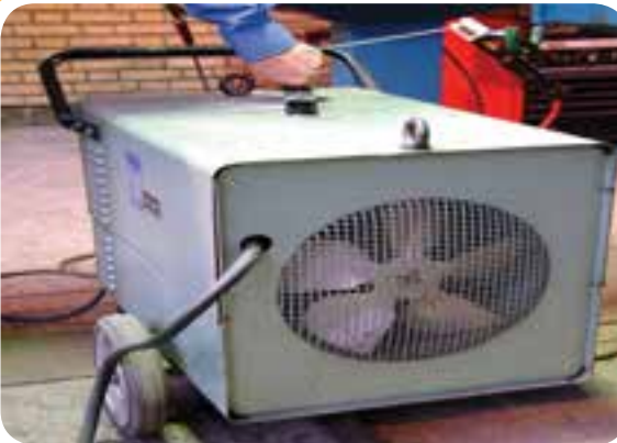
ترانسفورماتوری که شدت جریان خروجی با جابجایی هسته صورت می‌گیرد.

تغییر آمپر در بعضی از دستگاه‌هایی ترانسفورماتور ممکن است با جابه جا کردن هسته فرعی درون هسته اصلی مطابق آنچه که در شکل (۹-۵) مشاهده می‌شود، انجام پذیرد که در این صورت با گردش دسته، تغییر آمپر انجام می‌گیرد و نشانه مخصوص در مقابل اعداد، میزان آمپر خروجی دستگاه را نشان می‌دهد.