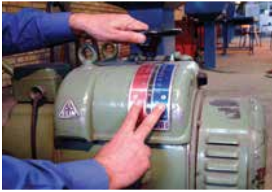
سیستم اهرمی جهت تغییر آمپر دستگاه دینام جوشکاری

هم‌چنین تغییر آمپر روی دستگاه دینام جوشکاری بوسیله یک سیستم اهرمی از طریق جابه‌جایی انجام می‌گیرد و دارای دو رنج درجه‌بندی شده است. (یکی برای تنظیم آمپر کم و یکی برای آمپر بالا). برای تغییر قابلیت انبر الکتروگیر به قطب مثبت یا منفی دستگاه نیز یک کلید تغییر قطب روی دستگاه وجود دارد که با جا به جا کردن آن الکتروود مثبت یا منفی می‌شود.