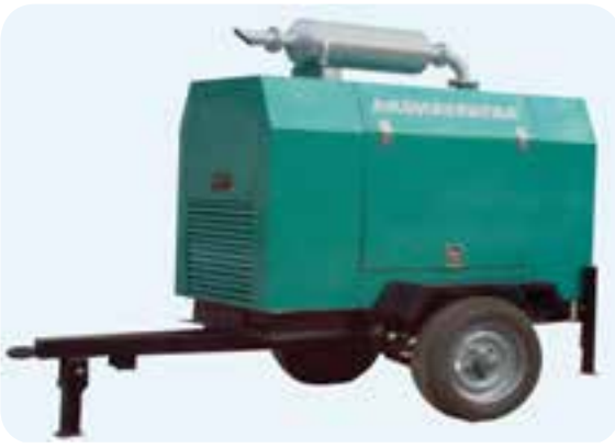
موتور جوش‌های احتراقی که در محل‌های نصب سازه‌های فلزی مورد استفاده قرار می‌گیرند.

موتور جوش‌هایی که در سایت‌ها محل‌های نصب سازه‌های فلزی و یا در راه‌سازی و پل‌سازی مورد استفاده واقع می‌شوند به طور معمول دارای یک موتور احتراق (بنزینی یا گازویلی) هستند که با استارت راه‌اندازه می‌شوند (شکل ۵-۲۲). راه‌اندازی، موتور احتراقی و کنترل روغن، سوخت و غیره بر اساس دفترچه راهنما دستگاه باید صورت گیرد و استفاده از مولد جریان جوشکاری، کابل‌های اتصال و انبر نیز مشابه دینام جوش کارگاهی است.