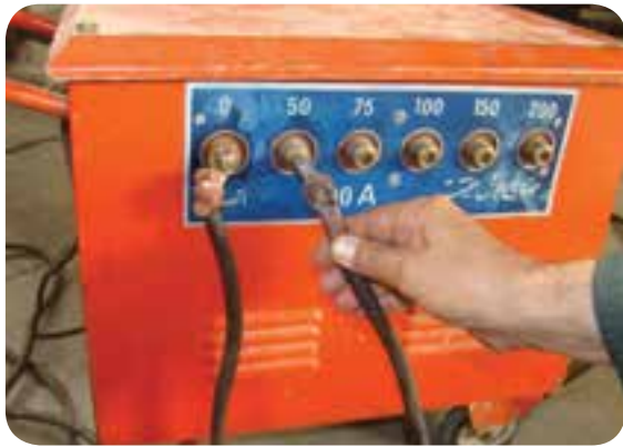
تنظیم آمپر در دستگاه ترانسفورماتور پله‌ای

امروزه بعضی از دستگاه‌های ترانسفورماتور جوشکاری دارای یک صفحه کوچک نمایش آمپر نیز هستند که موقع برقرار بودن قوس الکتریکی میزان آمپر جوشکاری را نیز نشان می‌دهد.