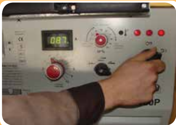
کلیدهای مختلف روی صفحه اصلی رکتی‌فایر جوشکاری

مطابق دستگاه‌های معمول جوشکاری، کلیدهای مختلف قطع و وصل و تنظیم دستگاه با سیگنال مرتبط روی صفحه اصلی رکتی‌فایر مشاهده می‌شود. (شکل ۵-۱۳).