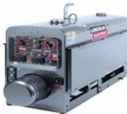
دو مدل از مولدهای جریان جوشکاری که با سوخت مایع کار می‌کنند.

مولدهای جوش سیار در سایت‌ها و مکان‌های دور از شبکه برق صنعتی مثل: سکوهای شناور در دریا و اقیانوس‌ها و مکان‌های نصب آنتن‌های مخابرات در ارتفاعات به کار گرفته می‌شود و با استفاده از موتور احتراق داخلی، حرکت دورانی جهت گردش محور دینام مولد جریان جوشکاری تأمین می‌گردد.