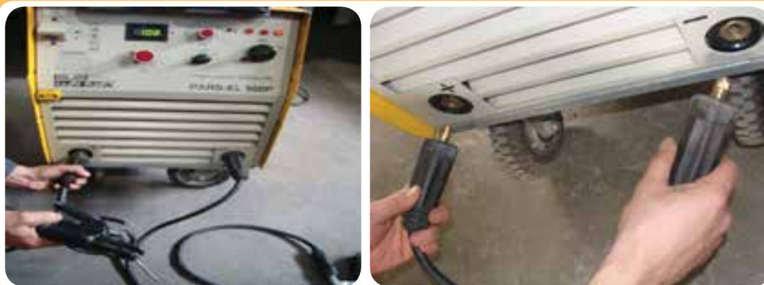
ترمینال‌های خروجی شدت جریان جهت اتصال کابل جوشکاری