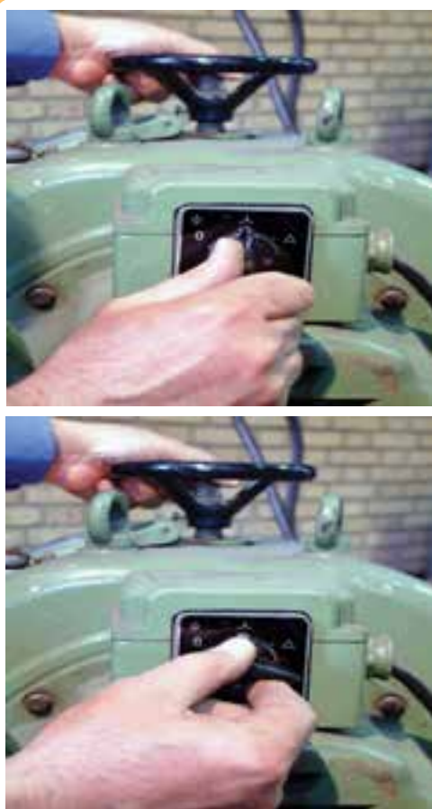
دینام جوش کارگاهی و کلیدهای مخصوص روشن و خاموش کردن دستگاه

راه‌اندازی دینام جوش کارگاهی به طور معمول از طریق کلید روشن ۱ و خاموش ۲ که روی دستگاه مطابق شکل (۲۰-۵) تعبیه شده صورت می‌گیرد. ولی در بعضی از دستگاه‌ها روشن و خاموش کردن از طریق کلید ستاره و مثلث صورت می‌گیرد. در این حالت ابتدا باید کلید را از حالت خاموش در حالت ستاره قرار دهیم و پس از چند ثانیه که موتور به دور نهایی رسید، آن را به حالت مثلث تغییر وضعیت دهیم تا دستگاه به کار خود ادامه دهد (شکل ۲۰-۵).