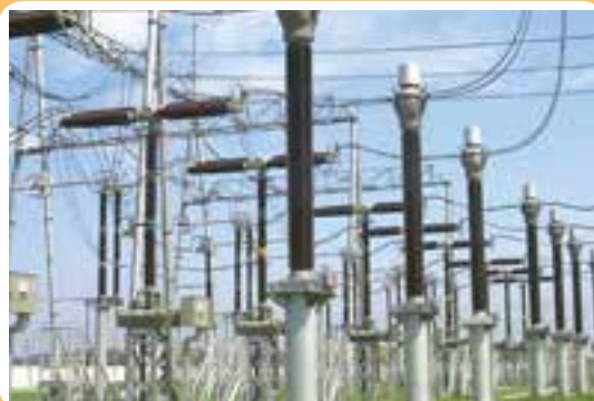
پست تقویت ولتاژ جریان برق

همان‌طور که در شکل (۵-۲) نشان داده شده است جریان الکتریسیته با ولتاژ بسیار بالا به طور معمول در حد چند ده هزار ولت می‌رسد. توسط دکل‌های بزرگ انتقال برق به طرف شهرها و یا واحدهای صنعتی منتقل می‌شود، تا اینکه در مجاورت شهرها وارد ایستگاه‌های تقلیل ولتاژ می‌شود و ولتاژ آن کاهش می‌یابد. سپس جریان الکتریکی به صورت تک فاز یا سه فاز (۲۲۰ یا ۳۸۰ ولت) توسط شبکه توزیع به واحدهای مصرف کننده منتقل می‌شود.