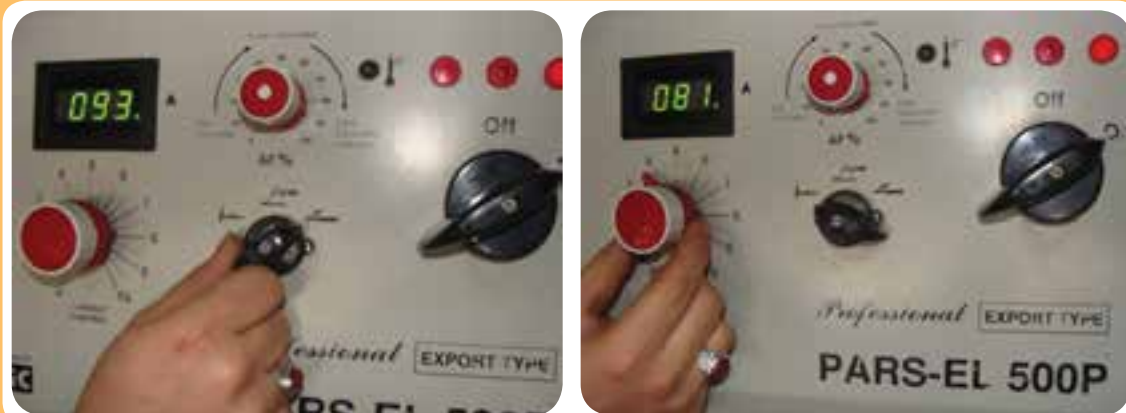
کلیدهای مختلف برای تنظیم دستگاه جوشکاری

هم‌چنین برخی از رکتی‌فایرهای جوشکاری ممکن است دارای کلید انتخاب جریان مناسب بر حسب نوع الکتروود جوشکاری باشند که باعث راحتی کار جوشکاری و پایداری قوس می‌شود (شکل ۱۵-۵). گاهی ممکن است دستگاه رکتی‌فایر جوشکاری دارای سیستم تنظیم آمپر از کنار دست جوشکار نیز باشد که این قابلیت توسط یک فیش و مادگی مطابق آنچه در (شکل ۱۶-۵) مشاهده می‌شود میسر می‌گردد.