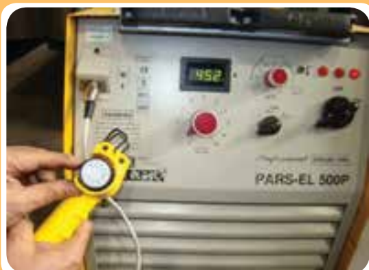
تنظیم آمپر از کنار دست جوشکار توسط سیستم کنترل از راه دور