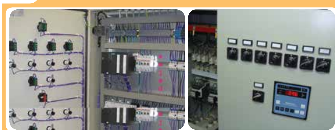
تابلوهای برق صنعتی موجود در کارگاه‌ها