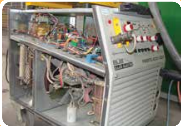
سیستم الکترونیکی تبدیل جریان متناوب بر جریان مستقیم در رکتی‌فایرهای جوشکاری

در حقیقت رکتی‌فایرهای جوشکاری همان دستگاه‌های ترانسفورماتور هستند که یک سیستم یکسو کننده‌گی جریان الکتریسته به آنها اضافه شده است و در (شکل ۵-۱۲) این تجهیزات الکترونیکی در قسمت فوقانی دستگاه نشان داده شده است.