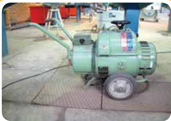
دینام جوش کارگاهی

دینام جوشکاری یک مولد جریان مستقیم است و از یک موتور که ژنراتور مولد جریان مستقیم را به گردش در می‌آورد، تشکیل شده است. اگر موتور محرکه دینام از نوع الکتریکی باشد دینام جوش کارگاهی نامیده می‌شود (۵-۱۸) و اگر بنزینی یا گازوییلی باشد، موتور جوش نامیده می‌شود.