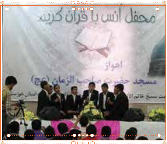
انس با قرآن کریم در استان خوزستان

با راهنمایی آموزگار خود پس از آوردن قرآن کریم از دفتر مدرسه، آن را به صورت تصادفی باز کنید و از روی آن بخوانید.