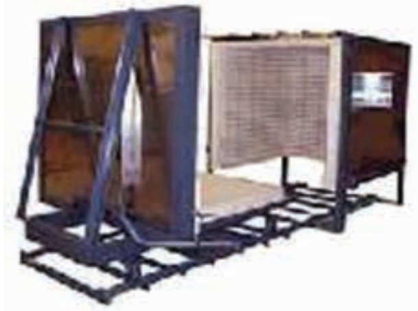
شکل ۱-۵- خشک کن متناوب

از خشک کن های متناوب، اغلب در جاهایی استفاده می شود که ظرفیت تولید پایین می باشد. انرژی گرمایی مورد نیاز این نوع خشک کن ها معمولاً از انرژی گرمایی مازاد کوره های پخت سرامیک تأمین می گردد. نیاز به تعداد بیشتر نیروی انسانی در چیدمان و راه اندازی خشک کن های متناوب و مصرف انرژی گرمایی زیاد در مقایسه با خشک کن های مداوم، از نقاط ضعف عمده ی آنها محسوب می شود (شکل ۱-۵).