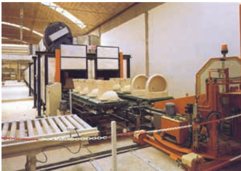
شکل ۳-۵- خشک‌کن مداوم برای چینی بهداشتی

۱-۳-۵ - خشک‌کن‌های عمودی: خشک‌کن‌های عمودی، کانال‌هایی هستند که محصولات سرامیکی در آن‌ها برای خشک شدن، از پایین تا ارتفاع بالا حرکت می‌کنند. به عبارت دیگر، محصولات سرامیکی در داخل محفظه‌ی خشک‌کن به طور قائم به طرف بالا حرکت می‌کنند، سپس به طرف پایین هدایت می‌شوند، و در اثر قرار گرفتن در معرض گرمای ناشی از دمنده‌های هوای داغ، خشک می‌شوند.