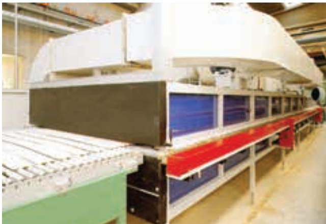
شکل ۲-۵- خشک‌کن مداوم صنعت کاشی

در کارخانجات انرژی گرمایی مورد نیاز این نوع خشک‌کن‌ها، انرژی گرمایی هم از انرژی مازاد کوره‌های پخت سرامیک و هم از منبع جدا و اختصاصی، تأمین می‌گردد (شکل‌های ۲-۵ و ۳-۵).