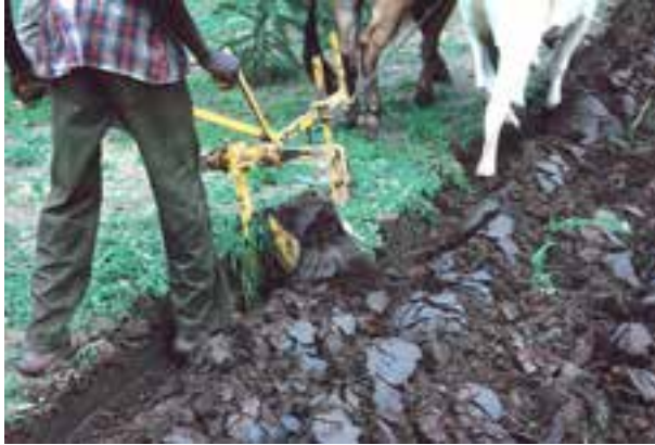
شکل ۲-۵- استفاده از دام برای شخم زدن زمین

مرحله بعد با کشف فلز و در نهایت آهن به وقوع پیوست. لذا انسان برای ساخت ابزار از آهن استفاده کرد و گاو آهن به وجود آمد. نام گاو آهن برگرفته از نام دامی که آن را می کشید (گاو) و جنس ابزار ساخته شده یعنی آهن بود.