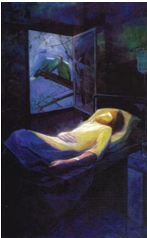
▲ شکل ۱۲-۱۴-ب - نقاشی رنگ و روغن، دوره معاصر

در جریان انقلاب فرهنگی و بازگشایی مجدد مراکز هنری در سطوح مختلف همچنان زمینه برای گرایش‌ات آزاد فراهم شد. با گذشت زمان در برگزاری نمایشگاه‌ها و جشنواره‌ها تحولاتی خاص در عرصه هنر پدید آمد.