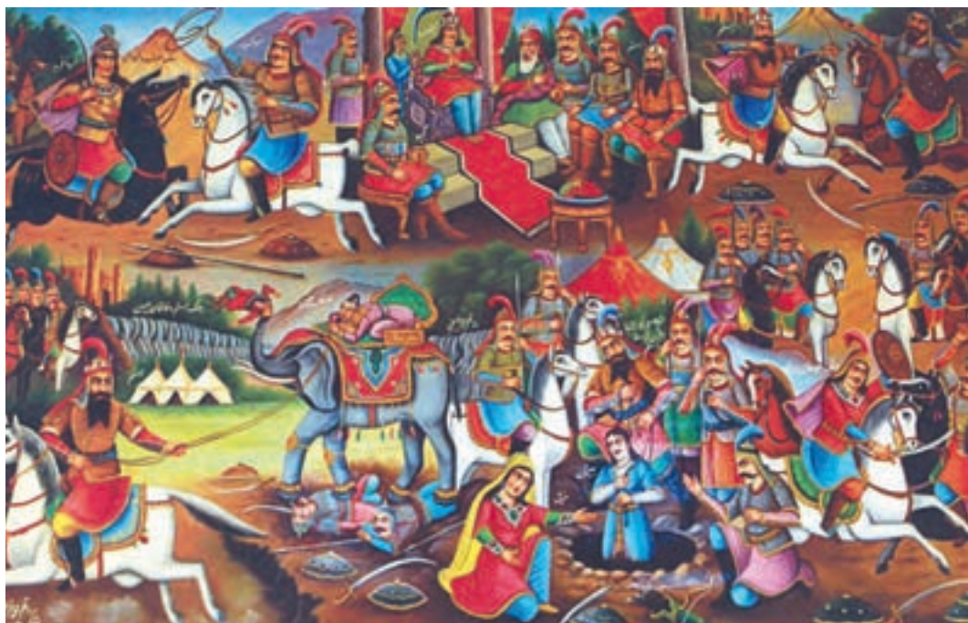
▲ شکل ۱۵-۱۳- نقاشی قهوه‌خانه‌ای، استاد محمد فراهانی

که با تأسیس مدرسه صنایع مستظرفه به همت کمال الملک شکل گرفت. این هنر، نوعی نقاشی ایرانی با گرایشات هنر غربی و شاعرانه همراه با چشم‌اندازهایی از مکان‌هایی واقعی است که بیان‌کننده هنر رسمی است (شکل ۱۶-۱۳).