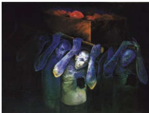
▲ شکل ۱۲-۱۴-د - رنگ اکریلیک روی بوم، دوره معاصر