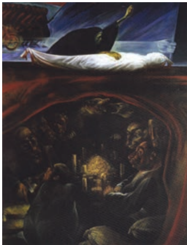
▲ شکل ۱۲-۱۴-الف - نقاشی رنگ و روغن، دوره معاصر