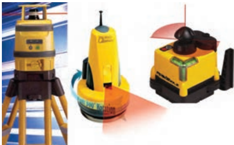
شکل ۷-۵ - تراز یاب چرخنده

پیاده کردن نقاط با GPS و PDA : همانند نقشه برداری تک نفره با RPU در اینجا به جای به کارگیری توتال استیشن برای تعیین موقعیت شاخص، از یک GPS استفاده می شود. برای این منظور آنتن GPS روی شاخص نصب شده و توسط کاربر در نقاط مورد نظر قرار داده می شود. GPS به صورت آنی نقاط را تعیین موقعیت نموده و نتیجه را روی صفحه کامپیوتر نمایشگر که روی شاخص نصب شده است به نام (PDA) (Personal Data Assistant) در کنار نقشه طرح نمایش می دهد. کاربر با نگاه به طرح آن قدر جابه جا می شود تا روی نقطه مورد نظر قرار گیرد. البته برای افزایش دقت در این روش، نیاز به دو گیرنده GPS می باشد که توضیح آن در فصل ششم ارائه شده است.