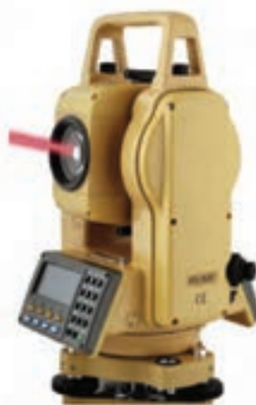
شکل ۷-۴- توتال لیزری بدون رفلکتور

ترازیاب چرخنده : این ترازیاب پس از استقرار و تراز شدن، یک صفحه افقی را با لیزر مشخص نموده و شاخص بارکددار آن، بسته به این که در چه نقطه ای از سطح زمین در دورتادور این ترازیاب قرار داده شود، به صورت آنی ارتفاع نقطه را روی صفحه نمایشگر خود نمایش می دهد. به این ترتیب می توان در پروژه های زیرسازی مسیرها و سایت های خاص مانند باند فرودگاه و کنترل های ارتفاعی پی بناها از این تجهیزات استفاده نمود.