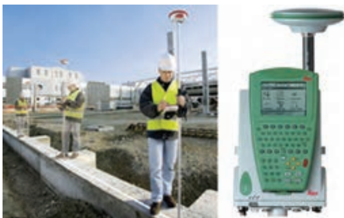
شکل ۷-۶ - پیاده کردن نقاط با GPS و PDA

پیاده کردن نقاط با GPS و PDA : همانند نقشه برداری تک نفره با RPU در اینجا به جای به کارگیری توتال استیشن برای تعیین موقعیت شاخص، از یک GPS استفاده می شود. برای این منظور آنتن GPS روی شاخص نصب شده و توسط کاربر در نقاط مورد نظر قرار داده می شود. GPS به صورت آنی نقاط را تعیین موقعیت نموده و نتیجه را روی صفحه کامپیوتر نمایشگر که روی شاخص نصب شده است به نام (PDA) (Personal Data Assistant) در کنار نقشه طرح نمایش می دهد. کاربر با نگاه به طرح آن قدر جابه جا می شود تا روی نقطه مورد نظر قرار گیرد. البته برای افزایش دقت در این روش، نیاز به دو گیرنده GPS می باشد که توضیح آن در فصل ششم ارائه شده است.