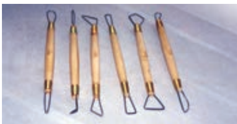
شکل ۴-۶- برخی از ابزار تزئین بدنه‌ی گلی - ابزار بردارنده (کاهنده)