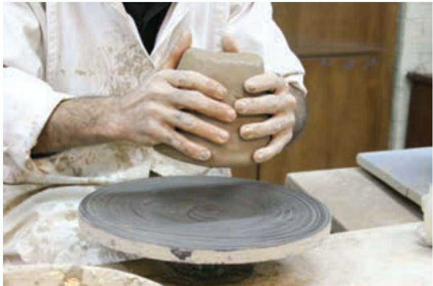
شکل ۸-۴ الف- قرار دادن چانه بر مرکز صفحه‌ی چرخ

۲-۹- شیء را به تدریج خشک می کنند و سپس در کوره می پزند (شکل ۸-۴).