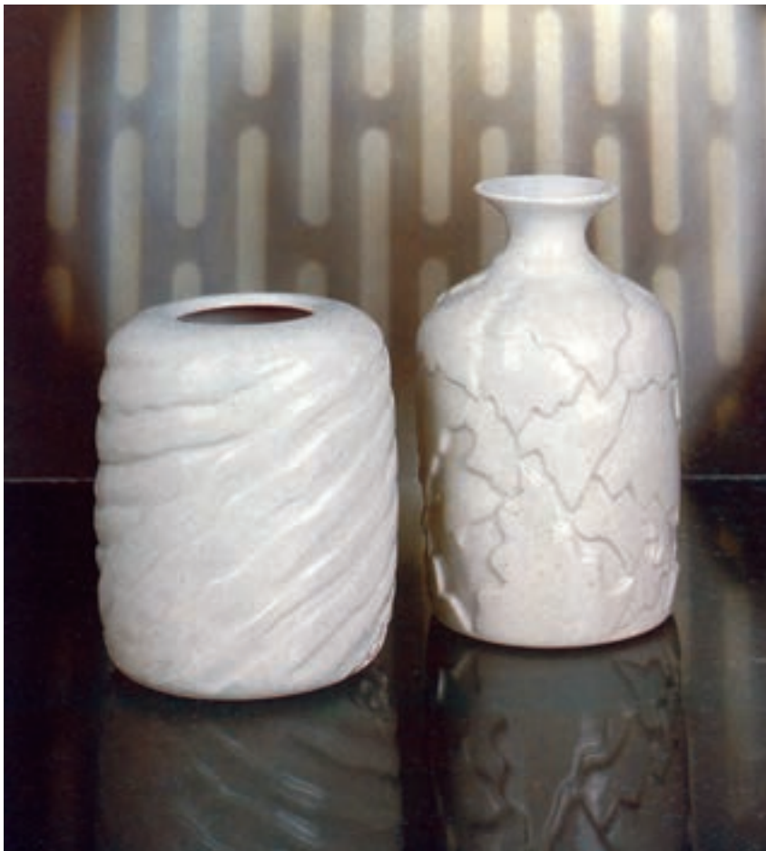
شکل ۳-۴-د - ظروف با نقش کنده و لعاب یکرنگ