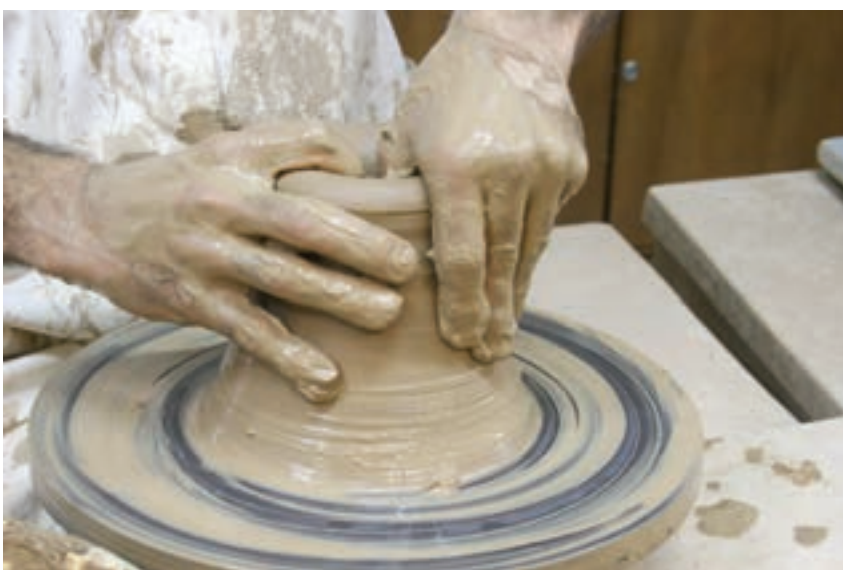
شکل ۸-۴-ه - بزرگ کردن حفره