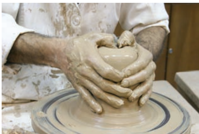
شکل ۸-۴-د - ایجاد حفره اولیه