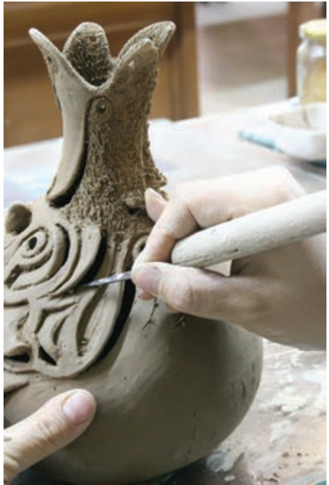
شکل ۱۰-۴-الف - تزیین بدنه‌ی سفالی به روش نقش‌کنده