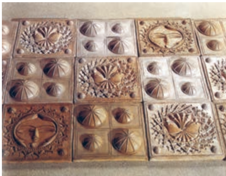
شکل ۲-۴ الف - خشت‌های نقش برجسته سفالی قالبی

هدف و کاربرد: گروهی از آثار سفالینه همواره ظروف مناسبی برای نگهداری مواد خوراکی بوده‌اند و گروهی دیگر به