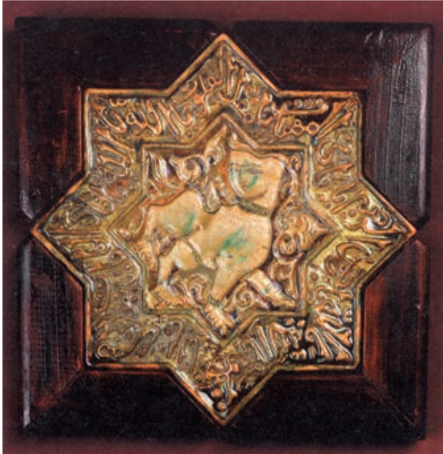
شکل ۹-۴- خشت شکل داده شده به روش فشاری در قالب