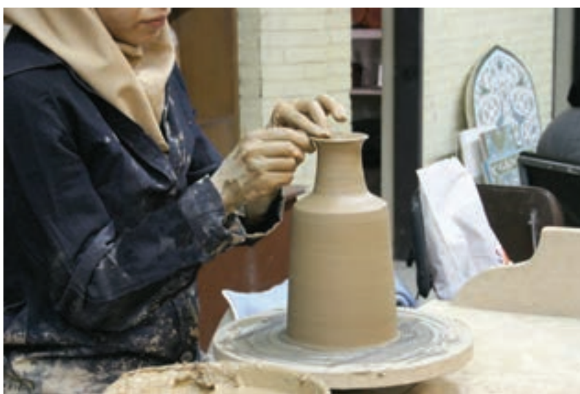
شکل ۸-۴-ز - شکل دادن لبه