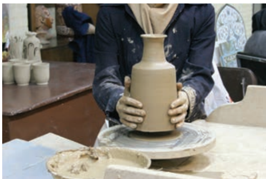
شکل ۸-۴-ی - برداشتن شیء گلی ساخته شده از روی چرخ