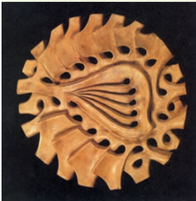
شکل ۳-۴- ب - اشیای سفالی دست‌ساز