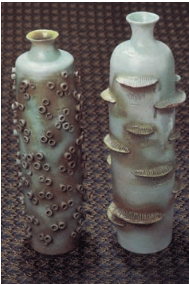
شکل ۱۰-۴-ب - تزیین بدنه‌ی سفالی به روش نقش افزوده

۱-۲- شیوه‌ی نقش‌افزوده: قطعه‌ای از خمیر گل را مطابق طرح روی بدنه‌ی خام (پیش از خشک شدن) می‌افزایند (شکل ۱۰-۴-ب).