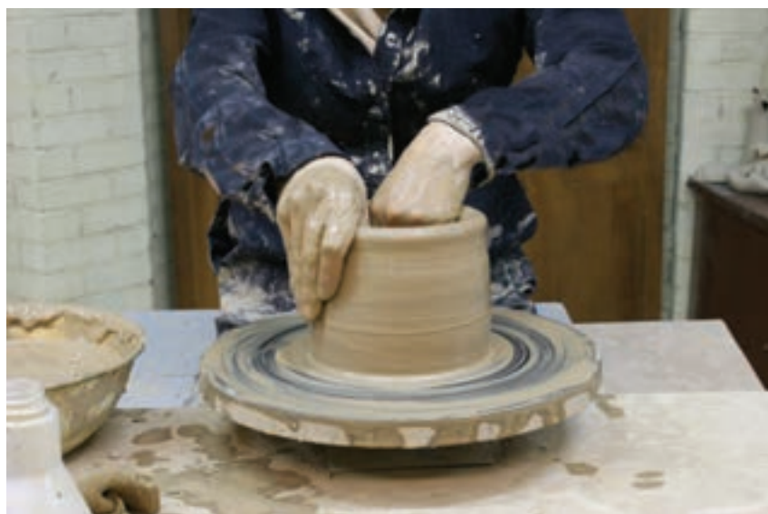
شکل ۸-۴-و - شکل دادن دیواره