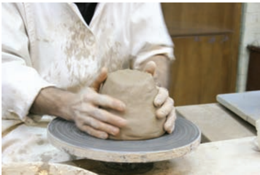
شکل ۸-۴ ب- محکم کردن چانه بر مرکز صفحه