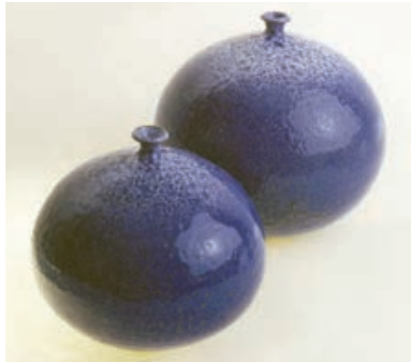
شکل ۳-۴- الف - اشیای سفالی مدور و قرینه (چرخ ساز)