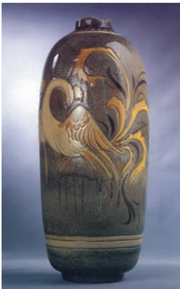
شکل ۱۱-۴-ج- تزیین به روش زیر رنگی

– اگر اطراف طرح و نقش‌ها را بر روی بدنه‌ی سفال با رنگ سیاه قلم‌گیری کنند و سپس با لعاب‌های متفاوت داخل آن‌ها را رنگ‌آمیزی کرده و در کوره بپزند به این روش تزیین «هفت‌رنگی» می‌گویند (شکل ۱۲-۴).