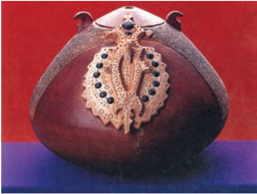
شکل ۳-۴-ج - شیء سفالی با نقوش برجسته