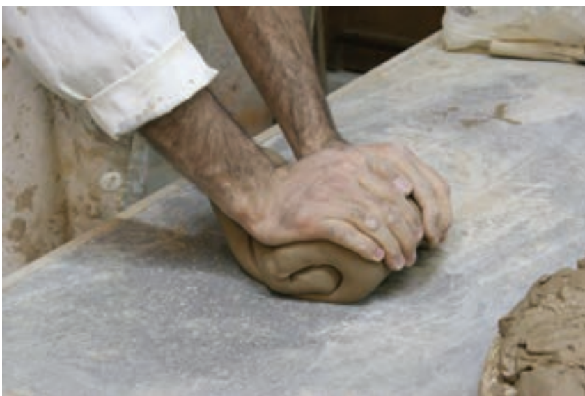
شکل ۷-۴-الف - ورز دادن گل