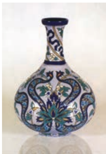
شکل ۱۲-۴- تزیین به روش هفت رنگ

– اگر اطراف طرح و نقش‌ها را بر روی بدنه‌ی سفال با رنگ سیاه قلم‌گیری کنند و سپس با لعاب‌های متفاوت داخل آن‌ها را رنگ‌آمیزی کرده و در کوره بپزند به این روش تزیین «هفت‌رنگی» می‌گویند (شکل ۱۲-۴).