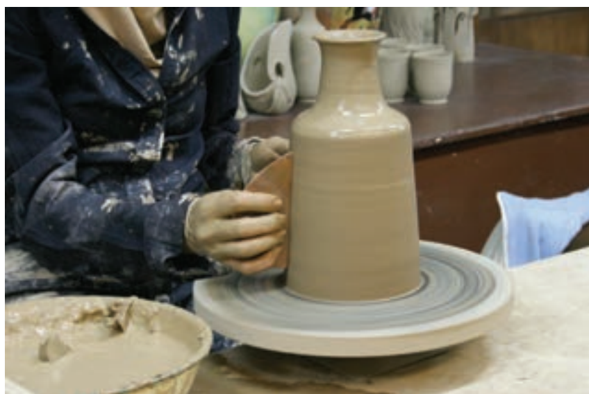
شکل ۸-۴-ح - پرداخت و شکل دادن با ابزار