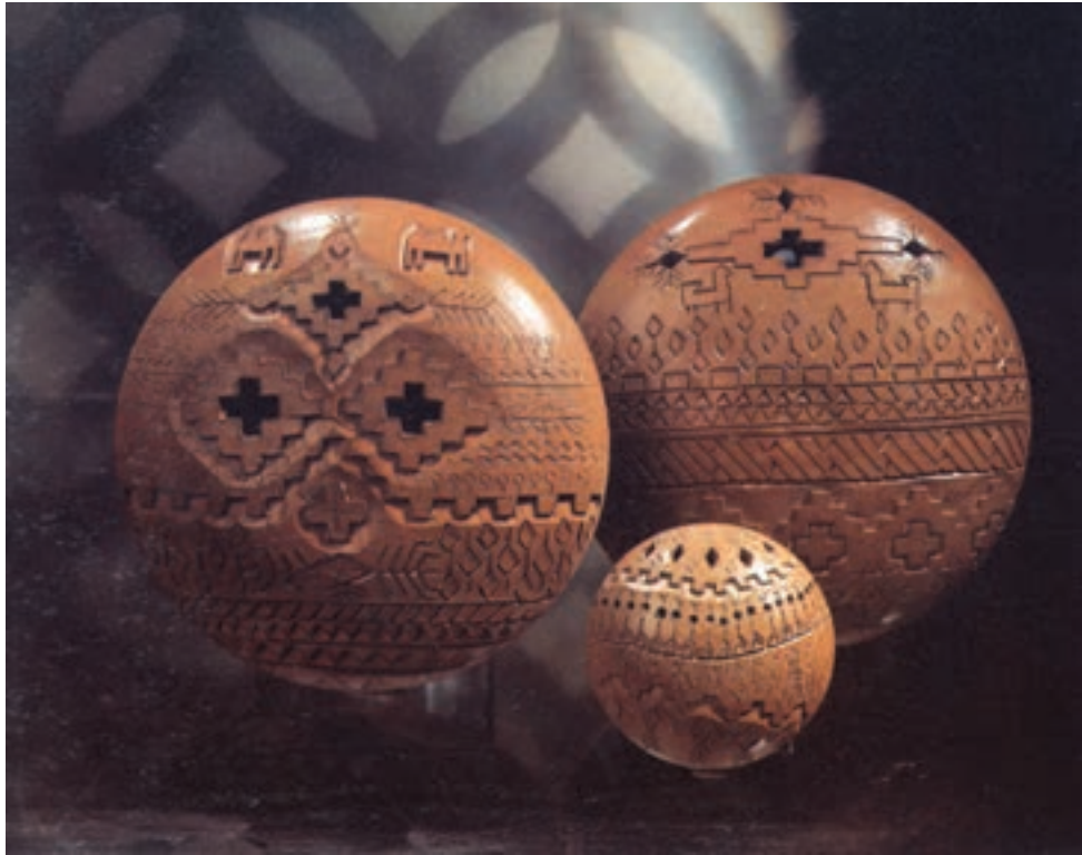
شکل ۱۰-۴-ج - تزئین بدنه‌ی سفالی به روش نقش بریده

۱-۳ - شیوهی نقش بریده: پیش از خشک شدن بدنه (چرمینه) قسمتی از بدنه را مطابق طرح بریده و جدا می‌کنند به گونه‌ای که زمینه‌ی شیء مشبک شود (شکل ۱۰-۴-ج).