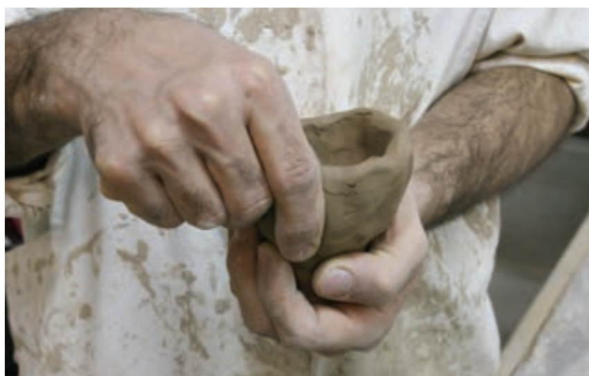
شکل ۷-۴-ب - شکل دادن گل با کمک دست به روش فشاری