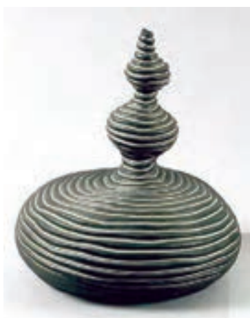
شکل ۷-۴-ج - شیء دست ساز به روش فتیله ای