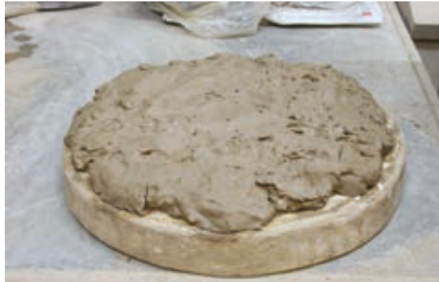
شکل ۴-۴- صفحه‌ی چوبی و کاربرد آن در آماده‌سازی گل

مفتول سیمی، وردنه و ورقه یا کیسه‌ی نایلون از جمله ابزار و وسایل شکل‌دهی بدنه سفال می‌باشند (شکل ۴-۵).