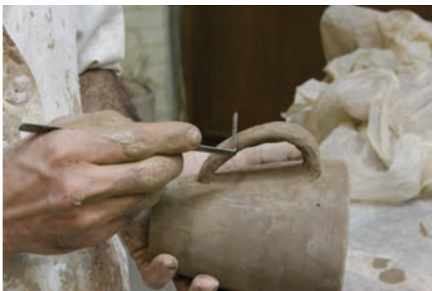
شکل ۸-۴-ک - اضافه کردن اجزای دیگر (لوله، دسته و ...)