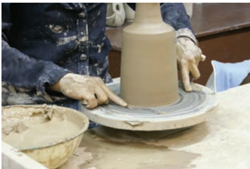
شکل ۸-۴-ط - بریدن ظرف ساخته شده با سیم یا نخ از روی صفحه