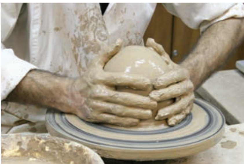
شکل ۸-۴-ج - هم مرکز کردن چانه با صفحه‌ی چرخ