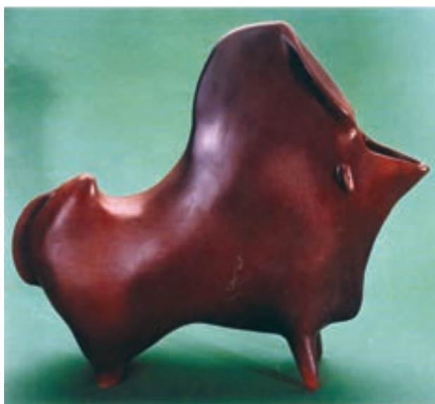
شکل ۲-۴ ب - پیکره سفالی