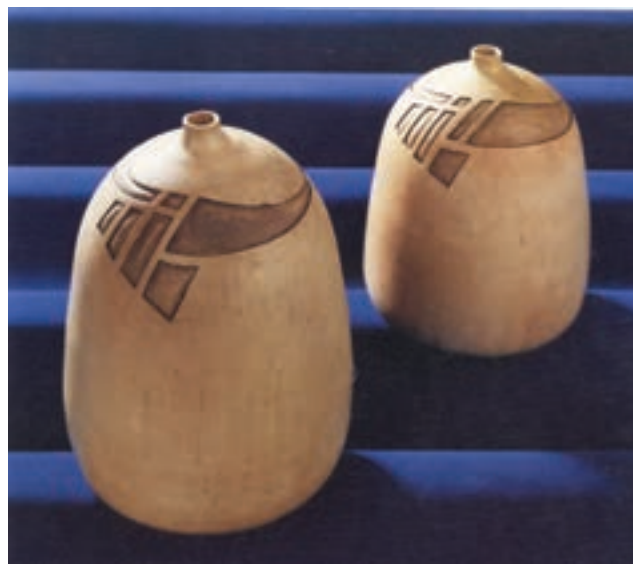
شکل ۲-۴ ج - ظروف سفالی