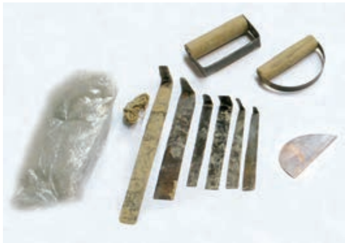
شکل ۴-۵- ابزار و وسایل شکل‌دهی بدنه‌ی گلی

(پایی یا برقی)، میز کار، ورقه‌های فلزی شکل‌دهنده، تراش‌دهنده و سایر ابزار جانبی مانند کاردک، اسفنج، سوزن (یا درفش)،