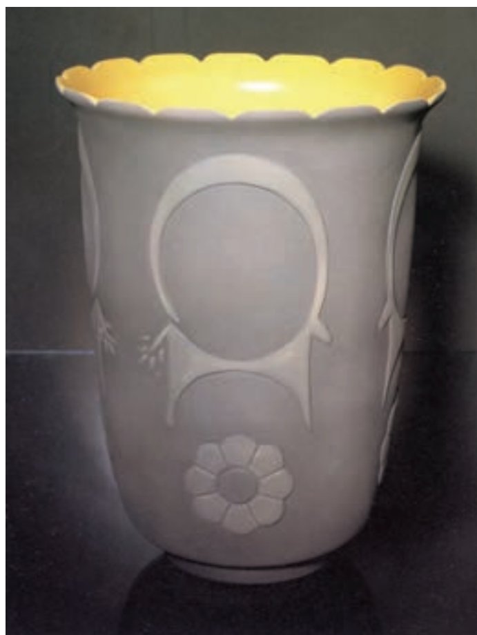
شکل ۱۱-۴-ب - تزیین به روش یک رنگ