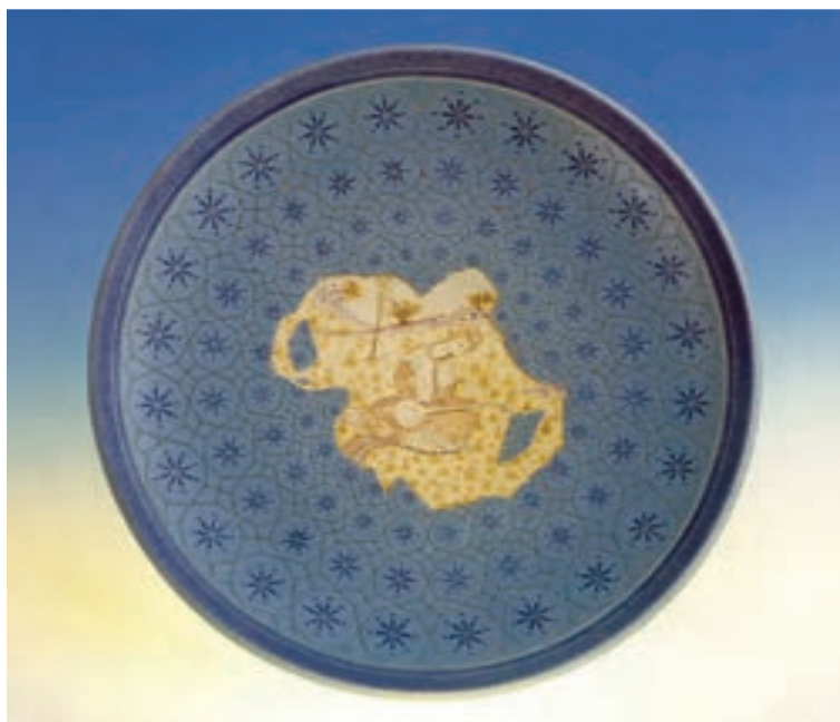
شکل ۱۱-۴-الف - تزیین به روش رو رنگی و زیر رنگی