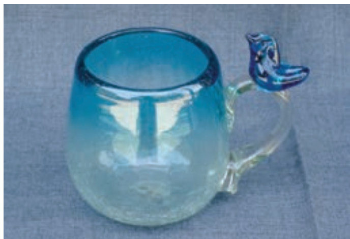
ج — لیوان دسته‌دار آبگز شده