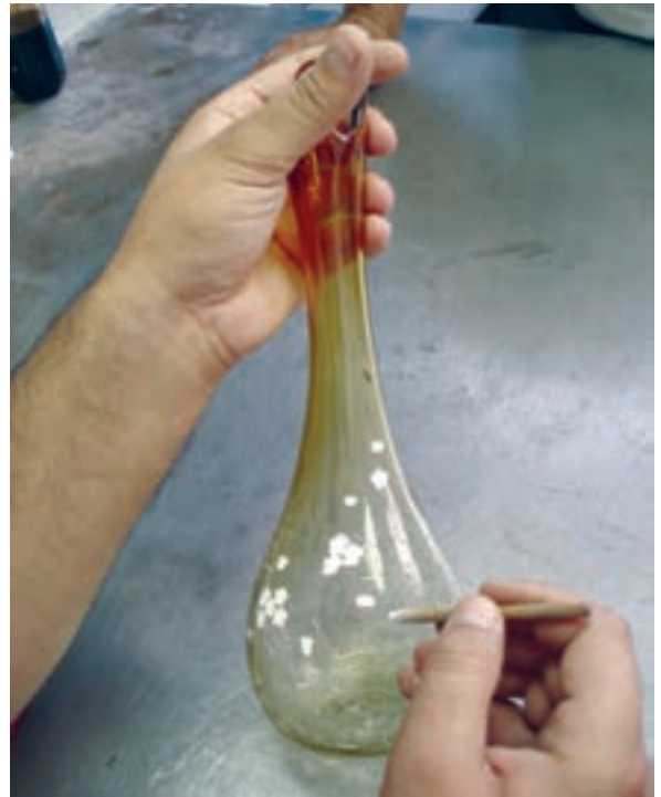
د - نقاشی روی شیشه با رنگ سفید