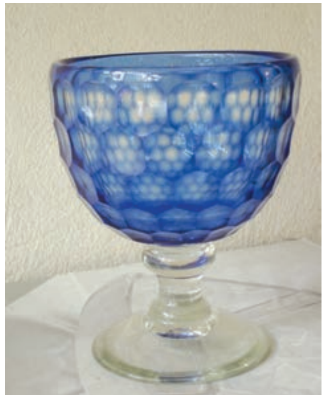
ج — شیشه دو پوست تراش خورده

شکل ۲۸-۷- انواع آثار هنری شیشه‌ای که با تلفیق روش‌های گوناگون تزیین شده‌اند