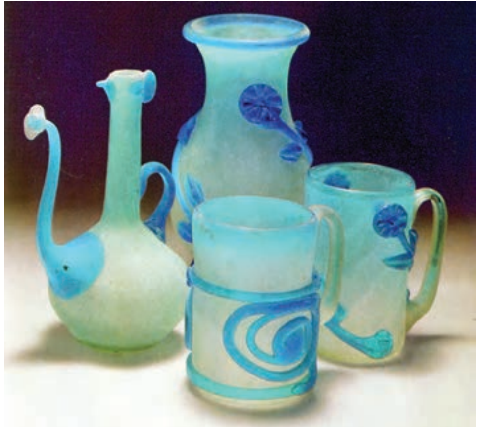
ج - پارچ و لیوان رنگی و مات