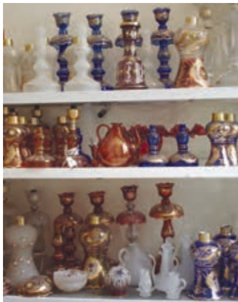
شکل ۲-۷- الف - انواع محصولات شیشه‌ای خانگی (لاله شمعدان - کاسه - گلاب‌پاش) - ب - محصولات صنعتی، شیشه در و پنجره

گلدان و ...)، شیشه‌های نشکن، کریستال، بطری و محصولات صنعتی (الیاف شیشه‌ای، در و پنجره، لوازم آزمایشگاهی و ...)