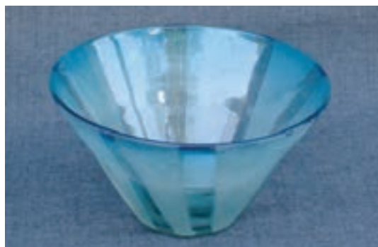
کاسه‌ی شیشه‌ای مات شده به روش ماسه پاشی (سند بلاست)