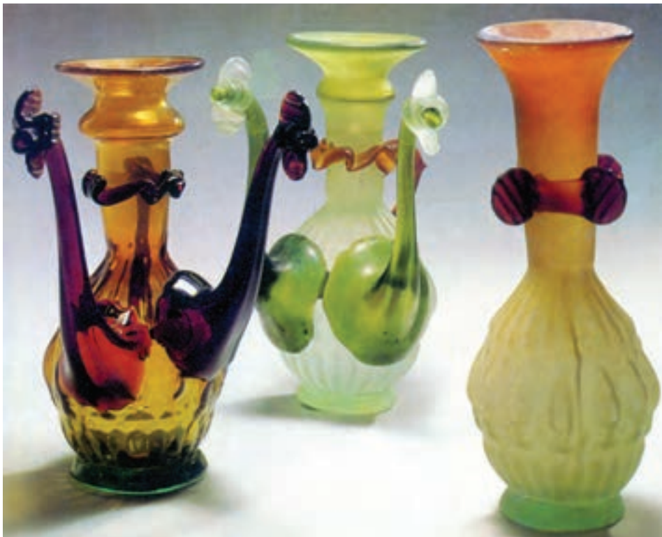
د - گلاب پاش و گلدان رنگی