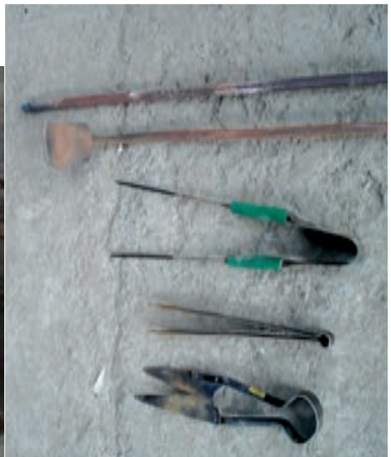
شکل ۴-۷- الف- ابزار و وسایل و تجهیزات شیشه‌گری سنتی - ب کوره شیشه‌گری سنتی