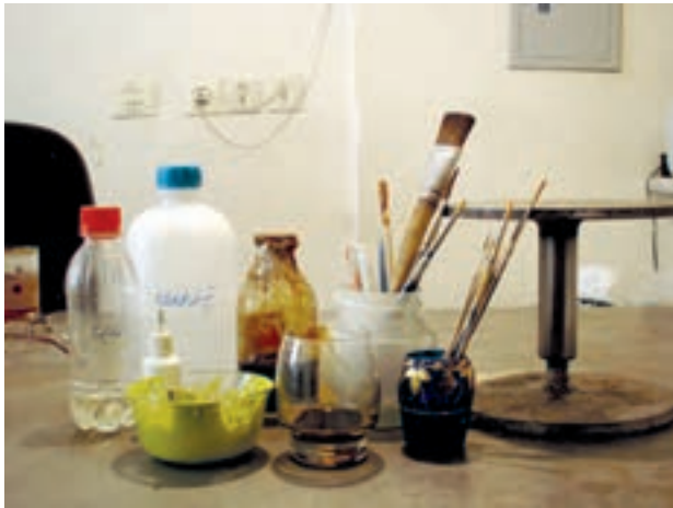
شکل ۷-۲۲- ب- ابزار و مواد اولیه‌ی نقاشی روی شیشه، رنگ آمیزی زمینه و نقش‌اندازی

— نقاشی روی شیشه: با استفاده از پودر نرم اکسیدهای رنگین (لعاب) روی شیشه‌ی ساخته شده را نقاشی کرده و سپس با