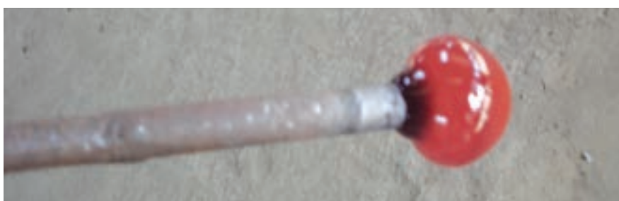
شکل ۷-۷- شکل‌دهی گوی اول