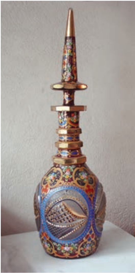
ب — شیشه‌ی تراش خورده و نقاشی شده