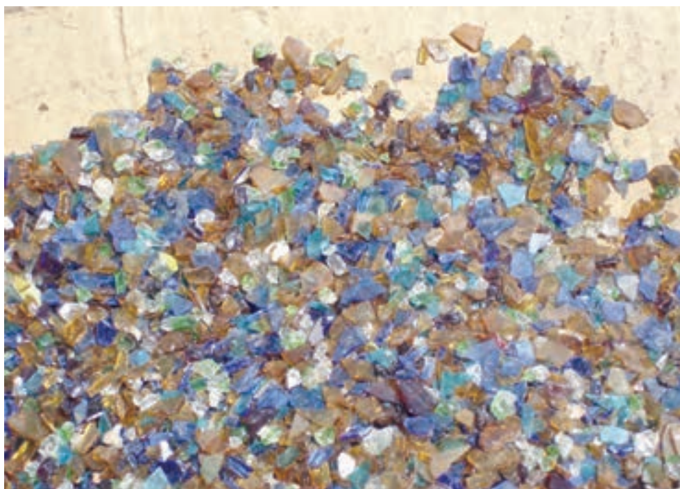
الف — خرده شیشه‌های رنگی

— شیشه‌ی رنگارنگ: هنگامی که گوی دوم را بر خرده شیشه‌های رنگی بغلطانند یا مذاب شیشه‌های رنگی را به صورت خطی بر گوی دوم به شکلی خاص قرار دهند و سپس در آن دمیده و شکل دلخواه را به وجود آورند، شیء ساخته شده (شکل ۱۸-۷-الف، ب، ج، د).