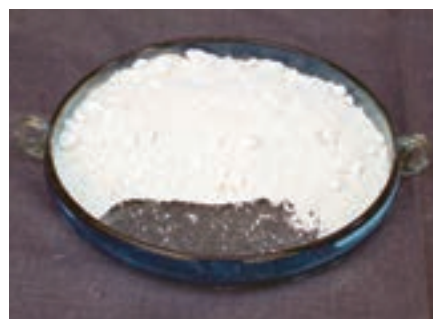
شکل ۷-۵ – بودر سیلیس

می‌برند تا مقداری شیشه‌ی مذاب که اصطلاحاً به آن بار می‌گویند بر سر آن بچسبد (شکل ۷-۶).