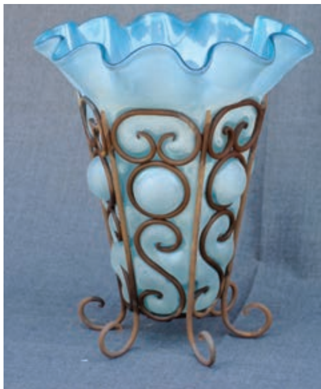
شکل ۱۹-۷-ب — تزئین به روش تلفیق شیشه و فلز آهن (مفتولی)