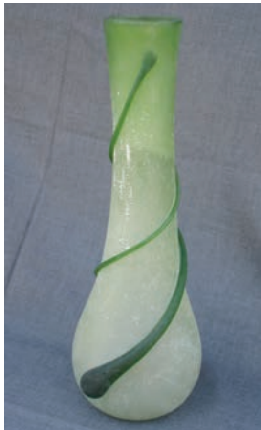
گلدان شیشه‌ای مات شده به وسیله‌ی غلطاندن در پودر سیلیس

مات کردن شیشه، نقاشی روی شیشه و تراش شیشه. - مات کردن شیشه: برای مات سازی بدنه‌ی شیشه می توان