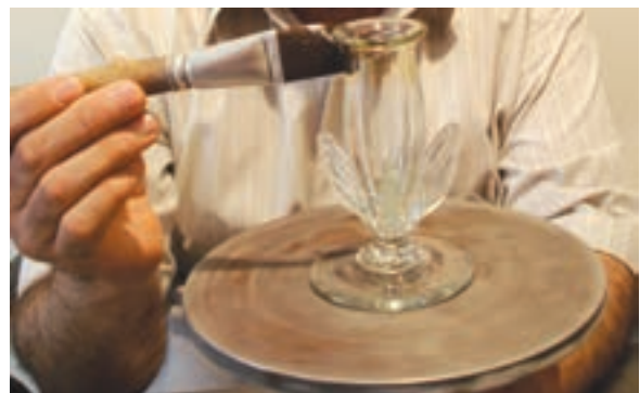
الف- رنگ آمیزی سطح بدنه