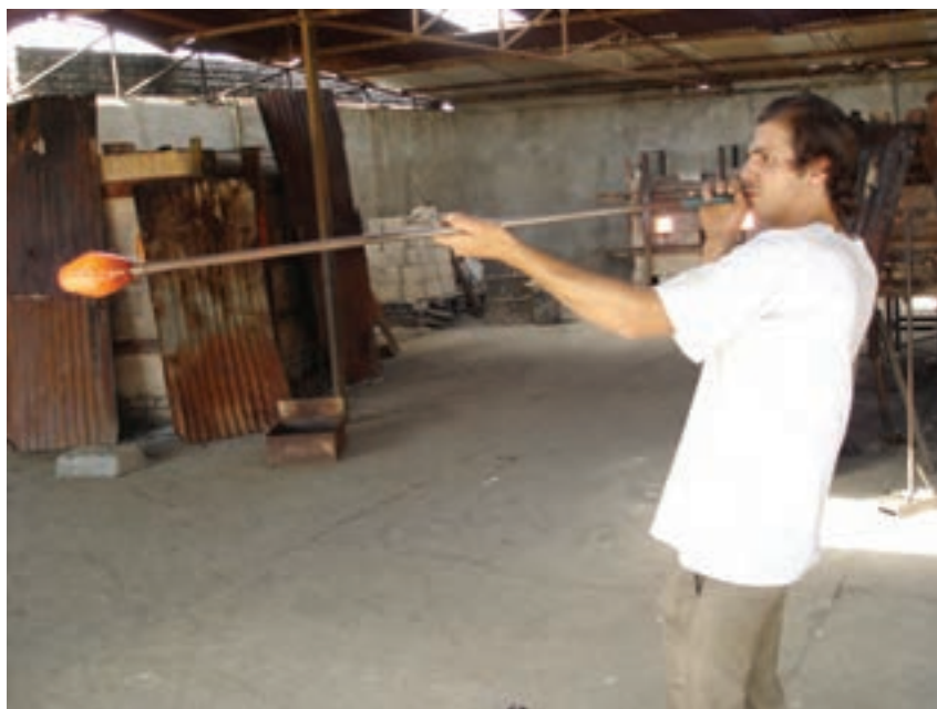
شکل ۷-۹- دمیدن در لوله‌ی دم

الف - ۱- در لوله‌ی دم به تدریج می‌دمند تا گوی به اندازه‌ی مورد نظر بزرگ شود (شکل ۷-۹).