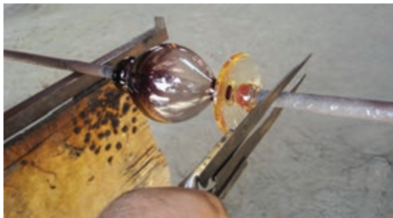
شکل ۷-۱۲- چسباندن میله‌ی واگیره به انتهای شیء ساخته شده و جدا ساختن لوله‌ی دم اولیه از سر شیء

الف - ۴- لوله‌ی دم یا میله‌ی واگیره دیگری که حاوی مقدار کمی مذاب شیشه است را به مرکز پایه‌ی شیء چسبانده و