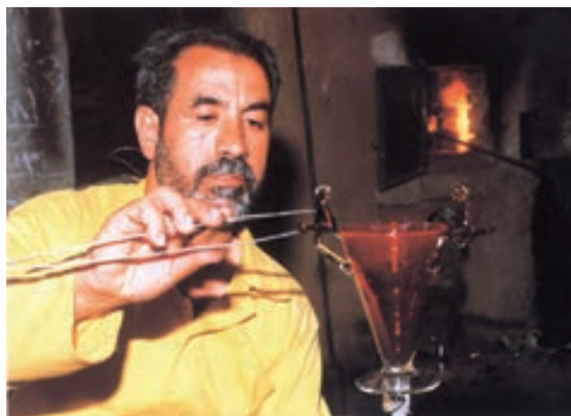
شکل ۷-۱۳- مراحل شکل‌دهی دهانه‌ی شیء