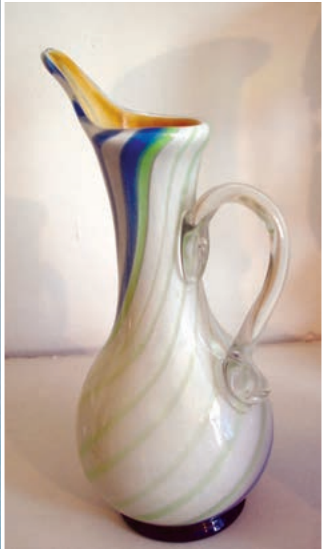
شکل ۱۷-۷. انواع شیشه‌های رنگی چند پوسته