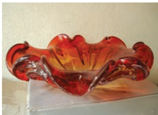
شکل ۳-۷-د - انواع محصولات گوناگون شیشه رنگی