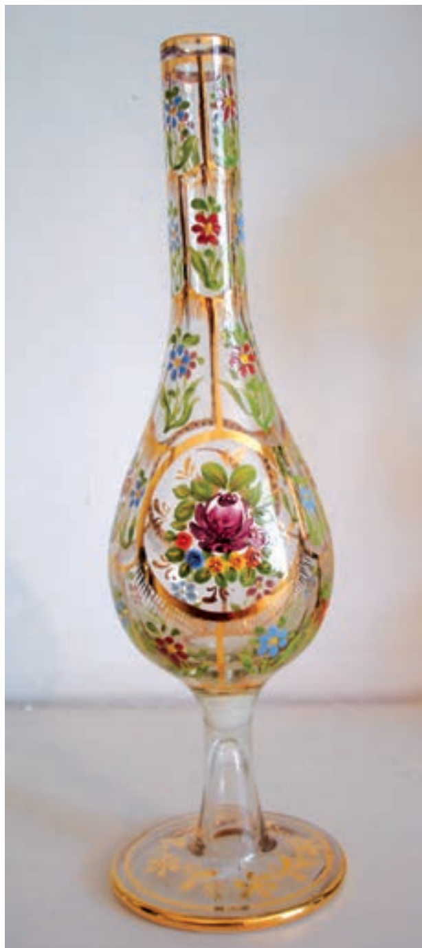
شکل ۳-۷-ج - اثر شیشه‌ای نقاشی شده