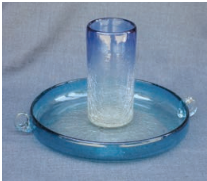
ب — لیوان و بشقاب دو رنگ شیشه‌ای آبگز شده

— آبگز کردن: پس از شکل دادن شیشه و قبل از سرد شدن کامل، برای چند لحظه آن را در آب سرد فرو می‌برند و دوباره شیء را در مقابل کوره نگاه می‌دارند تا ترک‌های ایجاد شده با حرارت کوره به یکدیگر متصل شوند (شکل ۲۰-۷-الف، ب و ج).