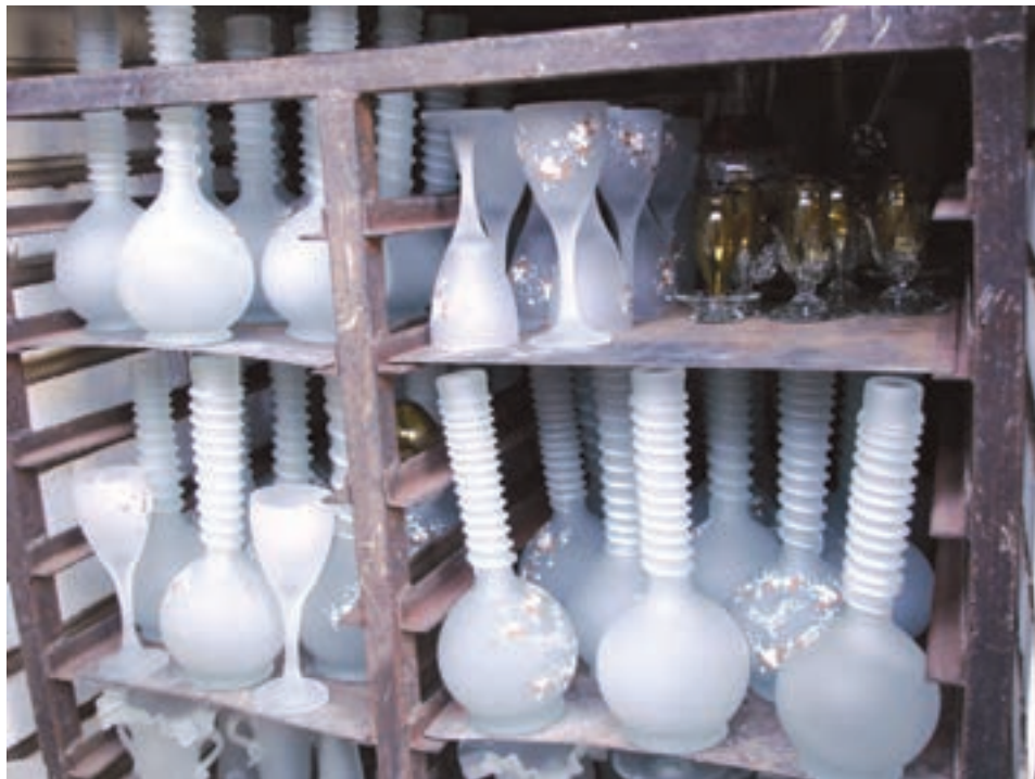
شکل ۲۴-۷ - چیدن اشیای نقاشی شده درون کوره برای پختن لعاب‌های رنگی