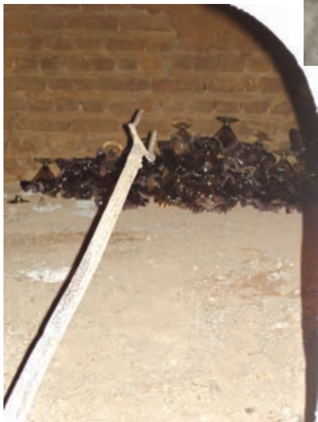
شکل ۱۶-۷ ب - انتقال شیء شیشه‌ای ساخته شده به گرمخانه