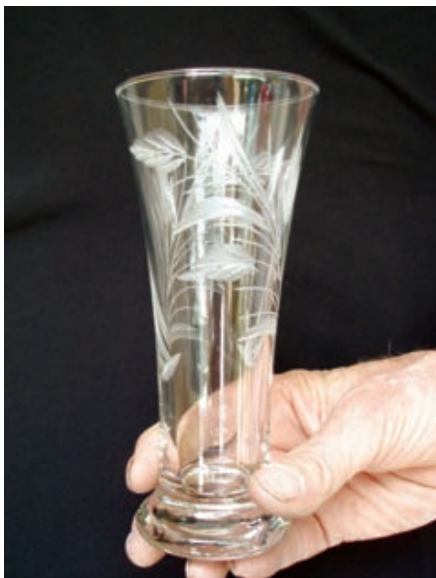
شکل ۲۷-۷- مراحل تراش شیشه با طراحی ذهنی