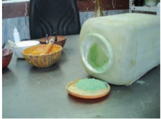
شکل ۷-۲۲- الف- مواد اولیه‌ی رنگی ویژه‌ی نقاشی روی شیشه