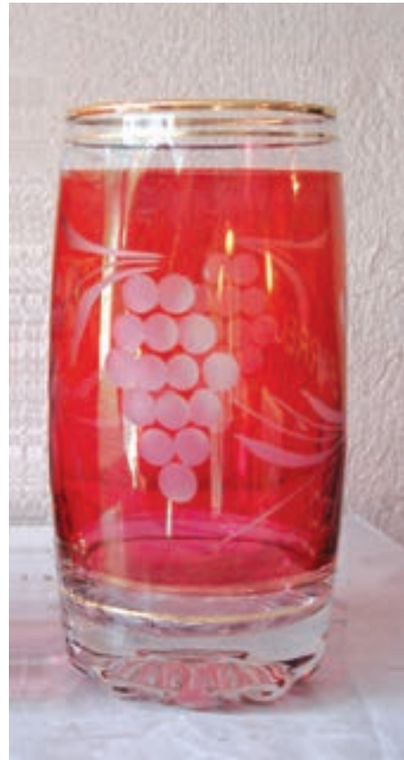
الف — شیشه‌ی رنگ آمیزی شده و سپس تراش خورده