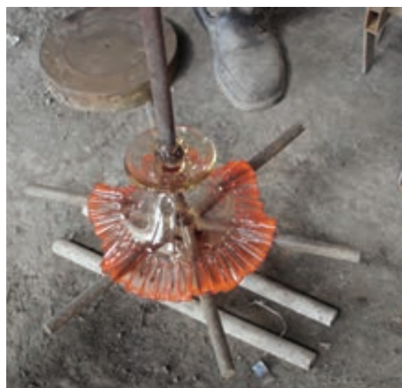
شکل ۷-۱۵- شکل دهی دهانه ی شیء با قالب پرسی (فشاری)