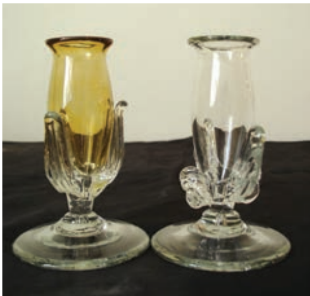
ب- شمعدان ساده و شمعدان رنگ آمیزی شده پیش از پخت