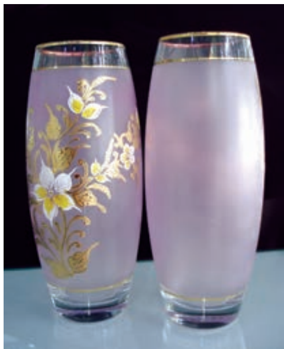
گلدان شیشه‌ای مات شده به روش آغشته کردن به مواد شیمیایی

ب- تزئین پس از ساخت: در این روش پس از ساخت شیء شیشه‌ای و سردشدن کامل، تزئینات به شیوه‌های زیر انجام می شود.