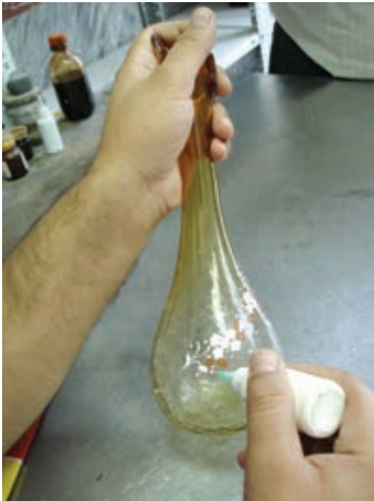
هـ - تکمیل نقاشی با رنگ‌های طلایی و غیره