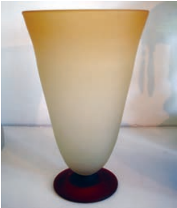
گلدان شیشه‌ای مات شده به روش شیمیایی

از مواد شیمیایی استفاده کرد تا بتواند سطح آن را مقداری حل کند. بهترین این مواد اسید فلوریدریک (HF) است. ولی امروزه از روش شن پاشی و غلطاندن در پودر نیز استفاده می کنند (شکل ۲۱-۷).