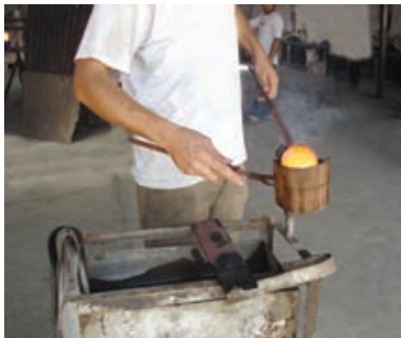
شکل ۷-۸- قاشقی کردن بار