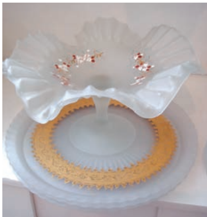
شکل ۲۵-۷- انواع ظروف شیشه‌ای تزئین شده به روش نقاشی و پخته شده