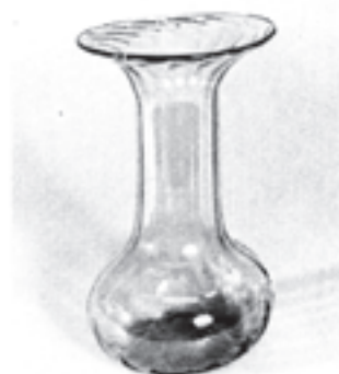
شکل ۱۴-۷- شکل‌دهی شیء به روش قالبی