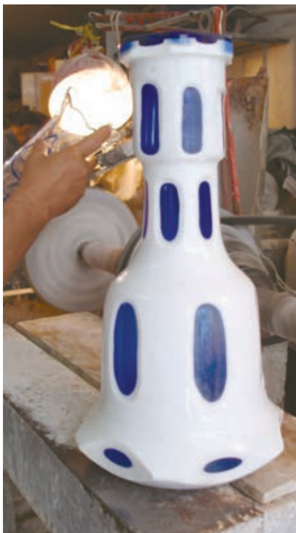
شکل ۳-۷-ب - اثر شیشه‌ای تراش خورده دو پوست