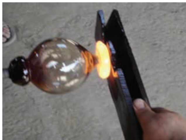
شکل ۱۱-۷- مراحل شکل‌دهی پایه شیء