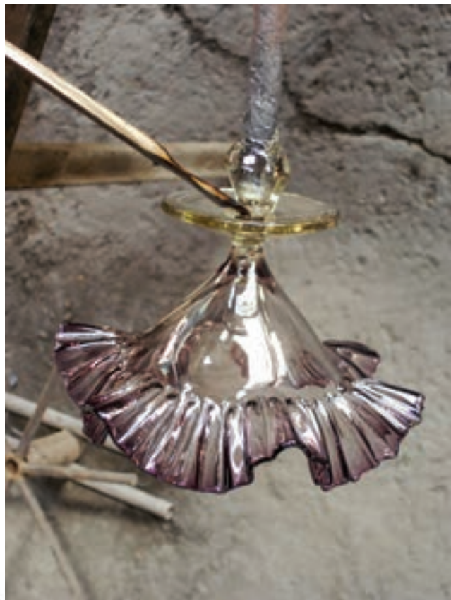
شکل ۱۶-۷ الف - جداسازی میله‌ی واگیره و گیره از انتهای شیء ساخته شده

در هر دو روش فوتی و قالبی، شیء ساخته شده را هنگامی که به گرمخانه منتقل می‌کنند با احتیاط از لوله‌ی دم جدا می‌کنند. پس از آن شیء حدود ۴۸ ساعت در گرمخانه، که دمای آن به