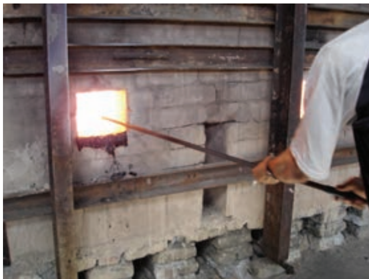
شکل ۷-۶ – مذاب شیشه در کوره (بارگیری)