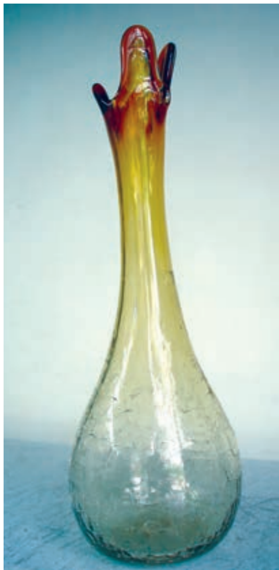
الف — گلدان آبگز شده