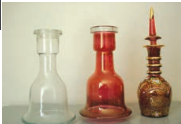
ج- ظرف شیشه‌ای ساده، رنگ آمیزی شده پس از پخت و نقاشی شده پس از پخت