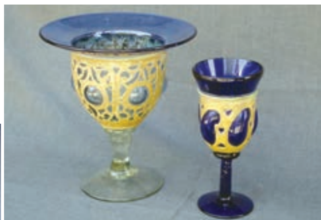
شکل ۱۹-۷-الف — تزئین به روش تلفیق شیشه و فلز مس (ورقه‌ای)