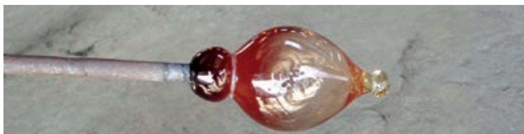
شکل ۱-۷- مراحل شکل‌دهی بدنه