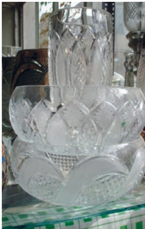
شکل ۳-۷- الف - آثار شیشه‌ای تراش خورده