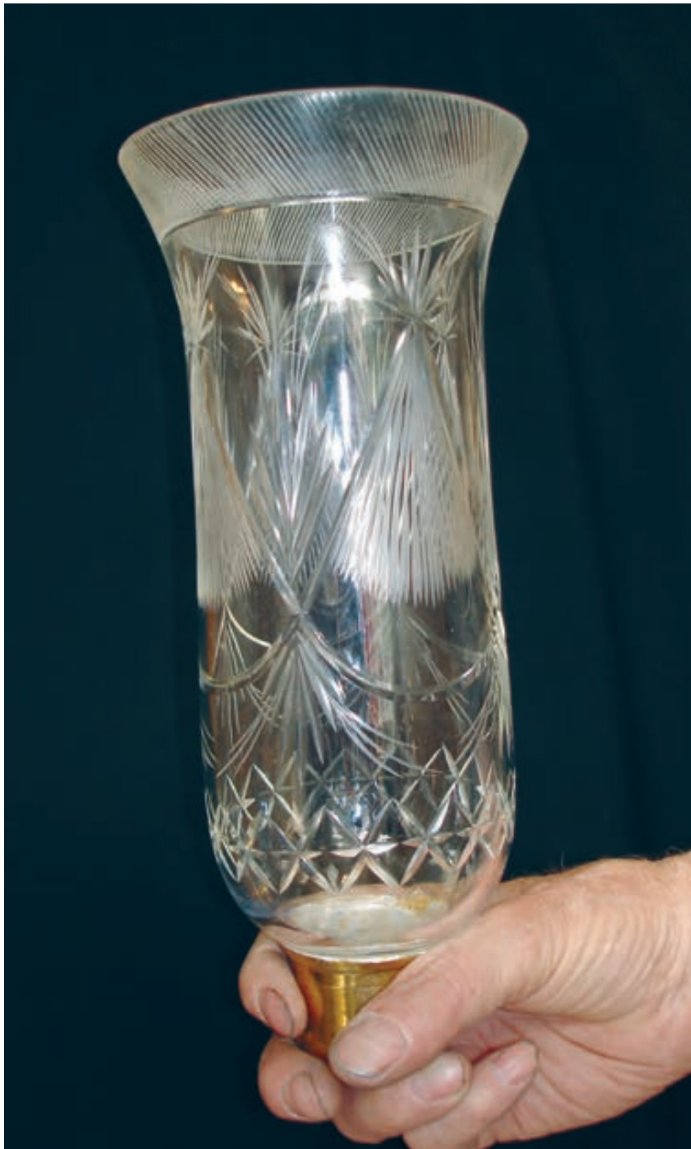
شکل ۲۶-۷- مراحل تراش شیشه با طراحی اولیه روی شیشه