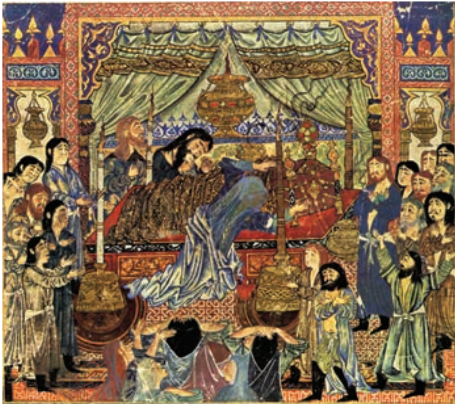
تصویر ۹-۱- مرگ اسکندر، شاهنامه فردوسی، مکتب تبریز، قرن هفتم، واشنگتن

از همین جا، پایه ی مکتب تبریز در نقاشی ایران پی ریزی شد. ارتباط ایلخانان مغول با اقوام خود در کشورهای دیگر از جمله چین، باعث نفوذ برخی از عناصر نقاشی چین در نقاشی ایرانی شد. این عوامل عبارت اند از ابرهای مواج کنگره دار و داخل هم، تنه گره دار بسیار پیچیده درختان، صخره های بلند و قله های نوک تیز و دشت های بریده و مقطع و به طور کلی نوعی منظره سازی ناهمگن با تلفیق نقاشی ایران، خصوصیات نقاشی عصر مغول را به وجود آورده است. در این دوره ارتباط پاره ای از امیران مغول با دیانت مسیح و حضور تعدادی افراد مسیحی در دربار، راه را برای نفوذ عناصر نقاشی بیزانس باز کرد. حضور این عناصر را می توانیم در نمایش چین و شکن لباس ها و به کارگیری سایه روشن در آن مشاهده کنیم (تصویر ۹-۱).