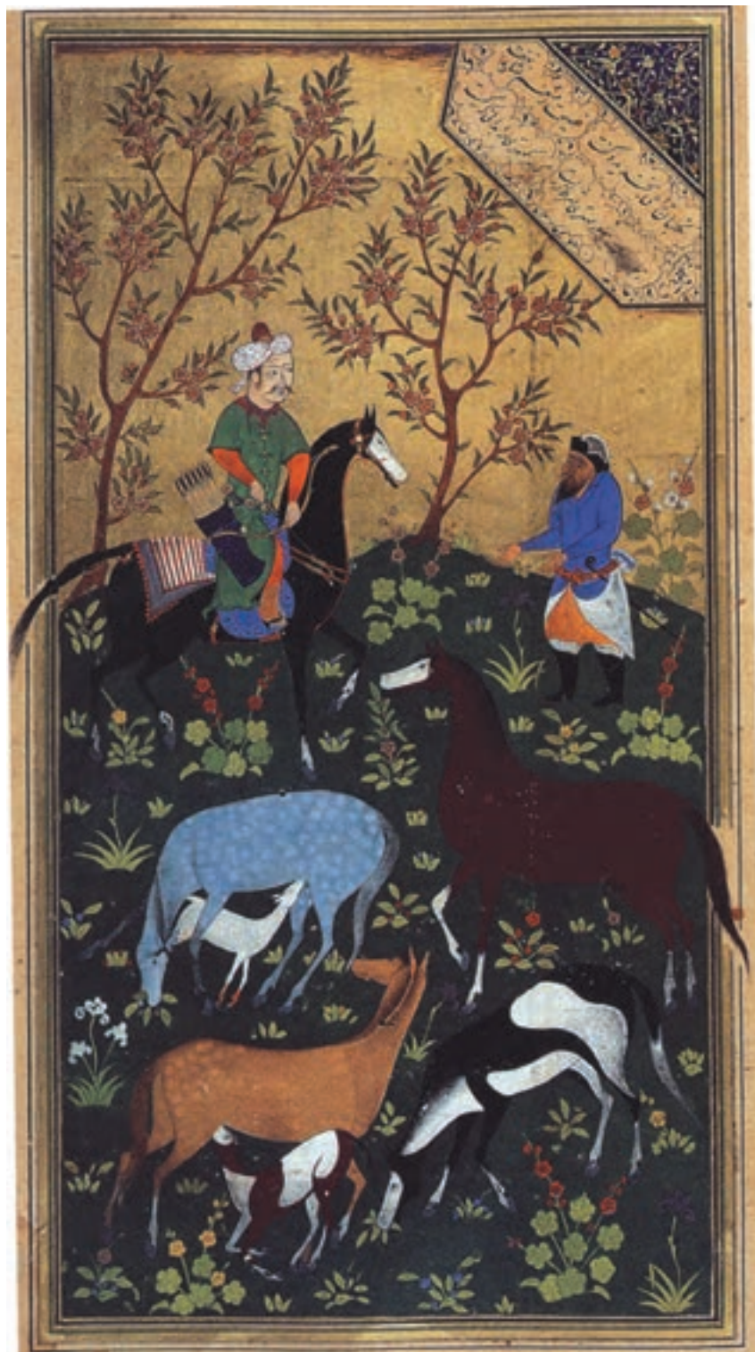
تصویر ۲۱-۱- شاه دارا و مهتر، اثر کمال‌الدین بهزاد، بوستان سعدی، قرن نهم هجری، کتابخانه عمومی مصر

رنگ‌سبز چمن بسیار پخته‌ای که گل و برگ‌های کم‌رنگ‌تر بدان تموج لطیفی بخشیده‌اند و درختان خوش طرح و رعنا و باطراوت، آسمان نیلگون که از لابه‌لای ابرها خودنمایی می‌کند، خورشید زرینی که پرتوهای درخشانش را به اطراف می‌پراکند با