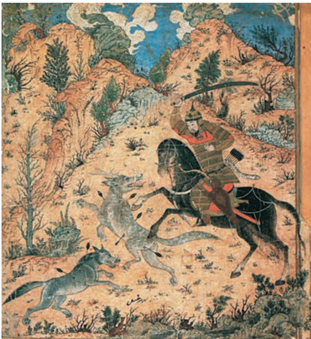
تصویر ۱۵-۱- خوان اول اسفندیار و کشتن گرگ‌ها، شاهنامه، مکتب تبریز، اواخر قرن هشتم هجری، موزه توپکاپی استانبول

دسته‌ی سوم آثاریست که تحت تأثیر هنر نقاشی چینی قرار دارد و بیش‌تر عناصر آن چینی است (تصویر ۱۵-۱).