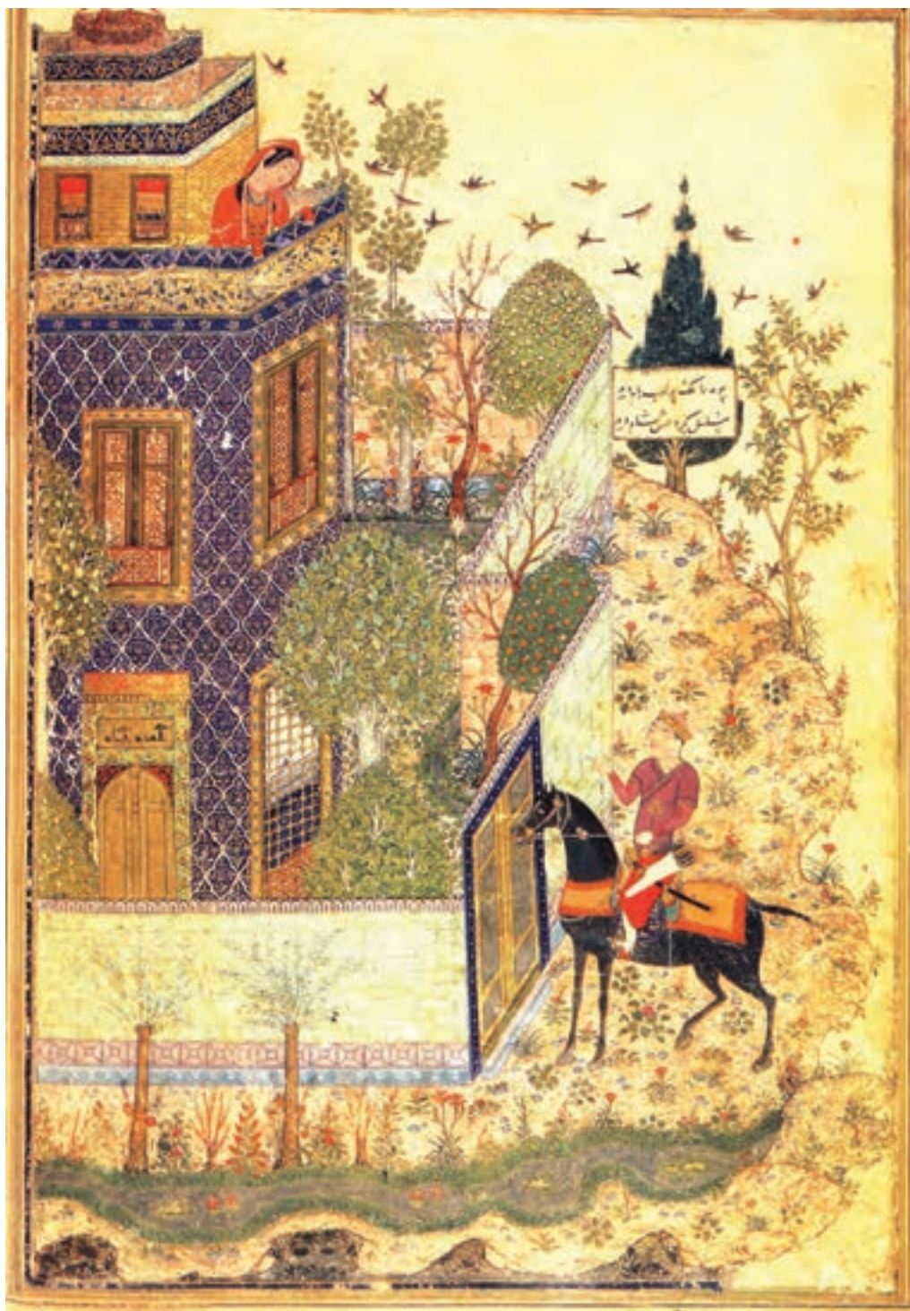
تصویر ۱۲-۱- همای و همایون، اثر جنید، مکتب جلایریان، کتاب خمسه‌ی خواجوی کرمانی، قرن هشتم هجری، موزه بریتانیا

عناصر را با ذوق خلاق ایرانی درهم آمیخته و اثری از نفوذ عوامل بیگانه در آن دیده نمی‌شود (تصویر ۱۳-۱).