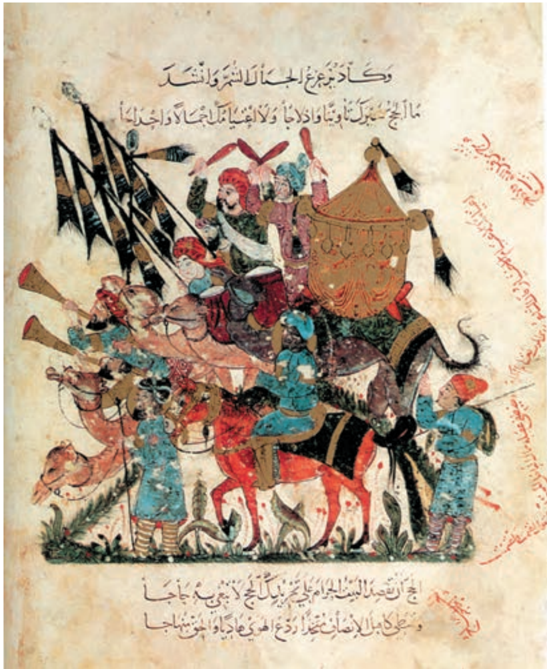
تصویر ۸-۱- کاروان حجاج، مقامات حریری، نقاش یحیی بن واسطی، مکتب بغداد، اواخر قرن ششم، کتابخانه ملی پاریس

وجه تمایز آثار مکتب بغداد و آثاری که در مراکز مختلف تحت تسلط سلجوقیان به وجود آمده در این است که چهره‌های تصاویر مراکز مختلف سلجوقیان به آثار مانویان و ساسانیان بیش‌تر شبیه‌اند. این چهره‌ها، با لباس‌های رنگارنگ همراه با تزیینات گل و برگ و نقوش هندسی و غیر هندسی بوده و شخصیت‌ها دارای گیسوان بلند بافته شده و با کلاه‌های شبیه به نیم‌تاج، مصور شده‌اند. شاید یکی از زیباترین تصاویری که در مکتب بغداد به تصویر