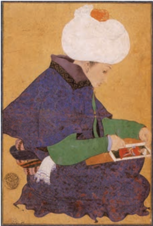
تصویر ۲۵-۱- چهره یک هنرمند، اثر بهزاد، تقلید از روی اثر بلینی (۷سال بعد) قرن نهم هجری و اشنگتن

آثار بهزاد تأثیر پذیرفته بود. تداوم نقاشی‌های بهزاد همراه با خصوصیات نقاشی محلی بخارا، مجموعاً خصوصیات نقاشی بخارا را به وجود آوردند. خصوصیات از قبیل غنی بودن و خلوص رنگ‌ها که بیش‌تر به کارگیری جزئیات و استفاده از شکل‌های ساده، پیکره‌های کوتاه قد و ساختمان‌ها از روبه‌رو را شامل می‌شد. نقاشی‌های مکتب بخارا اغلب جدا از متن کتاب تهیه می‌شدند و سپس به کتاب الحاق می‌گردیدند.