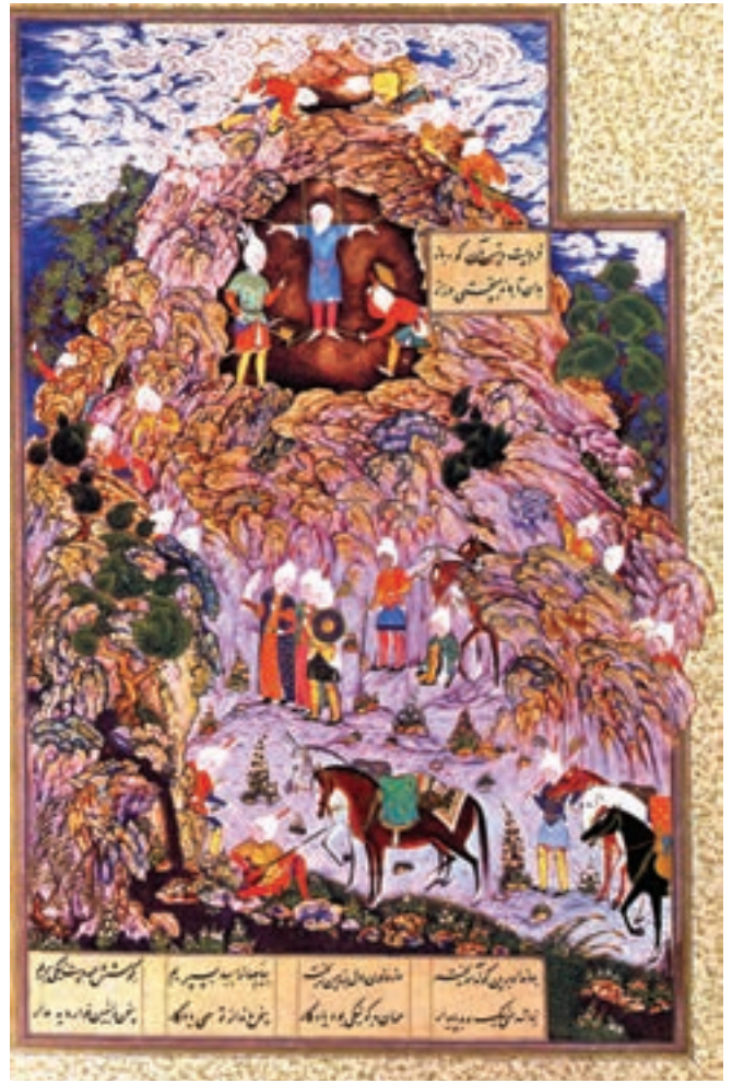
تصویر ۲۲-۱- مرگ ضحاک، شاهنامه، اثر سلطان محمد، قرن نهم هجری، موزه بریتانیا

در آثار بهزاد از عناصر نقاشی چینی یا بیزانس کم‌تر اثری می‌توان یافت. او حتی از به کار بردن نقش ابر در نقاشی‌های خود دوری می‌جست تا حتی الامکان از عناصر نقاشی چینی پرهیز