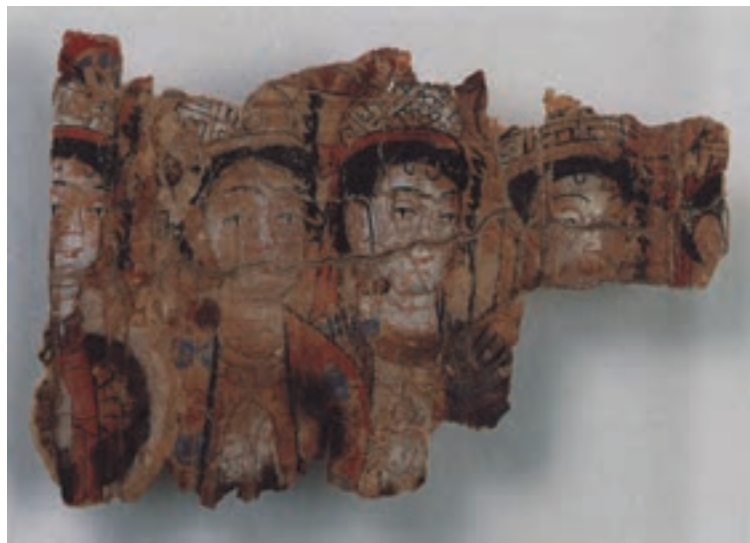
تصویر ۴-۱- چهار زن، تصویرسازی روی کاغذ، تورفان غرب ترکستان چین، قرن اول و دوم هجری، موزه برلین

بنابر اعتقاد مانویان، هرچه زیباست قابل پرستش نیز هست و این همان موضوعی است که باعث شد تا نگارگری ایرانی دارای جنبه‌های تزئینی بیش‌تری گردد. وظیفه‌ی هنر نقاشی در دوران مانویان این بود که توجه را به عالم بالاتر جلب نماید و عشق و ستایش را به سوی فرزندان نور متوجه سازد و نسبت به زاده‌های تاریکی ایجاد نفرت نماید، به همین دلیل، «تذهیب» در کتاب‌های مذهبی مانویان رواج بسیار یافت. در حقیقت تذهیب، صحنه‌ای از نمایش آزاد کردن نور و روشنایی به حساب می‌آید. مانویان برای نمایش نور در آثار خود از فلزات گرانبها چون طلا و نقره استفاده می‌کردند. به کار بردن فلزات گرانبهایی چون طلای زرد، سفید و نقره که به فراوانی در نقاشی‌های ایرانی و همچنین در تذهیب‌های اسلامی متداول گردید ادامه مستقیم سنت هنر مانویان است (تصویر ۴-۱).