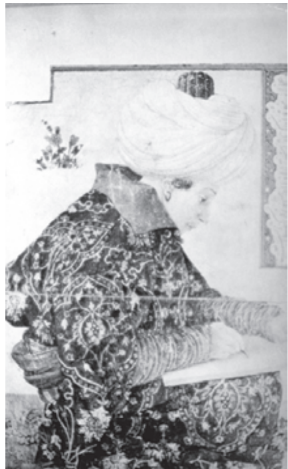
تصویر ۲۴-۱- چهره یک هنرمند، اثر جنتیل بلینی، در دربار عثمانی، قرن نهم هجری

معمولاً زمینه‌ی حاشیه‌های این تصاویر را با تشعیر پر می‌کردند ۱ (تصاویر ۲۶-۱ و ۲۷-۱).