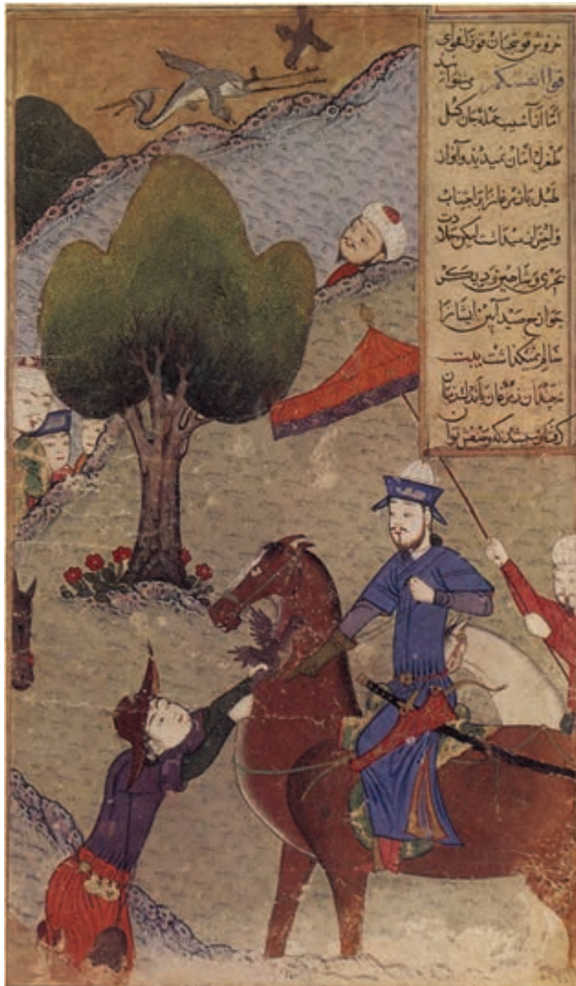
تصویر ۱۶-۱- شکار تیمور، ظفرنامه یزدی، آبرنگ و مرکب و طلا روی کاغذ، نقاش یعقوب بن حسن، مکتب شیراز قرن نهم هجری مجموعه خصوصی

در نقاشی‌های مکتب شیراز، موضوع اصلی انسان است و عناصر دیگر، تابع آن نقش و تنها به‌عنوان تزیین و پر کردن فضاهای خالی تصویر به‌کار گرفته شده‌اند. علاوه بر آن عناصر دیگری مانند به‌کار گرفتن جداول و نوعی رنگ‌آمیزی موزون و