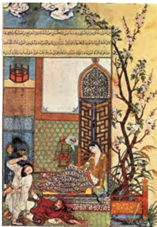
تصویر ۱۴-۱ غافلگیر شدن دزد، کلبله و دمنه، مکتب تبریز، قرن هشتم هجری، استانبول

دسته‌ی دوم آثاریست که با به کارگیری پاره‌ای عناصر نقاشی چینی و عناصر نقاشی ایرانی درهم آمیخته و آثاری به وجود آورده‌اند که با حفظ سنت نقاشی ایرانی، نفوذ عناصر نقاشی چینی در آن مشخص است (تصویر ۱۴-۱).