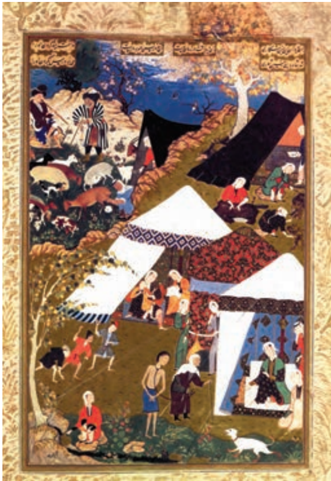
تصویر ۲۳-۱- مجنون در زنجیر، خمسه نظامی، اثر میر سید علی، قرن دهم هجری، کتابخانه بریتانیا

کرده باشد. شیوهی نقاشی بهزاد، پس از او دنبال شد و شاگردان او به اشاعه‌ی تحولات کارهای استاد همت گماشتند (تصاویر ۲۲-۱ و ۲۳-۱).