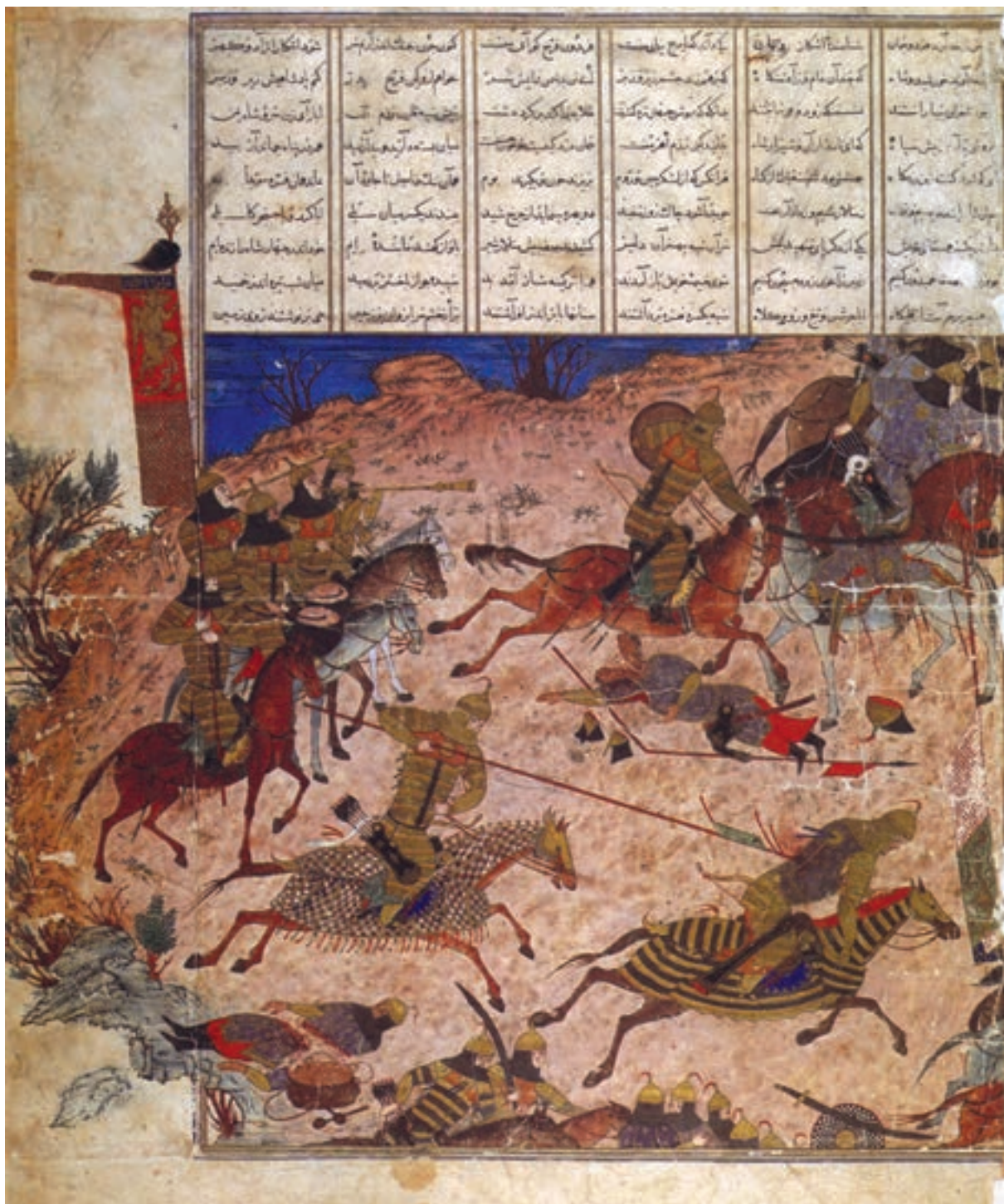
تصویر ۱۱-۱- نبرد شاه منوچهر با تورانیان، شاهنامه، مکتب تبریز، قرن هفتم هجری، موزه توپکاپی استانبول

وجه تمایز آن با نقاشی‌های مکتب تبریز عهد مغول، کوچک شدن تصاویر انسان است که تابع نقش منظره، طبیعت و مناظر نقاشی شده در اثر می‌باشد. تزئینات معماری که در دوره‌ی مغول آغاز گشته بود در این دوره ادامه یافت و ما شاهد تزئینات ظریف کاشی کاری و گره چینی در ساختمان‌های این دوره هستیم (تصویر