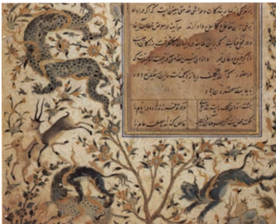
تصویر ۲۶-۱- تشعیر، اثر آقا میرک، خمسه نظامی، قرن دهم هجری، موزه بریتانیا