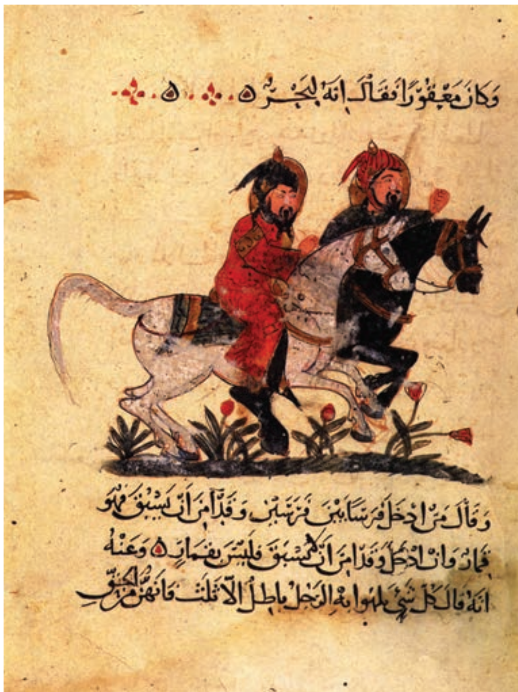
تصویر ۱-۷- دو سوارکار، کتاب البیطار (نگهداری چهارپایان)، نقاش احمد بن احنف، مکتب بغداد، قرن ششم هجری موزه توپکاپی استانبول

مکتب بغداد با وجود داشتن این نام، هرگز یک مکتب عربی خالص نیست، چرا که بسیاری از کتب خطی مصور شده در این دوره، در مراکز دیگر که تحت تسلط سلجوقیان بوده مصور شده است. ولی براساس آنچه درباره‌ی نام مکاتب گفته شد و بر طبق مرکزیت اصلی بغداد، این گونه نقاشی‌ها را تحت عنوان کلی «مکتب بغداد» نام نهادند. ویژگی‌های مهم نقاشی‌های این دوره که نمونه‌های آن بر روی کتب خطی انجام شده جزئی از متن کتاب