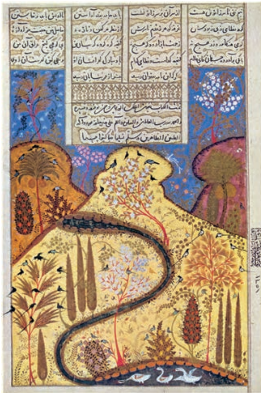
تصویر ۱۷-۱- جویبار، بهبهان، از کتاب گلچین اشعار، قرن هشتم هجری، موزه اسلامی استانبول

در دوره تیموری هنر نقاشی در شهرهای دیگر نیز رواج یافته ولی چون این رواج اندک بود، تنها به ذکر مراکز عمده اکتفا می‌شود. شهرهایی مثل یزد، مشهد، کرمان، سمرقند، نیشابور و... که هر کدام شیوه‌ای از نقاشی را در طول تاریخ به نام خود ثبت کرده و تا حدودی تحت نفوذ دگرگونی‌های حاصله از مرکز به وجود آوردند. از این شهرها می‌توان به بهبهان اشاره کرد که شیوه‌ای خاص را به خود اختصاص داده، در این شیوه، هنرمند سعی کرده است که تنها از مناظر طبیعی مانند کوه، درخت، آسمان، گل