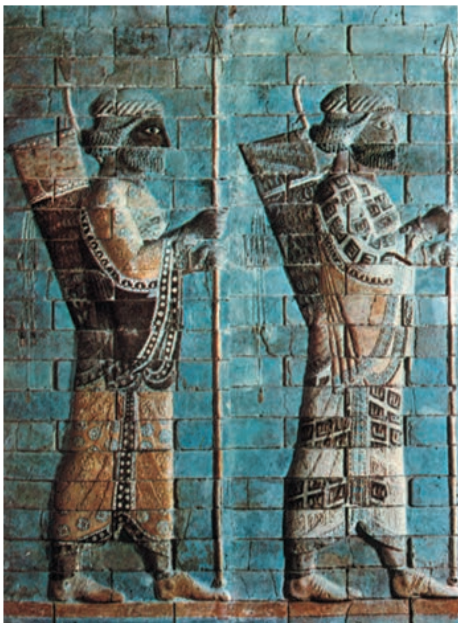
تصویر ۱-۱- سربازان جاویدان هخامنشی، کاشی لعابدار، آپادانای شوش، قرن چهارم و پنجم قبل از میلاد، موزه‌ی لوور

که با رنگ‌های اُخرایی، گل ماشی و سیاه منقوش شده بود. کشف جام‌ها، سفال‌ها، مفرغ‌ها و آثار کهن هنر ایران در گوشه و کنار کشور، تداوم هنر نگارگری ایرانی را به خوبی نشان می‌دهد. آثار دیگری که در تپه‌ی سیلک، چشمه علی، زیویه، مارلیک و دیگر نقاط به دست آمده نمایشگر ترقی فوق‌العاده هنرهای تصویری ایران باستان است. دوره‌های مختلف هنری ایران، مسیر خود را طی کرد تا اندک‌اندک زمینه‌ی پیدایش هنر نقاشی عصر هخامنشیان فراهم گردید. در عصر هخامنشیان کاخ‌ها و پرستش‌گاه‌ها به وسیله‌ی نقوش تزئینی و نقاشی روی گچ، تزئین می‌گردید، همچنین