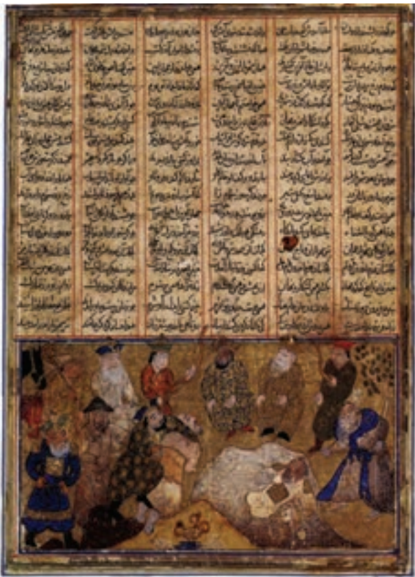
تصویر ۶-۱- افراسیاب، آبرنگ، مرکب و طلا روی کاغذ، شاهنامه، مکتب بغداد، اواخر قرن ششم هجری، مجموعه خصوصی

هنرمندان ایرانی در این دوره، کتاب‌هایی را مصور می‌کردند که موضوعاتی چون شرح حال شاهان ایرانی، دیوان‌های شعر، اخلاقیات، طب و علوم را دربر می‌گرفت. از آن جمله می‌توان به شاهنامه‌ی فردوسی اشاره کرد. (شاهنامه فردوسی بیش‌ترین آثار نقاشی و تصویرگری را در دوران‌های مختلف به خود اختصاص داده است) (تصویر ۶-۱).