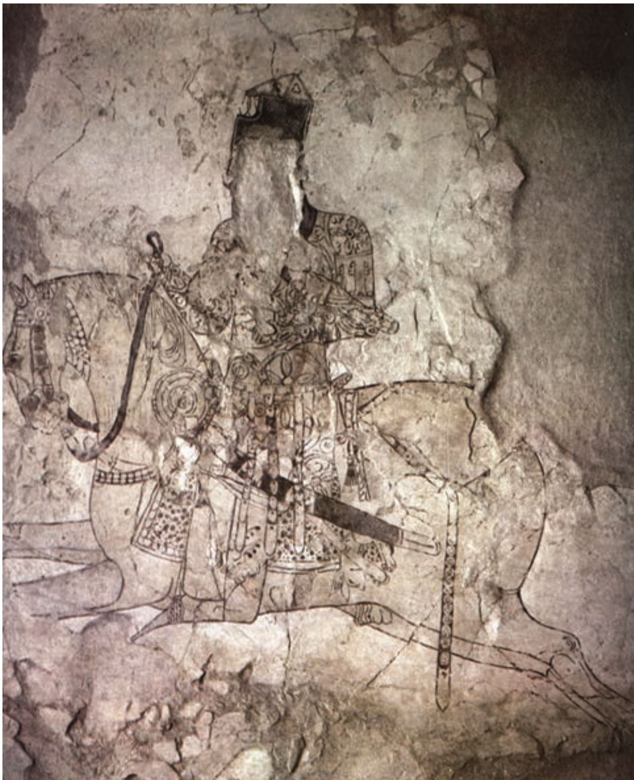
تصویر ۱-۳- شکارچی سوار بر اسب، نقاشی دیواری، کاخ سبزه‌پوشان نزدیک نیشابور، قرن دوم و سوم هجری، گنجینه هنرهای ملی

همان رنگ استفاده شود. کم کم نازکی و ضخامت در قلم گیری به وجود آمد و خطوط یکنواخت مشکی جای خود را به خطوط رنگی نازک و ضخیم داد. بدین شکل که خطوط اصلی و محل های