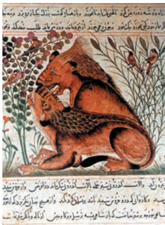
تصویر ۱۳-۱ دو شیر، منافع الحيوان نوشته ابن بختيشوع، محل تولید اثر مراغه، قرن هفتم هجری، کتابخانه مورگان نیویورک

دسته‌ی دوم آثاریست که با به کارگیری پاره‌ای عناصر نقاشی چینی و عناصر نقاشی ایرانی درهم آمیخته و آثاری به وجود آورده‌اند که با حفظ سنت نقاشی ایرانی، نفوذ عناصر نقاشی چینی در آن مشخص است (تصویر ۱۴-۱).