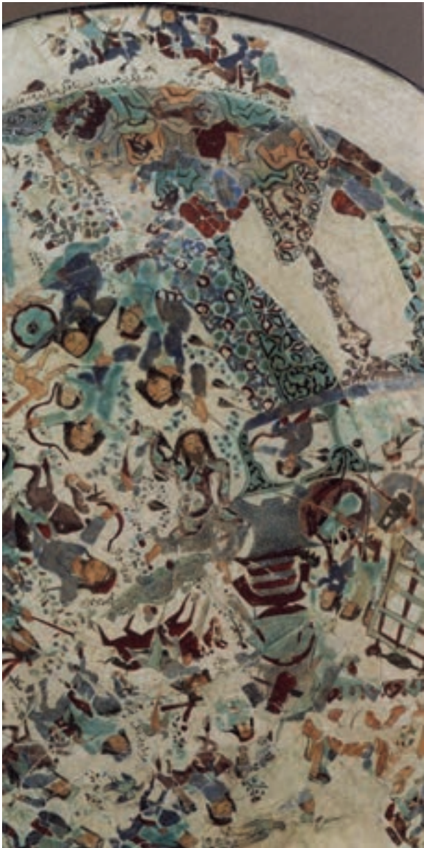
تصویر ۵-۱- صحنه جنگ، بخشی از یک بشقاب سرامیک مینایی، دوره سلجوقی، قرن ششم هجری، واشنگتن

کاشی‌ها نقاشی کنند. این سفال‌ها به علت قلم‌گیری‌های ظریف و لعاب‌کاری عالی آن به سفال‌های مینایی شهرت پیدا کرده است (تصویر ۵-۱).