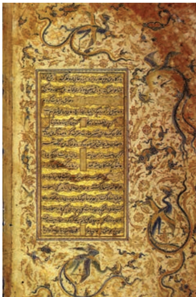
تصویر ۲۷-۱- تشعیر، اثر آقا میرک، خمسه نظامی، قرن دهم هجری، موزه بریتانیا