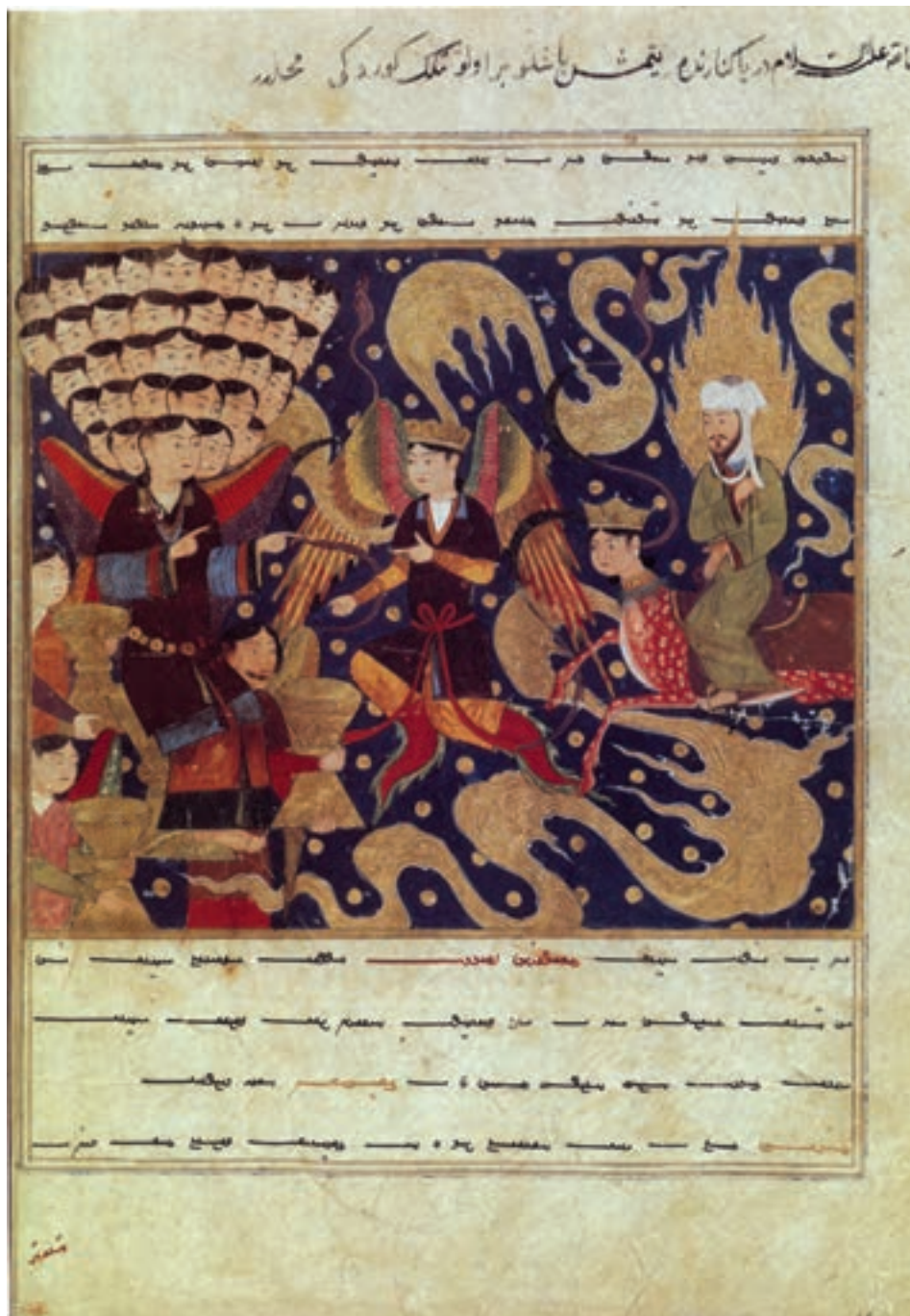
تصویر ۱۹-۱- معراج حضرت رسول، اثر میرحیدر، کتاب معراج‌نامه، مکتب هرات یا سمرقند، اوایل قرن نهم هجری، کتابخانه‌ی ملی پاریس

پس از تیمور پسرش شاهرخ که در زمان حیات پدر، در خراسان حکمرانی می‌کرد با تشویق صنعتگران و دانشمندان در مقرر حکومتی خود مرکز فرهنگی مهمی به‌وجود آورد. به‌طوری که شهر مشهد در آن روزگار یکی از مراکز معتبر هنری به‌شمار می‌رفت. شاهرخ هرات را به پایتختی برگزید و هنرمندان را از گوشه و کنار کشور به هرات دعوت کرد. پس از انتقال پایتخت شاهرخ به هرات، این شهر مرکز بزرگی در زمینه‌ی هنرهای گوناگون