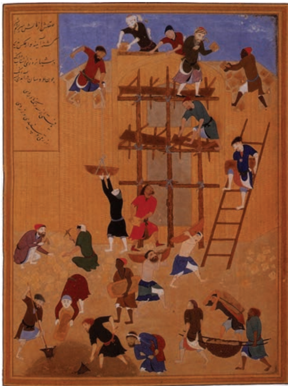
تصویر ۱-۲۰- ساخت کاخ خورتق، اثر کمال‌الدین بهزاد از مجموعه آثار خمسه نظامی، قرن نهم، کتابخانه ملی انگلیس

ایرانی‌ست. در این دوره هنرمندان که از تجسم واقعی احجام چشم پوشیده بودند با به کار گرفتن شکل‌های زیبا و دلنواز و هماهنگ و با استفاده از فضاهای روحانی در آثار خود، به دستاوردهای ویرای تصاویر نقاشی شده دست یافتند. این تصاویر با ویژگی‌هایی چون نداشتن سایه و روشن و عمق نمایی در تابلو و استفاده از جزییات بی‌شمار، نظر هر بیننده‌ای را به خود جلب می‌نماید. رنگ‌آمیزی در نقاشی‌های مکتب هرات، معرف تکامل فوق‌العاده‌ی این فن در هنر این دوره است. در این دوره، هنرمندی