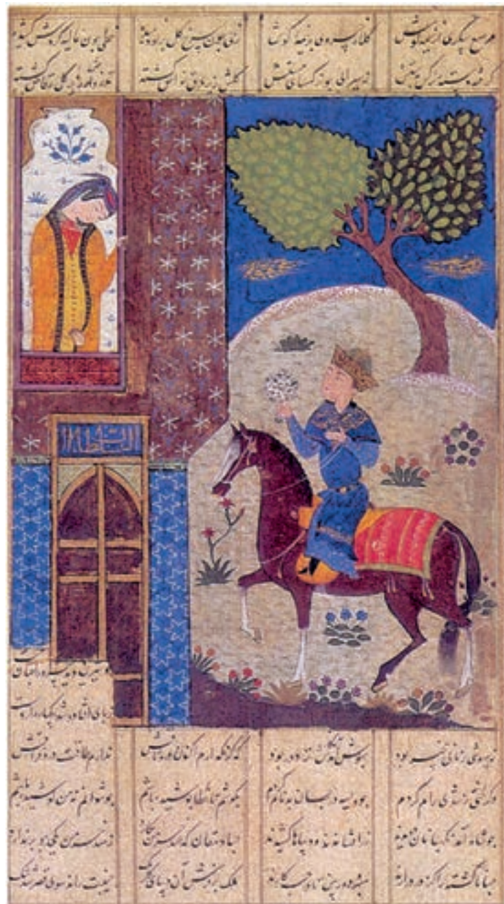
تصویر ۱۸-۱ خسرو با دسته گلی در کنار قصر شیرین، خمسه‌ی نظامی، اوایل قرن نهم هجری، دوره‌ی تیموری، مجموعه خصوصی

خود با نقاشی دیواری تعدادی از هنرمندان را به کار گرفته بود. اما به علت علاقه‌ی فراوان تیمور به هنر کتاب‌آرایی (نقاشی، تذهیب، تشعیر، جلدسازی، صحافی، خوشنویسی و...) و حمایت از این گونه هنرها مخصوصاً در پایتخت، هنر نقاشی دیواری رواج چندانی نیافت. آثاری که از نقاشی سمرقند باقی مانده تقلیدی از نقاشی چینی است حتی تعدادی از تصاویر، با مرکب چینی و با تکنیک نقاشی چینی اجرا شده است (تصویر ۱۸-۱).