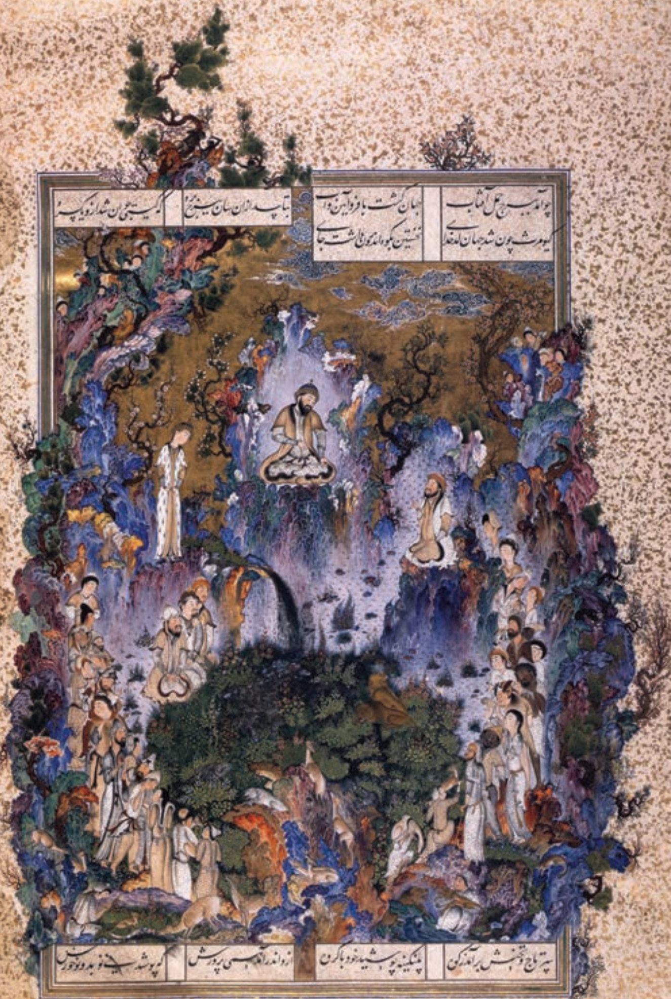
تصویر ۵- بارگاه کیومرث اولین شاه، شاهنامه شاه طهماسب، اثر سلطان محمد، مکتب تبریز در دوره دوم، قرن دهم هجری، مجموعه خصوص، ژنو