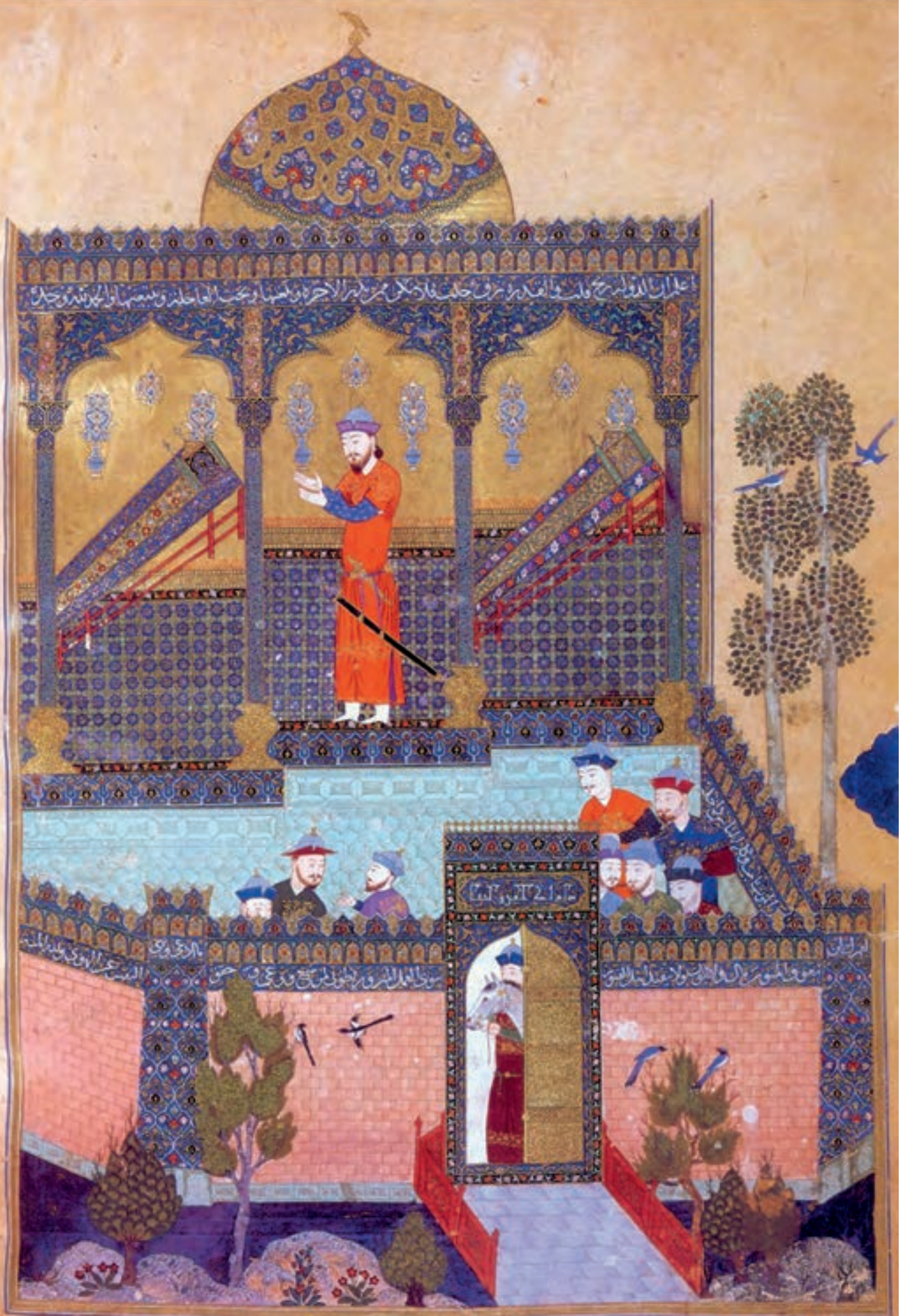
تصویر ۱- سوگواری فرامرز بر سر تابوت پدر و عمویش زواره، شاهنامه بایسنقری، سال ۸۳۳ هجری قمری، کاخ گلستان