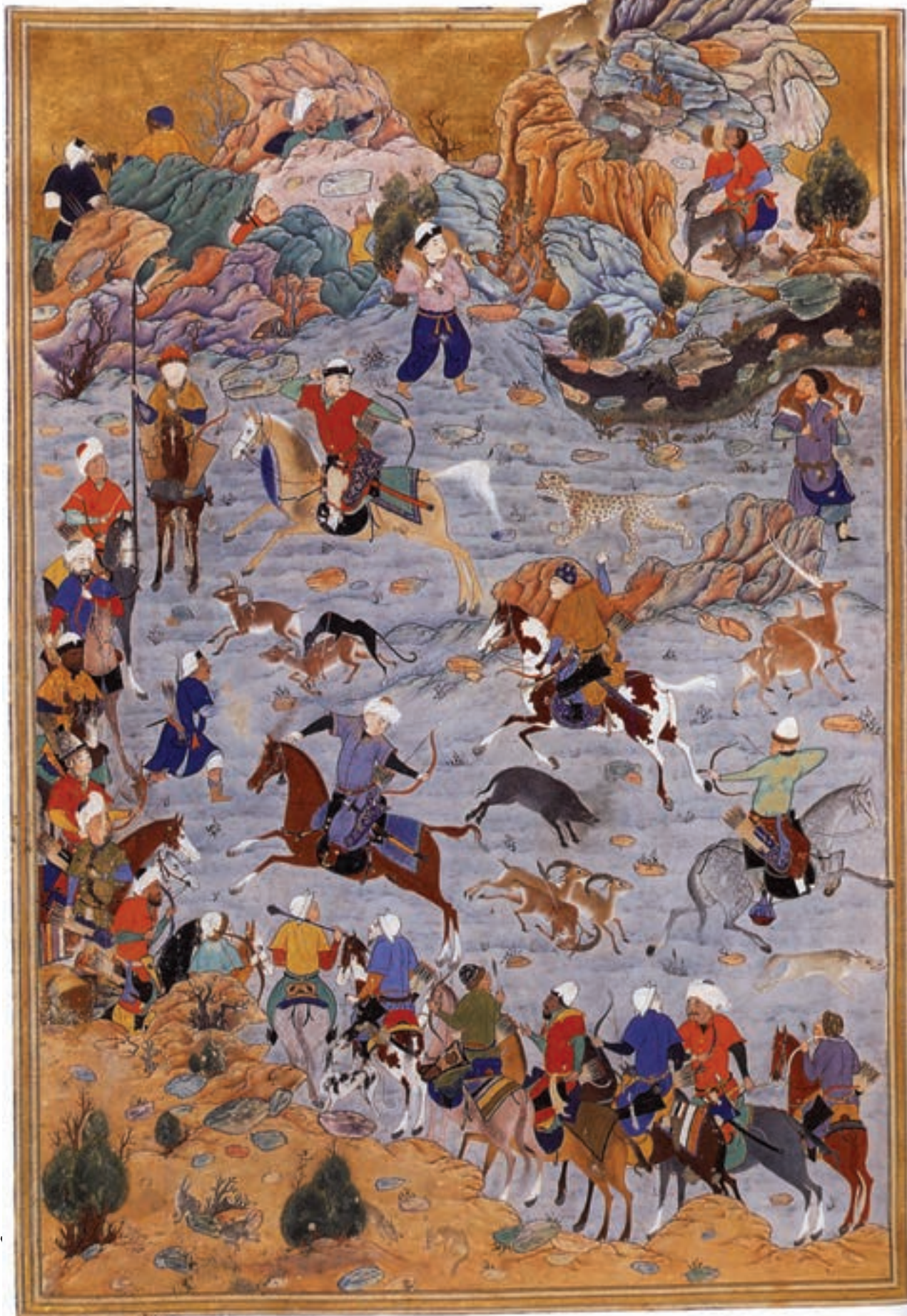
تصویر ۲ - هشت بهشت، شیوا بهزاد، مکتب هرات، قرن نهم هجری، موزه توپ کاپی