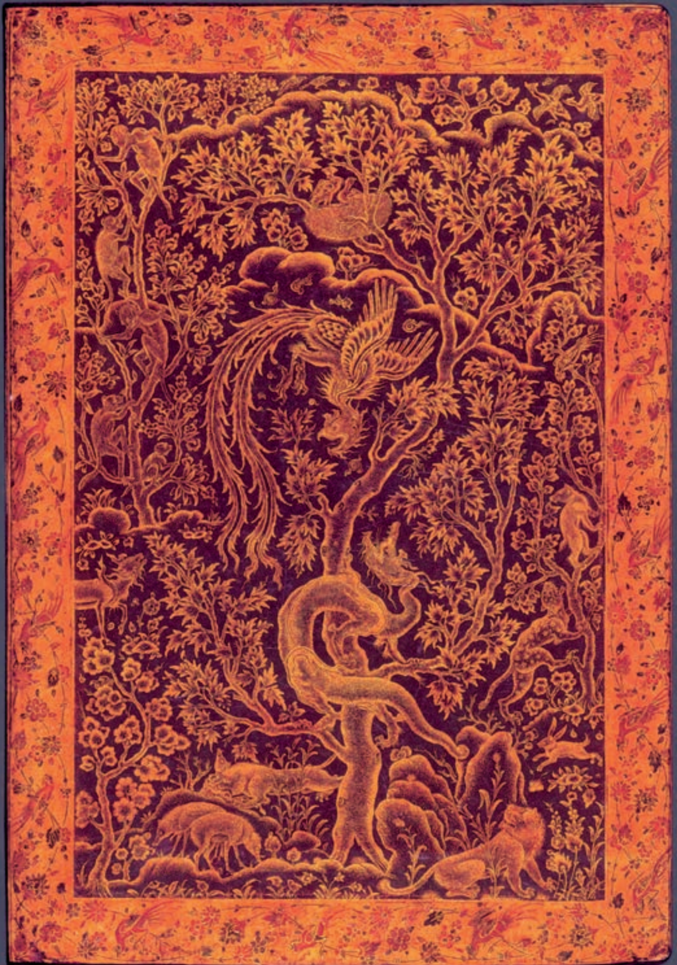
تصویر ۸ - گرفت و گیر سیمرغ و ازدها، جلد روغنی (اندرونی)، احسن الکبار، سال ۸۳۷ هجری قمری، کاخ گلستان