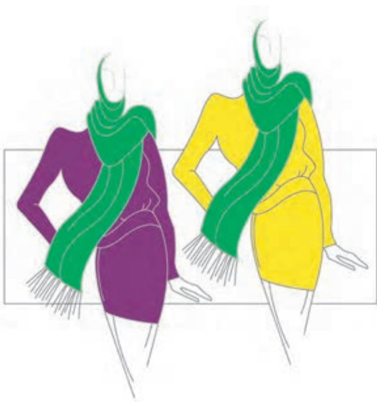
تصویر ۱-۴۷ - تغییر درجه‌ی تاریکی و روشنی و تأثیر متقابل رنگ‌ها