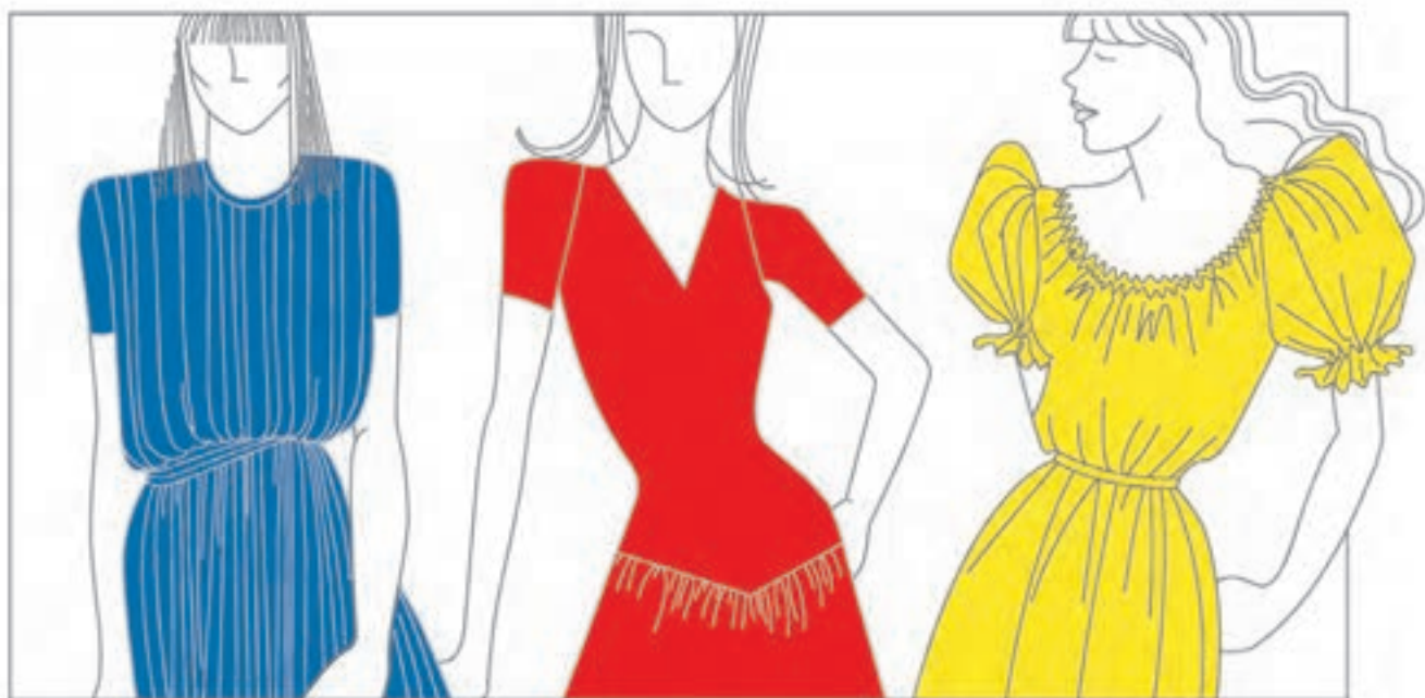
تصویر ۴۹-۱ - عدم تطابق شکل و رنگ

توضیح: تأثیر متقابل رنگ و شکل: اضافه شدن هر رنگ به هر شکل (به جز مطابقت رنگ و شکل)، باعث می شود که خصوصیات رنگ ها و شکل ها با یکدیگر ترکیب شود. در نتیجه، رنگ و شکل با هم می توانند مجموعه ای جدید از لحاظ خصوصیات ایجاد کنند. به طور مثال، اگر رنگ قرمز را به دایره اضافه کنیم که شکلی معلق، سبک و سرد است، به آن خصوصیات سنگینی، استحکام و گرمی می بخشیم (تصویر ۴۹-۱).