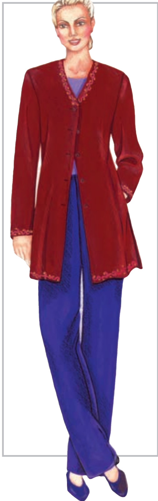
تصویر ۱-۶۰ - ترکیب بندی بر اساس رنگ های سرد و گرم

* ترکیب بندی رنگ های سرد و گرم (تصویر ۱-۶۰).