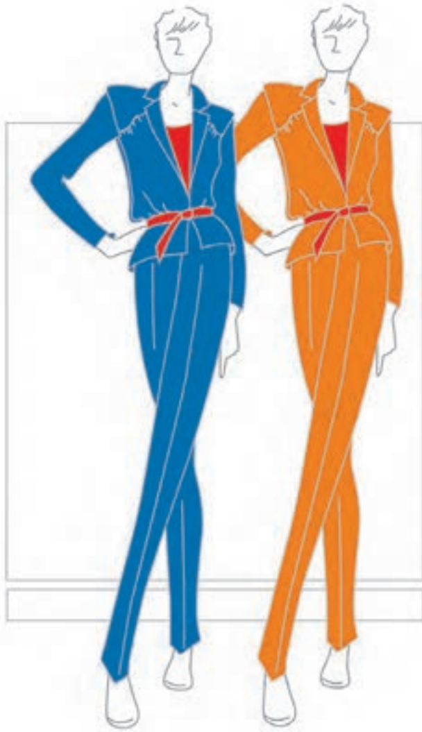
تصویر ۱-۴۵-ب - تغییر درجه‌ی ارزش‌های رنگی

در مجاورت‌های رنگی، رنگ‌ها بر درجات ارزش‌های رنگی یکدیگر تأثیر می‌گذارند. به‌طور مثال، رنگ قرمز در مجاورت و یا بر روی زمینه‌ی نارنجی، شفافیت کمتری می‌یابد، حال آن‌که همان رنگ، در مجاورت و یا بر روی زمینه‌ی آبی، گرم‌تر و شفاف‌تر ظاهر می‌گردد (تصویر ۱-۴۵-ب).