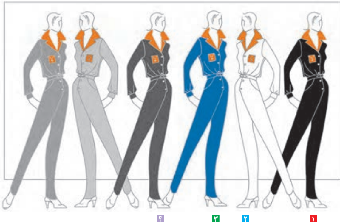
تصویر ۴۳-۱ - تأثیر فضایی گوناگون بر رنگ

زمینه‌های مختلف رنگی می‌تواند اثرات متفاوتی بر رنگ‌ها بگذارد این زمینه‌ها عبارتند از: (تصویر ۴۳-۱)