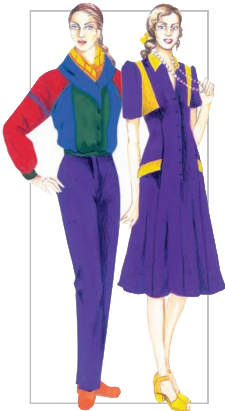
تصویر ۱-۳۸ - همجواری رنگ‌های مکمل بدون توجه به قانون مندی وسعت تضاد وسعت رنگ‌های مکمل

در همجواری رنگ‌ها با وسعت‌های گوناگون، باید به این نکته توجه داشت که تعداد رنگ‌ها هر چند که باشد به این منظور است که بتواند با تناسب وسعت رنگ، چشم را به یک تعادل زیبا و کامل برساند. البته این عمل از سوی طراح انجام می‌پذیرد (تصاویر ۱-۳۷ و ۱-۳۸).