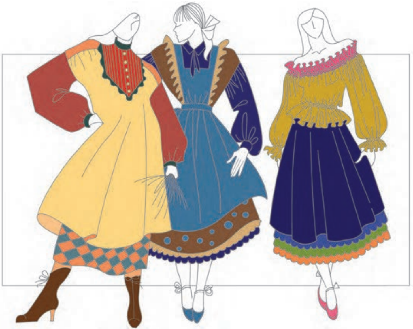
تصویر ۲-۷ - رنگ بندی های تزیینی و سنتی