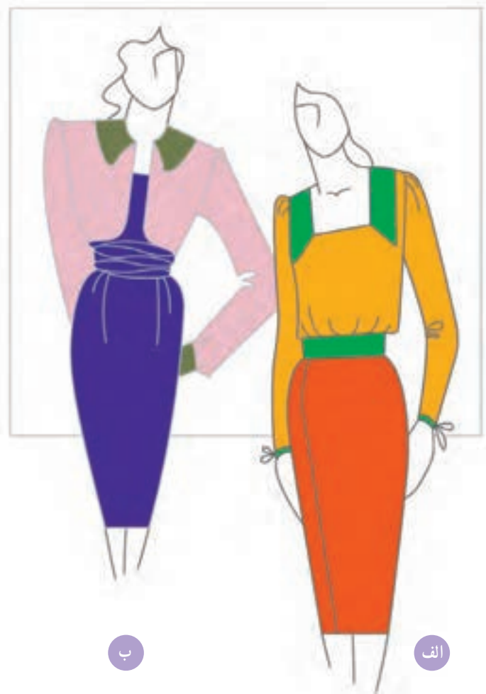
تصویر ۱-۵۵ - الف - ترکیب بندی بر اساس رنگ های اشباع

* ترکیب بندی رنگ های اشباع و غیر اشباع (تصویر ۱-۵۶).