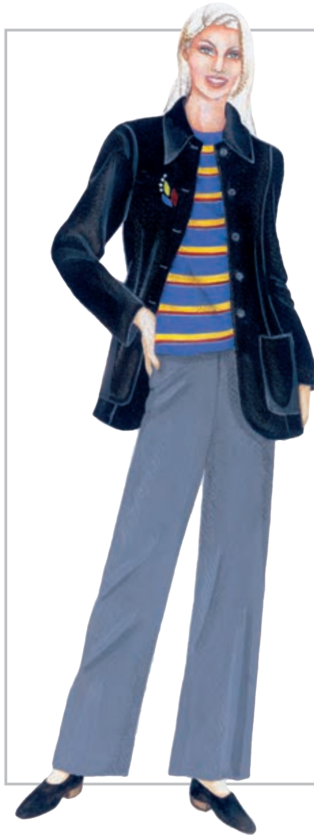
تصویر ۱-۵۴ — ترکیب بندی بر اساس رنگ‌های بی فام و فام دار