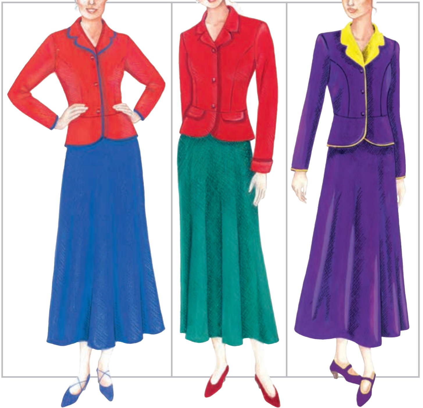
تصویر ۴۰-۱ - تناسبات و تضاد و سعت رنگ‌های مکمل