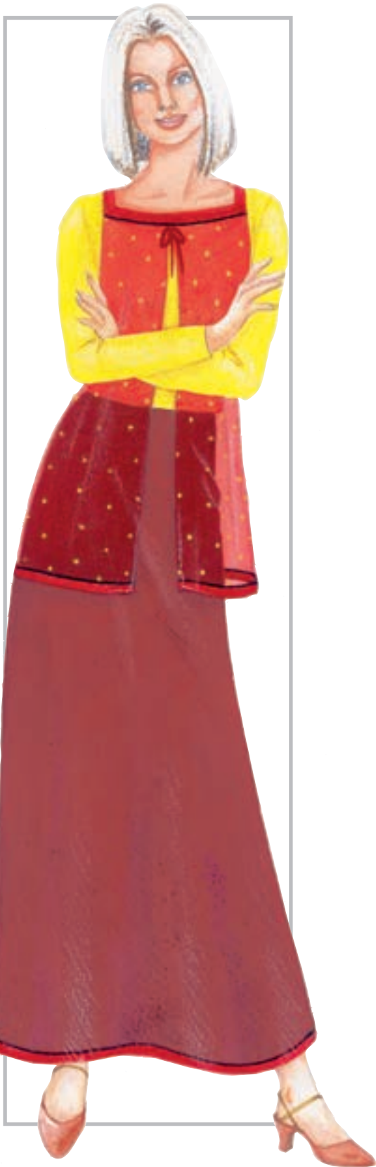
تصویر ۱-۵۰ - رعایت و تلفیق چند قانون مختلف رنگی