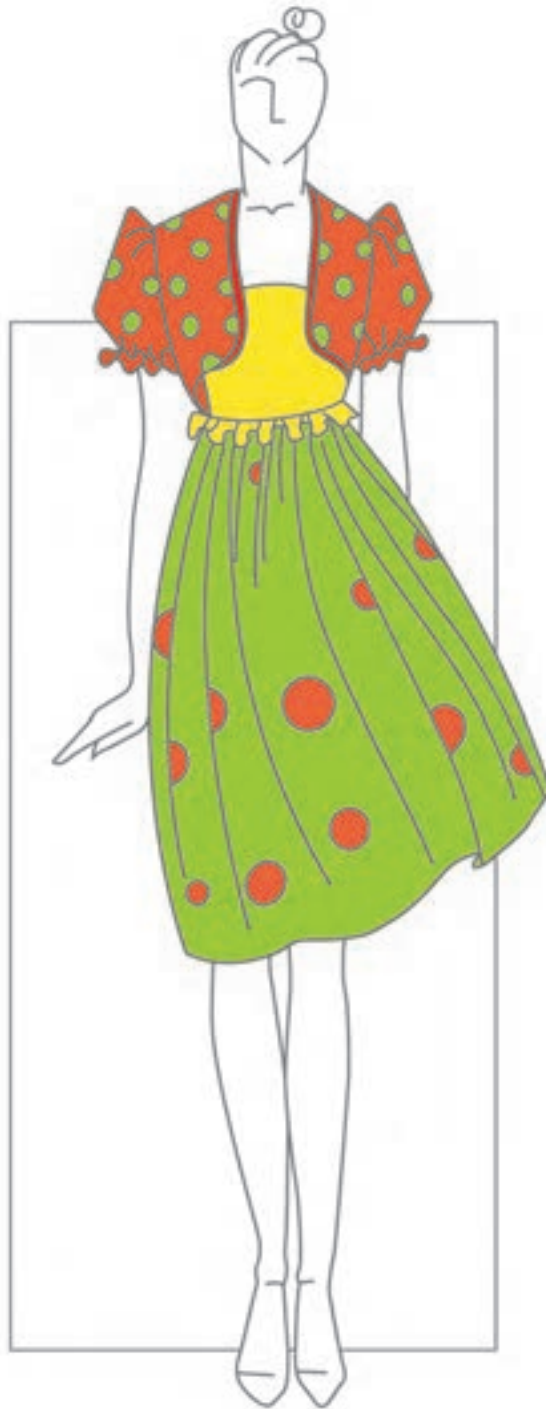
تصویر ۱-۵۳ - ترکیب بندی بر اساس رنگ های فام دار

* ترکیب بندی بر اساس رنگ های صرفاً فام دار (تصویر ۱-۵۴).