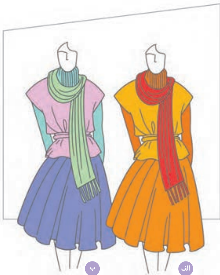
تصویر ۱-۵۹ - الف - ترکیب بندی بر اساس رنگ های گرم