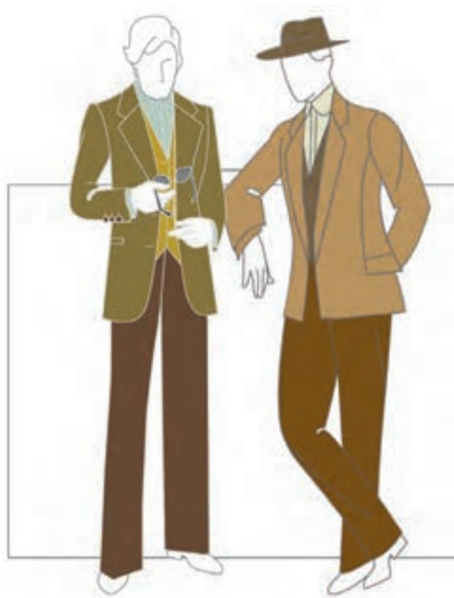
تصویر ۲-۶ - رنگ بندی مناسب لباس مردانه

سنگین و موقر ایجاد می نمایند که مناسب رنگ آمیزی لباس های میان سالان و کهن سالان می باشد (تصویر ۲-۶).