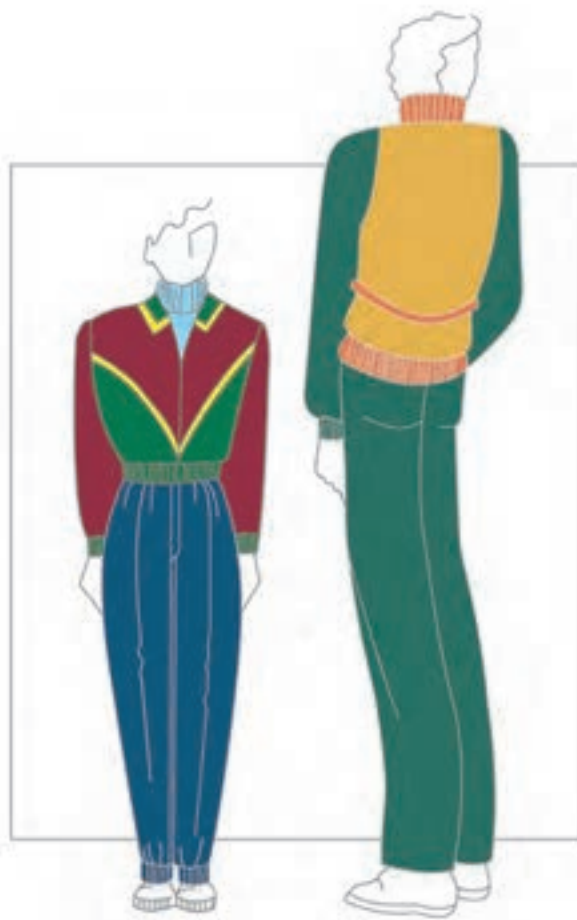
تصویر ۲-۴ - رنگ بندی مناسب لباس پسرانه

● رنگ های مناسب لباس پسرانه (نوجوان و جوان): رنگ بندی این گونه لباس ها فضایی فعال می آفریند و گاهی هم به سردی می گراید مانند انواع آبی، سبز، قهوه ای های روشن، قرمز بنفش، آبی بنفش و غیره (تصویر ۲-۴). مثلاً، مجاورت آبی بنفش و سبز، فضایی فعال، جوان و پویا ایجاد می کند.