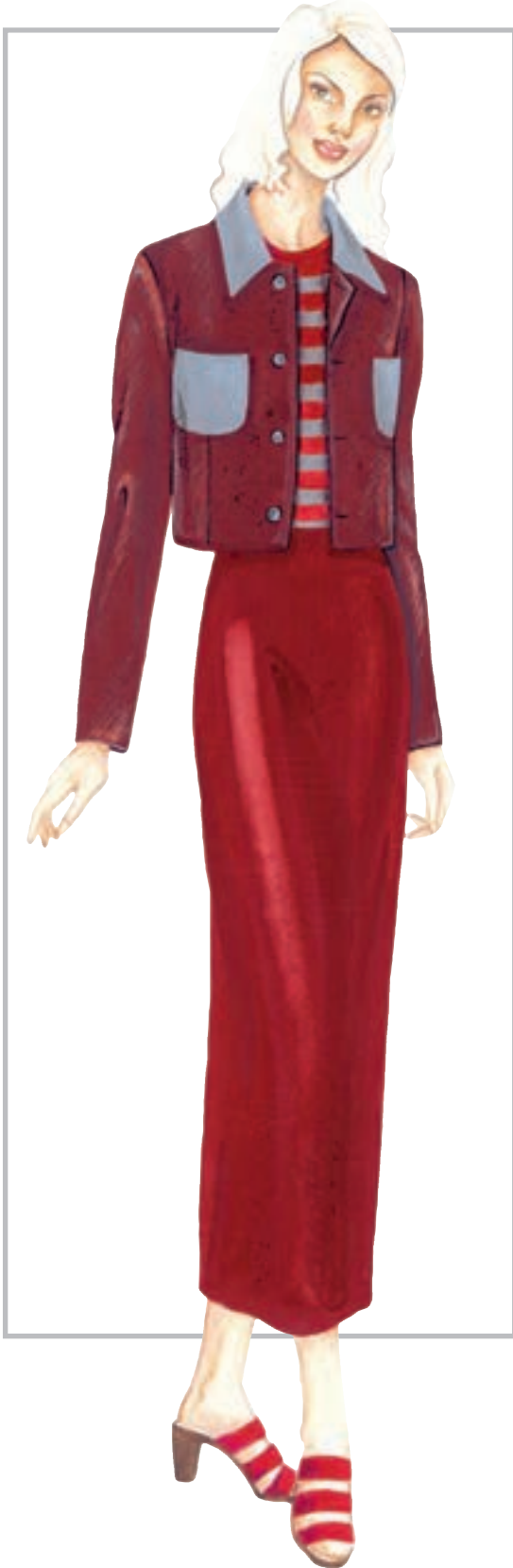
تصویر ۱-۳۴ - همجواری سطوح خاکستری بر زمینه‌ی رنگی - تضاد همزمانی

مثال : اگر سطحی خاکستری بر زمینه قرمز قرار گیرد متمایل به رنگ سبز (سبزی که مکمل آن رنگ قرمز است) به نظر می‌رسد.