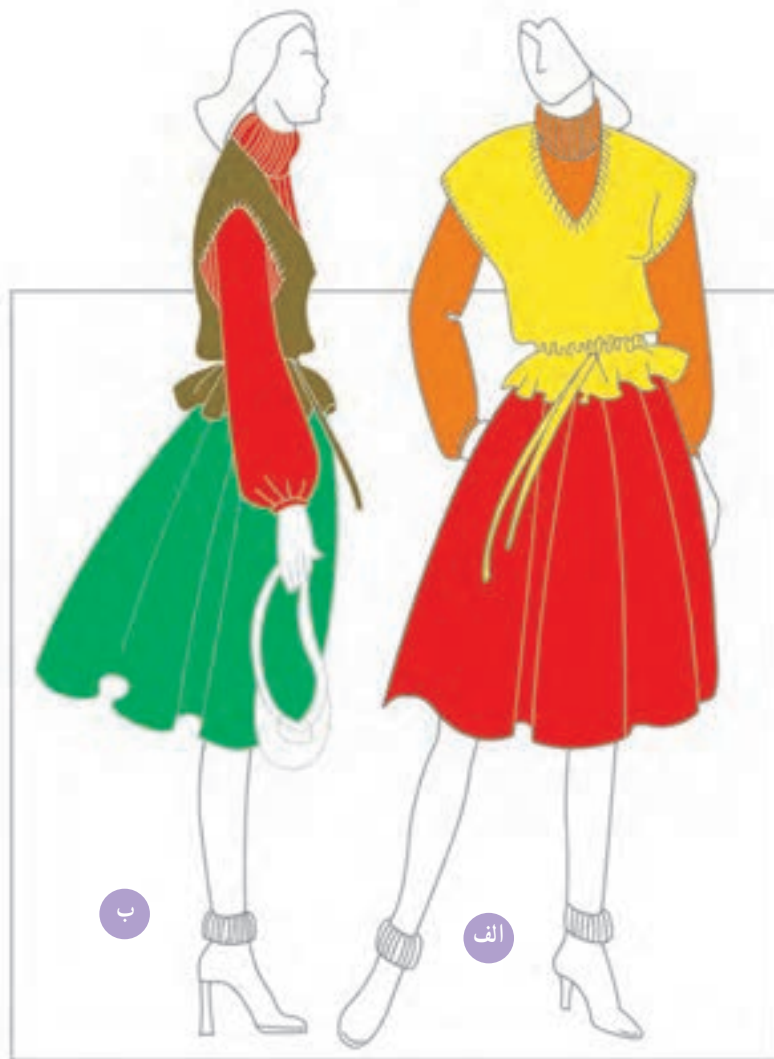
ب -- استفاده از ترکیب میان‌های رنگی غیر همجوار در ساخت رنگ میانی

اینتن: این گروه از انواع رنگ‌های میانی، رنگ‌هایی هستند