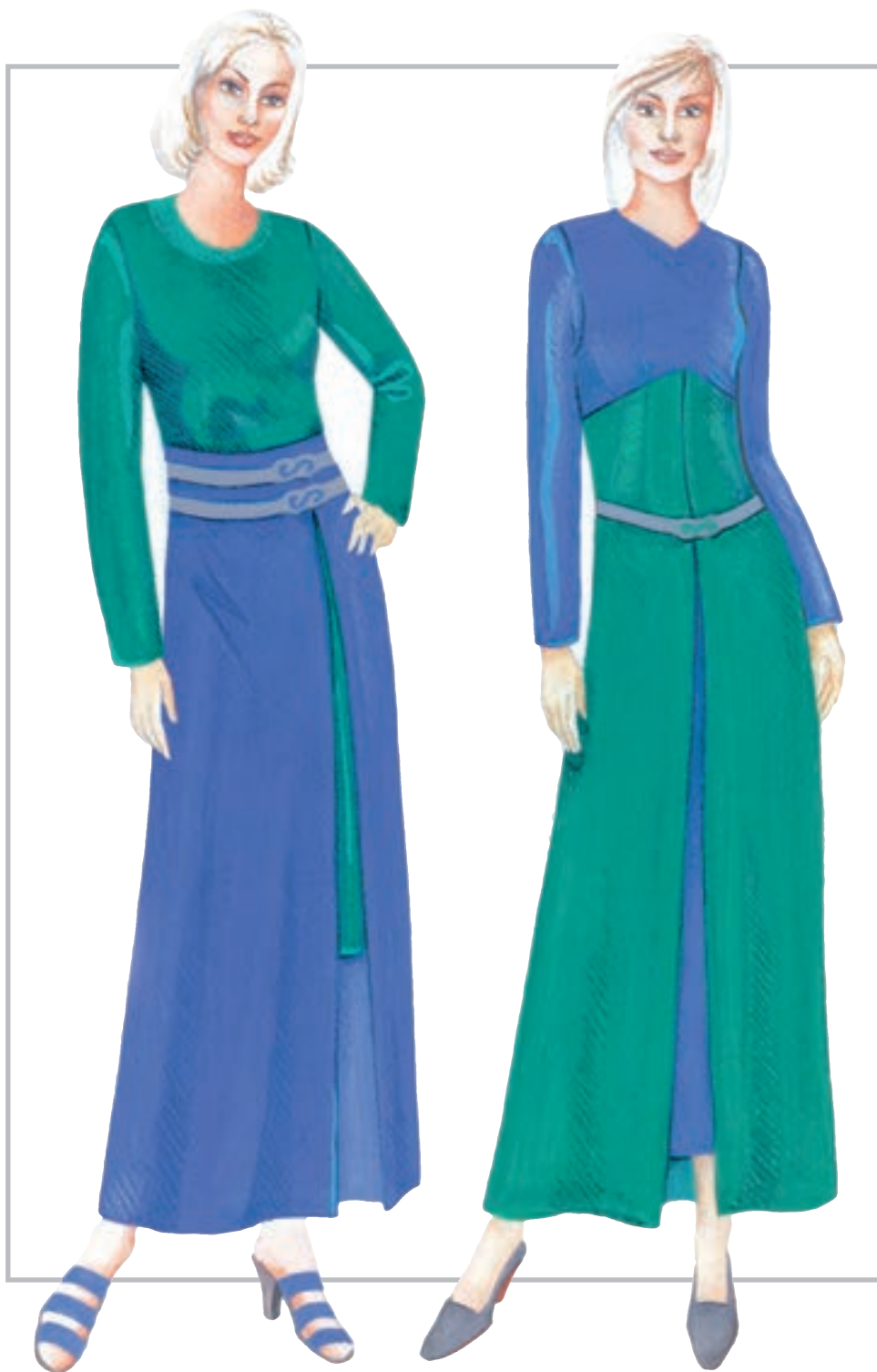
تصویر ۱-۳۵ - همجواری سطوح خاکستری بر زمینه‌ی رنگی - تضاد همزمانی

* همجواری رنگ‌ها در تضاد همزمانی یا سیمولتانه : زمانی که رنگ زمینه از خانواده‌ی گرم باشد، خاکستری بر آن سریع‌تر رنگ مکمل را به نظر می‌رساند (تصویر ۱-۳۵).