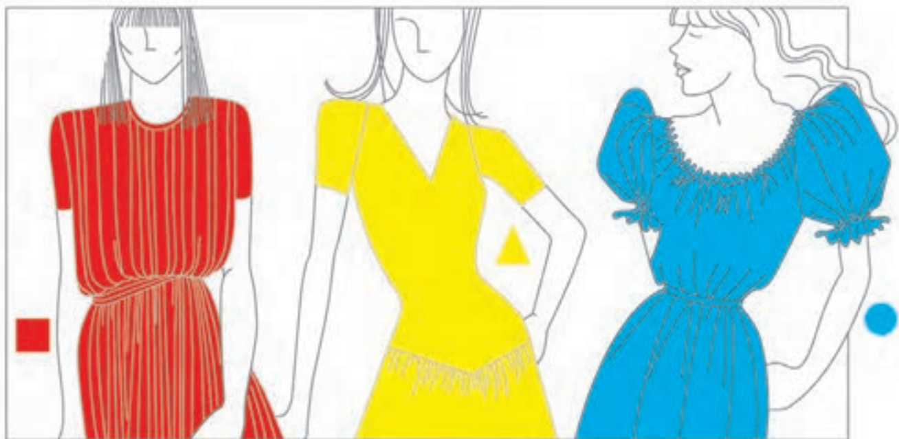
تصویر ۴۸-۱ - کاربرد رنگ‌های اصلی در سه شکل اصلی

ایتن معتقد است در مقابل سه رنگ اصلی، سه شکل اصلی نیز وجود دارد. بدین صورت که رنگ قرمز با مربع، رنگ آبی با دایره و رنگ زرد با مثلث مطابقت دارد و رنگ‌های ترکیبی چرخه‌ی رنگ، با شکل‌های ترکیبی مطابقت می‌نمایند (تصویر ۴۸-۱).