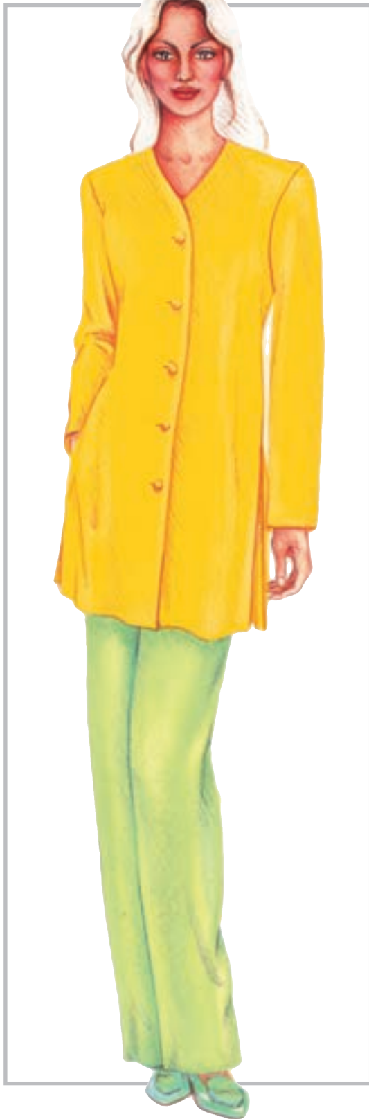
تصویر ۱-۵۶ - ترکیب بندی بر اساس رنگ های اشباع و غیر اشباع

ترکیب بندی بر اساس رنگ های اشباع و غیر اشباع این رنگ ها شامل تنوع ترکیب بندی های زیر می گردند: * ترکیب بندی رنگ های صرفاً اشباع (زنده) (تصویر ۱-۵۵- الف).