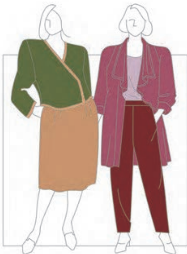
تصویر ۲-۵ - رنگ بندی مناسب لباس زنانه

● رنگ های مناسب لباس مردانه : رنگ بندی این گونه