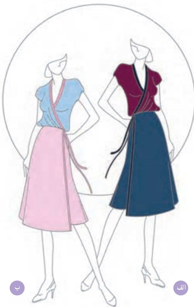
تصویر ۱-۵۷ — الف — ترکیب بندی بر اساس رنگ های تیره ب — ترکیب بندی بر اساس رنگ های روشن