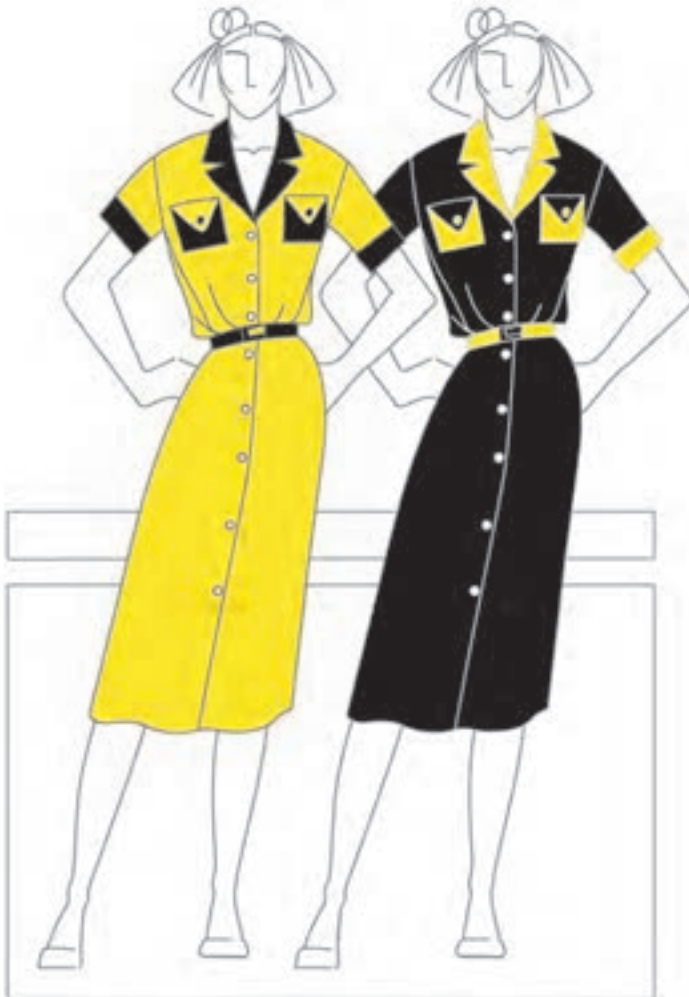
تصویر ۴۵-۱-الف - تغییر وسعت مجازی رنگ‌ها

تأثیر متقابل رنگ‌ها می‌تواند با تکیه بر بیان و مفاهیم رنگی و