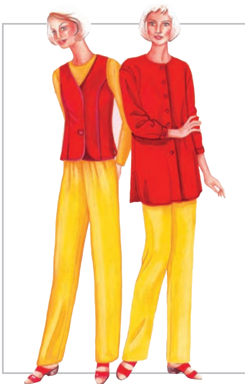
تصویر ۱-۳۶ - تضاد وسعت رنگی هم خانواده (گرم)

هرگاه مابین اندازه ی سطوح رنگ ها (مساحت رنگ ها) اختلافی به وجود آید تضاد وسعت رنگی پدیدار می شود. تضاد وسعت رنگی، ممکن است مابین رنگ های هم خانواده (تصویر ۱-۳۶) و نیز، رنگ های غیرهم خانواده و مکمل، وجود داشته باشد. گفتنی است که درجه ی تضاد وسعت رنگی تغییرپذیر باشد.