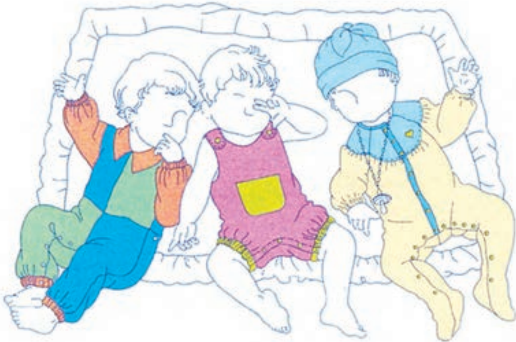
تصویر ۱-۲ - رنگ بندی مناسب لباس نوزاد

بی شک رنگ آمیزی لباس، می تواند متناسب با موقعیت و مناسبت های مختلف تغییر نماید. طراح لباس با شناخت مواردی از جمله گروه سنی، جنسیت فرد، موقعیت های اجتماعی و فرهنگی و مشاغل، به انتخاب رنگ و یا به رنگ بندی طرح لباس اقدام می کند. دسته بندی کلی در جهت بیان رنگ به شرح زیر است: - دسته بندی رنگی بر اساس گروه سنی و جنسیت فرد - دسته بندی رنگی بر اساس موقعیت های شغلی و نوع فعالیت