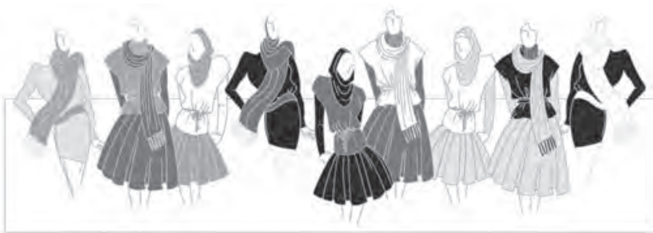
تصویر ۱-۵۱ - ترکیب بندی بر اساس رنگ های بی فام