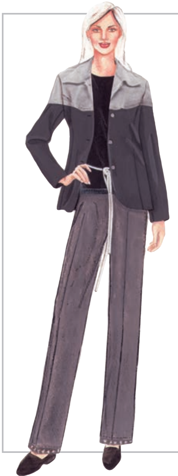
تصویر ۱-۵۲ - ترکیب بندی بر اساس رنگ های بی فام