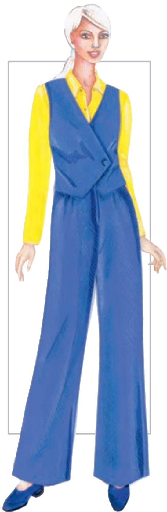
تصویر ۱-۵۸ — ترکیب بندی بر اساس رنگ های تیره و روشن

* ترکیب بندی رنگ های روشن و تیره (تصویر ۱-۵۸).