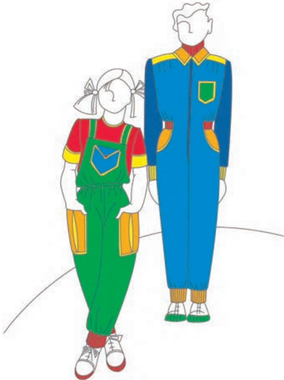
تصویر ۲-۲ - رنگ بندی مناسب لباس کودک

به کارگیری رنگ های درخشان، زنده و اشباع در کنار یکدیگر، با این گروه سنی متناسب است. مانند انواع زرد درخشان، نارنجی، سبز روشن، قرمز روشن و آبی روشن (تصویر ۲-۲).