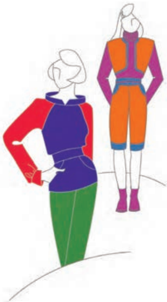
تصویر ۲-۳ - رنگ بندی مناسب لباس دخترانه

● رنگ های مناسب لباس دخترانه (نوجوان و جوان): رنگ بندی این گونه لباس ها فضایی گرم، پرشور و متنوع را طلب می کند مانند انواع زرد، قرمز، نارنجی و بنفش که بیشتر در مجاورت مکمل رنگی شان به کار برده می شوند (تصویر ۲-۳). برای مثال: همجواری قرمز بنفش در مجاورت سبز زرد