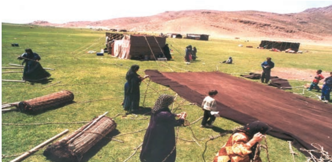
شکل ۴-۷- سیاه جادر از صنایع دستی عشایر قشقایی