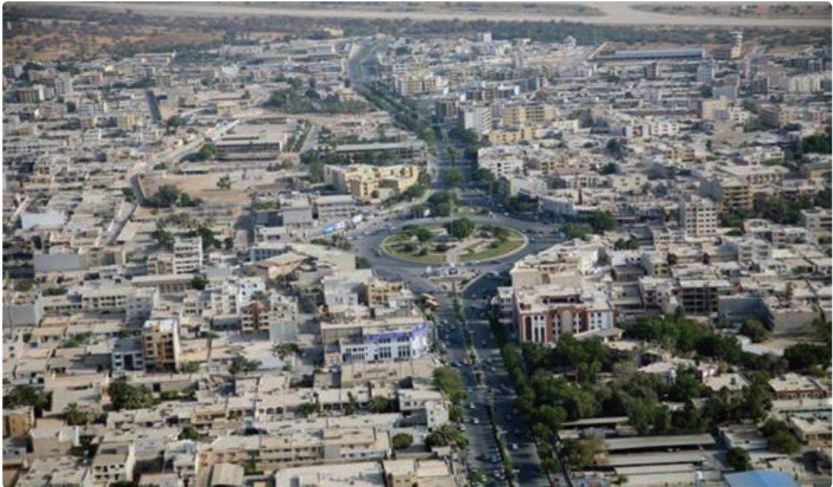
شکل ۷-۷- نمایی از شهر بوشهر

قدیمی ترین نشانه‌های به دست آمده از سکونت انسان در سرزمین بوشهر به دوران حکومت ایلامی‌ها و تمدن بین النهرین برمی‌گردد. منطقه تجاری بوشهر در آن زمان دهکده‌ای به نام لیان بود. از دوره هخامنشیان نیز آثار با ارزشی در شهرستان دشتستان کشف شده است. در زمان اردشیر بابکان شهر رام اردشیر در دو فرسنگی شهر بوشهر بنا گذاشته شد که اکنون به نام ریشهر معروف است. نحوه شکل‌گیری مراکز شهری استان بیانگر استقرار جمعیت و فعالیت‌های اقتصادی وابسته به منابع آب و فعالیت‌های مرتبط با دریا در ساحل می‌باشد. شکل‌گیری این مراکز از شمالی‌ترین نقطه استان تا جنوبی‌ترین آن که عمدتاً بر روی نوار ساحلی، دشت‌ها و کوهپایه‌ها بوده که نشانگر توزیع مناسب آنها از نظر استقرار و فاصله بین این مراکز است. شهر بوشهر به عنوان مرکز استان و دیگر شهرهای ساحلی از دیرباز مراکز تجارت و فعالیت‌های بندری بوده‌اند.