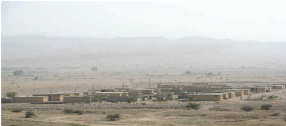
شکل ۳-۷- اسکان عشایر در ایل شهر بوشکان

شغل اصلی عشایر علاوه بر دامداری، تولید صنایع دستی، زراعت و باغداری می‌باشد. مناطق استقرار عشایر در استان به ترتیب جمعیت، شهرستان‌های دشتستان - دشتی - تنگستان - دیروجم را در بر می‌گیرد. مناطق بیلاقی عشایر استان بوشهر در استان فارس شهرستان‌های اقلید، صغاد، بهمن، مرودشت و شیراز، در استان اصفهان سمیرم و شهرضا و در استان چهارمحال و بختیاری بروجن و بلداجی است.