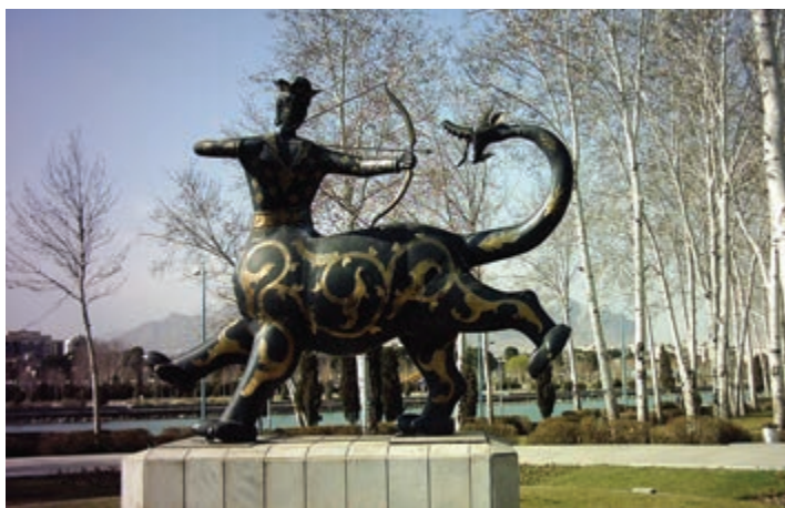
شکل ۳-۶- نماد شهر اصفهان. این تندیس نشانه چیست؟

از اصفهان پیش از اسلام؛ یعنی زمان هخامنشیان، اشکانیان و ساسانیان اطلاعات زیادی در دست نیست و آثار چندانی برجای نمانده است ولی آنچه مسلم است، از آنجا که استان اصفهان از لحاظ جغرافیایی در مرکز ایران واقع شده است، وجود دشت‌های وسیع و حاصل خیز و در برخی از مناطق، منابع آب فراوان - مانند زاینده رود - جاذبه‌هایی در آن ایجاد کرده است؛ از این رو، تمامی حاکمان در طول تاریخ نسبت به آن توجه ویژه داشته‌اند و تلاش همه‌جانبه آنها این بوده است که تسلط خود را بر این منطقه حفظ کنند. در دوران اساطیری، وجود داستان‌هایی مانند ماجرای کاوه آهنگر همان چهره آزاده که علیه ستم ضحاک قیام کرد و به کمک فریدون ملت ایران را از بند اسارت آزاد کرد و هم اکنون نیز در منطقه فریدن در روستایی به نام مشهد کاوه، آرامگاهی منسوب به این قهرمان ملی دیده می‌شود، نشان از مرکزیت قدرت سیاسی در این قسمت کشور دارد. وجود دژی بسیار بزرگ همانند اهرام مصر به نام کهندژ سارویه در حاشیه اصفهان امروزی که آثار آن تا هزار سال قبل هنوز برجای بوده و امروزه بخشی از آن در کنار پل شهرستان به نام تپه اشرف باقی مانده است و نیز بقایای آتشکده منسوب به عصر ساسانیان در ماریین اصفهان (کوه آتشگاه)، نمونه‌ای از آثار برجای مانده از پیش از اسلام است.