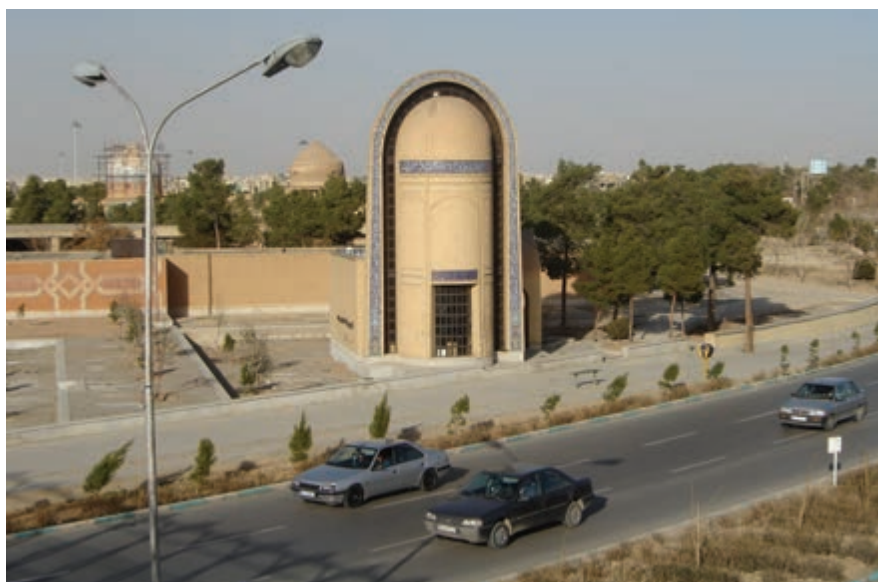
شکل ۱۴-۶- مقبره دانشمند بزرگ بانو مجتهده امین - تخت فولاد اصفهان