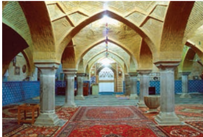
شکل ۷-۶- مسجد جامع شهرضا باقی مانده از زمان سلجوقیان

کوشش کردند. بناهای بسیاری ساخته شد که هنوز بسیاری از آنها پابرجاست. همچنین احداث چهارباغ ملکشاهی، آثار بسیار ارزشمند معماری و هنر اسلامی به ویژه در مسجد جامع اصفهان مانند گنبد نظام الملک و گنبد تاج الملک که به نظر باستان شناسان جهانی از آثار اعجاب انگیز محسوب می شوند، مسجد جامع اردستان، مسجد جامع زواره، مسجد جامع شهرضا، مسجد جامع گلپایگان نیز از جمله آثار ارزشمند معماری این دوره است.