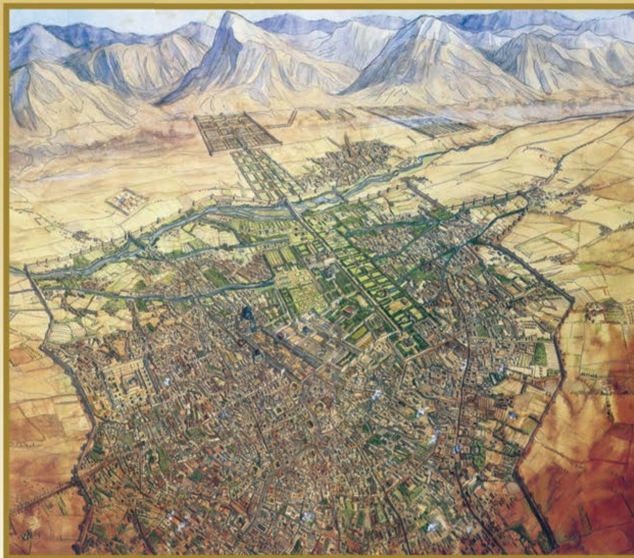
شهر اصفهان - صفویه