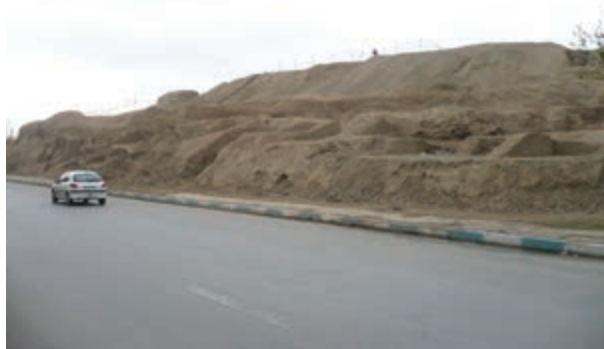
شکل ۴-۶- تپه اشرف باقی مانده بنای کهن سارویه (نزدیک پل شهرستان اصفهان)

از اصفهان پیش از اسلام؛ یعنی زمان هخامنشیان، اشکانیان و ساسانیان اطلاعات زیادی در دست نیست و آثار چندانی برجای نمانده است ولی آنچه مسلم است، از آنجا که استان اصفهان از لحاظ جغرافیایی در مرکز ایران واقع شده است، وجود دشت‌های وسیع و حاصل خیز و در برخی از مناطق، منابع آب فراوان - مانند زاینده رود - جاذبه‌هایی در آن ایجاد کرده است؛ از این رو، تمامی حاکمان در طول تاریخ نسبت به آن توجه ویژه داشته‌اند و تلاش همه‌جانبه آنها این بوده است که تسلط خود را بر این منطقه حفظ کنند. در دوران اساطیری، وجود داستان‌هایی مانند ماجرای کاوه آهنگر همان چهره آزاده که علیه ستم ضحاک قیام کرد و به کمک فریدون ملت ایران را از بند اسارت آزاد کرد و هم اکنون نیز در منطقه فریدن در روستایی به نام مشهد کاوه، آرامگاهی منسوب به این قهرمان ملی دیده می‌شود، نشان از مرکزیت قدرت سیاسی در این قسمت کشور دارد. وجود دژی بسیار بزرگ همانند اهرام مصر به نام کهندژ سارویه در حاشیه اصفهان امروزی که آثار آن تا هزار سال قبل هنوز برجای بوده و امروزه بخشی از آن در کنار پل شهرستان به نام تپه اشرف باقی مانده است و نیز بقایای آتشکده منسوب به عصر ساسانیان در ماریین اصفهان (کوه آتشگاه)، نمونه‌ای از آثار برجای مانده از پیش از اسلام است.