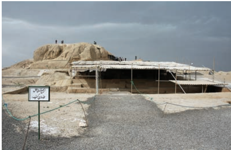
شکل ۲-۶- تپه‌های باستانی سیلک - کاشان

بیشتر این مکان‌ها مربوط به هزاره چهارم تا هزاره ششم قبل از میلاد است. برخی از مکان‌های باستانی استان عبارت‌اند از: تپه سیلک کاشان، محوطه باستانی اریسمان در شهرستان نطنز (هزاره چهارم ق. م)، تپه آشنا در چادگان (هزاره ششم ق. م)، تپه چغا حسن در گلپایگان (هزاره پنجم ق. م)، گورتان اصفهان (هزاره چهارم ق. م)، سبا در ورزنه (هزاره سوم ق. م)، تپه جوزک تیران و کرون (هزاره چهارم ق. م)، تل شاهی سمیرم (هزاره چهارم ق. م) و تپه‌های ننادگان فریدن (هزاره چهارم ق. م).