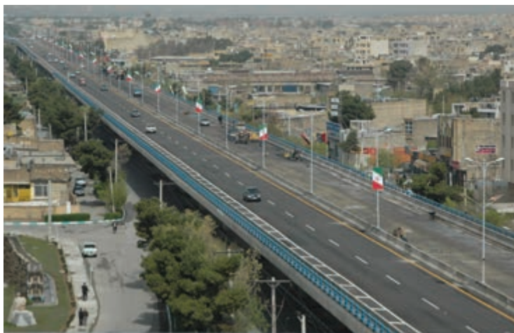
شکل ۳-۷- پل روگذر غیر مسطح امام خمینی (ره)

— حمل و نقل: استان اصفهان با دارا بودن ۱۱۰۰۰ کیلومتر راه، نقش مهمی را در بخش حمل و نقل کشور ایفا می‌کند. ۲۵ درصد آزاد راه‌ها و ۲۳ درصد بزرگراه‌های کشور در این استان قرار گرفته است. در بخش حمل و نقل ریلی، استان اصفهان دارای ۶۴۹ کیلومتر خط اصلی است. در بخش هوایی نیز با پنج فرودگاه در استان وجود دارد، که فقط فرودگاه شهید بهشتی در زمینه حمل و نقل عمومی و مسافربری فعال است. کاهش تلفات جاده‌ای و شناسایی و اصلاح نقاط پرحادثه، افزایش ظرفیت شبکه راه‌های استان، برقراری تردد امن با کاهش زمان و هزینه سفر از اقدامات مهم این بخش است. — حمل و نقل درون شهری: تا پایان شش ماهه اول سال ۱۳۸۷ سهم حمل و نقل عمومی در کلان‌شهر اصفهان ۶۸ درصد بوده است. طی ۳۰ سال (۱۳۵۸-۸۵) جمعیت شهری استان حدود ۲/۱۵ برابر شده؛ در حالی که تعداد وسایل حمل و نقل عمومی به بیش از ۵۹ برابر رسیده است.