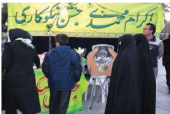
شکل ۲-۷- جشن نیکوکاری

وجود ۱۴۷ واحد توانبخشی، ۳۲ مرکز بازپروری ۱ معتادان و ۷ مرکز مشاوره ۲ ژنتیک ۳ از افتخارات خدماتی این سازمان بوده است. — کمیته امداد امام خمینی: ۳۴ واحد کمیته مشغول در استان، به عنوان نهادی انقلابی از نوع مؤسسات غیرانتفاعی و عام المنفعه، خدمات خود را در جهت سه محور امور حمایتی از محرومان، امور توانمندسازی محرومان و امور اعتمادسازی و جلب مشارکت‌های مردمی دنبال می‌کند.