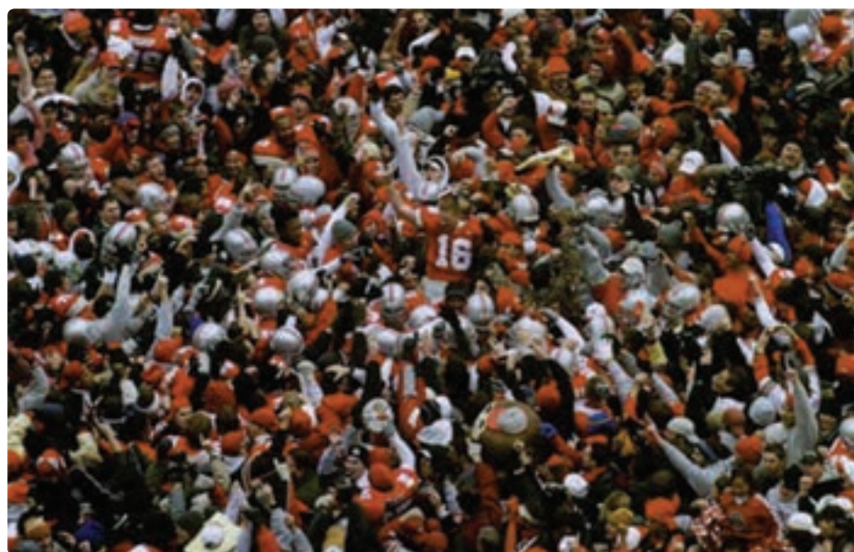
تصویر ۳۸-۴ عکس از هیجان پیروزی در ورزشگاه