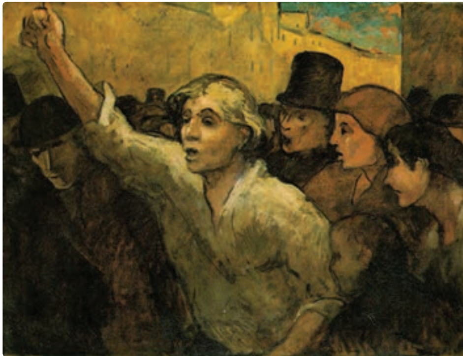
تصویر ۴-۵ قیام، انوره دومیه، رنگ روغن روی بوم

در تصویر ۴-۵ که با سبک رئالیسم اجتماعی خلق شده است، روشنایی رنگ لباس مردی که اعتراضات را رهبری می‌کند موجب تأثیر بر هدف وی در این اثر شده است. فریادها و چهره‌های بی‌رنگ، نشان می‌دهد که توفانی در راه است.