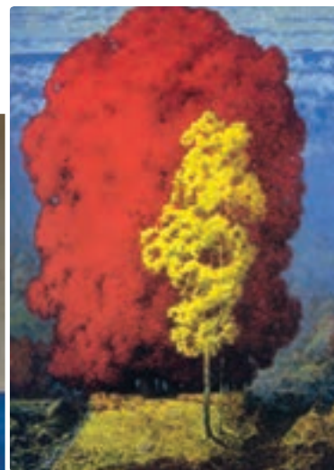
تصویر ۴-۱۳ منظره پائیزی - امدادیان

استفاده به جا از تضادهای دیگر از قبیل تضاد بافت، تضاد جهت، تضاد شکل و... نیز می‌تواند امکانات بیشماری را برای جلب توجه فراهم کند. یک نماد گرافیکی را در میان اشکال طبیعی تجسم کنید، آیا توجه را به خود جلب نمی‌کند؟