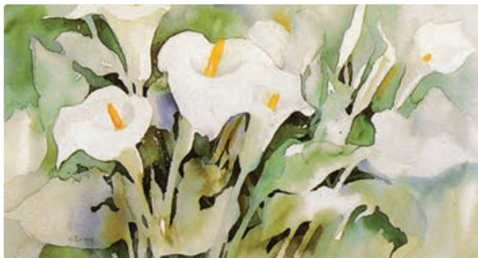
تصویر ۳۷-۴ نقاشی آبرنگ از گل‌های شیپوری

درباره تفاوت شیوه تأکید در آنها گفتگو کنید.