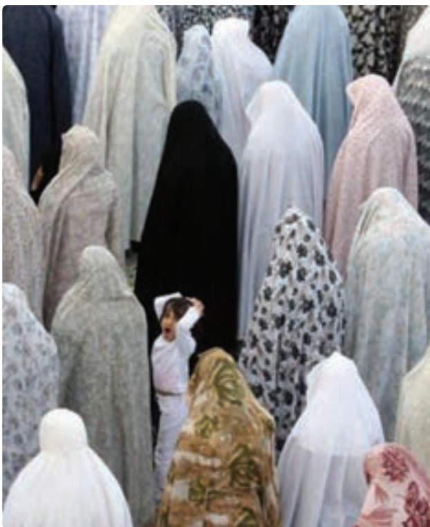
تصویر ۷-۴ کنتراست تاریک روشنایی و اندازه در کودک و چادر سیاه پس زمینه آن