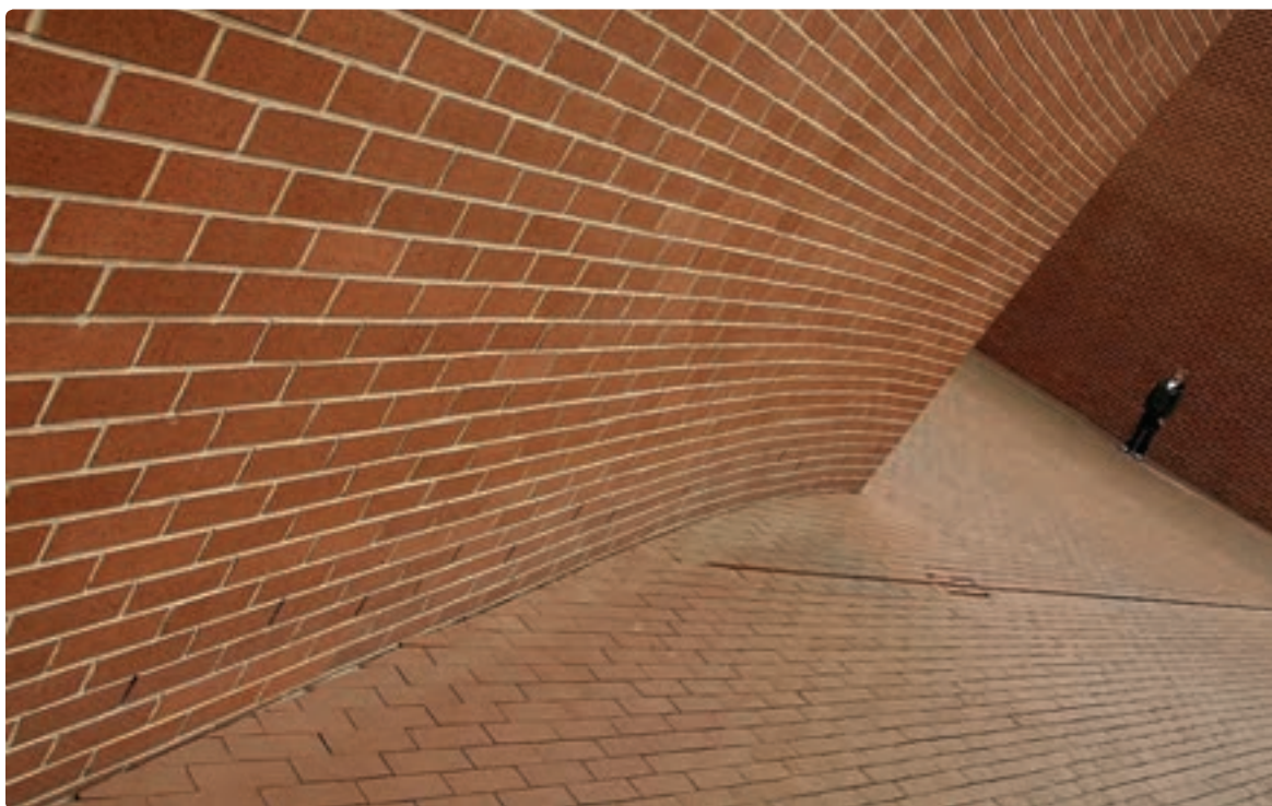
تصویر ۴-۲۷ عکس از نمای ساختمان با پرسپکتیو و اعوجاج، موضوع را تحت الشعاع قرار داده است. توماس هولتکوئنز