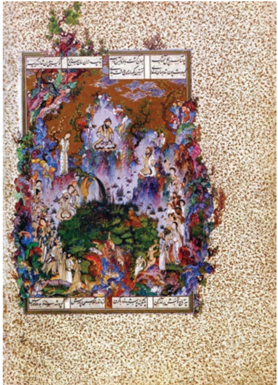
تصویر ۱۸-۴ نگارگری، بارگاه کیومرث اثر سلطان محمد

مجلس نگارگری بارگاه کیومرث در ترکیبی مدور، ریتمی از انسان‌ها، توجه را به بارگاه کیومرث در بالای تصویر هدایت می‌کند، نقطه اوج مجلس در بالای تصویر قرار گرفته است زیرا کیومرث به عنوان یک واحد از کل جدا شده است. (تصویر ۱۸-۴)