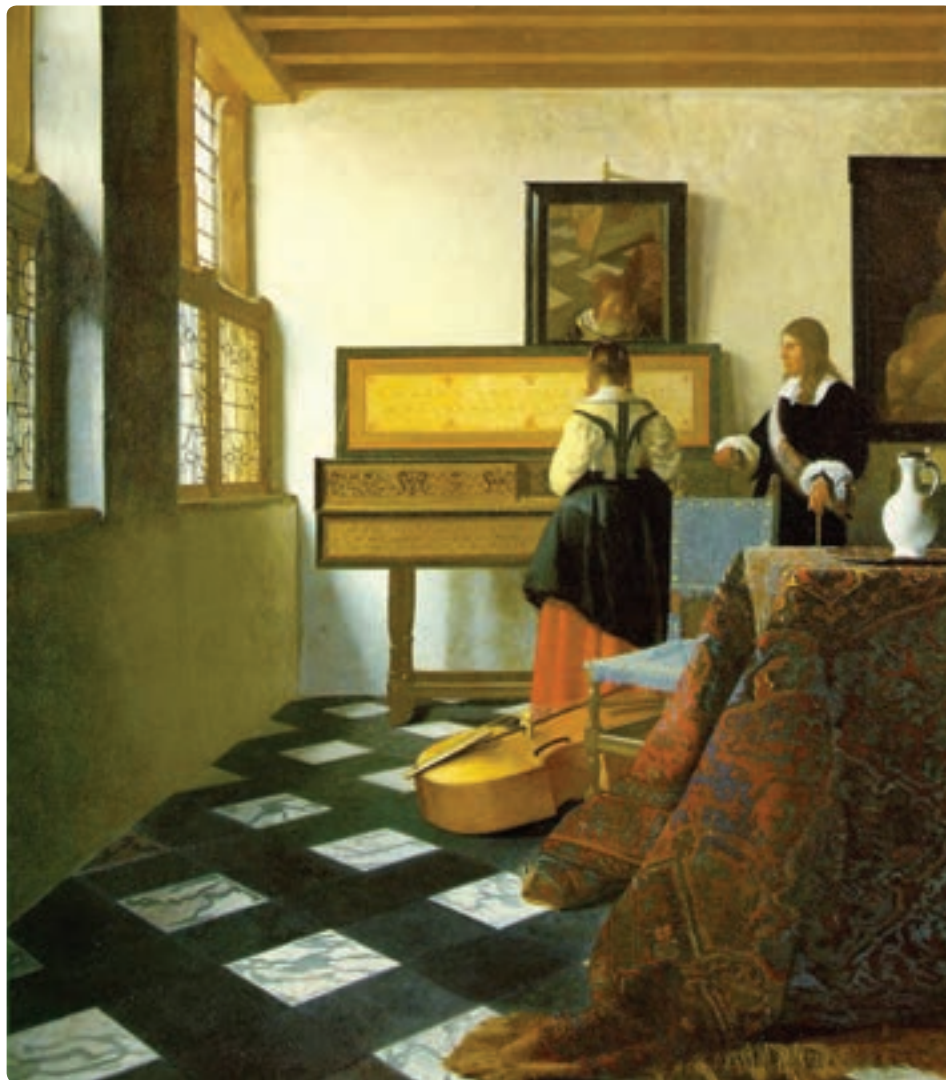
تصویر ۲۴-۴ درس موسیقی - یان ورمیر - رنگ روغن روی بوم

در پردهٔ درس موسیقی، هنرمند موشکافانه و غیرمستقیم چشم را به طرف موضوع هدایت می‌کند. بهره‌مندی از زاویه دید و پرسپکتیو مناسب در میان تاریکی‌ها این امکان را فراهم آورده است که موضوع چشمگیرتر به نظر برسد (تصویر ۲۴-۴).