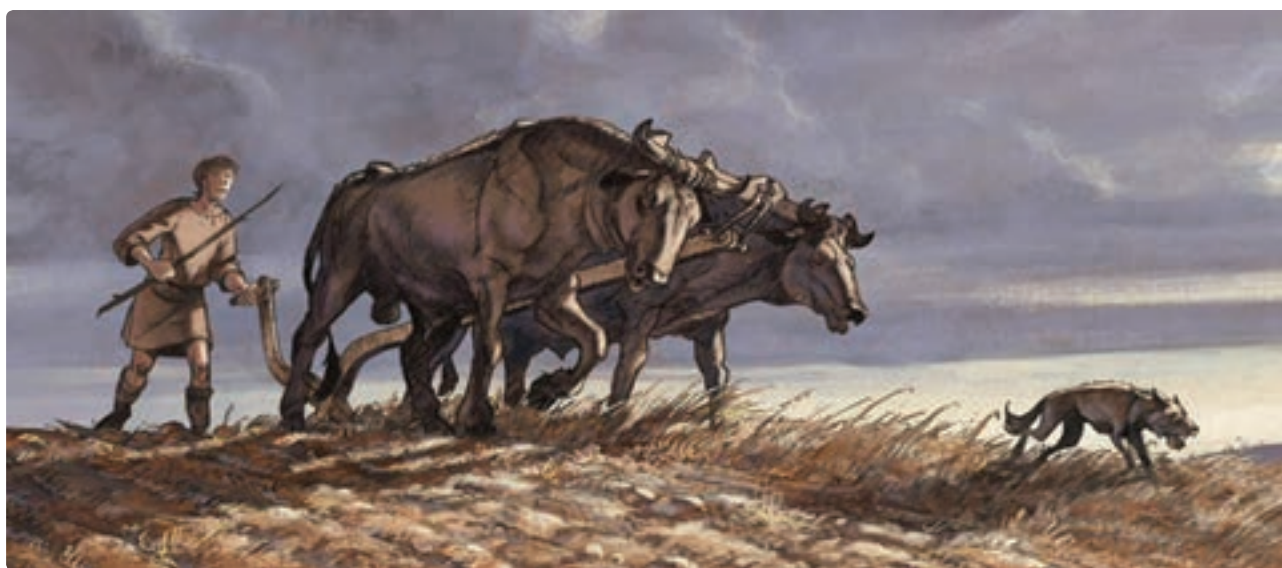
تصویر ۴-۲۳ طراحی برای انیمیشن (قسمتی از استوری بُرد)