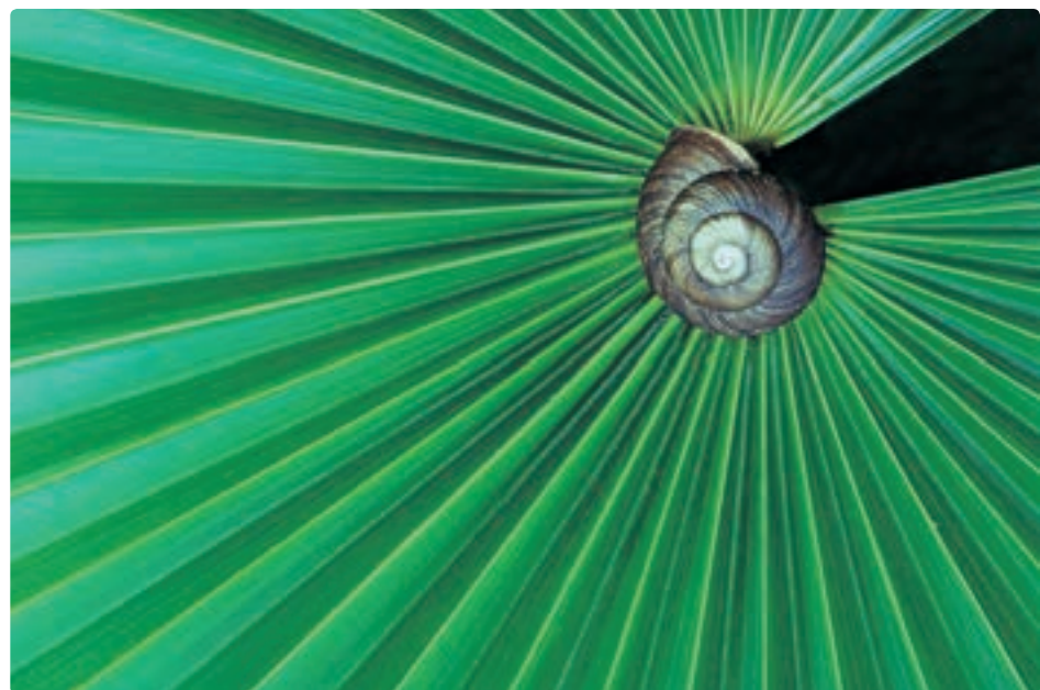
تصویر ۲۱- عکس - تأکید بصری به واسطه خطوط هدایت کننده چشم