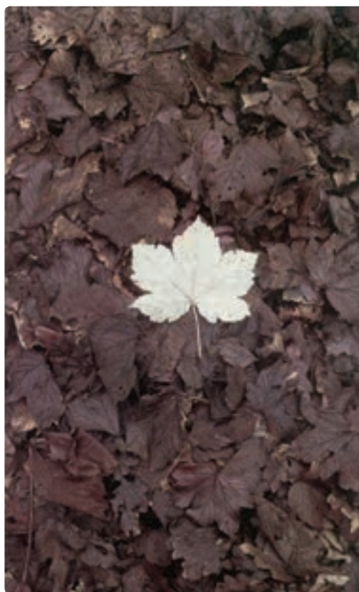
تصویر ۸-۴ طراحی روی زمین- اندی گلدزورثی