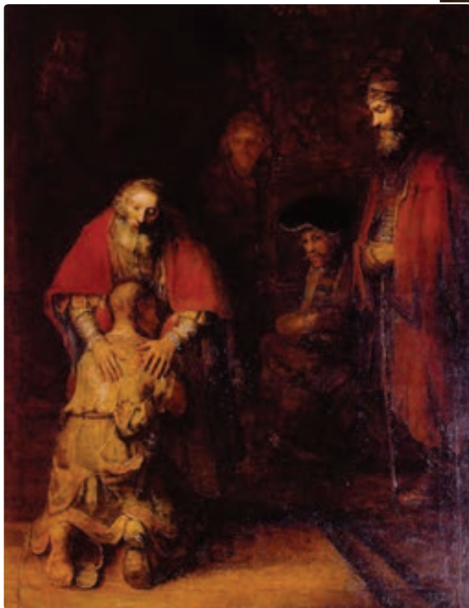
تصویر ۲-۴ رامبراند، ون راین - بازگشت پسر نافرمان - رنگ روغن روی بوم

رامبراند، در آثارش از جمله نقاشی‌های رنگ روغن و چاپ‌های فلزی، اغلب از تضاد روشنایی و تاریکی استفاده می‌کرد ولی طیف کمی از سایه روشن‌های بین سیاه و سفید را به کار می‌گرفت، در نتیجه تأکید زیادی بر موضوعات اصلی به وجود آورده است و آثارش حالت برجسته و زنده‌ای پیدا کرده‌اند. آثار وی بهترین دلیل برای نشان دادن اهمیت فوق‌العاده تضاد در هنرهای بصری است.