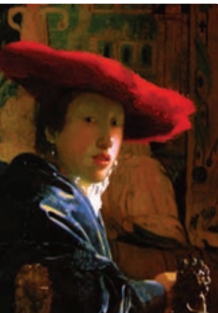
تصویر ۳۶-۴ دختری با کلاه قرمز، اثر یان ورمیر