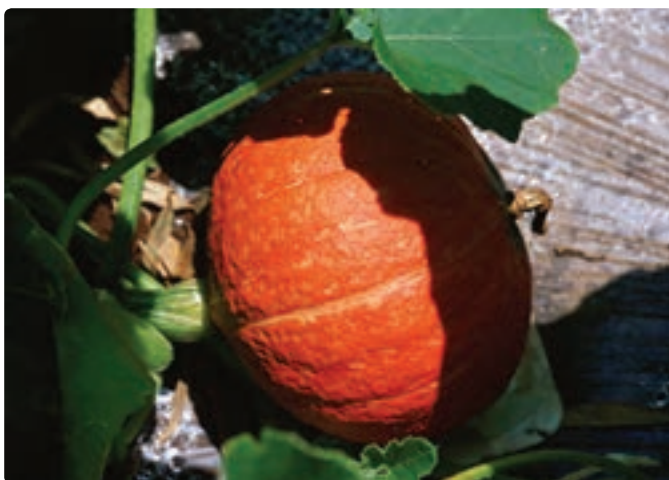
تصویر ۴-۱۱ (ب) تأکید بصری به واسطه رنگ

تضاد رنگ توانایی زیادی در ایجاد تأکید و جلب توجه دارد. چنان که می‌تواند تأثیر عناصر دیگر را هم کنترل کند. تصاویر زیر را با هم مقایسه کنید. هندوانه به لحاظ هماهنگی رنگ در میان برگ‌ها استتار شده است، ولی کدو تنبل به دلیل رنگ متفاوت خودنمایی می‌کند (تصویر الف و ب ۴-۱۱).