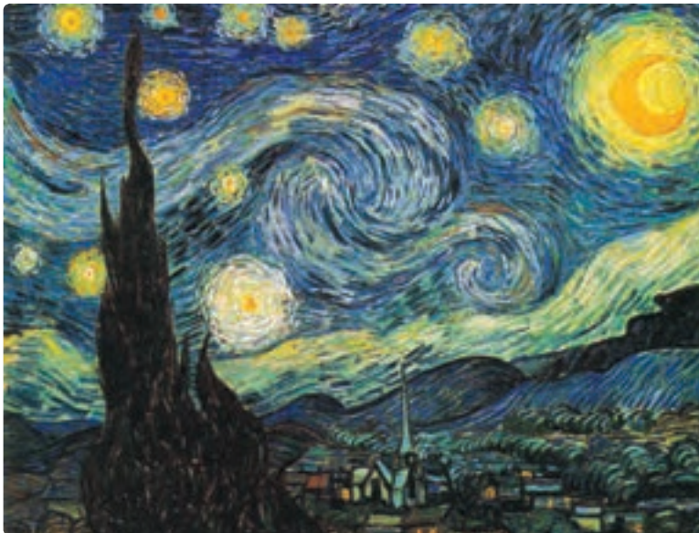
تصویر ۳۴-۴ وینسنت ون گوگ، شب پرستاره، رنگ روغن روی بوم

در شب پرستاره اثر ون گوگ نقاط تأکید متعدد هستند. ستاره‌های درخشان، پیچیدن کهکشانی از انفجار ستارگان، خطوط رنگی درهم تنیده شده و سروی که با رقصی شورانگیز قد برافراشته است. در اینجا هنرمند منظره‌ای کاملاً شخصی می‌آفریند. اما او با وجود نقاط تأکید متعدد، از این اثر یک کل واحد را به وجود آورده است (تصویر ۳۴-۴).