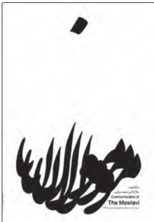
تصویر ۱۷-۴ پوستر بزرگداشت جلال‌الدین محمد مولوی - علی خورشیدپور

غیر از انواع تضاد، به وسیله جداسازی یک عنصر از میان عناصر دیگر، می‌توان به روش‌های دیگری از تأکید دست یافت. زیرا محل استقرار متفاوت و فضای منفی اطراف آن باعث جلب توجه مخاطب می‌شود تا جایی که بدون متمرکز شدن روی موضوع مورد نظر نمی‌توانیم به اثر نگاه کنیم (تصویر ۱۷ و ۱۶-۴).