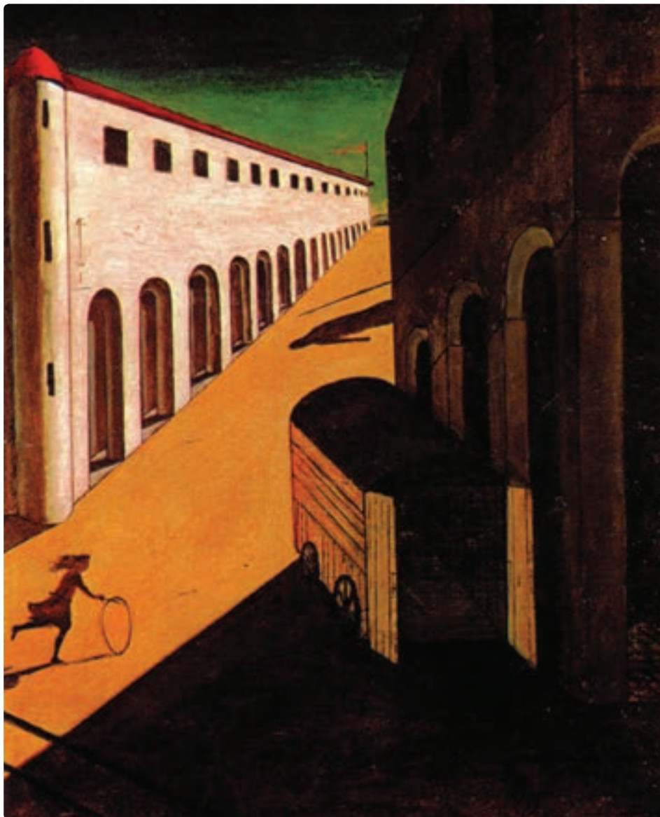
تصویر ۲۹-۴ راز مالیخولیای یک خیابان، جورجیو دکریکو رنگ روغن روی بوم

در نقاشی زیر، پرسپکتیو اغراق آمیز و نورپردازی قوی، چشم بیننده را از دخترک به سایه آدمی پشت دیوار هدایت می کند. هنرمند به این ترتیب توجه مخاطب را به هدف خود از نقاشی هدایت می کند (تصویر ۲۹-۴).