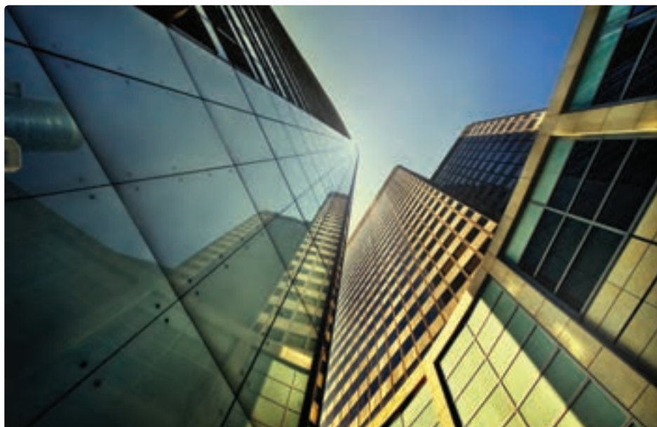
تصویر ۲۶-۴ پرسپکتیو ساختمان‌ها - اسون فینما - نمای نمای ساختمان‌های شهری با پرسپکتیو

در تصویر (۲۸-۴) ساک دستی به گونه ای طراحی شده تا تصویر آن با زاویه دید از بالا موجب جلب توجه شود. در نتیجه، این شیوه از طراحی گسترش تبلیغات را به دنبال خواهد داشت.