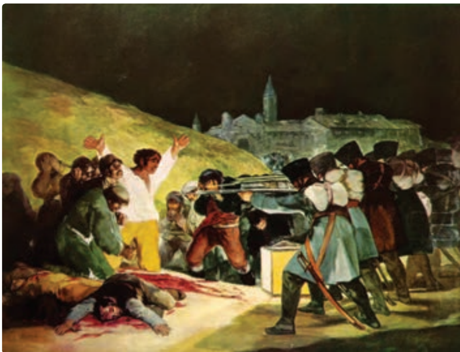
تصویر ۲۵-۴ سوم ماه مه، فرانسیس گویا-رنگ روغن روی بوم

در تصاویر (۲۷ و ۲۶-۴) عکاس ضمن استفاده از زاویه دید خاص برای هدایت چشم به سوی موضوع، کل اثر را هم مورد توجه قرار داده است.