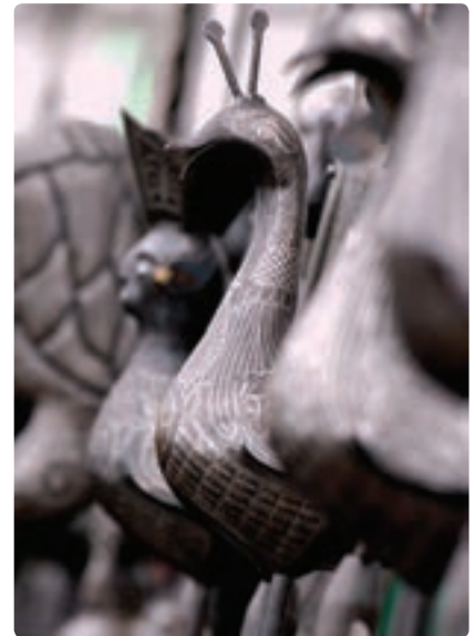
تصویر ۴-۹ تأکید به واسطه عمق میدان وضوح

تضاد بافت نیز تأکید بصری ایجاد می‌کند. در تصویر ۴-۱۰ جنس براق و صیقلی در حجم فلزی باعث شده است تا انعکاسی از محیط اطراف به وجود آید و ابعاد بصری تازه‌ای ایجاد گردد.