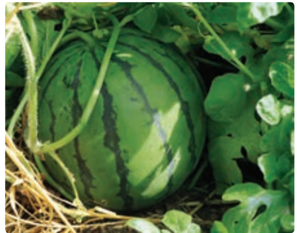
تصویر ۴-۱۱ (الف) هماهنگی رنگ و استتار در طبیعت