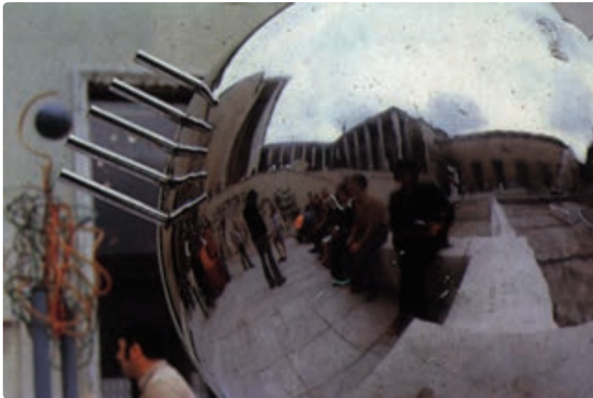
تصویر ۴-۱۰ یک حجم فلزی براق با انعکاس فضای اطراف خود ابعاد تازه و تأکید بصری را ایجاد کرده است.