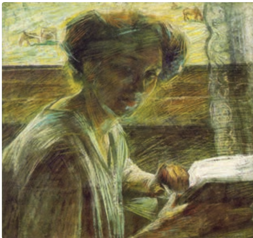
تصویر ۴-۴ زن جوان، امبرتو بوتچینی

گرفته است. در معماری اسلامی، نورگیرها نقش خیره کننده‌ای در جلب توجه افراد دارند. نور نقش مهمی را در ایجاد مفهوم کمال ایفا می‌کند. وقتی وارد معماری می‌شویم نور، چشم ما را به سمت خود هدایت می‌کند و خیلی ظریف اشاره به حضور متعالی خداوند دارد (تصویر ۳-۴). در تصویر زیر هنرمند با نورپردازی خاص و ظریف در طراحی اش جلوه‌ای مطلوب به چهره بخشیده است. جالب اینکه بر خلاف اغلب طراحی‌ها، چهره در تاریکی قرار گرفته است. انعکاس نور به چهره، طراحی زن در پیش زمینه، همراه با پس زمینه‌ای بی‌اهمیت، همگی از هدف هنرمند تبعیت می‌کند (تصویر ۴-۴).