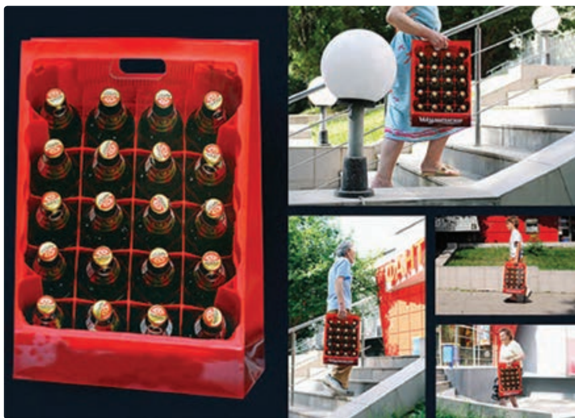
تصویر ۴-۲۸ در تصویر فوق ساک دستی به واسطه طراحی خاص موجب تأکید و جلب توجه شده است.