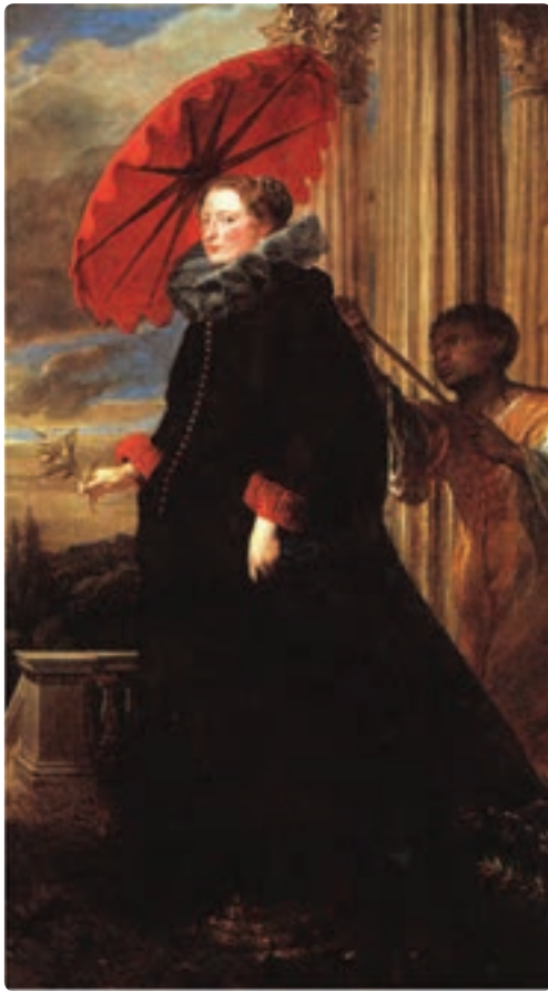
تصویر ۲۰- پرده نقاشی دوره باروک

اشاره به موضوع اصلی توسط یک یا چند عنصر، توجه را مستقیم یا غیر مستقیم به سمت آنها هدایت می کند و تأثیر دلخواه را به سادگی ایجاد می کند. معمولاً عنصر خط بهتر از بقیه عناصر به هدایت چشم کمک می کند. پرتوهای شعاعی، ژرف نمایی (پرسپکتیو)، زاویه دید، جهت حرکت موضوع، اغراق و سمت نگاه و... همه مثال هایی از این نوع هستند (تصویر ۲۳ و ۲۲ و ۲۱-۴).