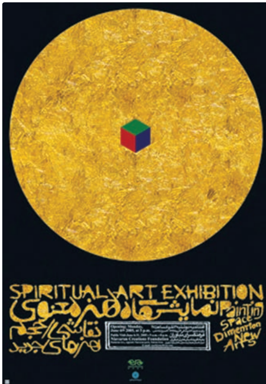
تصویر ۱۹-۴ پوستر نمایشگاه هنر معنوی

گاه محل استقرار موضوع در مرکز یک شکل، نیز از چنین هدفی تبعیت می کند. در تصویر زیر، بزرگی دایره و رنگ آن، استقرار مکعب در مرکز دایره موجب تأکید بر موضوع شده است (تصویر ۱۹-۴).