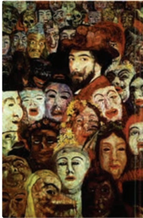
تصویر ۳۲-۴ جیمز انسور - پرتره خودش احاطه شده با ماسکها - رنگ روغن روی بوم