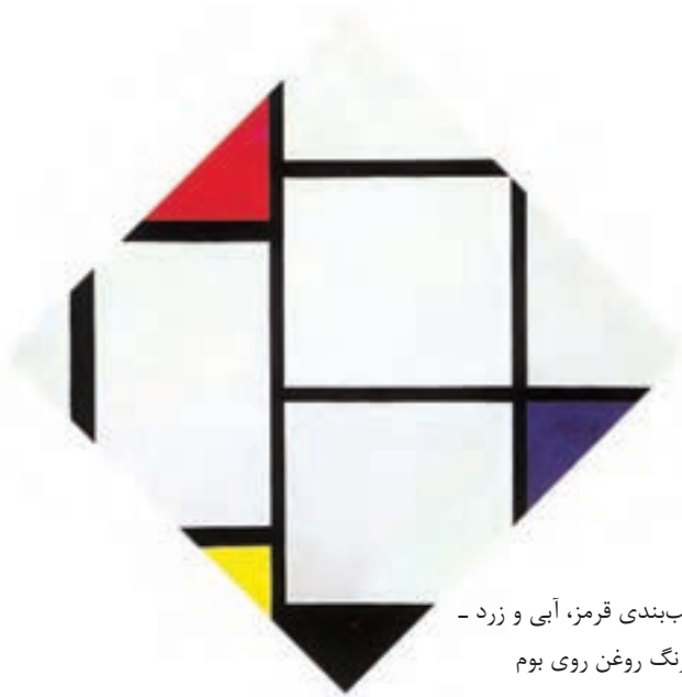
تصویر ۳۵-۴ ترکیب‌بندی قرمز، آبی و زرد - پیت موندریان - رنگ روغن روی بوم

همیشه برای خلق اثر موفق لازم نیست که نقطه تمرکز مشخصی داشته باشیم. به یاد داشته باشیم که نقطه تأکید فقط یک روش است که هنرمند ممکن است از آن استفاده کند. بعضی از هنرمندان عقیده دارند، که باید کل اثر بر اجزا مؤثر باشد. در بسیاری از نقاشی‌های هندسی و آبستره ۱ موندریان، هیچ نقطه مرکزی که چشم را نگه دارد، وجود ندارد. حاشیه‌های آثارش به اندازه مرکز آنها دارای اهمیت هستند، خط‌های افقی و عمودی که استفاده کرده است، اغلب نوعی سکون، آرامش و تعلیق را تداعی می‌کند که از دو نیروی متقابل و متضاد که یکدیگر را در تعادل نگه می‌دارند، ناشی می‌شود. در تصویر ۳۵-۴ شبکه‌ای سیاه در پس زمینه‌ای سفید نقاشی شده است و سطوح یک دست با رنگ‌های اصلی بر آن اضافه شده‌اند. تابلو هیچ نقطه مرکزی ندارد. موندریان اصطلاح "حاشیه‌ای" را بر آن گذاشته بود، به آن معنا که مرکززدایی شده و مانند شهری بدون مرکز است. البته در این گونه آثار، موندریان با استفاده از تضاد رنگ‌های اصلی، نقش بسیار مهمی در تأکید بر کل اثر داشته است. نقطه تأکید می‌تواند متعدد باشد یا حتی وجود نداشته باشد، مهم این است که با تمرکز بیش از حد روی یک موضوع یا چند موضوع و یا حتی با عدم تمرکز موجب کم شدن وحدت و انسجام عناصر نشویم و موضوع اصلی وابسته به کل طرح باقی بماند.