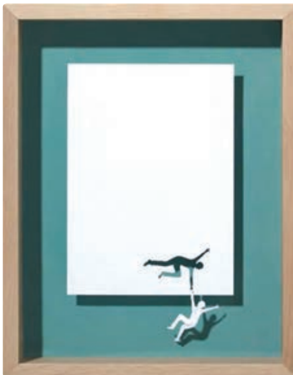
تصویر ۶-۴ کاغذ بری - کنتراست سطوح مثبت و منفی