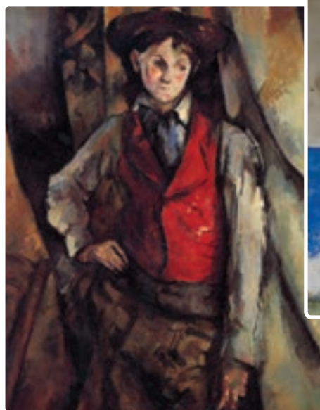
تصویر ۴-۱۵ پل سزان، پسرک با جلیقه قرمز، رنگ روغن روی بوم