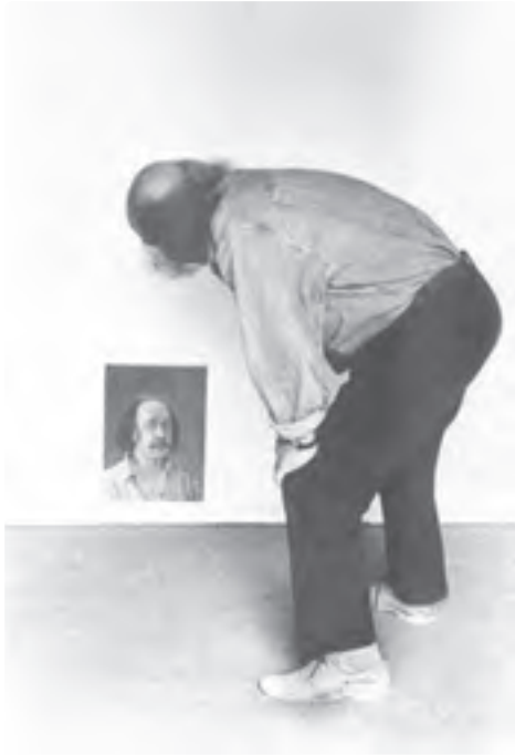
تصویر ۳۳-۴ علی اصغر معصومی