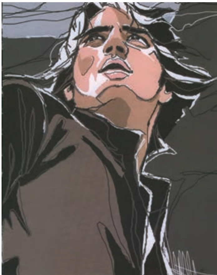
تصویر ۳۱-۴ در این تصویرسازی زاویه دید و جهت نگاه موجب ایجاد تأکید بصری شده است.