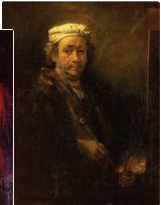
تصویر ۱-۴ رامبراند، ون راین، چهره خودش - قرن هفدهم - رنگ روغن روی بوم