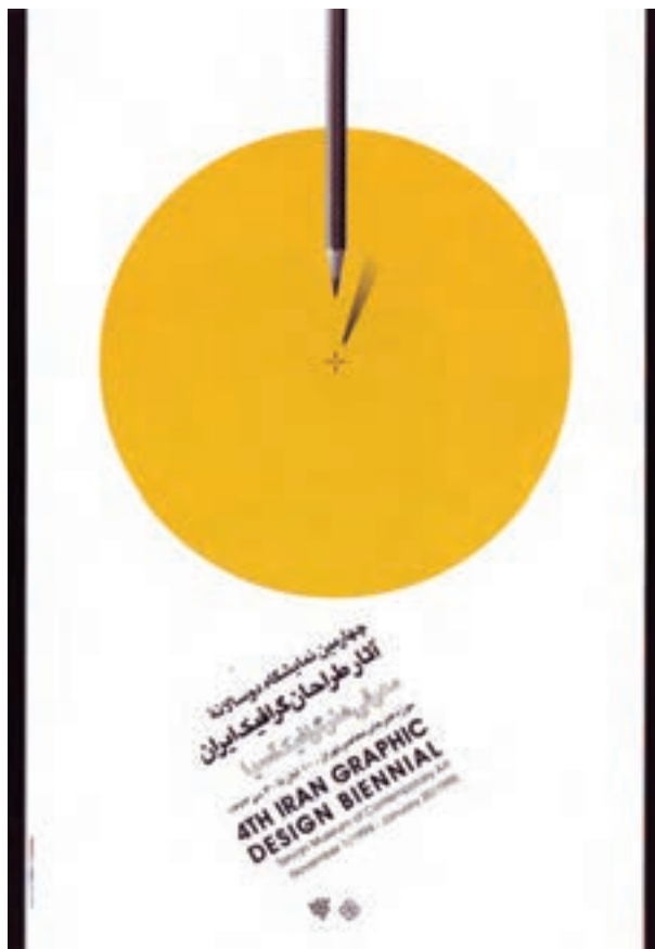
تصویر ۴-۲۲ طراحی پوستر چهارمین نمایشگاه دوسالانه آثار طراحان گرافیک ایران - هنرمند معاصر