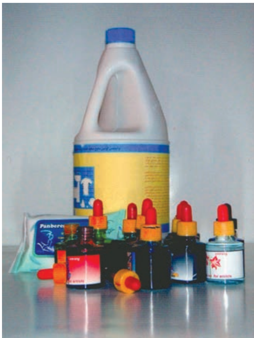
▲ تصویر ۵۴- در تصویر وسایل مورد نیاز شیوه جوهرهای رنگی و پاک‌کننده (سفیدکننده) دیده می‌شود

جوهرهای رنگی، دستمال کاغذی، پاک‌کننده، قلم موی الیاف مصنوعی و یا چوب کبریت (تصویر ۵۴).