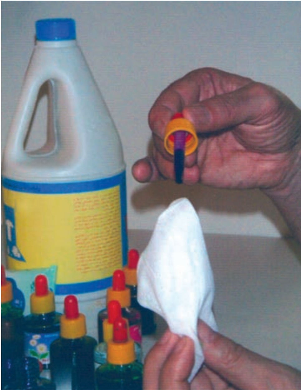
▲ تصویر ۵۵ - تصویر نشان دهنده مرحله اول شیوه جوهرهای رنگی و پاک‌کننده است که با قطره‌چکان بر دستمال کاغذی مرطوب اکولین می‌چکانیم

در این شیوه ابتدا دستمال کاغذی را با آب مرطوب می‌کنیم. سپس با استفاده از قطره‌چکان چند قطره از رنگ دلخواه را همان‌گونه که در تصویر ۵۵ مشاهده می‌کنیم بر روی دستمال کاغذی مرطوب که چند تا خورده می‌چکانیم. و با توجه به خیس بودن سطح دستمال رنگ به راحتی و به صورت اتفاقی بر سطح دستمال پخش می‌شود. و با همین شیوه رنگ‌های دیگر را به آن اضافه می‌کنیم. نتیجه حاصله رنگ‌هایی با شکل‌های غیرمنتظره و زیبا می‌باشد (تصویر ۵۶- الف و ب). بعد از این که رنگ‌گذاری به اتمام رسید، تای دستمال را به دقت باز نموده و صبر می‌کنیم تا کاملاً خشک شود و سپس با پاک‌کننده (سفیدکننده) بر روی آن طرح مورد نظر خود را اجرا می‌کنیم (تصویر ۵۶- الف تا ج). و طرح به صورت خطوط نگاتیو (سفید) بر سطح دستمال کاغذی بوجود می‌آید و پاک‌کننده به خوبی رنگ را پاک می‌کند.