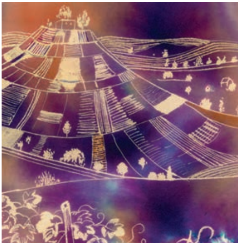
▲ تصویر ۵۷- ب - اثر دانشجو مهناز سیداختیاری