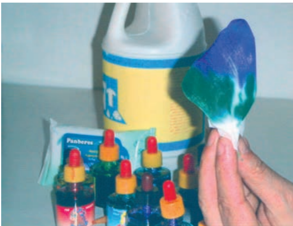
▲ تصویر ۵۶- الف - نشان دهنده مرحله دوم رنگ آمیزی با جوهرهای رنگی و پاک کننده است.