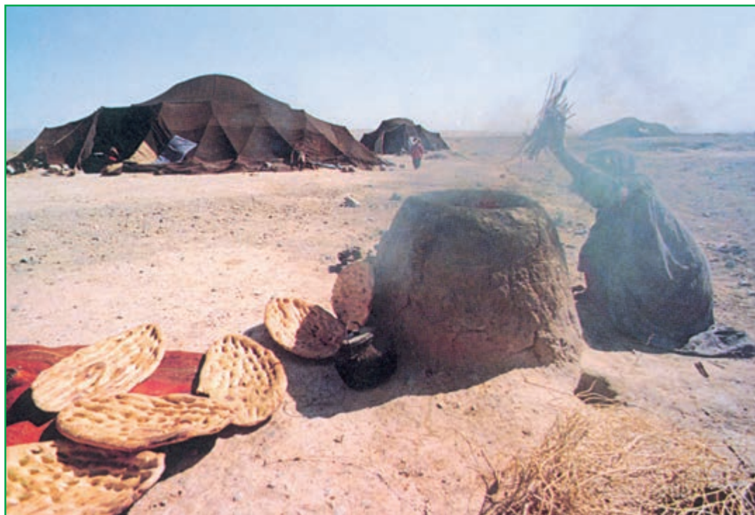
شکل ۸-۴ - استفاده از چوب برای مصارف سوختی در مناطق خشک و بیابانی