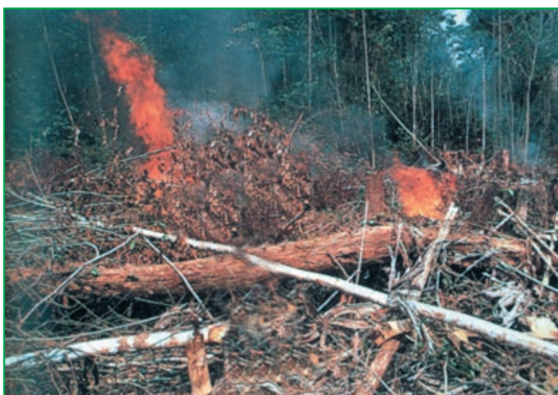
شکل ۵-۴ - تخریب جنگل بر اثر آتش‌سوزی

۲- درباره عوامل مختلفی که ممکن است باعث کاهش مساحت جنگل‌های جهان شوند به صورت گروهی بحث کنید و نتیجه را به کلاس ارائه دهید.