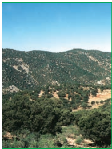
جنگل‌های بلوط - زاگرس