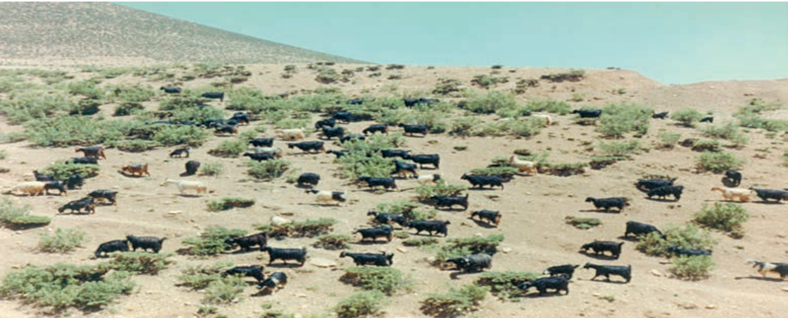
شکل ۱۲-۴- تخریب مراتع بر اثر چرای بی‌رویه دام‌ها

● مهم‌ترین عوامل تخریب جنگل‌ها و مراتع کشور عبارت‌اند از: چرای بیش از حد دام‌ها، کندن بوته‌ها برای مصارف سوخت روستاییان، قطع درختان و از بین بردن مراتع به منظور تبدیل به زمین کشاورزی، خانه‌های مسکونی، کارخانه‌ها و غیره. ● یکی از آثار مهم از بین رفتن مراتع، کاهش میزان