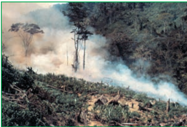
* تهران - واحد مرکزی خبر

براساس یک پژوهش دولت برزیل که اخیراً منتشر شد، روند تخریب جنگل‌های استوایی آمازون با نرخ نگران‌کننده ۲۰ هزار کیلومتر مربع در سال همچنان ادامه دارد.