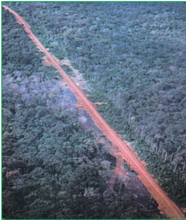
شکل ۴-۴ - احداث بزرگراه سراسری عامل نابودی بسیاری از درختان آمازون