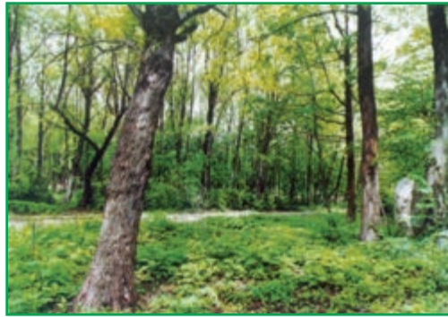
چشم اندازی از جنگل‌های هیرکانی (شمال)