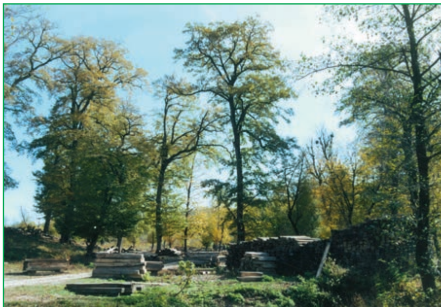
شکل ۱۱-۴ - قطع درختان

بهره‌برداری صحیح و منطقی از جنگل‌ها و مراتع زمانی امکان‌پذیر است که به اندازه میزان تولید و توان آنها مورد استفاده قرار گیرند و رویش مجدد آنها میسر شود. جنگل‌ها و مراتع کشور از با ارزش‌ترین منابع ملی اند. در گذشته حدود ۱۱ تا ۱۸ درصد خاک کشور، پوشیده از جنگل بود که در حال حاضر این رقم به ۷/۴ درصد کاهش یافته است.