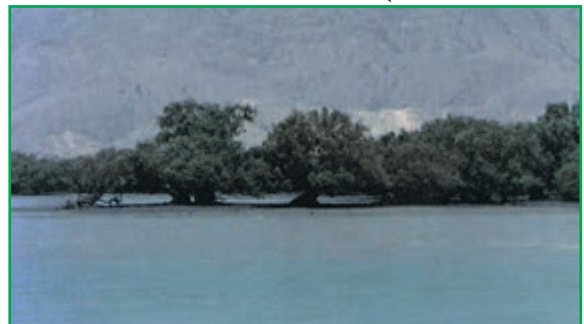
جنگل حرا - سواحل خلیج فارس