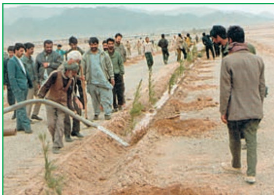
الف) سیستان و بلوچستان