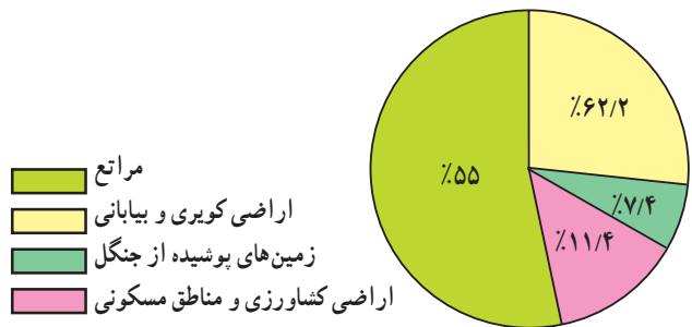
شکل ۶-۴- درصد وسعت انواع اراضی در ایران

این جنگل‌ها در شمال غرب ایران که شامل حوضه آبخیز رودخانه ارس است، (بارش سالانه ۱۰۰۰-۶۰۰ میلی‌متر) رویده‌اند. این جنگل‌ها عمدتاً مخلوطی از درختان بلوط و راش سفید تشکیل شده‌اند و شبیه جنگل‌های کوهستانی نواحی خزری‌اند.