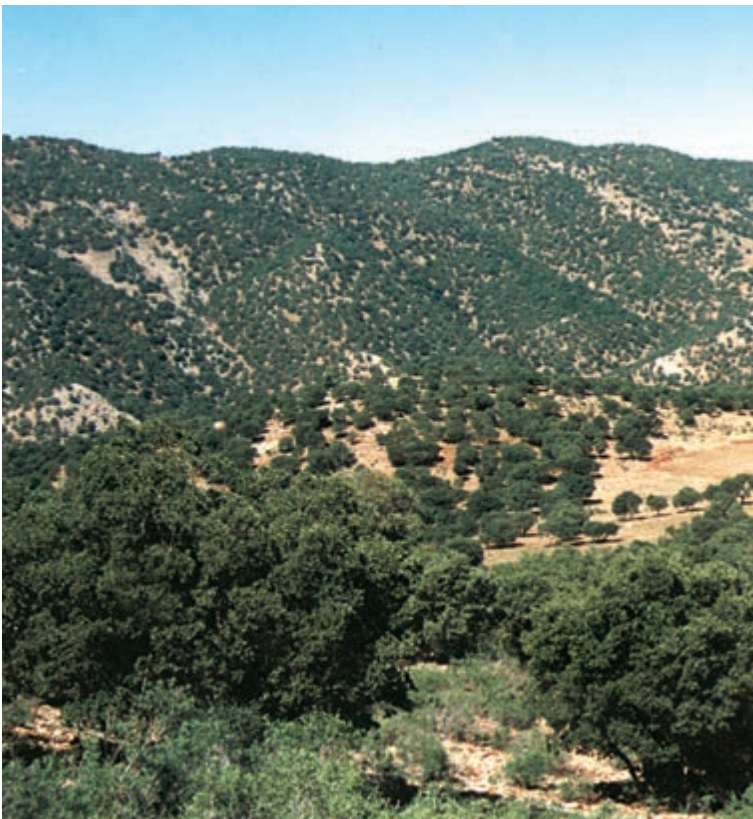
شکل ۷-۴ - جنگل بلوط (ایلام)

جنگل‌های حرا : در سواحل کم عمق خلیج فارس در محدوده بندرعباس، جزیره قشم، ساحل بندر خمیر، جنوب غرب میناب و خلیج گواتر جنگل‌های گرمسیری مانگرو یا حرا قرار دارند. این جنگل‌ها در هنگام مد تا نیمه به زیر آب می‌روند و در هنگام جزر سر از آب بیرون می‌آورند. از آب شور دریا تغذیه می‌کنند و از نظر داروسازی و تغذیه دام‌ها اهمیت دارند. * مرتع : مرتع یا چراگاه زمینی دارای پوشش گیاهی خودرو است و دام می‌تواند مدتی در آن چرا کند.