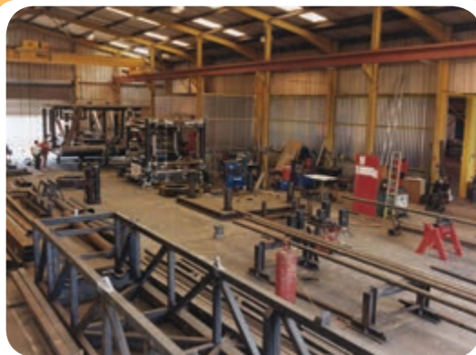
الف) کارگاه ساخت سازه‌های ساختمانی