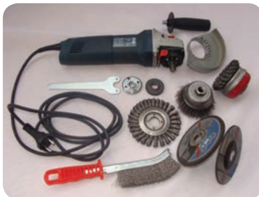
ب) دستگاه‌های آماده سازی و ماشین‌کاری نظیر: تراش، فرز، دریل، سنگ‌زنی، پرس کاری و پخ کاری