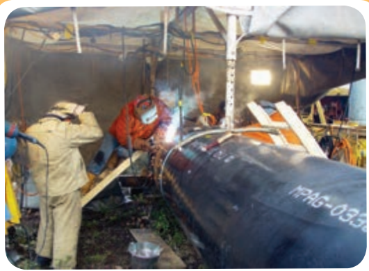
ن) کارگاه ساخت خط لوله