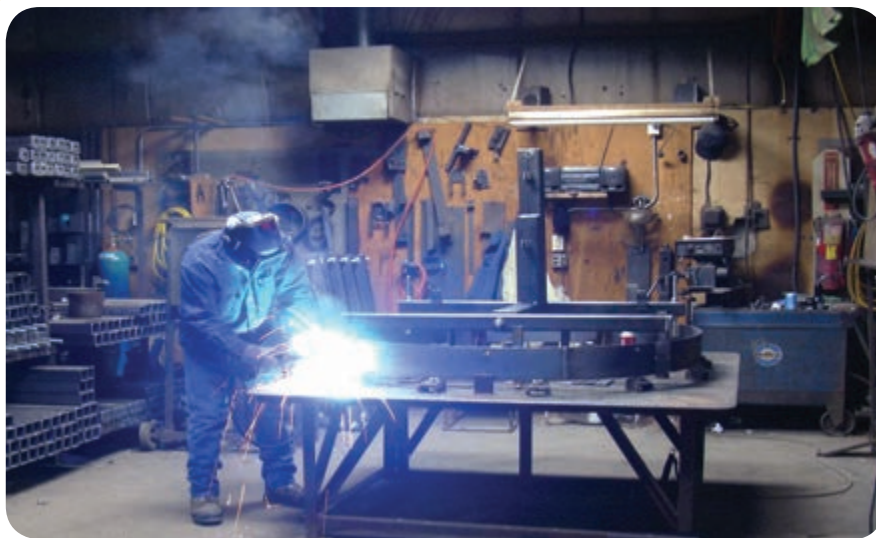
بخشی از فضای داخل کارگاه جوشکاری ساخت

فضای کارگاه جوشکاری به طور معمول سرپوشیده است ولی گاهی به دلیل شرایط اجرایی مثل: مشکل حمل و نقل سازه‌های بزرگ صنعتی بخشی از فعالیت‌های جوشکاری و یا تمام آن در محل نصب سازه‌ها (سایت) صورت می‌پذیرد.