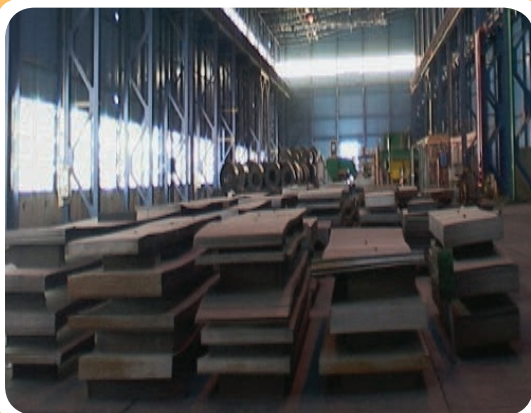
ج) انبار نگه‌داری انواع ورق فولادی