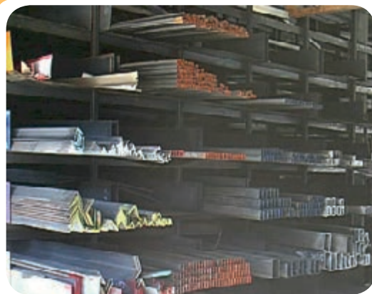
ب) انبار ذخیره انواع پروفیل فولادی