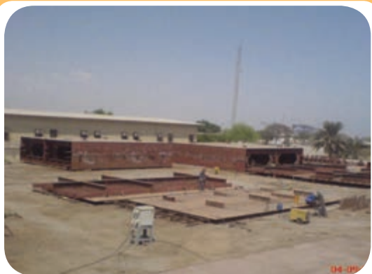
د) کارگاه ساخت اسکلت فلزی ساختمان