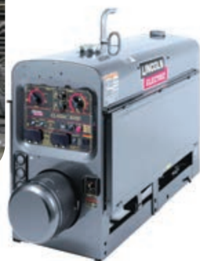
ج) دستگاه‌های جوشکاری نظیر: رکتیفایر، ترانس، دینام و موتور جوش ادامه- برخی از دستگاه‌های موجود در کارگاه‌های جوشکاری