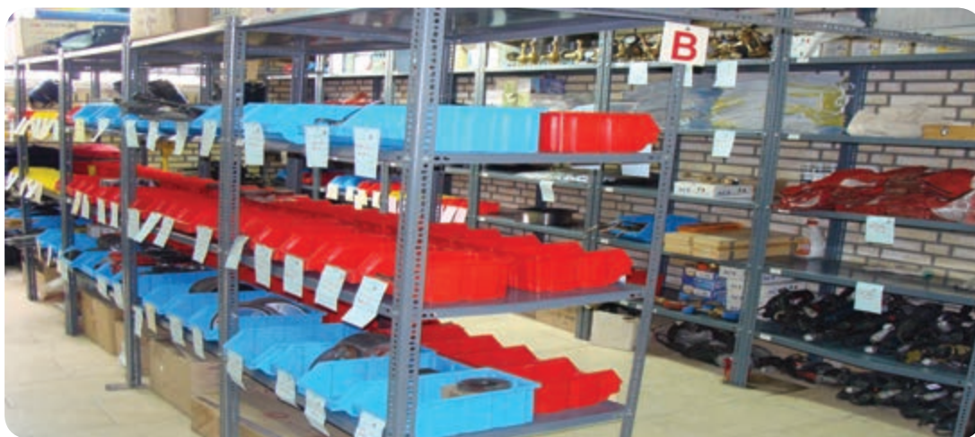
انبار ابزار و لوازم یدکی