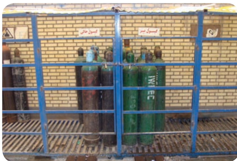
محل نگهداری کپسول‌های گاز محافظ