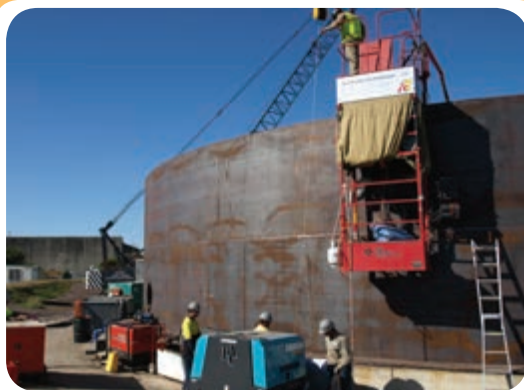
م) کارگاه ساخت مخازن ذخیره

نمونه ای از کارگاه‌های جوشکاری تجهیز شده برای ساخت سازه‌های صنعتی