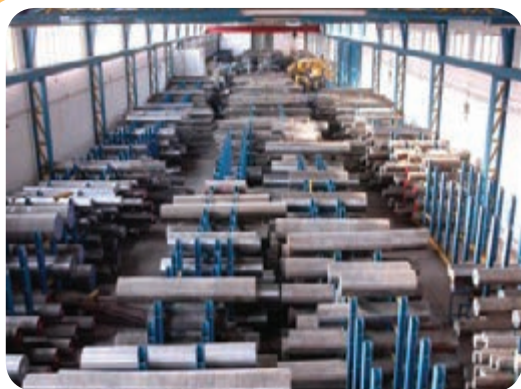
الف) انبار ذخیره لوله و پروفیل های گرد فولادی