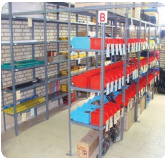
انبار مواد مصرفی جوشکاری