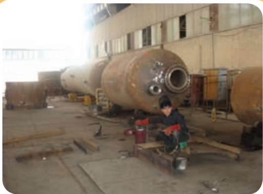
ب) کارگاه ساخت مخازن تحت فشار