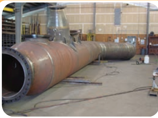
ج) کارگاه ساخت تجهیزات صنعتی