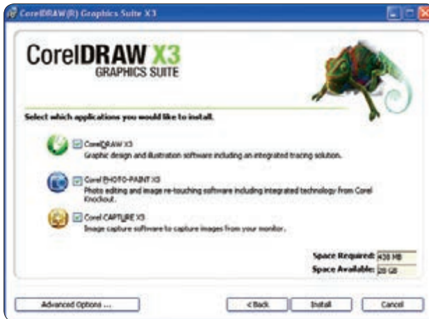
شکل ۱-۳ پنجره راهنمای نصب