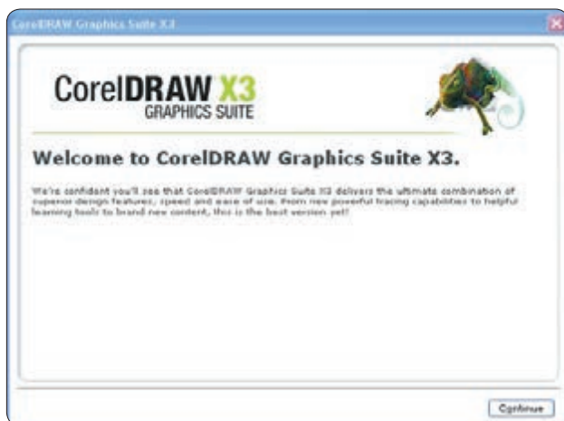
شکل ۱-۱ کادرمحاوره راهنمای نصب

در کادرمحاوره بعدی، شماره سریال (Serial Number) را در بخش 'Already have a Trial serial number?' از محتوای CD پیدا کرده و در کادر متنی مربوطه وارد کنید. سپس روی دکمه Continue کلیک کرده و وارد کادرمحاوره بعدی شوید (شکل ۱-۲).