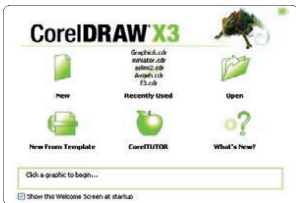
شکل ۱-۴ کادر محاوره خوشامدگویی

از مسیر Start/All Programs/Corel Graphics Suite X3 روی آیکن Corel DRAWX3 کلیک کنید تا نرم‌افزار اجرا شود. با اجرای نرم‌افزار، در ابتدای ورود به برنامه کادر محاوره خوشامدگویی (Welcome screen at startup) ظاهر می‌شود (شکل ۱-۴).