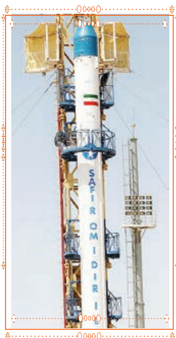
سوره‌ی الرَّحْمَن آیه‌ی ۳۳