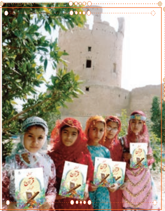
انسان با قرآن کریم در استان هرمزگان

با راهنمایی آموزگار خود پس از آوردن قرآن کریم از دفتر مدرسه، آن را به صورت تصادفی باز کنید و از روی آن بخوانید.