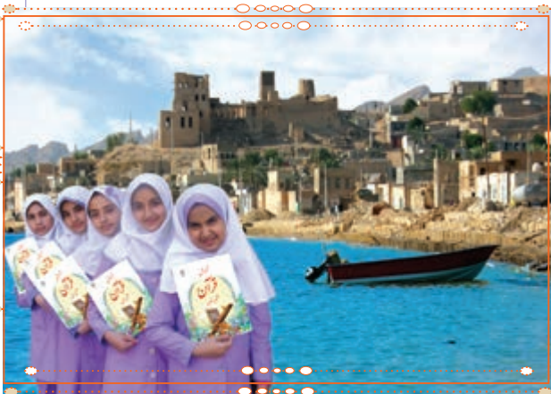
انس با قرآن کریم در استان بوشهر

با راهنمایی آموزگار خود پس از آوردن قرآن کریم از دفتر مدرسه، آن را به صورت تصادفی باز کنید و از روی آن بخوانید.