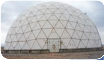
● رصدخانه مراغه